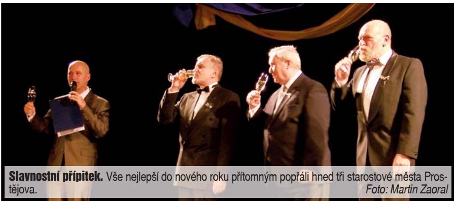
Slavnostní přípitek. Vše nejlepší do nového roku přítomným popřáli hned tři starostové města Prostějova.