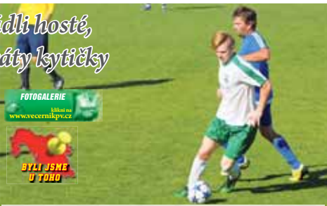
FOTOGALERIE z utkání www.vecernikpv.cz BYLI JSME U TOHO

PROSTĚJOV V devátém kole skupiny „A“ Smoos I. třídy Olomouckého KFS na sebe narazily týmy z opačných konců tabulky. Trápící se Haná Prostějov přivítala na svém domácím stadionu v areálu SCM Za Místním nádražím Sokol v Pivíně, který je od začátku soutěže na koni a získává body s železnou pravidelností. Haná je ale nevyzpytatelný soupeř, a tak bylo jasné, že to hosté nebudou mít lehké. Večerník vše sledoval pěkně zblízka v rámci svého víkendového šlágru.