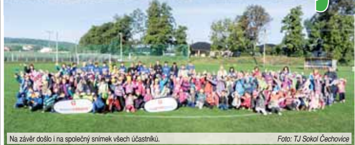
Na závěr došlo i na společný snímek všech účastníků.