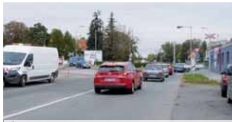
SŽDC bude opravovat železniční přejezd na vlečce vedoucí z kovošrotu na místní nádraží. Část Kostelecké ulice tedy bude pět dní uzavřena.

doucí z kovošrotu na místní nádraží jsme věděli jen několik málo dní předem“, sdělil Večerníku Pavel Smetana (ČSSD), náměstek primátorky pro dopravu. Uzavírka bude platit například i pro městskou hromadnou dopravu, linka číslo 19 bude tedy muset lokalitu objíždět přes Týrsovu či Sportovní ulici. Složitě to budou mít také fanoušci Havířova, kteří budou ve středu ve velkém počtu mířit na prostějovský zímák... (mik)