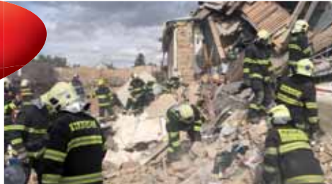
Také v pondělí pokračovali hasiči v prozkoumávání sutin domu, který jeho majitel zřejmě po manipulaci s pyrotechnikou vyhodil do vzduchu.

Zatímco během předminulého víkendu vydávala zprávy o tragédii v Mostkovicích pouze tisková mluvčí krajských hasičů, ale částečně i mluvčí zdravotnické záchranné stanice Olomouckého kraje, policie zveřejnila své prohlášení až v pondělí dopoledne. „Celé sobotní odpoledne a také v neděli třináctého září po celý den kriminalisté místo výbuchu obhlédávali, zajišťovali stopy a prováděli dokumentaci. V době výbuchu se v domě nacházela jedna osoba,