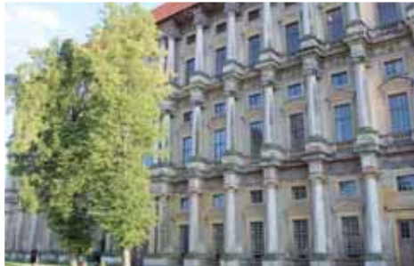
Statut národní kulturní památky by mohl pomoci při hledání desítek milionů korun potřebných na opravu fasády plumlovského zámku.

PLUMLOV Stane se plumlovský zámek druhou národní kulturní památkou v prostějovském regionu? Takhle otázka se na stránkách Večerníku objevila poprvé vloni na jaře, kdy vedení města podalo oficiální žádost na Ministerstvo kultury. Od té doby nebylo dosud definitivně rozhodnuto.