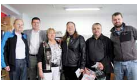
Tři vítězové a tři patroni letní soutěže ve starohanáčtině na společné fotografii po předání cen.