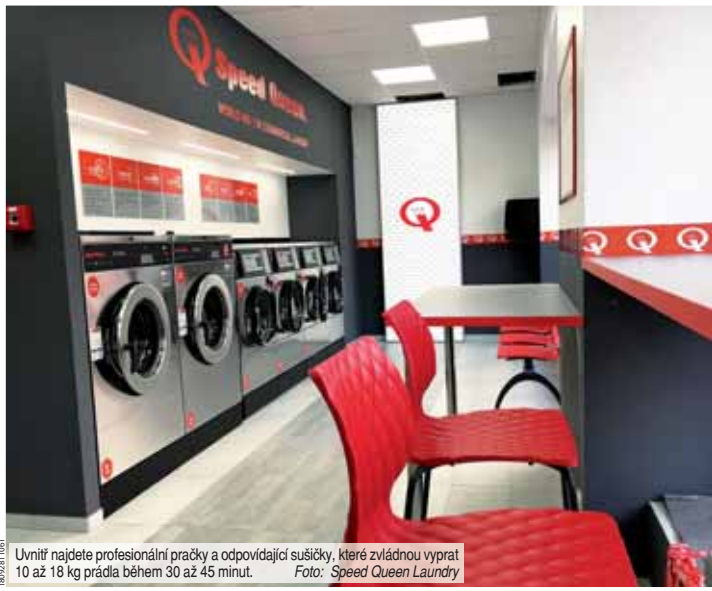
Uvnitř najdete profesionální pračky a odpovídající sušičky, které zvládnou vyprat 10 až 18 kg prádla během 30 až 45 minut.

Laundry jistě sami zjistíte, proč si právě tento typ prádelny v posledních letech po celé ČR našel takovou oblibu. Prostějovská samoobslužná prádelna Speed Queen Laundry je v Plumlovské ulici otevřena každý všední den od 8:00 do 20:00 hodin a o víkendech od 9:00 do