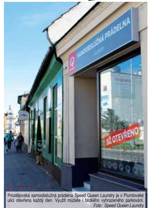
Prostějovská samoobslužná prádelna Speed Queen Laundry je v Plumlovské ulici otevřena každý den. Využít můžete i blízkého vyhrazeného parkování.

Pokud máte prádlo v pračce, provedenou platbu i vybranou teplotu, pak zmáčknete start a podle času, který na displeji ukazuje, si můžete zařídit další úkony, například navštívit blízko kavárnu. Pokud využijete praní v nové samoobslužné prádelně Speed Queen