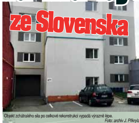
Objekt zchátralého sila po celkové rekonstrukci vypadá výrazně lépe.