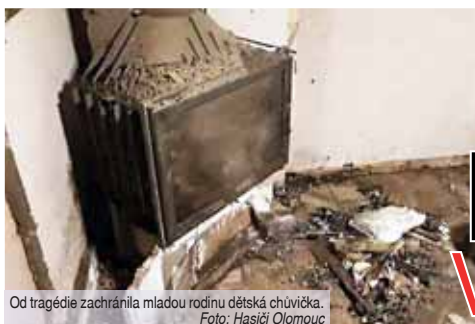
Od tragédie zachránila mladou rodinu dětská chůvička.

Další ušetření finančních prostředků by se mělo projevit i na základě vybudování nového veřejného osvětlení, které má Plumlov v plánu. „Osvětlení už opravdu dosluhuje a nemůžeme tak například pomýšlet na to, že bychom vypnuli jen třeba každou druhou lampu. Nyní musíme vždy určitou část. Brzy se to ale změní, protože čekáme na zpracování dokumentace ze strany poskytovatele, abychom mohli požádat o dotace na kompletní rekonstrukci. Ta by měla zabrat tři roky, kdy v každém roce přijde na řadu jedna etapa. Snad se nových úsporných svítidel v Plumlově i místních částech dočkáme co nejdříve,“ dodala Jančíková.