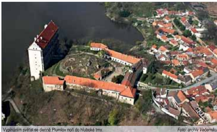
Vypínáním světel se denně Plumlov noří do hluboké tmy.

Město si od tohoto kroku slíbilo snížení nákladů, které jen za