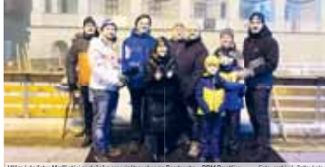
Vítězná družstva Modří spolu s organizátory akce ze Sportovně – ODM Prostějov.

„Byla to hodně ubojuvňavá výhra, ale pro nás to je cennější.“ Vlasti Aleš Tošer měl po zápase se Sokolovem jano. „Byla to hodně ubojuvňavá výhra, ale pro nás to je cennější.“ Vlasti Aleš Tošer měl po zápase se Sokolovem jano. „Byla to hodně ubojuvňavá výhra, ale pro nás to je cennější.“ Vlasti Aleš Tošer měl po zápase se Sokolovem jano.