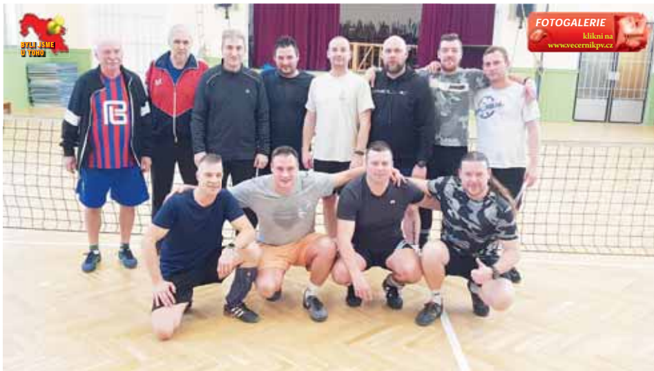
Aktéři Vánočního turnaje trojic TJ Sokol I Prostějov na společném snímku.