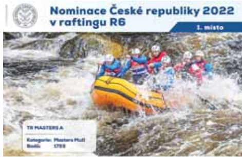
Nominace České republiky 2022 v raftingu R6

První polovina loňského roku byla především ve znamení červnového mistrovství světa R6 (šestimístných člunů) v Bosně a Hercegovině. V barvách hanáckého klubu tam excelovala hlavně ženská posádka TR Omega Tygřici, jež ovládla hned tři ze čtyř jednotlivých disciplín a rovněž celkové pořadí. Absolutní triumf vyšel také veteránům TR Masters, kteří v dílčích závodech dojeli