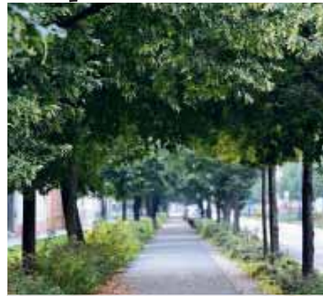
Některé lípy v prostějovské Svatoplukově ulici nepochybně pamatují i Otto Wichterleho, který v této ulici vyrůstal.

Alej roku: Svatoplukova zvítězila v Olomouckém kraji, celorepublikově skončila čtvrtá