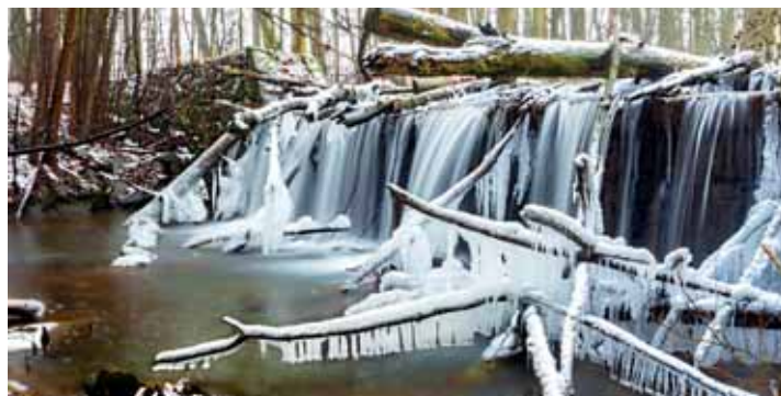
Nádherná fotografie vznikla na říčce protékající kolem Kostelečka na Haně.

KOSTELEČEK NA HANĚ Do konce uplynulého roku probíhalo v rámci fotografické soutěže na facebookových stránkách města Kosteleček na Haně hlasování o „Cenu veřejnosti“. Rozhodli jsme se zveřejnit vítěznou fotografii, která se opravdu povedla. Lidé prostřednictvím tlačítka „To se mi líbí“ mohli po několik předcházejících týdnů podpořit snímek, který je nejvíce oslovil. Vítězem se nakonec stala fotografie zobrazující zamrzající přepad první přehrady pod Zápověděským kopcem na říčce Romži. (mš)