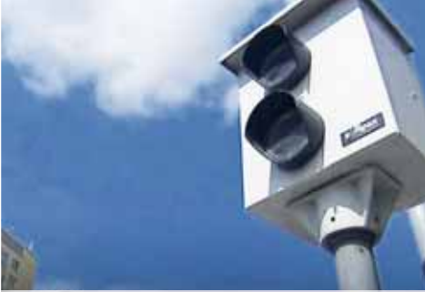
Nákup dalších radarů zatím prostějovský magistrát neohlásil, vedení města ale o tom jedná.

„Na Vápenici zřejmě radar nebude vzhledem k tomu, že by instalace byla technicky velmi náročná, tím i finančně nákladná. Musím říci, že po rekonstrukci komunikace na Vápenici došlo na této ulici k podstatnému zklidnění dopravy,“ prozradil náměstek primátora Statutárního města Prostějov. Stále však platí, že ve všech „budkách“ je vždy pouze jedno měřicí zařízení, ostatní jsou „prázdné“. Figl je v tom, že řidiči netuší, který radar měří a který ne. Nákup dalšího měřicího zařízení město zatím neohlásilo. „Stojí zhruba sedm set tisíc korun, proto se musí