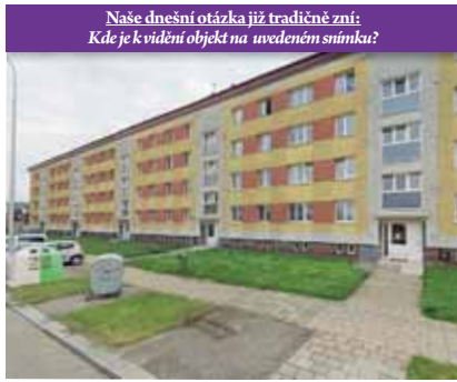
Kde je videný objekt na uvedeném snímku?