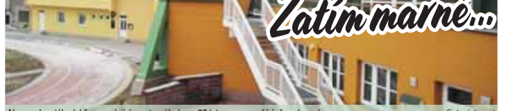
Na zvenku stále dobře vypadající sportovní hale se 25 let provozu pořádně podepsalo.