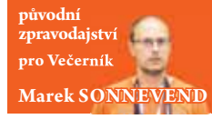
původní zpravodajství pro Večerník

PROSTĚJOV Další úspěšnou sezónu mají za sebou vodáci a vodačky Raft teamu Tomi-Remont Prostějov. Byť uplynulý rok 2022 už pro ně nebyl natolik výsledkově dominantní jako předchozí léta. Přesto se výrazně prosadili na tuzemské i mezinárodní scéně.