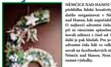
Fotografie z sbírkových skupin se na kolektu, vypravila i v sobotodnem.

NĚMČICKO NAD HANOU Parádni předložka lidké kreativity se podařilo zorganizovat v Němčicko nad Hanou, kde uspořádali soutěž O nehezčí adventní èíska. Místní pří ní v rámci zápisného stvážení prvního ročníku originální soutěže přišli lidé z okolních obcí. Od začátku prázdnin do šestiho dne pak probíhala soutěž o nejlepší kladě. Vyhálené lidé našli stěchu zida 1. a 24. 12. na domov v Němčicko nad Hanou, kteří našli nebo napul čísla popsaná doma, na nich bylo ad- ventní číslo vyzdobeno a poslal je orga- nizátorem. V této úloze soutěže bylo oceněno celkem pět. Mezi nejhezčí ad- ventní èíska lidé ve velkém bla- osvali na facebookových stránkách Němčic nad Hanou. Nyní už jsou známé výsledky.