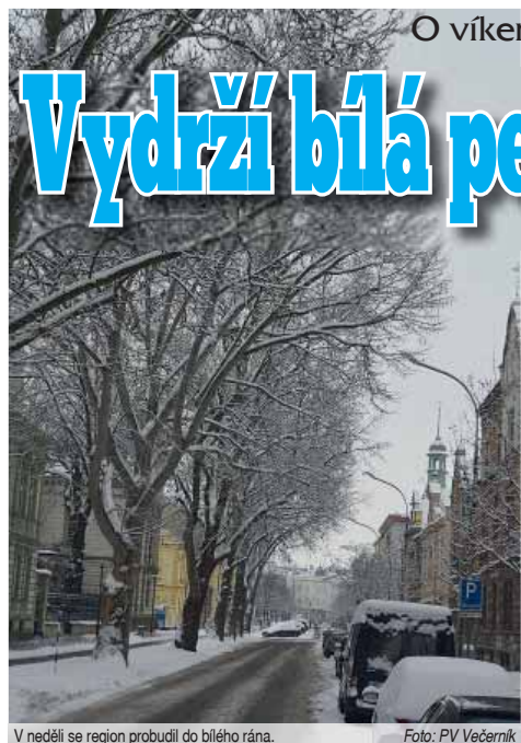
V neděli se region probudil do bílého rána.