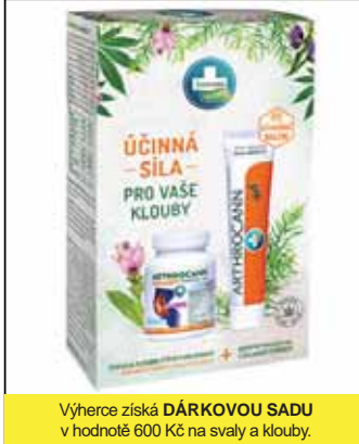
Výherce získá DÁRKOVOU SADU v hodnotě 600 Kč na svaly a klouby.