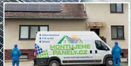
7x foto: archiv Montujeme panely