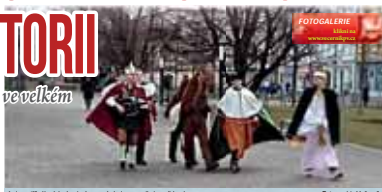
Fotografie z sbírkových skupin se na kolektu, vypravila i v sobotodnem.

Lidé nepropadli strachu a navzdory inflaci darovali ve velkém