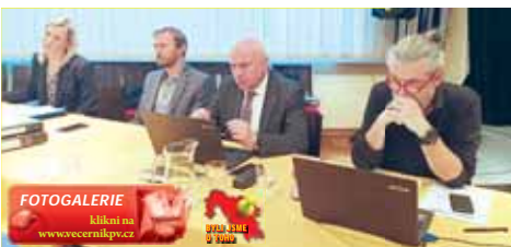
V kulturním sále Duhy projednali lidé 5. změnu územního plánu.

oddělení územního plánování upozorňovali, že se řeší pouze navrhované změny. Ne ty, co by v budoucnu mohly následovat. „Řešíme uspořádaní ploch. A na otázky do budoucna nikdo z nás nedokáže odpovědět. Nemáme žádnou projektovou dokumentaci ani studii,“ reagoval. Kritikům se například nelíbilo, že při postupné práci na 6. změně by se zase využily některých řešených ploch mohlo změnit. „Nevíme, kdo to bude dělat, jaké budou návrhy a podobně. To jsou otázky, na které vám nikdo není dnes schopný odpovědět,“ uklidňoval je Rozehnal. Opozice pak projevila obavy, aby v blízkosti zelených, případně rekreačních ploch nevzniklo něco, co by je znehodnotilo. „Dáváme pravidla území, co se v něm může,