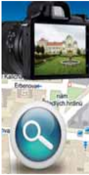
Naše dnešní otázka již tradičně zní: