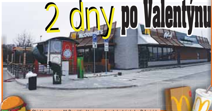
Objekt restaurace McDonald's, který vyrostl v obchodní zóně v Držovicích, už je téměř dokončen.

DRŽOVICE Tak už je to venku! Ve čtvrtek 16. února se zákazníkům poprvé otevrou dveře pobočky světoznámého řetězce McDonald's. Nový objekt roste v nákupní zóně v Držovicích naproti OC Arkáda. O den dříve proběhne slavnostní otevření franšízy pro pozvané hosty.