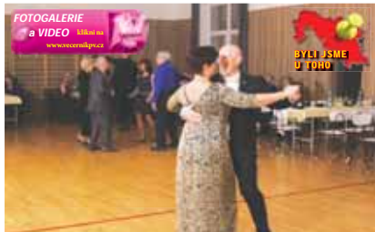
Parket se plnil spíše pozvolna.

Ples začal s úsměvem. Brzy se ujal role moderátora a poprál přítomným, aby se dobře bavili. Ke spokojenosti měl přítomný důvod. „Vypadá to dobře, máme prodaných 151 lístků, tak jsme spokojeni. A někteří lidé ještě chodí. Hodně se to obměnilo, myslím návštěvníky. Tentokrát přišla spousta mladých lidí,“ uvedl pro Večerník. Sál a přisál se plnily pozvolna. Po osmé už ale bylo téměř plno. V průběhu taneční zábavy holdovali účastníci pivu nebo zašli do „pekla“. Vedle baru našli pod pódium také zvěřinové dobroty jako dančí guláš a taky zvěřinové řízky. Nechyběl ani bramborový salát. Program obstarala skupina Trio plus. Ve tříčlenném složení dělala čest svému