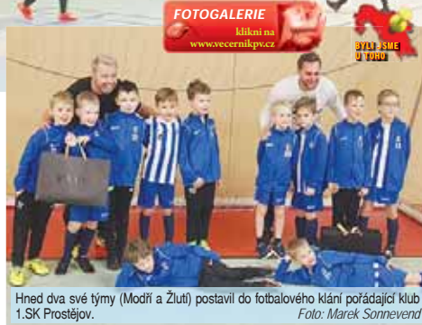
Hned dva své týmy (Modří a Žlutí) postavil do fotbalového kláně pořádající klub 1.SK Prostějov.