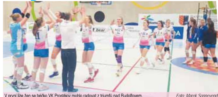
V první lize žen se běčko VK Prostějov mohlo radovat z triumfů nad Rudolfovy.