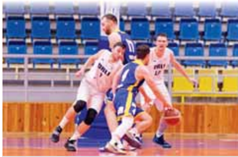
Basketbalisté Prostějova cíl pro letošní ročník nesplnili.