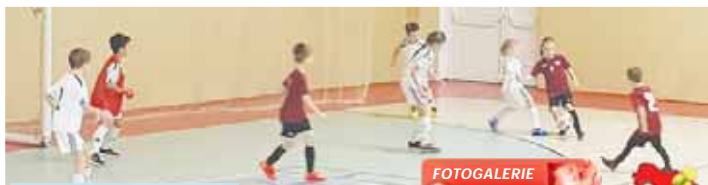
Benjamínci Sparty Brno (v červených dresech) ovládli turnaj mladších přípravků v Némčicích nad Hanou.