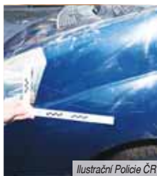
Ilustrační foto: Policie ČR