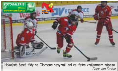
Hokejisté šesté třídy na Olomouc nevyzráli ani ve třetím vzájemném zápase.

Start druhého dějství kopíroval situaci z první části. Domácí hokejisté začali aktivně a měli i dvě velké příležitosti. Obzvláště ve druhé z nich se znovu blýskl brankář Zelinka, který i podruhé vychytl Musila. Po sedmi minutách se zdálo, že zakončení do odkryté branky už nemůže stát nic v cestě, ale na poslední chvíli zachránil čisté konto jeden z obránců. Krátce nato mohl slavit se spoluhráči třetí trefu. Knápek poslal skvělou přihrávkou vzduchem do úniku Slepíčku, ten tvářiv v tvář brankáři