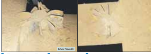
Brdek u Prostějova. Zpráva: Jan Frehar.

BRDEK U PROSTĚJOVA Začátkem uplynulého týdne přijali prostějovští policisté hlášení o nálezu letecké miny. Nejprve havarijní evakuace, nakonec se ukázalo, že předmetem byl nebezpečný. V pondělí státní bezpečnostní úřad oznámil, že se jedná o neaktivní miny. Současné začali připravovat evakuaci okolí domu. „Přotečnické ověření po kontrole předchozího úřadu, že neaktivní ide tor přotečnická za pomoci technicky vlnatá načítací pumpy stabilizátor dělostřelecké miny bez bojevého účinku.“