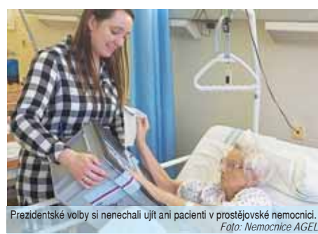
Prezidentské volby si nenechali ujít ani pacienti v prostějovské nemocnici.