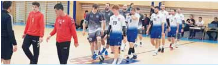
Házenkáři Kosteletci na Hané (v bílém) i Prostějova (v tmavém) jdou na to, začíná jim druhoholivé jaro.

Kosteletci i prostějovští muži do ní vstoupí s jasným cílem vylepšit své postavení po podzimu. První jmenovaní jej zakončili na sedmé příčce tabulky se ziskem jedenácti bodů, druhý zmíněný tým figuruje na deváté pozici s osmi