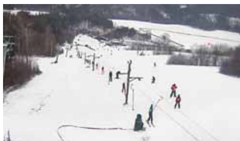
Uplynulou sobotu bylo na sjezdovce v Kladkách konečně pěkně živo.