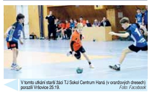
V tomto utkání starší žáci TJ Sokol Centrum Haná (v oranžových dresech) porazili Vřovice 25:19.