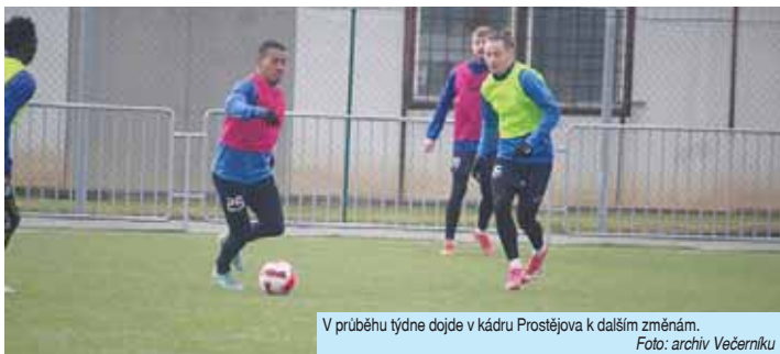
V průběhu týdne dojde v kádru Prostějova k dalším změnám.