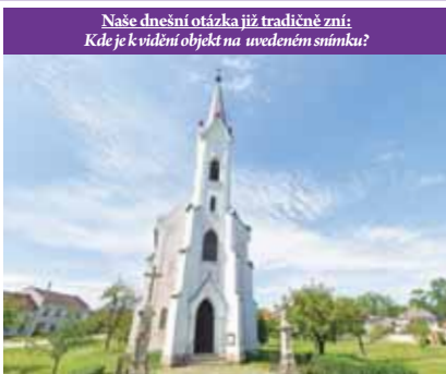
Naše dnešní otázka již tradičně zní: Kde je k vidění objekt na uvedeném snímku?