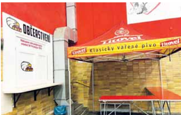
Zatímco provizorní stánek je „v pořádku“, kamenná prodejna zůstává uzavřena.