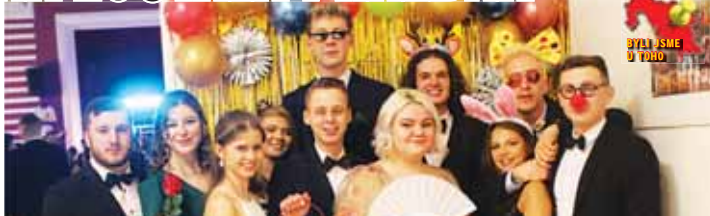
Na ples dorazili i relativně nedávni absolventi místní školy, která je v regionu známá zejména svými sportovními úspěchy a fantastickým divadlem.

PTENÍ Býval to ples fotbalový, nyní je sportovní. Aula školy ve Ptení hostila v sobotu 4. února první ze dvou balů, které se letos v obci konají. Do jeho organizace se kromě místních fotbalistů zapojili také sokolové, kteří pro děti v obci organizují zejména početný oddíl orientačního běhu. Ten letos oslavil půlstoletí své existence.