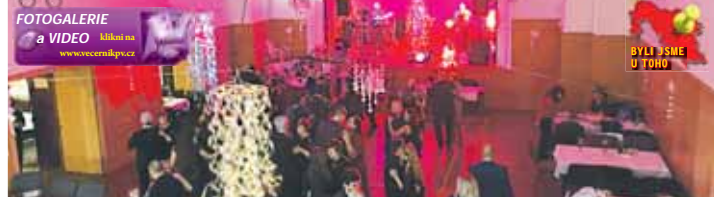
V Otaslavicích se tancilo v průběhu celého večera i noci.