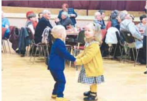
Při masopustním veselí se bavily i děti.

rými ohlasy. „Tento druh akce není v našich končinách tolik obvyklý a je schopen přitáhnout návštěvníky ze širšího okolí. A jak je vidět, cimbálová muzika zaujala účastníky všech věkových kategorií. Děkujeme a těšíme se na další ročníky,“ vzkazuje Novotná. Cimbál se začíná těšit na Haně zájmu a stává se součástí nejedné kulturní akce. Loni tak měli cimbál v Dubanech, začátkem letošního roku zase byl součástí programu na Tradičním městském plese v Prostějově. (red)