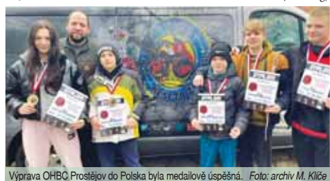
Výprava OHBC Prostějov do Polska byla medailově úspěšná.