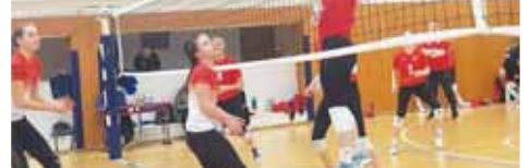
Volejbalistky TJ OP Prostějov (vlevo) nestačily ve 2. lize žen ani doma na očku Ostravy.