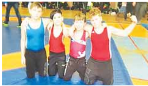
Čechovičtí zápasníci zdatně bojovali na mezinárodním turnaji v Jablunkově.