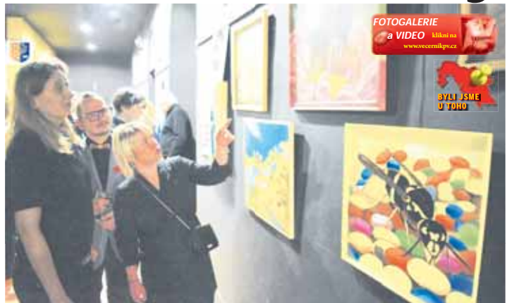
Divadlo Point zažilo první vernisáž v historii.

Zatímco na části pláten zpodobnila hmyz, zejména vosy, na dalších se vyjímaly české památky zasazené do přírody. „Hlavně fotím. Všechny malby jsou pak podle skutečných objektů,“ konstatovala autorka. Na vernisáž zůstala řada diváků z předcházejícího divadelního představení Love you truly. A tak měla autorka početné publikum. „Bylo to pro mě těžké, měla jsem trému. Nejsem zvyklá vystupovat před tolika lidmi,“ sdělila Večerníku aktuálně krátce po vernisáži. Emocionální zážitek to pro ni byl i z toho důvodu, že malířka je ab-