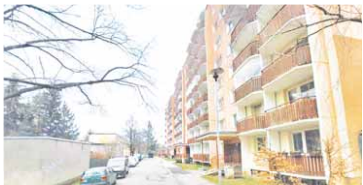
K incidentu došlo v tomto rozlehlém panelovém domě v Družstevní ulici.