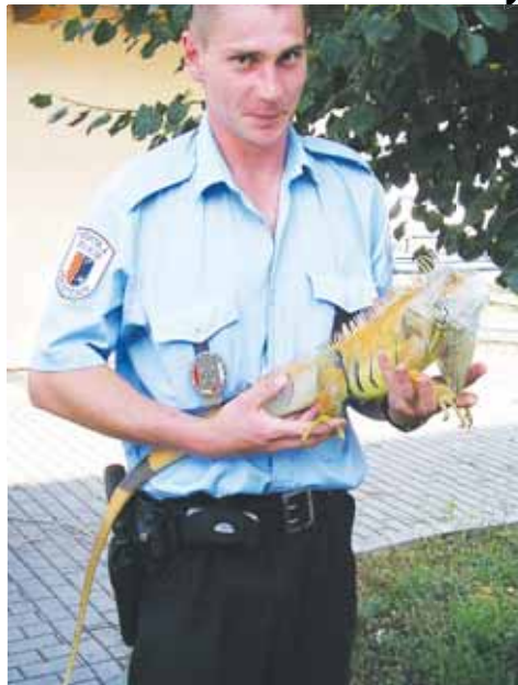
Požadavek na městského strážníka? I láska ke zvířatům...

původní zpravodajství pro Večerník Michal SOBECKÝ