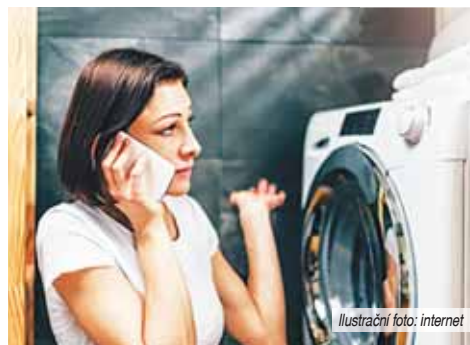
Ilustrační foto: internet