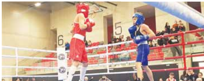
Řada ze 44 utkání Národní ligy boxu v NSC Prostějov měla vysokou úroveň.

dalo pořadně zabrat a trvalo celou hodinu. Vlastní boje tak odstartovaly až v poledne, načež extrémně