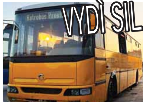
Autobus společnosti Retrobus do hor nakonec nezamířil, jeho pneumatiky byly na první pohled poměrně sjeřáb.

Sám autodopravce věc tak dramaticky neviděl, dle něj se vše zcela zbytečně vyhocilo. „Na tuto akci jsem