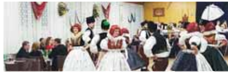
Hanácký bal v Kralicích je hlavně o krojích a tanci.