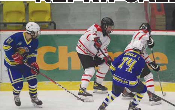
FOTOGALERIE klikni na www.vecernikpv.cz