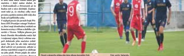
Základní sestava vítězného týmu Prostějov OFS z posledního kola soutěže.