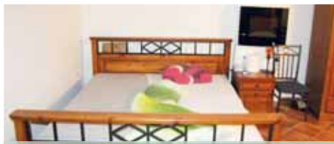
Vybavení kuplířových bytů. V každém z nich byl trezorek, kam prostitutky dávaly peníze za denní pronájem hrůzoborné lásky.

„Příčinlivého kuplíře zadrželi v minulých dnech kriminalisté z Českých Budějovic při naplánované razii naivní republikou“, sdělil policejní mluvčí z jihu Čech Jiří Matzner a dodal: „Muže ve věku padesáti let z Mostu obvinili z mravnostního trestného činu kuplířství. Od roku 2021 do února letošního roku získal bezmála 200 tisíc korun