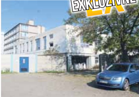
O novém bydlení v areálu Galy si zájemci stále mohou nechat pouze zdát. Místo „Residence Krasice“ zde stojí pouze nevzhledné torzo.