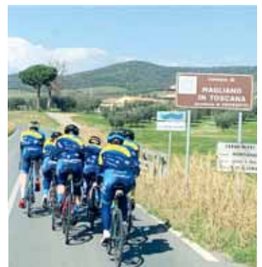
Cyklisté TUFO PARDUS Prostějov se v rámci přípravy tradičně prohánějí italskými silnicemi.