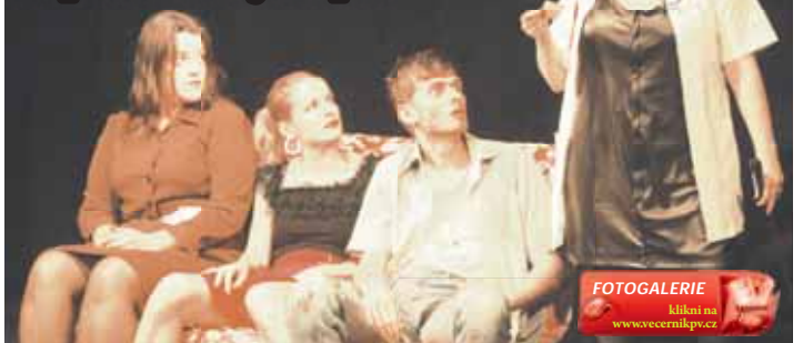
Premiéra Encyklopedie akčního filmu představila celou řadu herců Divadla Point.