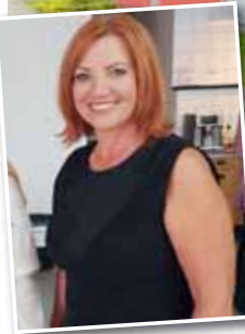
Kanceláře jednoho z největších českých výrobců oříšků společnosti Alika.