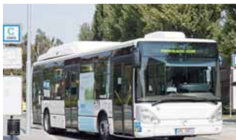
Nová zastávka MHD pro Prostějov? Plán zatím odložen.

linky městské hromadné dopravy nevedou. Nejbližší zastávkou je přes tři sta metrů vzdálené stanoviště ve Sportovní. Budova a přílehlý areál dětí při účasti na kroužcích. „Jsou zde podmínky pro vybudování nové zastávky. Treba projekt. A taky točna a místo na ni“, připomněl náměstek prostějovského primátora Jiří Po-