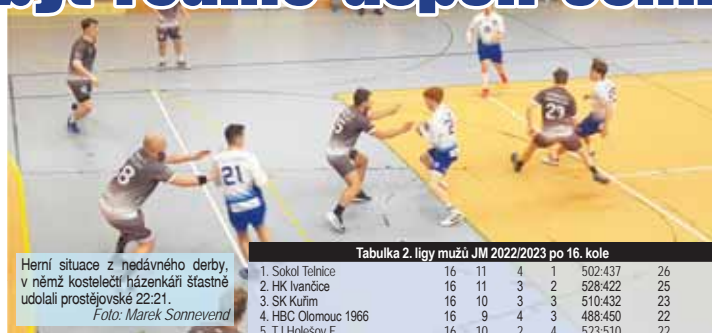
Herní situace z nedávného derby, v němž kostelečtí házenkáři šťastně udolali prostějovské 22:21.