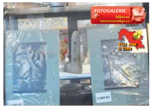
V Avatarce se kromě fotografií můžete podívat i na tento netradiční exponát.

Bezoporu nejmeně tradičním exponátům výstavy, také však neozporuplnějším artiklem, je podepsaná umělohmotná kopie penisu autora v životní velikosti, kterou návštěvníci spatří hned při příchodu do kavárny. Nachází se