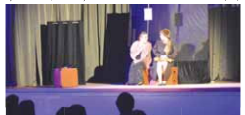
Dvě ženy na útěku, to byl pivínský divadelní večer.

Pivín by se dal označit za divadelní obec. Letos se totiž nejednalo o první představení ve zdejším obecním domě. A další by mělo zhruba za měsíc následovat. Navíc se v Pivíně nachází hned dva divadelní spolky: Větrák a PiDi. (sob)