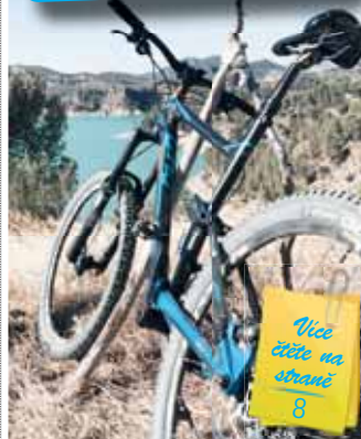
Zloději si vybírají jen drahá kola, kterých měli odložit více než deset.