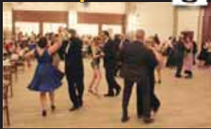
Na parketu bylo často docela těsně.