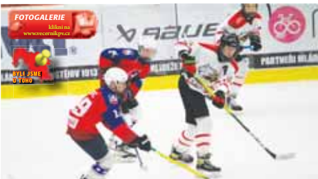
Domáci zlomili dvě branky v závěru druhé části.

Úvod duelu se lépe vydařil hostům, kteří nastoupili velmi aktivně a agresivně a domácím hráčům dělali potíže. Už v 5. minutě se jim to podařilo také přetavit v první vstřelenou branku, kdy byl na konci kombinace Hobza – 0:1. Za necelé dvě minuty později přidali hosté i druhou branku, o kterou se postaral Klapetek – 0:2. Poté už se do zápasu dostávali i domácí a měli i zajímavé příležitosti na korigování, jenže proti brankáři střelci ve dvou tůvkách během necelé minuty vyhořeli. Šance se pak střídaly na obou stranách. Eskáčko se puk nad beton brankáře dostat nepodařilo, hostům zase scházelo pár centimetrů, kdy bekend do prázdné branky jen zavonil o břevno. Závěrečné minuty opět patřily hostům, kteří dokázali eskáčko zamykat v pásmu, a Prostějov