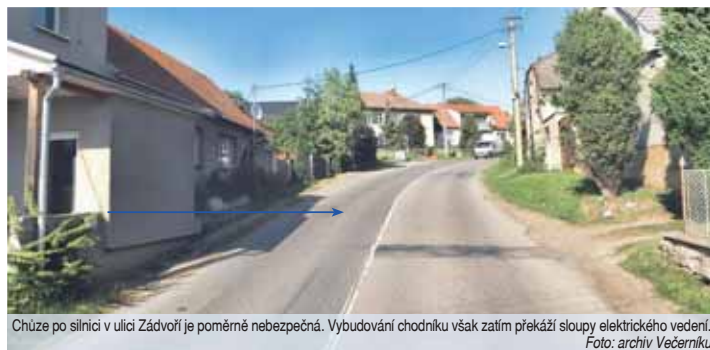
Chůze po silnici v ulici Zádvoří je poměrně nebezpečná. Vybudování chodníku však zatím překáží sloupky elektrického vedení.

Rekonstrukci bude pochopitelně provázet uzavírka. Od dubna do června půjde o částečnou, kdy provoz budou řídit semaforey. „V červenci a srpnu se bude pokládat v celém úseku nový povrch a chodníky a uzavírka bude úplná,“ uzavřel Michal Obrusník.