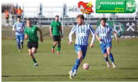
Prostějov měl míč častěji na kopačkách, využívat šance se ale domácím hráčům nedařilo.