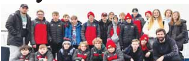
Hokejoví mládežníci si na závěr sezóny užili výlet po Evropě.

PROSTĚJOV První kategorií, která ukončila svou letošní sezónu, jsou starší žáci. Těm se během ročníku poměrně dařilo a hráči nelenili ani po jejím konci. V rámci utužení kolektivů se právě uplynulý víkend vydali na sever. Konkrétně mladi hokejisté navštívili Dánsko, ale i Švédsko a za doprovodu trenérů toho stihli opravdu hodně. Nechyběla návštěva řady významných památek a žáci si tak užili krásy Kodaně. Následně se lodním spojením přesunuli ještě více na sever a další zastávkou bylo Švédsko, kde na ně čekal neméně zajímavý program.