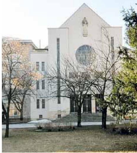
Někdejší židovská synagoga byla přestavěna a nyní slouží jako Husův sbor.