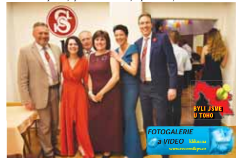
Na sokolském plesu bylo patrné, že tělesná i duševní svěžest lidem přirozeně přináší také dobrou náladu a pozitivní pohled na svět.

trasy dlouhé 21,1 a 10 km, děti si budou moci svoji zdatnost změřit na kratších distancích. O uplynulém víkendu bylo přihlášeno již 131 běžců.