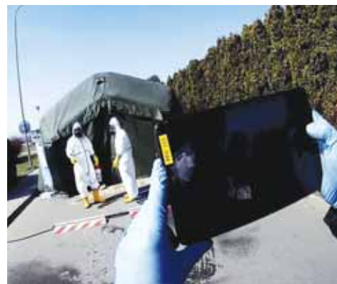
Otevření testovacího centra před prostějovskou nemocnicí provázela nejprůběžnější hygienická opatření.