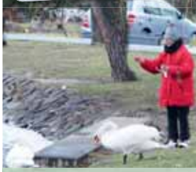
Takto labutí pár v polovině letošního března přikrmovala pečivem jedna z Prostějovčanek. Činila tak jen pár metrů od výrazné tabule.