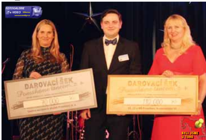
Organizátoři mohli být spokojení, tolik se na dobrou věc ještě nevybralo.