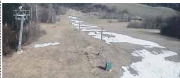
O uplynulém víkendu panovalo v Kladkách již veskrze jarní počasí.

zinárodní den žen však na umělý sníh setrval přišlo a předpověď na následující dny rovněž nebyla vůbec příznivá. Proto se místní rozhodli sezónu definitivně ukončit. „Byli jste opět skvělí! Moc děkujeme za lyžařské zážitky na vašem svahu a přání sezónu ahoj,“ vzkázala Helena G. provozovatelům z řad Tř Sokol Kladky. (ms)