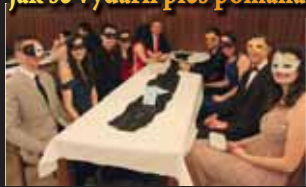
Výzva k nošení škrabošek na plesu se setkala s velkým nadšením.