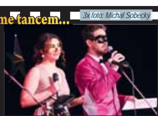
Dvojice moderátorů se oproti dřívějším ročům nezměnila.