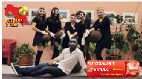
Originálními maskami se to v Nezamyslicích jen hemžilo. Nechybělo ani hejno much.

NEZAMYSLICE O tom, že se v Nezamyslicích umí bavit všechny generace, se už dlouhá léta ví. Tento víkend toho byl jasným důkazem. Zatímco v pátek si svůj maskarní večer užili dospěláci, kteří se bavili až do pozdních nočních hodin, v sobotu krátce po obědě už na sále řádily děti. Obě akce se už tradičně těšily velkému zájmu, návštěvy rozhodně nikdo nelitoval.