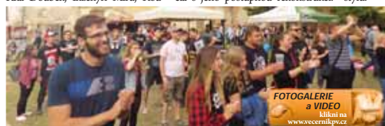
FOTOGALERIE a VIDEO klikni na www.vecernikpv.cz

Festivaly, které pořádá, mu pomáhají s financováním oprav. Plány do budoucna má velké, většinu místností hodlá postupně zpřístupnit veřejnosti, počítá se středověkou křemou, sálem, ubytovacími pokoji. Jak uvedl již dříve, hodlá zámek proměnit ve středověkém stylu.