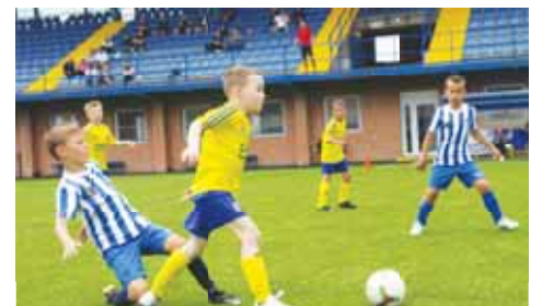
Momentka z utkání Zlín Cupu 2023 mezi domácími FC Zlín a 1.SK Prostějov.

Nicméně mladší příprava 1.SK obsadila v konečném pořadí pěknou pátou pozici a rozhodně nezklamala. „Kluci potvrdili velký fotbalový posun, který za poslední rok udelali díky naší společné práci. Řekl bych, že jen dva soupeři tady ve Zlíně našly vyložení převyšovali, se všemi ostatními jsme dokázali