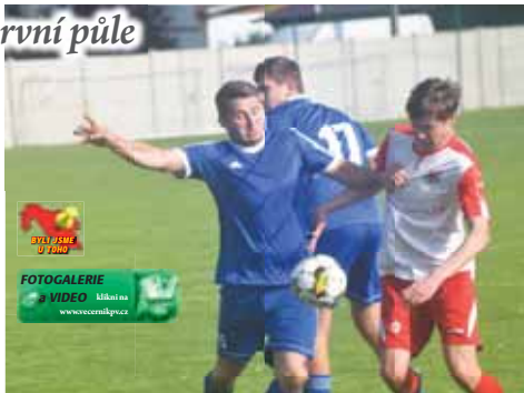
Kostelec v domácím prostředí dokázal srazit i Lipovou a nadále drží skvělou domácí bilanci.

EXKLUZIVNÍ reportáž pro Večerník Jan FREHAR