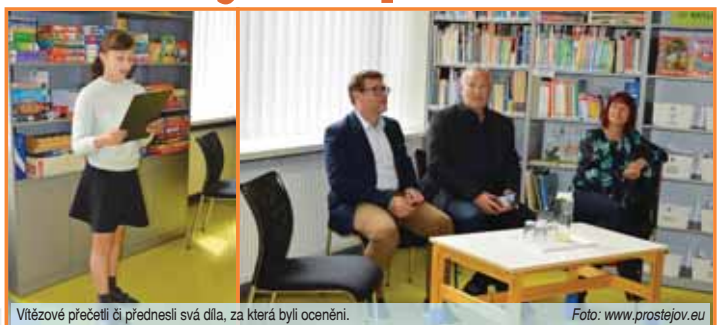
Vítězové přečetli či přednesli svá díla, za která byli oceněni.