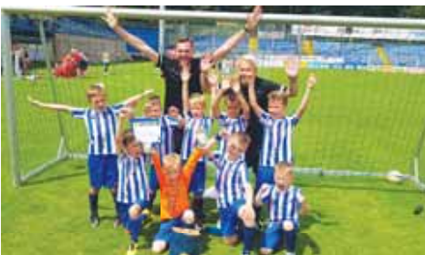
V konečném pořadí mezinárodního turnaje obsadili malí Hanáci maximálně páté místo.

když porazili slovenský Púchov 6:3, Kroměříž 6:4 i SK Zlín 5:0, mezi tím podlehli po převážně vyrovnaném boji kvalitním Pardubicím 4:7. Následovala půlhodinová pauza, po níž osmiletým reprezentantům eskáčka už viditelně docházely síly. Navíc čelili papírově silnějším kolektivům a spouflováním akce,