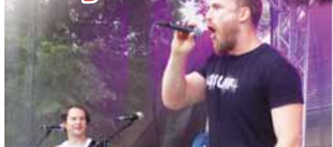
Zámek ve Ptení ovládli punkeři.