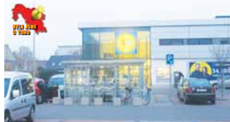
Lidl na Újezdě se s nejrůznějšími zloději potýká pravidelně.

Těm se Patrik Horváth celkem bez problémů přiznal a spolehal, že vzhledem k jeho nesvéprávnosti z jeho krádeží nikdo žádnou vědu dělat nebude. Ale to se poněkud přepočítal. S jeho nemocí na hlavu je to totiž poněkud vachrlaté... „Znalci zjistili, že obžalovaný simuloval těžkou mentální retardaci,