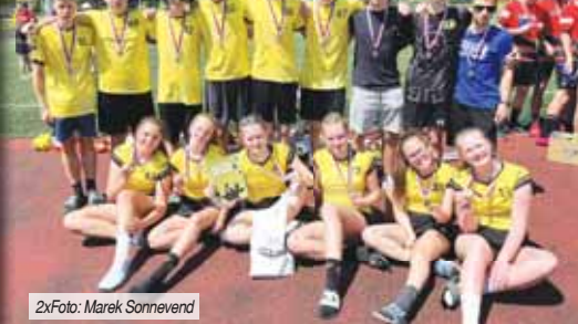
2xFoto: Marek Sonnevend