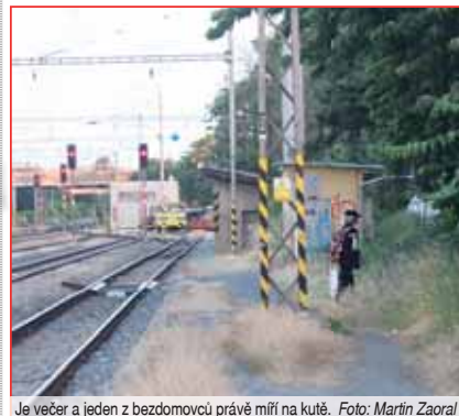
Je večer a jeden z bezdomovců právě míří na kutě.