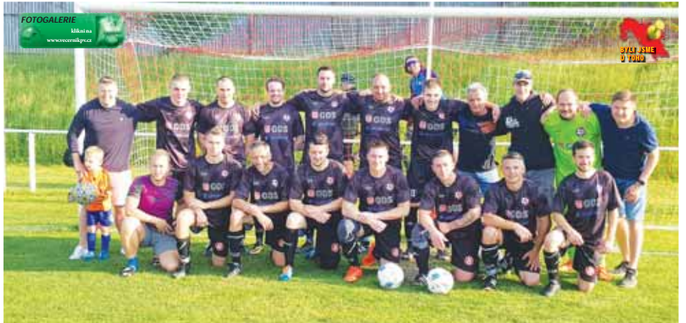
Fotbalisté TJ Sokol Vícov, vítězové okresního přeboru mužů OFS Prostějov 2022/23.