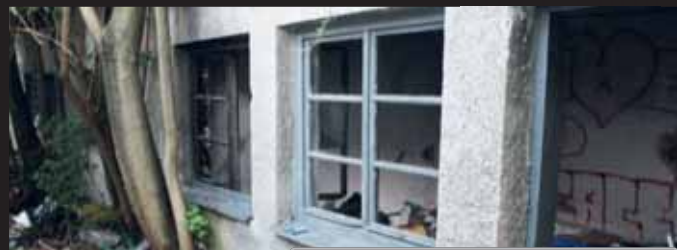
Jen pár metrů od nástupiště hlavního nádraží najdete podobné brlohy.