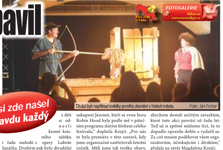
Diváci byli například svědky prvního zkonění v historii města.

pro malé i starší publikum. Jedním z hostů bylo brněnské divadlo Jaromír, které se divákům představilo v pátek odpoledne se hrou Robin Hood a dvojice herců rozesmála všechny generace. Příběh o tom, jak bohatý bratr a chudý dávat byl plný improvizace, zapojení diváků i vtipných hlásek narážejících na současnou dobu, což vykouzlo úsměv na rtech dětem i rodičům a prarodičům. „Věřím, že si každý z návštěvníků našel to své. Za zmínku kromě našich představení jistě stojí i představení dvou našich brněnských hostů. Jedním z nich bylo brněnské Divadlo Dno, které předvedlo velmi vtipné provedení Lišky Bystroušky