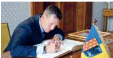
Nejlepší český tenista novodobé éry se právě podepisuje do pamětní knihy města.