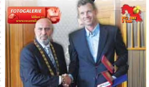
Tenista Tomáš Berdych obdržel z rukou prostějovského primátora medaili za šíření dobrého jména města.