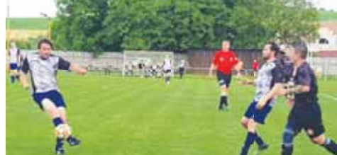
Favorit (v černých dreslech) si na trávníku Přemyslovic došel k postupu suverénně.

vo vápna P. Pliskovi, ten se uvolnil a z otočky zavěsil k pravé tyčce – 0:1. Zanedlouho odpověděl Vybíral pokusem z dálky Pánubohu do oken, načer do té doby nijak extra výrazní hosté získávali postupně větší převahu. Rychle za sebou páliili Dostál technicky z přímáku a Kvapil dělovkou pod břevno, Rozsival v obou případech skvěle vyrazil. Ve 28. měl navíc štěstí, když Rajnoha po rohovém kopu poslal tutovku zblízka vedle. Ve zbytku úvodního poločasu se však góly přece jen roztrhl pytel.