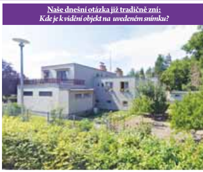
Naše dnešní otázka již tradičně zní: Kde je k vidění objekt na uvedeném snímku?