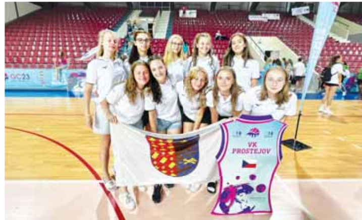
Kadetky VK Prostějov na týmovém snímku v chorvatské Pule.