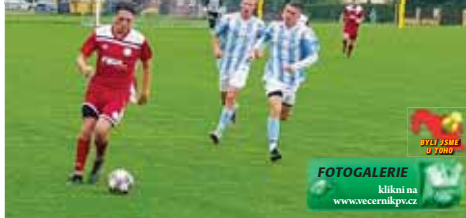
Fotbalisté Lipové (v červených dresech) odvezli z Určice derby vítězství 3:1.

EXKLUZIVNÍ reportáž pro Večerník Marek SONNEVEND