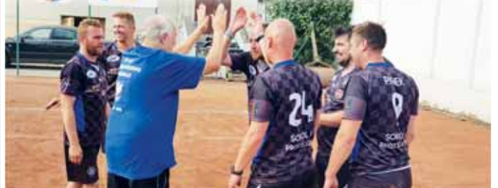
Prostějovští nohejbalisté zažili medailovou radost také na letních jednorázových turnajích.

PROSTĚJOV Po skončení základní části 1. ligy družstev mužů ČR 2023 dostali nohejbalisté TJ Sokol I Prostějov až do konce července týmové volno. Přesto řada členů hráčského kádru vítěze dlouhodobé fáze letošního ročníku soutěže nezůstala ani během této více než měsíční pauzy bez svého milovaného sportu.