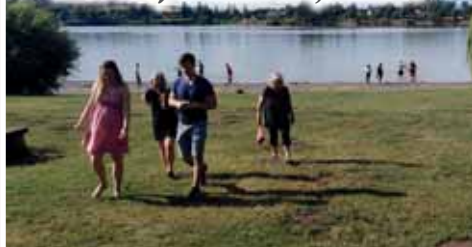
Pláž U Vrbiček jede i letos v zajetých kolejkách, kromě koupání nabízí i zajímavé kulturní akce.

První polovinu prázdnin však tady zvládli na jedničku