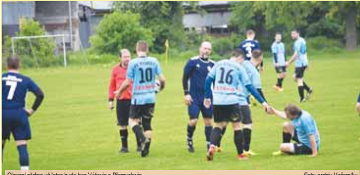
Okresní přebor už letos bude bez Vyšovic a Přemyslovců.