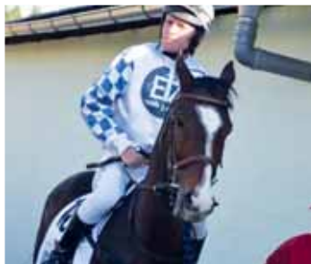
Hnědáč Lombargini je zkušeným matadorem dostihových drah.

Úspěšného kouče ale nyní trápí jiná věc. „Je otázka, zda pro koně budou jezdit. Překážkáři bohužel ubývá a ti, kdo už Velkou pardubickou jeli, si mohou vybrat,“ postesk si Popelka.