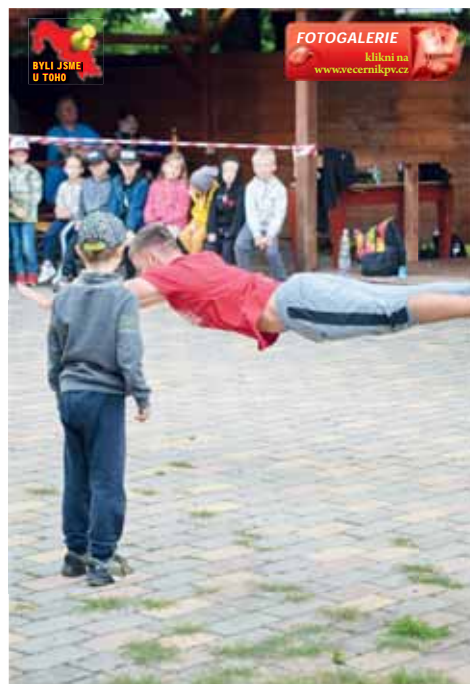
Tary učil děti zacházet s vlastním tělem.

Parkourista pohází z Ukrajiny, v roce 2002 se přistěhoval do Řičan u Prahy. K parkouru se dostal díky filmu Yakamasi, který mu změnil celý život. „Probudil ve mně touhu „být svobodný a volně se pohybovat“. Kvůli tomu jsem ve 12 letech začal skákat a překážky vnímat jako novou výzvu. Ten film mě nasměroval k parkouru, kterému jsem se pak začal opravdu aktivně věnovat v roce 2008,“ svěřil se. Snaží se, aby jeho YouTube kanál s 1,1 mil odběratelů, fanoušky nejen bavil, ale aby jim taky něco dal. „Hrozně si vážím toho, že mohu inspirovat spoustu mladých lidí a motivovat je k po-