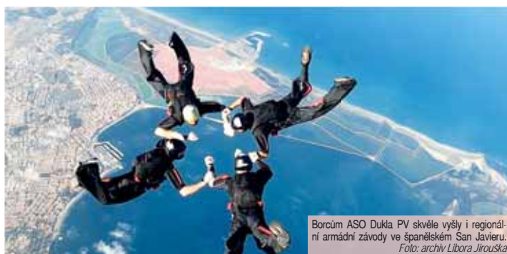
Borcům ASO Dukla PV skvěle vyšly i regionální armádní závody ve španělském San Javieru.