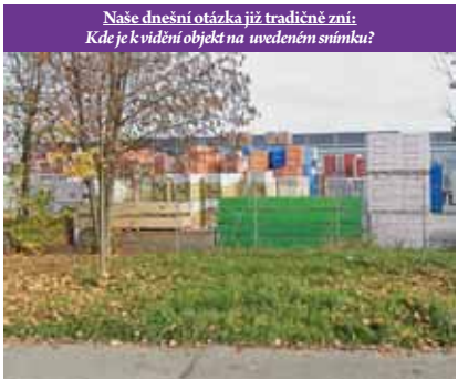
Naše dnešní otázka již tradičně zní: Kde je k vidění objekt na uvedeném snímku?