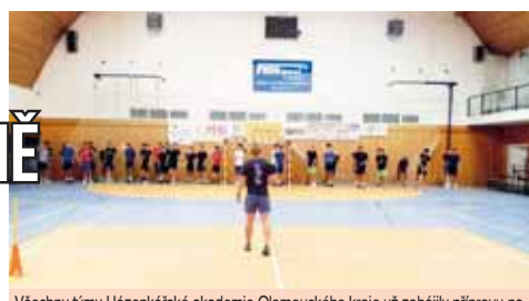
Všechny týmy Házenkářské akademie Olomouckého kraje už zahájily přípravu na novou sezónu.