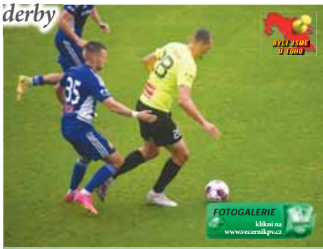
První hanácké derby letošní sezóny vítěze nenašlo.

EXKLUZIVNÍ reportáž pro Večerník Jan FREHAR