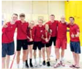
Okteto SK RG úspěšně na mezinárodním turnaji kategorie U15.

Dokonce osmičlenné zastoupení měl korfbalový oddíl SK RG na mezinárodním turnaji U15 v polském Krotoszynu, kde Česko reprezentovaly dva kolektivy. Jeden vybojoval stříbro za druhé místo, další přidal bronz za třetí příčku. A kdo z úspěšné hanácké organizace tedy měl podíl na těchto cenných kovech?