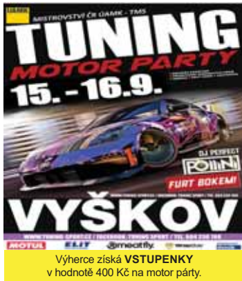
Výhrace získá VSTUPENKY v hodnotě 400 Kč na motor party.