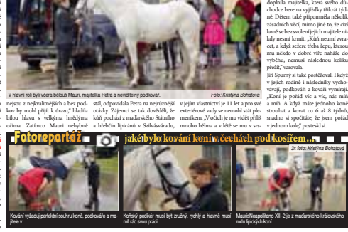
Kováři vyžádali perfektní souhru koně, podkovače a mistra.

EXKLUZIVNÍ reportáž pro Večerník Kristýna BOHATOVÁ Náš Hanáček ambasadorka v Čechách pod Kosírem a bílá mladá podivná podivná výstavní gletových mekka. Ale tentokrát a pro malý a velké zájemce o přípravu ženskou ukázkou starobu formou. Zájemci mohli v nedělní dopoledne na zámečku, kde dvoje na vlastní oči vidět, jako se kováři koně metodou za studena. Někte se dovedli zapojovat o tomto způsobu kováření, vět se koně koně metodou za studena. Někte se dovedli zapojovat o tomto způsobu kováření, vět se koně koně metodou za studena. Někte se dovedli zapojovat o tomto způsobu kováření, vět se koně koně metodou za studena.