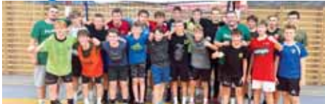
Pod záštitou HAOLK proběhl v Kostelci na Hané příměstský tréninkový kemp starších žáků.

Vstup na prvooligovou scénu mužů však není zdaleka jedinou zásadní novinkou z Házenkářské akademie Olomouckého kraje. Neméně důležitý je například fakt, že ambiciózní a úspěšně se rozvíjející oddíl získal status Regionální klubové centrum.