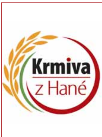
Výhrace získá DÁRKOVÝ POUKAZ v hodnotě 400 Kč na sortiment prodejny.

AGÁVE, ANTRAX, ARZEN, BOWLE, DCERA, KAPSY, KASAŘ, KYCLE, KYTARA, LYSKA, MALER, MLSÁK, OHLAS, OSLAŘ, OTEPI, RASER, REAKCE, ŘEDKEV, SCELENÍ, SISAL, VČELY, VDOVA, VPICHY, VYŠAČ, YELLOW