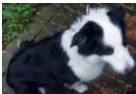
Strážníci si vylekanou fenku museli odvézt na služebnu, za chvíli jí však vyzvedl páneček.

Osmapadesátiletý muž bydlící mimo Prostějov celou situaci také strážníkům vysvětlil. „Uvedl, že šel do obchodu nakoupit a psa nechal venku. V tu chvíli se přes Prostějov zrovna přehnal bouřka, která fenku vystrašila natolik, že se jí podařilo utéct a vběhnout do obchodu, kde byla následně odchyacena,“ zproneřkovala vyjádření vedoucí skupiny prevence kriminality Městské policie Prostějov. (mik)