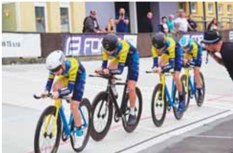
Zlaté medaile vybojovali i starší záci TUFO PARDUS PV ve stíhacím závodě družstev.

a přidal druhé místo ve scratchi. Ve starších zářích potvrdil konstantní