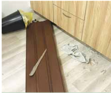
Muž plný vzteku vyrvál zasunovací dveře od koupelny a při hádce s přítelkyní nechal v bytě notný nepořádek.

luje vybavení bytu. „Strážníci na místě zjistili, že se dvojice nejprve pohádala a poté pětáctiletý muž rozbil ve vzteku dveře do koupelny, televizor a koš na prádlo. Ke svému jednání se doznal. Za přítomnosti hlídky muž z bytu dobrovolně odešel. Způsobená škoda, která nepřesáhla hranici deseti tisíc korun, bude vymáhána u příslušného správního orgánu,“ informoval Petr Zapletal, zástupce Oddělení prevence Městské policie Prostějov. Pokud žena „nestáhne“ oznámení na svého druhá, muži hrozí i finanční postih. „Za přestupek proti majetku pětáctiletému muži hrozí pokuta do výše padesáti tisíc korun,“ potvrdil Zapletal.