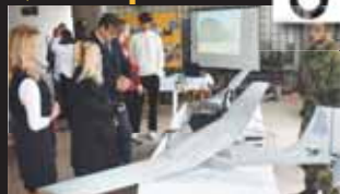
Hodně zájmu zaregistrovali u svého stánku vojáci. V „Kasku“ totiž představili i bojové drony.