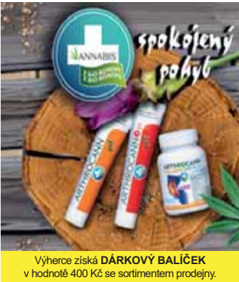
Výherce získá DÁRKOVÝ BALÍČEK v hodnotě 400 Kč se sortimentem prodejny.