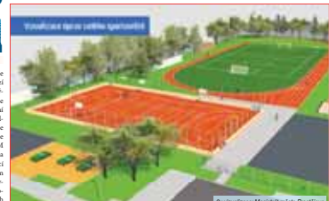
Z vizualizace Magistrátu města Prostějova

Rekonstrukce hřiště ZŠ v Melantrichově ulici právě začala PROSTĚJOV Prostějovský magistrát naplánoval novou podobu hřiště v areálu Základní školy v Melantrichově ulici již v loňském roce. Setrávil se z rekonstrukce stávajícího hřiště, které bylo v špatném stavu. V současnosti se provádí demolicí stávajícího hřiště včetně oplocení a zpevnění plochy pod stávajícími venkovními stoly na stálém místě, nová hřiště bude státní populárního typu. Naopak dochází k demolicí stávajícího hokejbalového hřiště. První etapa prací byla zahájena minulý úterý 26. září. KRISTÝNA BOHÁTOVÁ Nový atletický ovál bude proveden na místě stávajícího, nově vybudované hřiště včetně oplocení a zpevnění plochy pod stávajícími venkovními stoly (250 m). Jeho součástí bude hřiště pro ledoběžkové hřiště, objemná měry námištěk prostřežského primátora Jiří Rozehnal s tím, že součástí budou zpevněné plochy plochy instalace mobilní a výměnná aranzování osvětlení. „Dále bude provedena oprava a kácení dřev. Stávající proutek pro volný čas a hra stolního tenisu bude zrekonstruována, provedena bude nová zpevněná plocha a ETOM povrchu, která bude doplněna o nové herní vybavení. Stávající oplocení bude nahrazeno novým a doplněno o záchranné síť ve výměřích deseti. Součástí tohoto objektu je realizace vybraných venkovních branek a vjezdové brány na stávajících místech“ popsal náčelník primátora. Výhledově hřiště proběhne v červenci a srpnu 2023. Nejvhodnější náhláka předložila společnost