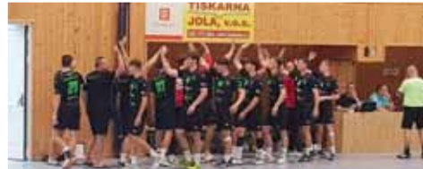
Házenkáři HAOLK týmu Velká Bystřice/Olomouc při pohárovém vítězství v Kostelci na Hané.

Liga Olomouckého kraje starších žáků - turnaj 1. kola: Velká Bystřice - Centrum Haná 29:35,