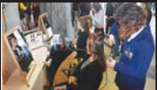
Své umění předváděly i mladé kadeřnice. O toto řemeslo byl mezi návštěvníky zájem.