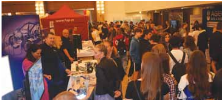
Prostějovská Burza práce a vzdělávání získala obrovskou oblibu, tu letošní navštívily více než dva tisíce lidí.

Stánků bylo ve všech sálech Společenského domu tolik, že například představitelé Policie ČR,