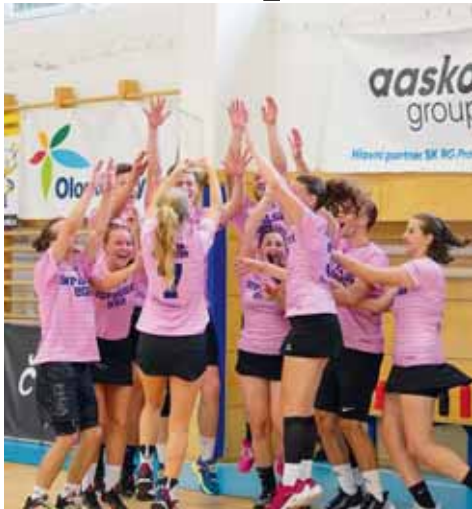
Korbfbalovou Superligu ČR 2023 v Prostějově vyhrál Collaloc team s početným zastoupením domácích hráčů i hráček v sestavě.

Semifinále: Chňapíci - Česko U19 23:17 (13:10), Collaloc team - On/Off 20:12 (14:6). O 3. místo: Česko U19 - On/Off 19:9 (10:5). Finále: Collaloc team - Chňapíci 18:17 (11:13) O 5. až 8. místo: Infinity team - Somelieris 20:12 (14:6), Challenge team - Cypisci 28:8 (12:4) O 7. místo: Somelieris - Cypisci 25:4 (10:3). O 5. místo: Challenge team - Infinity team 14:13 (7:7).