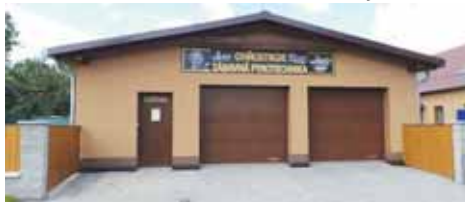
K první explozi došlo v tomto skladu patřícím k domu profesionálního hasiče.

Výbuchem bylo poškozeno nakonec 15 nemovitostí, čtyři domy značně