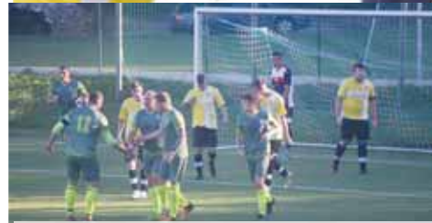
Ve finále se tentokrát Čechovice postavily Brodsku u Konice.