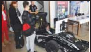
Firma Honeywell vyrábí nejen letecké motory, do Prostějova přivezla i speciální formuli.