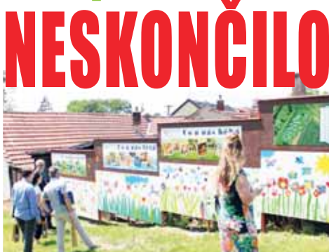
Hodnotitelská komise měla před rokem v Dobrochově skutečně co obdivovat.

Rok po úspěchu je jasné, že v obci neusnuli na vavřínech. „Po vzniku lokálního biocentra jsme se nyní orientovali spíše na menší projekty. Kromě rozsáhlé výsadby květin v centru obce mezi ně patřilo také vysazení švestkové aleje kolem polní cesty vedoucí od nové cyklostezky směrem k vyhlídce. Kromě toho