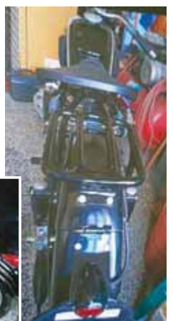
O dva motocyklové veterány přišel sběratel z Hluchova. Policie pátrá po pachateli krádeže.

Kostelec na Hané (mls) – Výroba elektřiny ze solárních panelů je trend, který může pomoci vyrovnat se s vysokými cenami energií. V Kostelci na Hané vznikne fotovoltaická elektrárna i na budově městského úřadu. Za zhruba 852 000 korun ji vybuduje společnost Heinz elektro.