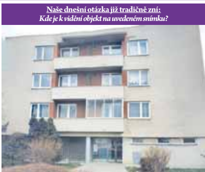
Naše dnešní otázka již tradičně zní: Kde je viděn objekt na uvedeném snímku?