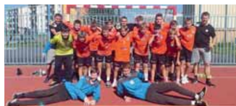
Starší žáci TJ Sokol Centrum Haná otevřeli Ligu Olomouckého kraje dvěma výhrami v Uničově.

Uničov - Centrum Haná 9:43. Zlínská liga starších žáků - turnaj 1. kola: Velká Bystřice - Centrum Haná odloženo na 11. října. Liga Olomouckého kraje mladších žáků - turnaj 1. kola: Osek