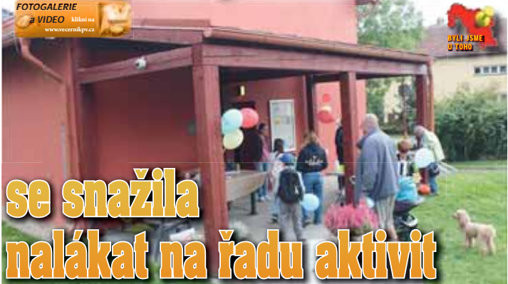
Okolí červeného domu v Kostelci na Hané.