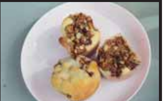
Připraveno bylo i originální občerstvení.