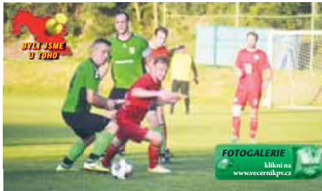
Plumlov doma potvrdil slušnou formu a Pivín udolal.

Domácí Plumlov se dočkal, přestože byl v deseti