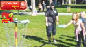
Prostějovští namístě otevřeli nové discgolfové hřiště v Kolářových sadech, které odhalil primátor Jiří Rozehnal.

„Kritici nemají pravdu, hřiště je bezpečné,“ ujistí náměstek primátora Jiří Rozehnal