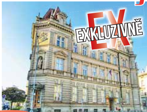
Budova hlavní prostějovské pošty půjde do prodeje.

„Výběrové řízení proběhne formou e-aukce. Podmínkou je podepsání dlouhodobé nájemní smlouvy pro zachování provozu