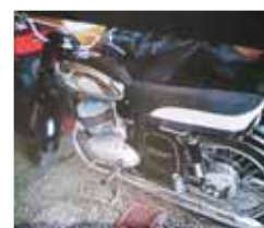
O dva motocyklové veterány přišel sběratel z Hluchova. Policie pátrá po pachateli krádeže.

ředitelství policie Olomouckého kraje. Poškozenému majiteli tak nyní zbývají tak akorát oči pro pláč a víra, že policie zloděje vypátrá a oba vzácné stroje mu budou vráceny. „Majitel veteránů odhadl škodu na sedm set tisíc korun. Pachatel hrozí za přečin porušování domovní svobody a krádež trest odnětí svobody na jeden rok až pět let,“ uzavřel mluvčí krajské policie. (mik)