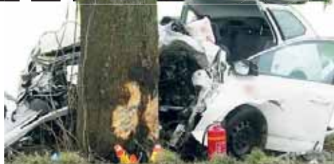
Náraz do stromu řidič nepřežil. Policie v tuto chvíli nemůže vyloučit ani případnou sebevraždu.

„Podle prvotních informací osmapadesátiletý řidič vozidla Škoda Octavia jel ve vozidle sám a z dosud nezjištěných příčin vyjel vpravo mimo komunikaci, kde narazil do rozlehlého stromu,“ sdělil k události krajský policejní mluvčí Libor Hejtmán a dodal: „Řidič při nehodě na místě zemřel. Přesná příčina dopravní nehody je v šetření prostějovských dopravních policistů.“ Možných příčin je přitom hned několik. Muže mohl postihnout mikrosrpněk nebo nějaká zdravotní příhoda. Stejně tak může za nehodu stát technická závada na vozidle. A policisté zatím nemohou vyloučit ani možnost sebevraždy. Odpovědi na některé otázky tak bude muset přinést až nařazená pitva a expertiza vraku vozidla.