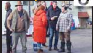
Někteří dorazili i s originálním kloboukem na hlavě.