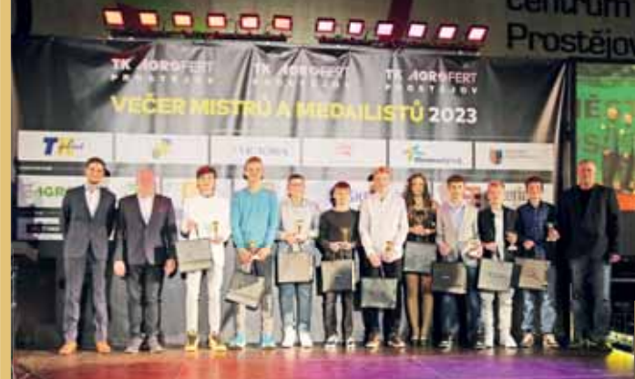
A že za letošní ročník bylo co oslavovat.