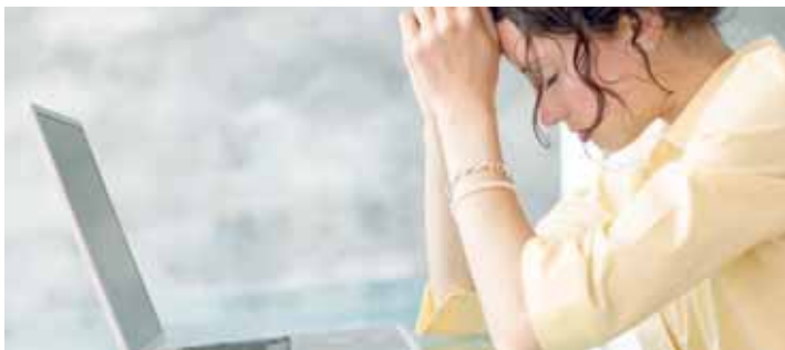
Když už se nechají podvádět i mladí lidé, kteří sociálním sítím a internetu rozumí, je to na pováženo. Ilustraci foto: internet

Oběma se ozvali neznámí zájemci, kteří požadovali odběr přes jistou dodávkovou službu. Prodávající, kterým nedošlo, že mají co do činnosti s podvodníky, od údajných zájemců obdrželi obratem odkazy na přepravní společnost, která se o celý obchod měla postarat. „Po jejich rozkliknutí byly oběti přesměrovány na webovou stránku, na níž zadaly údaje ke svým účtům, a podvodníkům tak umož-