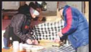
Ke konci akce toho ve stáncích už mnoho nezůstávalo.