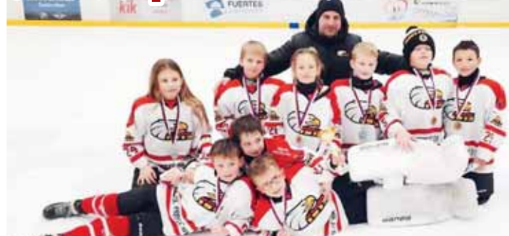
Třetí příčku přivezli hokejisté SK Prostějov 1913 z Kuřimi.

PROSTĚJOV V sobotu se hokejisté Prostějova zúčastnili turnaje v Kuřimi, kde místní klub pořádá další ročník turnaje Mystery Cup, v němž změřila síly pětice celků. V nabitě konkurenci se ani mládež Prostějova neztratila a s vyrovnanou bilanci obsadila třetí příčku. Na tento úspěch budou chtít další kategorie navázat i během mezi-