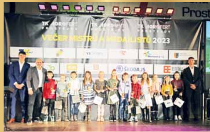
Ocenění za skvělou reprezentaci předávali i zástupci vedení města.