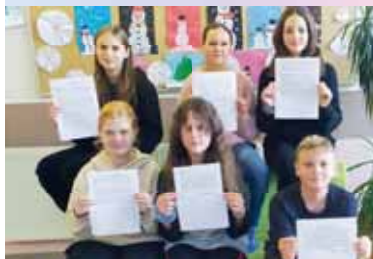
Dĕti ze 7. roĕniku Zĕkladnĕi ŕkoly T. G. Masaryka v Brodku u Konice poslaly Veĕernĕku svĕ literĕrnĕi dĕla s vĕnoĕnĕi tematikou.