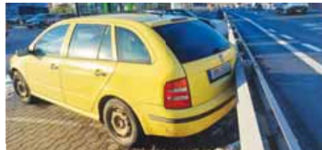
Odstavené auto na odlehlém parkovišti bylo namáčknuto na svodidla.