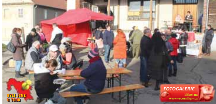
Zabijačkové dopoledne se konalo v prostoru za nákupním střediskem. Lidé nakupovali u stánků, někteří si jídlo dali u připravených stůlů.

PLUMLOV Domácí zabijačky u nás dříve patřily právě k adventu mnohem více než nakupování dárků. Díky mrazu se maso z právě zabitého prasete nekazilo a nesedalo na něj mouchy. Přestože se podoba našich Vánoc změnila, na zabijačkových pochoutkách si lidé stále rádi pochutnají i dnes. Svědčilo o tom Zabijačkové dopoledne, které se konalo uplynulou sobotu 12. prosince v prostoru za nákupním střediskem v Plumlově. „Podívejte, kotle jsou prázdné, v závěru akce místní feznický mistr zabijačkové pochoutky byl během dopoledne velkým zájem, lidé si domů