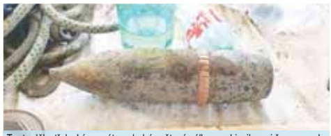
Tento dělostřelecký granát ze druhé světové války se objevil mezi řepou v cukrovaru.

Lidé z cukrovaru kontaktovali policii. „Přivolání pyrotechnika pak potvrdilo, že obavy cukrovarníků byly oprávněné. Kovový předmět nalezený mezi bulvami řepy byl sovětský dělostřelecký granát ze druhé světové války. Pyrotechnik muniční zajistil a odvezl k zneškodnění,“ uvedla Marie Šafářová, tisková mluvčí Krajského ředitelství Policie ČR v Olomouci. (ofr)