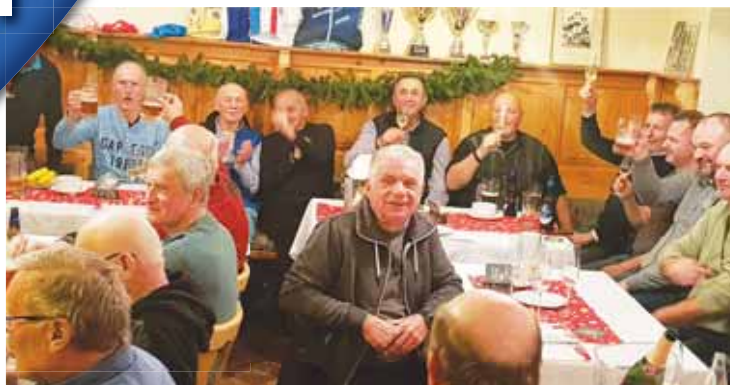
Vzácní hosté přijíjí na zdraví a zdár Vánočního posezení 2023.

PROSTĚJOV Stejně jako loni při obnovené premiéře si i letos cyklističtí nadšenci z Prostějova a různě širokého okolí naplno užili Vánoční posezení kamarádů cyklistů 2023. Jeho dějištěm opět byla prostějovská Restaurace Na Mánesce, kam dorazilo necelých sto pozvaných hostů. Včetně řady bývalých špičkových závodníků, z nichž někteří sbírali světové, či dokonce olympijské medaile a tituly.