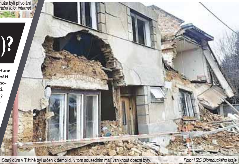
Starý dům v Tištině byl určen k demolicí, v tom sousedním mají vzniknout obecní byty.