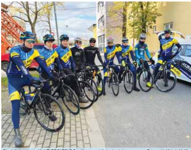
Odměněná sestava cyklistů TUFO PARDUS Prostějov na společném domácím srazu.

PROSTĚJOV Sestava cyklistického týmu mužů TUFO Pardus Prostějov pro novou sezónu 2024 je kompletní. Tým je na i příští rok opět registrován u Mezinárodní cyklistické unie (UCI) v kategorii Continental Team a vedení hanáckého klubu naplánovalo první společný organizačně-tréninkový kemp pozemního kolektivu doma v Prostějově.