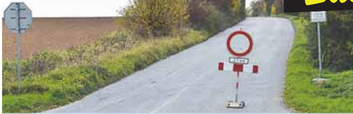
Loni byla „stará“ uzavřena kvůli výstavbě rondelu u Olšan, což řidiči s ohledem na zácpy na D46 nesli s velkou nevolností.

Všichni o tom vědí, ale nikdo s tím nic neudělá. Tak by se dala stručně popsat situace se stavem „staré“ silnice mezi Prostějovem a Olšany. Po ní se řada lidí kvůli většinou upaně dálnici