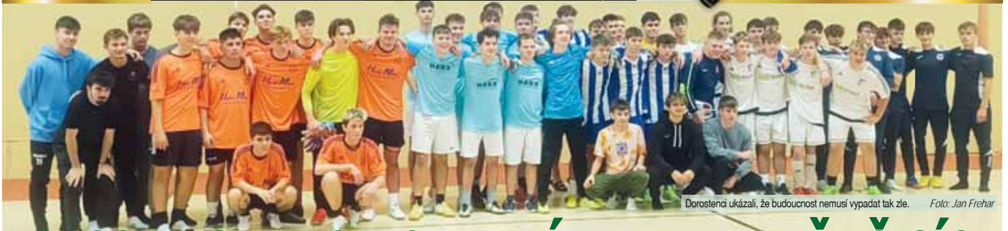
Dorostenci ukázali, že budoucnost nemusí vypadat tak zle.