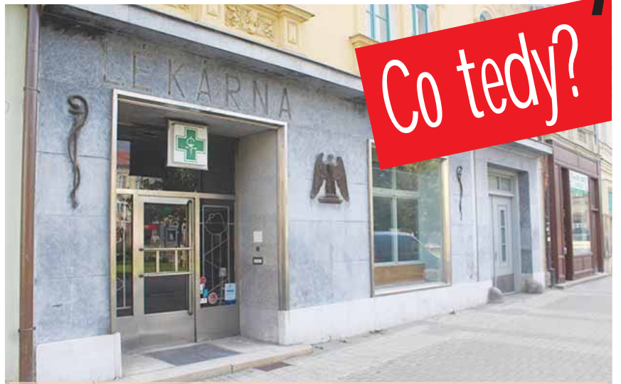
Uvolněné prostory po lékárně v domě U Černého orla zůstávají stále prázdné