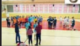
Po turnaji nemohlo chybět ani slavnostní vyhlášení.