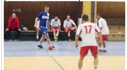
Sudí i letos předvedou, že si s míčem velmi dobře rozumí.

PROSTĚJŮV Meziváteční období toho z hlediska fotbalu příliš nenabízí. Jednu jistotu však toto období má. Stejně jako v letech předěšlých, tak i letos proběhne tradiční turnaj v sálové kopané, kde budou v hlavní roli sudí. Pod hlavičkou Okresního fotbalového svazu Prostějov se o primát utkání tradiční čtveřice účastníků, tedy sudí spadající pod OFS Prostějov, KFS Olomouckého kraje, Řídící komisi pro Moravu a celostátní sudí. A i když jde především o meziváteční setkání, rozhodně o zajímavé výkony nebude nouze. Jak už bývá zvykem, tak se sudí sejdou ve sportovní hale v Kostelci na Hané, kde tak 27. prosince budou moci vypít vánoční obězterví.