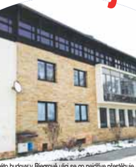
Do této budovy v Riegrově ulici se co nejdříve přestěhuje celá Domovní správa Prostějov.