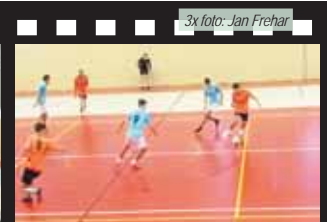
K vidění byly kvalitní duely.