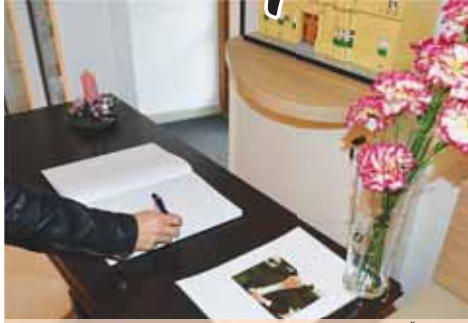
Až do konce roku můžete projevit soustrast rodině Ladislava Županíče v kondolenční knize v městském informačním centru vedle radnice.

PROSTĚJOV Jak Večerník informoval v minulém vydání, Prostějov ztratil další výraznou osobnost z uměleckého světa. Zemřel slavný prostějovský rodák Ladislav Županíč, herec, jehož role jsou nezapomenutelné. Stejně jako jeho umění v dabingu. Magistrát dal minulý týden k dispozici kondolenční knihu. Od čtvrtka 14. prosince až do konce roku je v prostorách Turistického informačního centra Magistrátu města Prostějova k dispozici kondolenční kniha. Lidé mohou přijít vyjádřit soustrast rodině Ladislava Županíče, prostějovského rodáka, který nás opustil 9. prosince letošního roku. „Jeho smrt se mě osobně velmi dotkla. Přišli jsme o úžasně ho člověka, skvělého herce a da-