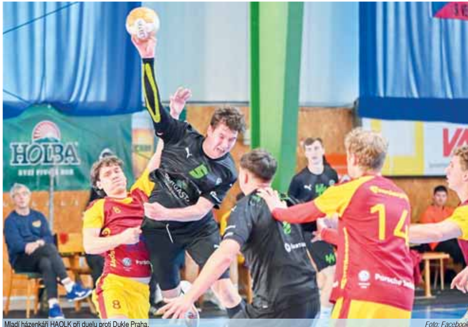
Mladí házenkáři HAOLK při duelu proti Dukle Praha.