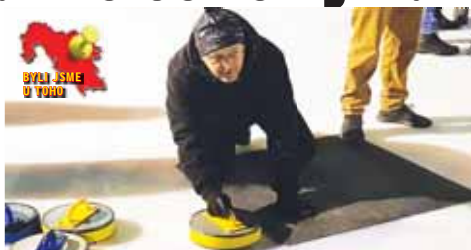
Jeden z bronzových Farmářů se soustředí na vyslání hracího kamene.

„Atmosféra byla jako vždy výborná, nesla se v přátelském a svátečním duchu,“ zdůraznil šéf organizačního kolektivu. Základní část zahajovacího turnaje vyhrál Kras Vrahovice, který však v následném play-off nezládl čtvrtfinále a skončil pátý.