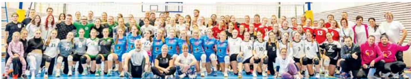
Všechny týmy volejbalového turnaje ČP juniorek U20 v Ústí nad Labem na společném snímku.