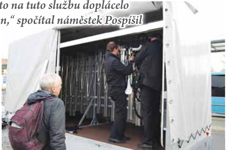
V letošním roce bylo směrem z Prostějova do Jedovnice přepraveno cyklobusem 164 jízdních kol.