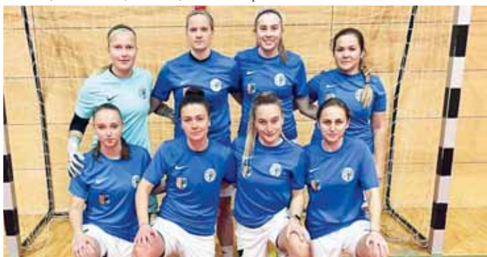
Ženy Prostějova si prosinec zpestřily halovým turnajem.