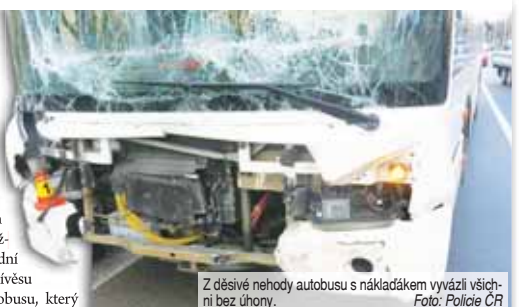
Z děsivé nehody autobusu s nákladákem vyvázli všichni bez úhony.

Mohutná rána, řízení skla a skřípění plechů, to vše se rozeznělo okolím křižovatky kolem deváté hodiny. Autobus, vyjíždějící z ulice Šárka, narazil přední částí do kontejnerového přívěsu nákladní soupravy. „Řidič autobusu, který vyjížděl z vedlejší ulice na hlavní, vysvětlil, že při dojíždění ke křižovatce mu sklouzla noha z brzdového pedálu,“ prozradila policejní mluvčí Marie Šafářová. Z dechové zkoušky vyšli oba řidiči se ctí. Policejní alkoktest ukázal u obou mužů nula promile. Škodu pak znalci na místě odhadli na 200 tisíc korun. A protože se nikomu nic nestalo a s řidiči bylo vše v pořádku, vyřešili policisté nehodu na místě uložení pokuty nešťastnému autobusařovi. (ofr)