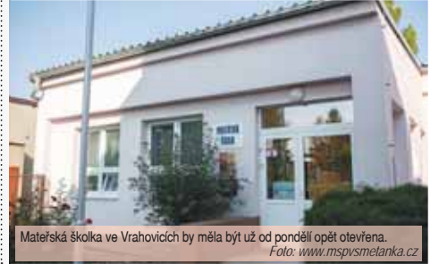
Mateřská školka ve Vrahovicích by měla být už od pondělí opět otevřena.