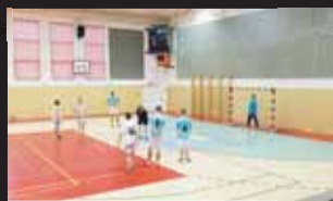
Vyrovnanost dokazuje fakt, že poslední Nezamyslice porazily první Křenovice.