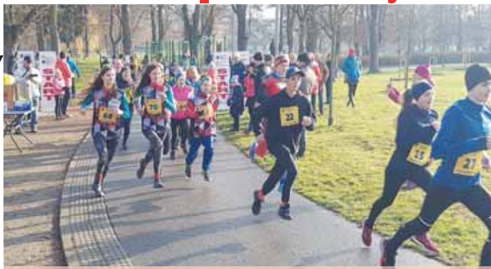
Po roce je tady zase prostějovský Silvestrovský běh, už 47. ročník.