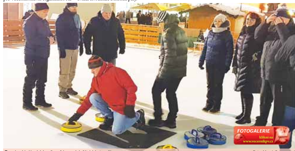
Turnaje série Hanácké curling vždy provází přátelská atmosféra.

Úvodní turnaj 8. prosince – pořadí po základní části: 1. Kras Vrahovice, 2. Prasklé gumy, 3. Jahody na medu, 4. Farmáři, 5. Flingstones, 6. Mokří banditi, 7. SK Salí, 8. Děti punče, 9. Black and White, 10. Žízeň.