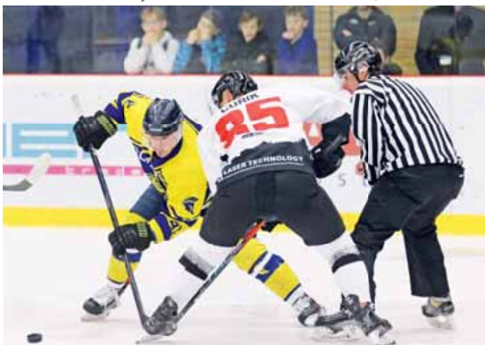
Hokejisté zapsali druhou porážku v sezóně.

Dohrávka 14. kola, středa 10. ledna, 19.00 hodin: Blansko – Prostějov. 21. kolo, neděle 14. ledna 17.00 hodin: Uherský Brod – Blansko (sobota 13. ledna, 17.00), Brumov-Bylnice – Břeclav (sobota 13. ledna, 17.00), Prostějov – Uherské Hradiště, Uherský Ostroh – Boskovice, (Kroměříž – volný los)