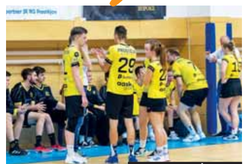
EXTRALIGA KORFBALU ČR 2023/2024

Místo toho se teď před hanáckou partou – ac zatím zůstává na poslední čtvrté pozici – otevírá šance dotáhnout se k úplnému čelu pořadí. Podmínkou však samozřejmě