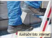
Ilustrační foto: internet

Při rekonstrukci bytu poblíž centra Prostějova spadl ze žebříku a poranil si hlavu a rameno šestatřicetiletý hmotnější muž. Při jeho transportu do sanitky asistovali hasiči i strážníci, kteří jako příčinu jeho pádu ze žebříku zjistili přítomnost 2,4 l promile alkoholu v jeho žilách.