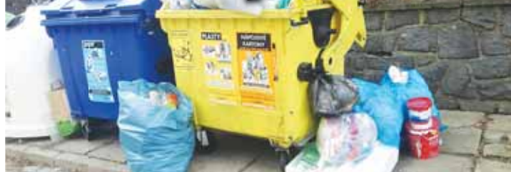
Přestože od letošního roku zaplatíme za odpad více peněz, stovky občanů Prostějova mohou uplatnit slevu.