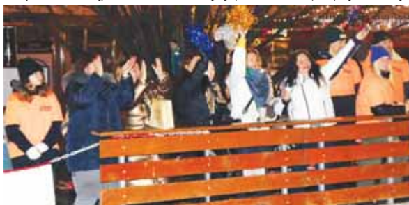
Vybornou kulisu vytvářeli i příznivci (zde fanynky týmu Prachovka).