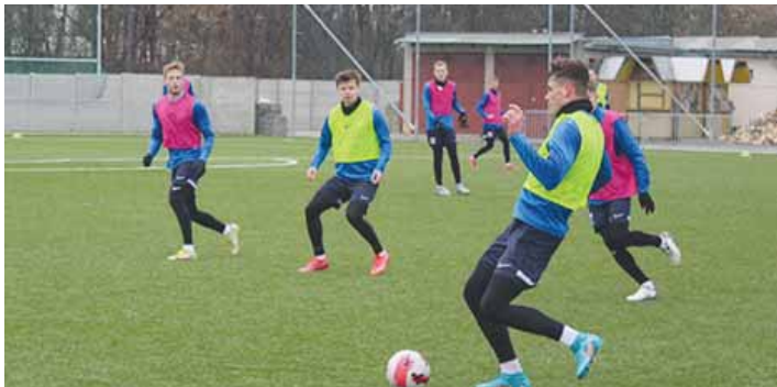
Esáčko čeká na startu přípravy mrazivě počasí.