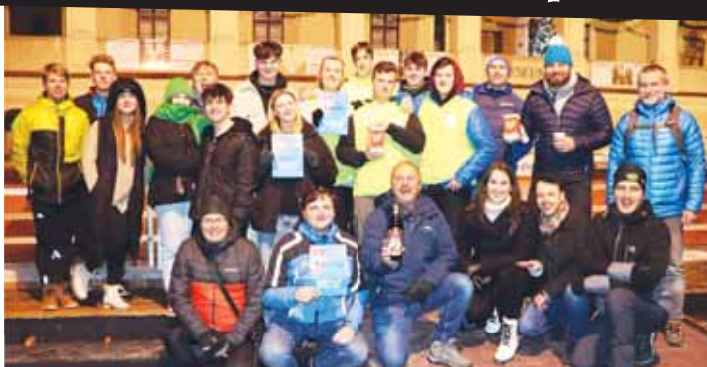
Nejlépeší družstva třetího turnaje letošní série na společném snímku.