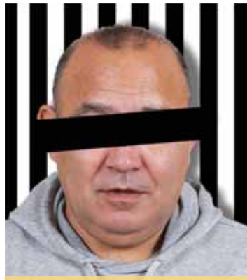
Celostátně hledaný darebák byl zadržen v Prostějově.

Poté, co se minulý týden policisté obrátili se žádostí o pomoc na občany v rámci veřejné pátrací relace, nabraly věci rychle spád. Na tísňovou policejní linku se ozvali občané, kteří hledaného delikventa viděli v Prostějově. Tam pak byl v ulici U Spalovny prostějovskými muži zákona zadržen. „Muž byl eskortován k soudu, který rozhodl o jeho vzetí do vazby. Na základě tohoto rozhodnutí byl eskortován do vazební věznice v Olomouci,“ konstatovala mluvčí krajské policie Míluše Zajícová a dodala: „Všímavým občanům děkujeme za spolupráci.“