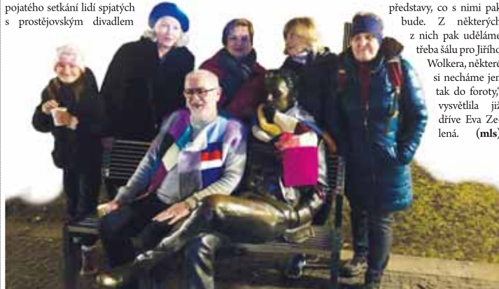
Za každoročním zahalováním Jiřího Wolкера stojí spolek Knitty-witty tvořený lidmi spojenými s prostějovským divadlem.