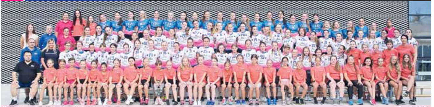
Mládežnické volejbalistky VK Prostějov prožívají solidní sezónu 2023/24.