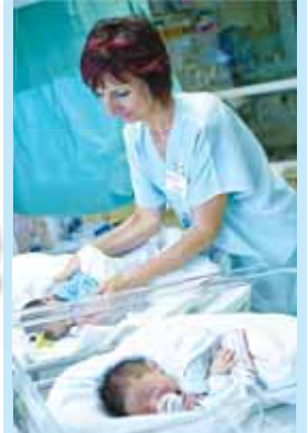
Vloni se v prostějovské porodnici narodilo 604 dětí.

PROSTĚJOV Celkem 604 narozených dětí, z toho čtyřikrát dvojčata. A opět vedl počet chlapců nad děvčátky. Nejplodnějším měsícem roku 2023 v porodnici Nemocnice AGEL Prostějov byl srpen. Jak ovšem vyplývá z čerstvě vydané statistiky, počet narozených dětí se v Prostějově opět rapidně snížil.