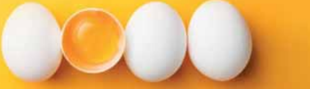
Vajíčka jsou nepochoybné drahé střívelo.

ci. Vypadá to však, že jeho útoky lidem až tak neškodí, nebo alespoň ne natolik, aby je hlásili policii. Prostějovští strážníci totiž ani jeden z výše uvedených případů nevidují. „Vámi uváděný útok ani žádný jemu podobný nám v posledních několika měsících nikdo neohlásil,“ reagovala Tezeza Greplová z Městské policie Prostějov. (mls)