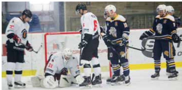
Foto Hokejisté eskáčka na Břeclav překvapivě nestačili.