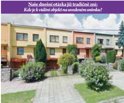
Naše dnešní otázka již tradičně zní: Kde je viděn objekt na uvedeném snímku?