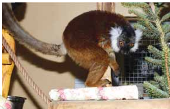
I zvířata v zoo mají ráda dárky a baví je jejich rozbalování.

Potrava představuje nejčastější způsob využití enrichmentu. Stačí, když zvíře nedostane svou potravu připravenou do misky a k jejímu získání musí vynaložit úsilí a hledat ji. Oblíbeným postupem jsou třeba zmíněné vánoční dárky s ovocem či vydlabané dýně, zamražené potraviny do ledu, naplnění bambusového tubusu červy, případně jakékoliv pletence z hasičských hadic, v nichž může být ukryto maso.