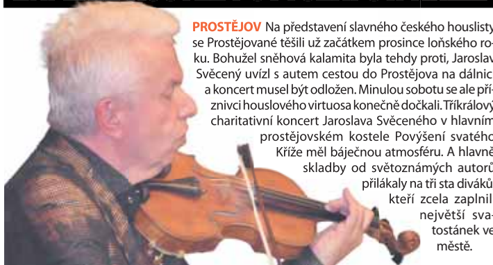
Houslový virtuos Jaroslav Svěcený exceloval během Tříkrálového charitativního koncertu v Prostějově.

PROSTĚJOV Na představení slavného českého houslisty se Prostějované těšili už začátkem prosince loňského roku. Bohužel sněhová kalamita byla tehdy proti. Jaroslav Svěcený uvízl s autem cestou do Prostějova na dálnici a koncert musel být odložen. Minulou sobotu se ale příznivci houslového virtuosa konečně dočkali. Tříkrálový charitativní koncert Jaroslava Svěceného v hlavním prostějovském kostele Povýšení svatého Kříže měl báječnou atmosféru. A hlavně skladby od světznámých autorů přilákaly na tři sta diváků, kteří zcela zaplnili největší svatostánek ve městě.