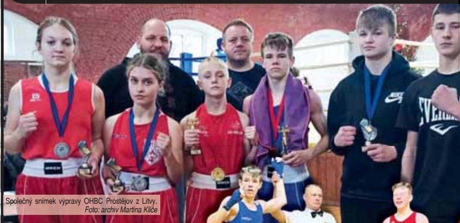
Společný snímek výpravy OHBC Prostějov z Litvy.