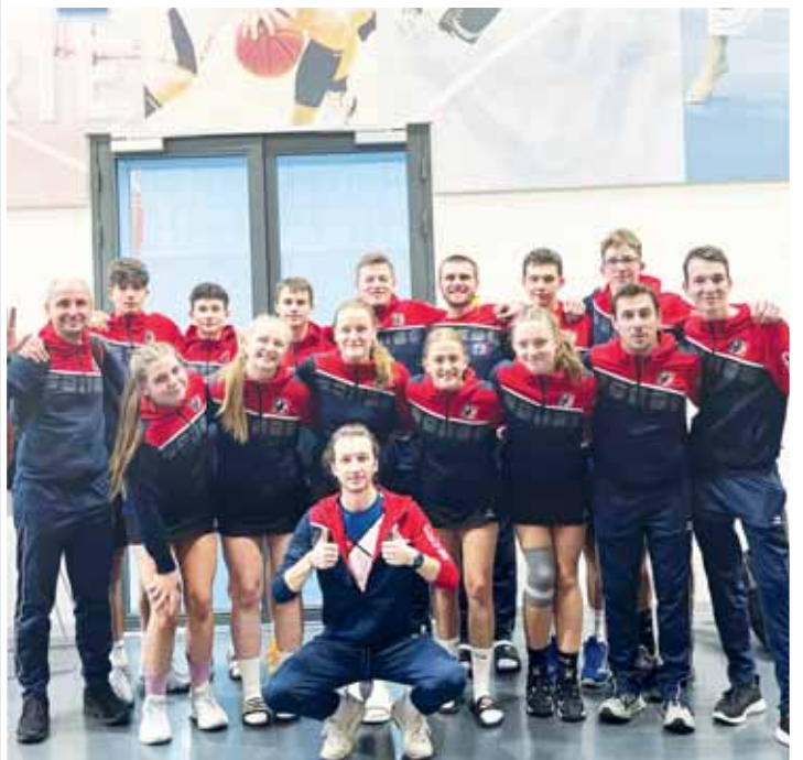
Klub Vosime.cz Korfbal Prostějov měl na mezinárodním turnaji v Rotterdamu takto početné zastoupení.

Družstvo U19 tak splnilo své cíle sběrem nových zkušeností, sehráním se a obecně vystoupením na takto významném turnaji. Sedmnáctka jej navíc dokázala ve své věkové kategorii i ovládnout, přičemž triumf z tradiční akce v Nizozemsku jakožto korfbalové Mecke pomohl vybojovat mančaft tvořený převážně hanáckou enklávou! (son)