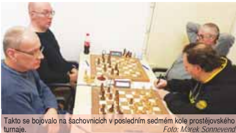
Takto se bojovalo na šachovnicích v posledním sedmém kole prostějovského turnaje.