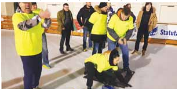
Hanácké curling vždy provází báječná atmosféra mezi vlastními aktéry.