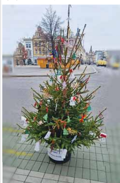
Vánoční stromky můžete letos odložit k běžným kontejnerům či popelnicím na odpad.