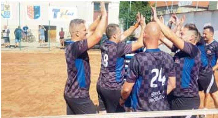
Nohejbalisté Sokola I Prostějov už zbrojí a jsou v plné přípravě na extraligu.