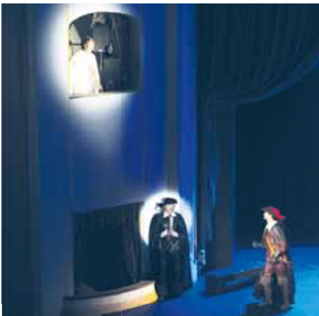
V Národním domě se odehrála i asi nejslavnější balkónová scéna celé divadelní historie.