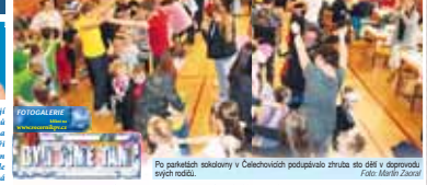
Po patnácti hodinách v Čelechovicích podávalo žitná sůl děti a doprovod.