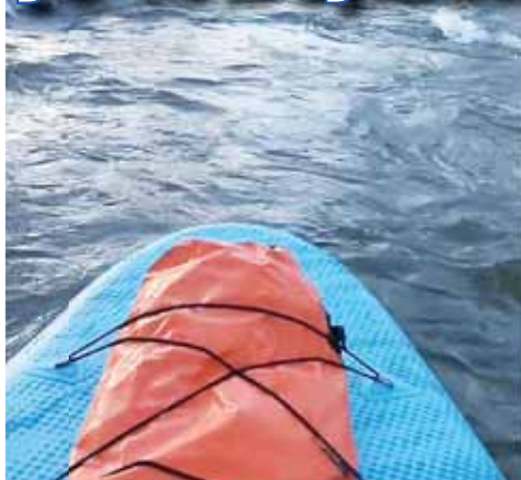
Cesta na paddleboardu po únorové Hloučele byla plná romantiky.

PROSTĚJOV Opravdu vzácná skutečnost, již by se mělo patřičně využít! Jen málokdy protékalo Hloučelou v Prostějově tolik vody jako právě v těchto dnech. Někteří lidé už toho využívají a na říčku vyrazili i se svými kajaky, či dokonce na paddleboardu. Zatímco v létě řeka často vysychá, projekt se po ní v průběhu celého února nebyl vůbec žádný problém.