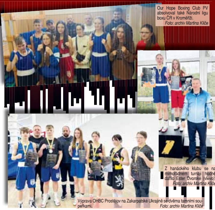
Our Hope Boxing Club PV absolvoval také Národní ligu boxu ČR v Kroměříži.