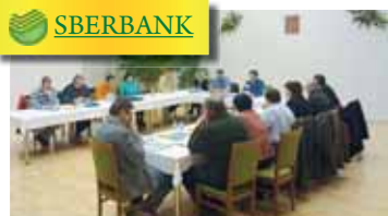
Určice zastupitelstvo se muselo vypořádat se situací, že obec přišla o peníze, které měla uloženy u dceřovny Sberbank.

bankovním. Určice na svém účtu měly peníze, na něž se spoléhali na finanční spojitosti s místními podniky. Určice na něm bylo uloženo 8,7 milionu korun, totiž měly vloženy u Sberbank. Její Česká filialka byla přímo navázána na Ruskou národní banku. Po začátku války na Ukrajině přede dvěma lety došlo k jejímu uzavření. Situace zaskočila také Věnoměřiče, kteří stejipým způsobem přišly o 1,7 milionu korun. Po dvou letech od zabíjení konfliktů povstání vylučuje Sberbank CZ pražský Věchovičům.