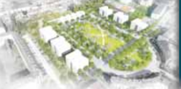
Takto má v budoucnu vypadat prostor v areálu bývalých jezdeckých kasáren v Prostějově.

Výhled ve Strojářské ulici 29 je otevřená v pondělí od 13.00 do 15.00 hodin a v pátek od 10.00 do 12.00 hodin. Zájemce sdělit základi sdáje, tedy jméno, příjmení, rok narození, důvod vyzvání vyzvání, a dostane buďto potvrzení. Na další výhled je mu vystavena kartačka s daty odberu potvrzení. Přijít může maximálně jedenkrát týdně, celkové pak čtyřikrát. Pokud jeho vyzvání star bude potvrzení, bude pracovat na dalším třetím a odberu sociálních věcí a Úřadu práce“ doplnila náměstkyně prostějovského primátora Marcela Zupková.