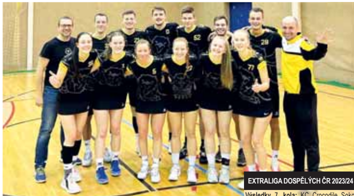
EXTRALIGA DOSPĚLÝCH ČR 2023/24

ČESKÉ BUDĚJOVICE, PROSTĚJOV Zásadní duel pro celý zbytek sezóny – špil takzvaně o bytí a nebytí – hráli korfbalisté Vosime.cz Prostějov v nedělním odpolední na palubovce KC Crocodile Sokol České Budějovice. Aby neskončili s největší pravděpodobností až na poslední čtvrté pozici extraligy dospělých ČR 2023/24, museli tam minimálně remizovat, v lepším případě zvítězit. Což se jim skvělým výkonem povedlo, z kraje rybníků odvezli jednoznačný triumf 25:34 (12:15)!