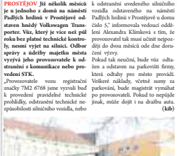
Dlouhodobé nepopulární vuz blokuje parkovací místo v centru města.

k odstranění uvedeného silničného vozidla občerstveno na náměstí Padlých hrdinů v Prostějově odstavěn lidští Volkswagen Transporter Vux, který je více než půl roku bez platné technické kontroly, nesmí vyjet na silnici. Odbor správy a služby majetku města vyzývá jeho provozovatele k odstranění a komunikace nebo provedení STK.