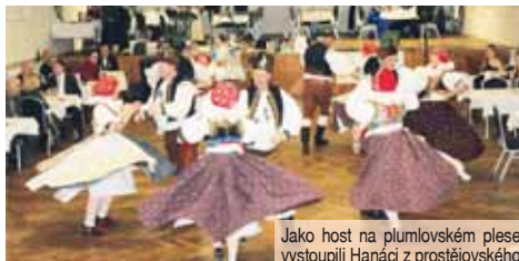
Jako host na plumlovském plesu vystoupili Hanáci z prostějovského souboru Mánes, jehož členky roztáčely sukne s opravdu velkým elánem.

chodily činit ven, a to jen proto, aby se aspoň trochu zchladily. Zámeckým plesem sezóna v kulturníku v Žárovicích rozhodně nekončí. Už nadcházející sobotu 9. března se zde bude konat oblíbený Maškarní ples Plumlovských nadšenců s kapelou Tamdem. (mls)