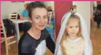
Rodiče své ratolety na karneval v Držovicích pečlivě připravili...

DRŽOVICE Předminulou nedělí si prostory Obecního domu v Držovicích vyhradil místní spolek Floriánek, jehož hlavní náplní je starost o děti a jejich volný čas. V pořadí již druhý dětský karneval pod taktovkou Floriánku přilákal davy dětí a jejich rodičů. Drobotina se bavila v maskách a převlecích.