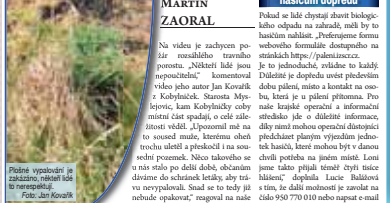
Ploušné vypalování trávy je zakázáno, lidé jsou nepoučitelní.

KOBYLNÍČKY Hradní tři zakony zakazují ploušné vypalování. Jedná se o zákony o požární ochraně, ochrání přírody a krajiny a také o spásnosti. Vzhledy i oběi ročníky na zářivě a nebezpečně vypalování trávy. Ploušné vypalování trávy je zakázáno, lidé jsou nepoučitelní. V Kobylničkách vypaloval trávu. Ploušné vypalování trávy je zakázáno, lidé jsou nepoučitelní. V Kobylničkách vypaloval trávu. Ploušné vypalování trávy je zakázáno, lidé jsou nepoučitelní. V Kobylničkách vypaloval trávu.