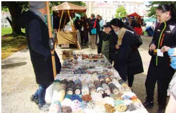
Sobotní Den Země na prostějovském náměstí se vydařil. Například o minerály byl velký zájem.

sběrem pylu. Velký zájem byl o stánek Okrašlovacího spolku města Prostějova, který jako obvykle nabídl vědomostní soutěž. „To je nejlepší stánek,“ zhodnotil jeden z malých soutěžících odměnu v podobě sladkosti. Plno bylo i u pódiá před budovou muzea. Vystoupil na něm zpěvák