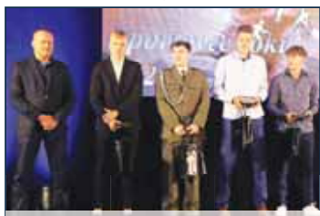
Jako Talenti roku byli oceněni hned čtyři nadějní mladíci.