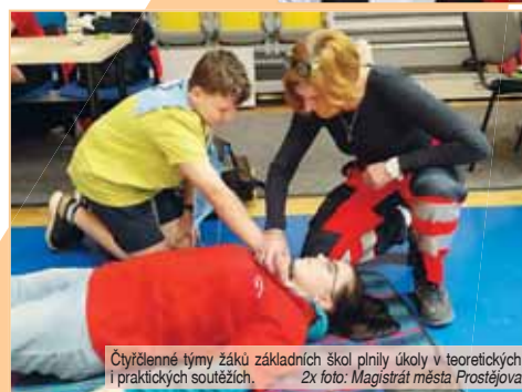
Čtyřlenné týmy žáků základních škol plnily úkoly v teoretických i praktických soutěžích.