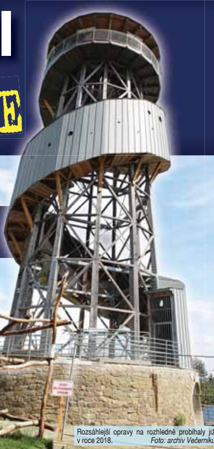
Rozsáhlejší opravy na rozhledně probíhaly již v roce 2018.

s oznamovatelem, který jim předmět ukázal a sdělil, že ho našel při výkopových pracích. Po ohledání předmětu si hlídka na místo vyžádala pyrotechnickou službu. Po příjezdu pyrotechnik uvedl, že se jedná o dělostřelecký granát PZGR 8,8 centimetru,“ uvedla Miluše Zajícová, tisková mluvčí Krajského ředitelství Policie ČR v Olomouci. Jak dodala, pyrotechnik municí na místě zabezpečil a převezl k odborné likvidaci. (mik)