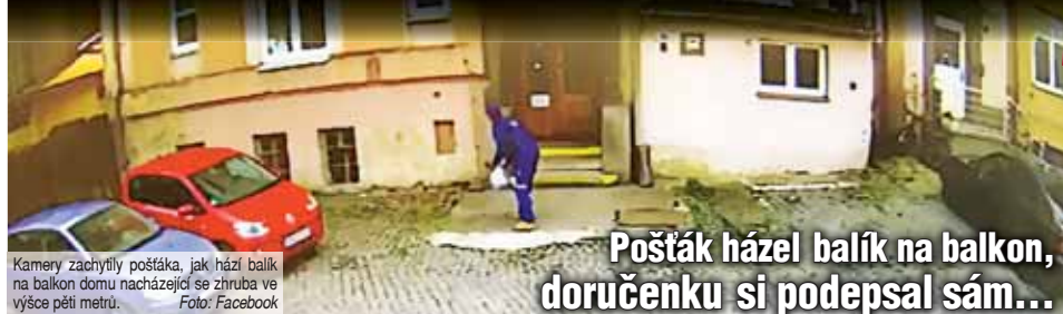
Kamery zachytily pošťáka, jak hází balík na balkon domu nacházející se zhruba ve výšce pěti metrů.