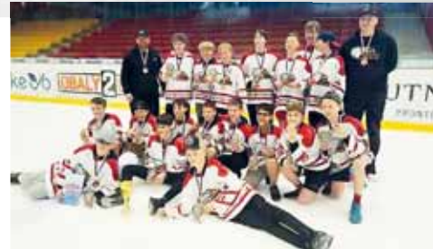
Společná fotografie domácího výběru, který obsadil bronzovou příčku.

„SIDA Cup má za sebou neuvěřitelně dlouhou tradici a jsem za ni opravdu rád. I jednotlivé kluby se sháňejí velmi snadno, protože se na turnaji chtějí objevit a vědí, že to tu dlouhodobě funguje. Za to patří největší dík panu Netušilovi, protože nám každým rokem vychází vstříc. Je hlavním sponzorem, bez kterého bychom nemohli tuto akci pořádat. Nejde však jen o tuto akci, ale i o podporu mládežnického hokeje, a ta je skutečně dlouhodobá.“