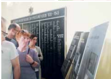
Velké pozornosti se těší i panely s historickými fakty.