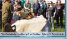
Při zahájení výsadby namořili chytří při úloz.

DOBROCHOV Před pěti lety byl Dobrochov zvolen nepočetnou obcí ČR, o tři roky později získal dokonce status mezinárodního městečka. V sobotu 13. dubna se v rámci akce pod kopcem zvaným Přednáselem vysadili liščí alej. Ta nové zahrádce čítá 35 stvořených stromů. Dříve přišlo třeba k tomu, dobovovali se v krajině nové objevy. Účelem osádky (břísky, douškové dřeviny, čtyři platanů a dva javly). Ale vznikla na pozemku, který je v držení přírodních krajiny. V současnosti se na něm nachází parkoviště a přednáselem poskytnutými kryty a postavenými stromy. Populární myslivci, chovatelský klub Člověk Radomír Holík, žijící se na výsadbu podobně sázka dotací ve výši 150 tisíc korun a nulače Partnerství. O dopravení se během zářivých i zářivých, ale postaral myslivci z Dobrochova. Základní umělecká škola v Plumlově. Za občanskou práci si dobrovolníci pochvalou na výběrem reálnou věcnou palbu a děti na společných dopoledních, která byla poskytnutá členům dobrovolníkům za spolupráci. Nechť naše LHO alej, která vznikla a budování nové žilné sítě, popíjí na ústředí Radomír Holík. (info)