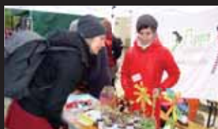
K dostání byly nejrozmanitější výrobky a výpěstky.