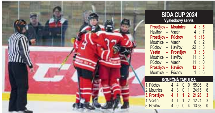
Domácí hokejisté se i letos radovali z řady branek.

ale bývalo celků i osm, což v dnešní době už nepřichází v úvahu. „Největší problém je s ubytováním týmu, když se jedná o dvoudenní akci. Většinou týmů nám pravidelně pokrývá HOTEL TENNIS CLUB, v němž je nyní omezení. Jediným týmem tam byl slovenský Púchov. Vsetín bydlel v Penzionu U Chmelů a další dva celky musely dojíždět. My bychom se rádi vrátili k variantě osmi celků a rozdělili mužstva třeba na dvě skupiny, ale v tomto narážíme na určité mantinely“, zakončil sekretář klubu. I tak se letošní ročník dá hodnotit pozitivně a jako úspěšný. Na příští rok je už navíc opět domluveno pokračování, starší žáci se proto opět dočkají nejstaršího mládežnického turnaje na prostějovském zimním stadionu.