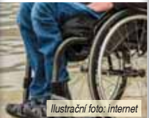
Ilustrační foto: internet

Vozíkář se převrátil, strážník mu pomohl