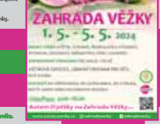
Soutěž o vstupenky na jarní věžky.

Zájemců o vstupenky na jarní věžky. Soutěž o vstupenky na jarní věžky. Zájemců o vstupenky na jarní věžky. Soutěž o vstupenky na jarní věžky. Zájemců o vstupenky na jarní věžky.