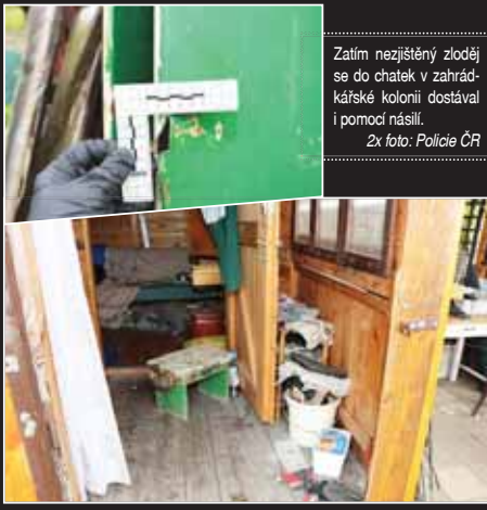
Zatím nezjištěný zloděj se do chatek v zahrádkářské kolonii dostával i pomocí násilí.

V kolonii bral všechno, co mu přišlo pod ruku