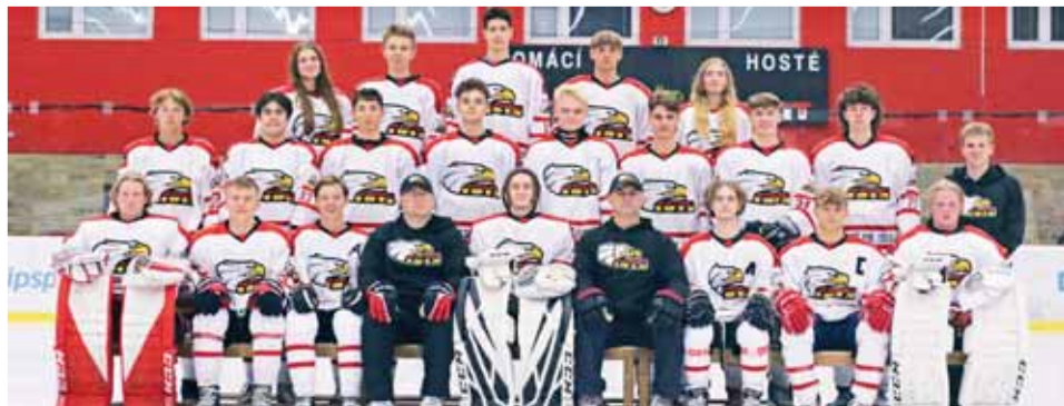
Společná fotografie juniorů SK Prostějov 1913.