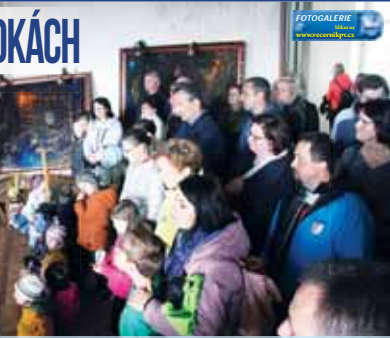
O pohádkové prohlídce plumlovského zámku byl mezi lety enormní zájem.

FOTOREPORTÁŽ Plumlov. Dokud se budou rodit děti, tak se toto jen tak nezmění. Přesněže se pohádkové prohlídky na zámku v Plumlově pořádají už spoustu let, stále se jedná o jedno z vůbec neoblíbenějších akcí pořádaných na zdejším národní kulturní památce. Letošní premiéru zazdí v sobotu 20. a v neděli 21. dubna, kdy samozřejmě nechybí ani množství dětí i dospělých. Všichni se již tradičně dočkají trojice pohádek.