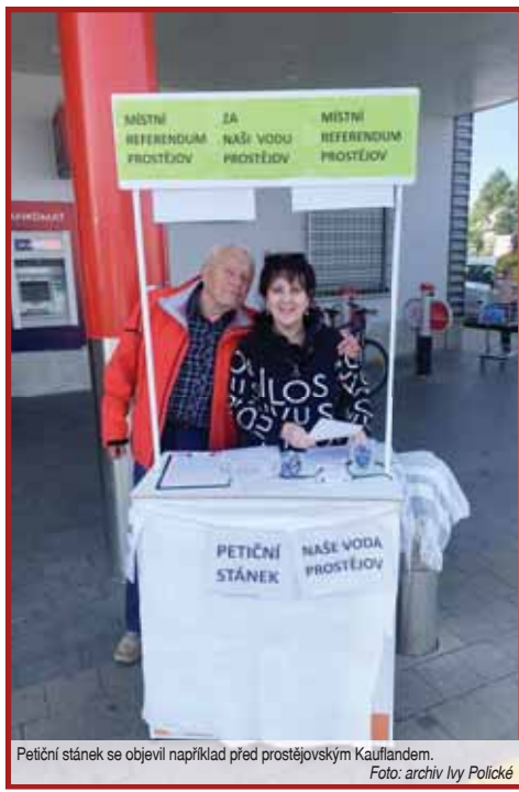
Petiční stánek se objevil například před prostějovským Kauflandem.

Po převzetí bude mít město větší možnost kontroly cen vodného a stočného, na druhou stranu to pro něj bude představovat výraznou administrativní, personální i technickou zátěž. Dosud radnice prostřednictvím společnosti VaK Prostějov vybírala od distributorů nájem. Od roku 2006 takto připlula na konto města přibližně suma 1,4 miliardy korun. Prakticky stejná částka však z města putovala na opravy a investice vodárenské sítě. K tomu VaK využil i dotace přesahující 150 milionů korun. Podle Sklenky nelze zcela zaručit, že po převodu infrastruktury do majetku města se vodné a stočné již nebude zdražovat. „Nyní v Prostějově platíme za vodu v rámci ČR průměrnou cenu. Její cena se přitom odvíjí od mnoha faktorů. Jsou města jako třeba Pardubice, kde si infrastrukturu provozují sami, přesto platí více jako my," upozornil Miloš Sklenka.