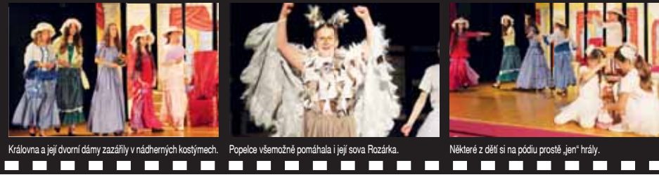
Královna a její dvorní dámy zazářily v nádherných kostýmech.