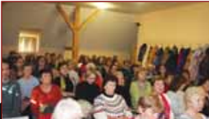
Podkrovní sál prostějovské knihovny se zaplnil doslova do posledního místečka.

často nezájemně přináší lidem ve svém okolí jen samé utrpení. Autorka však měla k takové charakteristice na první pohled daleko a své početné publikum nejenže nesoužila, ale naopak dosti úspěšně bavila. Využila přitom své přípravy z vystupování před lidmi, když se podstatnou část svého života živila jako učitelka. „Už