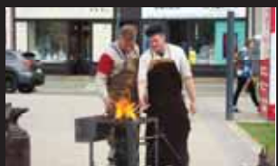
Mistři cechu kovářského se tentokrát věnovali exhibici.