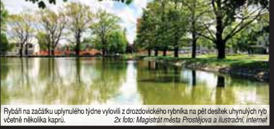
Rybáři na začátku uplynulého týdne vylovili z drozdovického rybníka na pět desítek uhynulých ryb včetně několika kaprů.

PROSTĚJOV Zatímco běžní smrtelníci chodili začátkem minulého týdne okolo drozdovického rybníka poněkud znepokojeni, profesionální rybáři zůstávali v klidu. Uhyn více než pět desítek ryb ze klidu nevyvedl. Prý je to normální ve chvíli, kdy se najednou rychle oteplí. Dvaapadesát uhynulých ryb včetně několika kaprů řešilo minulý týden několik úředníků