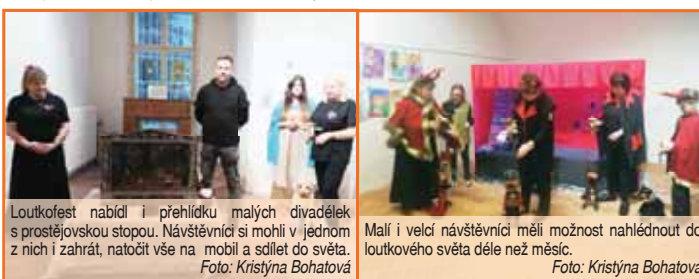
Loutkofest nabídl i přehlídku malých divadelček s prostějovskou stopou. Návštěvníci si mohli v jednom z nich zahrát, natočit vše na mobil a sdílet do světa.