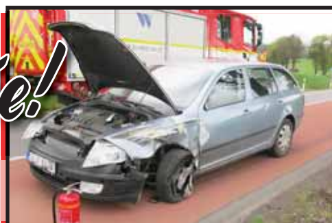
Zatímco škodovka řízená šedesátiletou ženou utrpěla jen škody na karoserii, Ford Mondeo skoněilo na střeše a jeho šofer zraněný v nemocnici.

VÝŠOVICE Každý ví, o jak nebezpečný úsek se jedná. Ostrá zatáčka na silnici mezi Výšovicemi a Němčicemi nad Hanou byla v minulosti častokrát místem závažných nehod. Toho si ale zřejmě nebyla vědoma šedesátiletá řidička škodovky, která do prudké „zákruty“ vjela jako závodník. Zavinila srážku s protijedoucím vozidlem, které nakonec skoněilo na střeše.