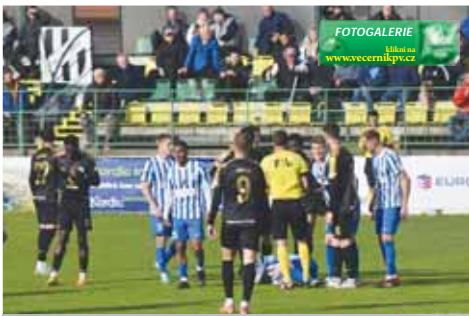
Fotbalisté Prostějova nevyužili dlouhou výhodu a s Vyškovem padli.

První zajímavější situace přišla v podání domácích, kdy zahrávali nadvicový signál a Bartolomeu našel lobem Jaroň, jeho střelený pokus ale proletěl bez teče malým vápnem. Další situací pak ve 12. minutě zapasli hosté. Po rohovém kopu Prostějova se totiž do úniku dostal po přihrávce Enemeho Fomba ale s jeho zakončením si dokázal poradit Mucha. V krátkém časovém sledu po necelé půlhodině měl na hlavě během minuty dvě branky Matoušek. U první dokázal skvěle umístit míč po centru Koudelky, ale brankář Borek vytáhl skvělý zákrok. Z následného rohu se pak objevil sám na zadní tyči, ale míč s přispěním brankáře i tyče skončil opět mimo kyžený prostor. Na dvě velké šance