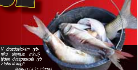
V drozdovickém rybníku uhynulo minulý týden dvaapadesát ryb, z toho tři kapři.

PROSTĚJOV K nečekané události došlo v minulých dnech na městském rybníku v Drozdovicích. Občané Prostějova upozorňovali na sociálních sítích na skutečnost, že na vodní hladině plavou desítky mrtvých ryb. Situaci záhy prověřovali radniční úředníci, strážníci městské policie i sama náměstkyň primátora!