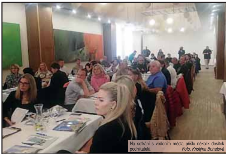
Na setkání s vedením města přišlo několik desítek podnikatelů.