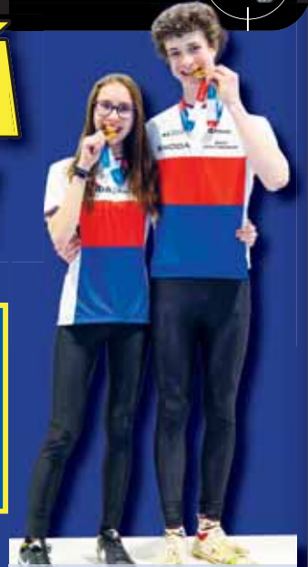
Společná fotografie s vítězem závodu juniorů.