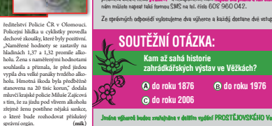
Opilá seniorka havarovala na elektrokole. Napálila to do značky!

VRANOVICKE KĚLČE V přechodu Křižovatky v obci Vranovice havarovala opilá seniorka na elektrokole. Havarovala na elektrokole. Napálila to do značky! Vranovicke Kelce. V přechodu Křižovatky v obci Vranovice havarovala opilá seniorka na elektrokole. Havarovala na elektrokole. Napálila to do značky!