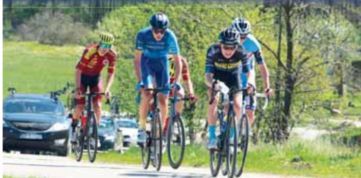
Prostějovský cyklista v čele jednoho z úniků na RBB Tour 2024 v jižních Čechách.