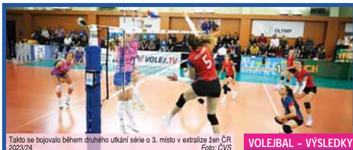
Takto se bojovalo během druhého utkání série o 3. místo v extralize žen ČR 2023/24.

PRAHA Druhé střetnutí o třetí místo v tomto extraligovém ročníku ženské kategorie nebylo pro slabší povahy. Trvalo dvě a půl hodiny, přineslo ohromné vyrovnaný boj a dospělo až k nesmírně dramatickému rozuzlení. Olymp Praha v úplném závěru těsně podlehl volejbalistkám VK Prostějov, jež tak vyhrály celou sérii 2:0 na zápasy. A po bolestném vyřazení v semifinále si zasloužily medailovou útechu.