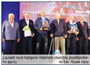
Laureáti nové kategorie Historické okamžiky prostějovského sportu.