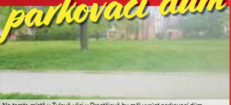
Na tomto místě v Tylové ulici v Prostějově by měl vyrůst parkovací dům.

PROSTĚJOV Nedostatek parkovacích míst trápí všechna prostějovská sídliště. Majitelé aut svádějí den co den bitvu o možnou odstavit svého plechového pomocníka co nejbližší domovním dveřím. V Tylové ulici jim vyroste řešení, které alespoň částečně problém vyřeší. Společnost Garážové domy s.r.o. požádala město o odkup pozemků v Tylové ulici. V sousedství bývalé mateřinky chce postavit parkovací dům.