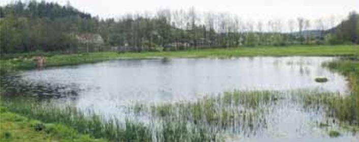
Loni využívání nové vodní nádrže u Čertových rybníků bránil nedostatek vody, letos je jí už dostatek.