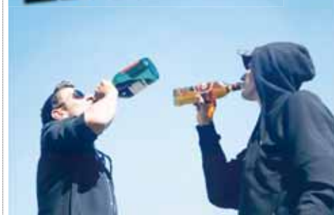
Skupinka mužů nejenže popíjí alkohol na veřejnosti ve velkém, ale zároveň tropí nepřístojnosti v okolí autobusového nádraží.

PROSTĚJOV Už to bude pár týdnů, co si lidé procházející po chodníku okolo bývalého Agrostroje ve Vrahovické ulici a také v okolí autobusového nádraží začali poprvé stěžovat na skupinku šesti až osmi mladých mužů. Ti každý den od odpoledních hodin až do pozdního večera okupují jednu z laviček, pořádají zde doslova alkoholové dýchánky a obtěžují kolemjdoucí chodce. Co s tím? Hlaste to policii!