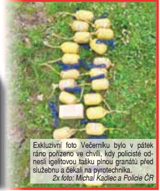
Exkluzivní foto Večerníku bylo v pátek ráno pořízeno ve chvíli, kdy policisté odnesli igelitovou tašku plnou granátů před služebnu a čekali na pyrotechnika.

původní zpravodajství pro Večerník Michal KADLEC