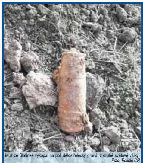
Muž ze Slatinek vykopal na poli dělostřelecký granát z druhé světové války.

SLATINKY Velice správně se zachoval muž, který při výkopových pracích na svém pozemku našel válečnou municí. Zavolał ihned na linku 158. Přivolani policisté si záhy vyžádali příjezd pyrotechnika. Ten pak dělostřelecký granát odvezl k odborné likvidaci.