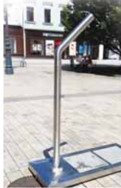
Vloni se mlžítka během parného léta na prostějovském náměstí osvědčila.

kde si lidé mlžítka velmi pochvalovali. Jak dodala, záměr město projednalo a odsouhlasilo jak s památkáři, tak s hygieniky. Zařízení je podle reakcí obyvatel velmi oblíbené a využívané. „Proto jsme přistoupili k nákupu mlžící brány. Ta by měla být instalována do zahájení letní sezóny, pravděpodobně v průběhu května 2024," uvedla pro Večerník Sokolová. Mlžící bránu není možné pořídit jako hotový výrobek, je nutné ji nechat vyrobit na zakázku. „Dodavatel, který ji rovněž instaluje, vyčísil náklady na 295 135 korun," informoval Večerník náměstek primátora Jiří Pospíšil, podle kterého jsou finanční prostředky na akci zajištěny v rozpočtu města. (kib)