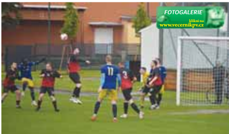
Klenovice dokázaly zvládnout důležité derby a drží se na špičce tabulky.