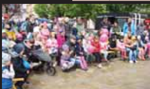
Loutkové divadlo přitáhlo malé i velké návštěvníky.