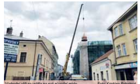
Východní věž se vrací na své původní místo.