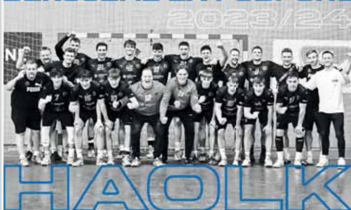
Házenkářská akademie Olomouckého kraje má za sebou další velice dobrou sezónu.