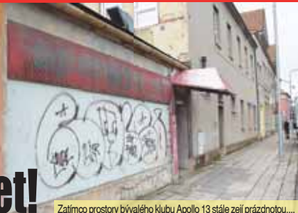
Zatímco prostory bývalého klubu Apollo 13 stále zejí prázdnotou,...