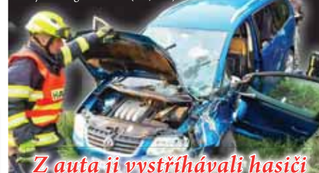
Dvašedesátiletá řidička v tomto autě zřejmě při řízení usnula a poté havarovala.

BOHUSLAVICE K vážné dopravní nehodě došlo v sobotu večer na silnici mezi Bohuslavicemi a Laškovem. Řidička osobního automobilu značky Volkswagen skončila s autem v příkopu. „Vyprostili jsme řidičku za pomoci hydraulických nůžek z vozu, předali ji do péče zdravotnické záchranné služby a následně pomohli s transportem,“ uvedl Josef Koláček z Hasičského záchranného sboru Olomouckého kraje. Konečně hasiči následně auto zajistili proti požáru. „Dvašedesátiletá řidička vozu Volkswagen Touran pravděpodobně při jízdě usnula, vyjela z komunikace a čelně narazila s autem do příkopu,“ popsal policejní mluvčí Libor Hejtmán s tím, že test na alkohol byl u ní negativní. (kib, mik)