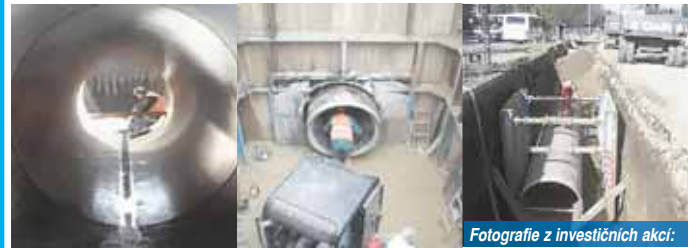
Fotografie z investičních akcí:

V JEDENÁCTÉM DÍLE HISTORIE VODÁRENSTVÍ MĚSTA PROSTĚJOVA BYLA PODÁNA INFORMACE O PROVOZNÍCH SOUBORECH ČISTÍRNY ODPADNÍCH VOD /ČOV/ V PROSTĚJOVĚ V KRALICKÉM HÁJI.