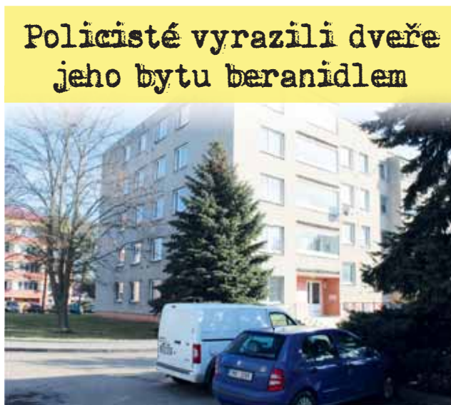
Skokem ze čtvrtého patra jednoho z domů na Sídlišti Svornosti ve Vrahovicích chtěl ukončit muž svůj život. Policisté ho zachránili razantní akcí.

Nájemkyně sousedního bytu pustila jednoho z policistů na balkon svého bytu, aby mohl lépe monitorovat pohyb muže, informovat o dění v bytě ostatní policisty a případně s ním navázat rozhovor. „Další hlídka mezitím přivolala příslušníky hasičského záchranného sboru, aby pod oknem nafoukli dopadovou plochu pro případ, že by se oznamovatel skutečně rozhodl skočit a ublížit si. Další hlídka se přes dveře snažila s mužem navázat krizovou komunikaci, kterou telefonicky konzultovala s policejním vyjednávačem, jenž byl také na místě události povolán. Oznamovatel ale neodpovídal a ani jím způsobem nereagoval. Po nějaké chvíli se přestal objevovat