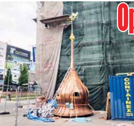
Začátkem května dorazila repasovaná východní věž.

zhruba dva měsíce. Magistrát předpokládá, že hotovo by mělo být do září letošního roku. „Náklady jsou odhadnuty na částku zhruba 726 tisíc korun. Tyto finanční prostředky jsou v rozpočtu města na rok 2024 vyčleněny,“ dodal Rozehnal. (kib)