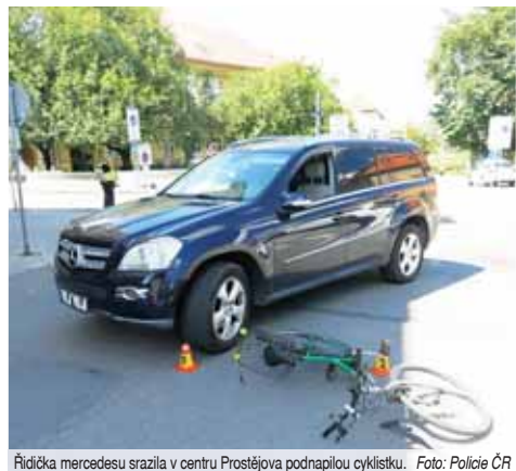
Řidička mercedesu srazila v centru Prostějova podnapilou cyklistku.

„Ve středu 15. května krátce před polednem řídila osmatřicetiletá žena osobní vozidlo po Pernštýnském ná-