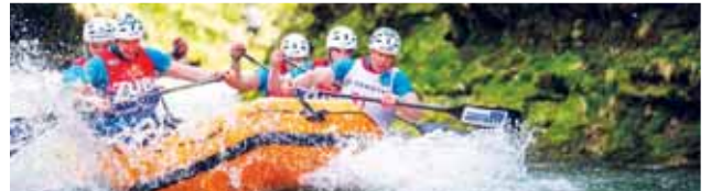
Prostějovská posádka mládežníků TR HRMOM vylavila v nádherné řece Salze dva triumfy.