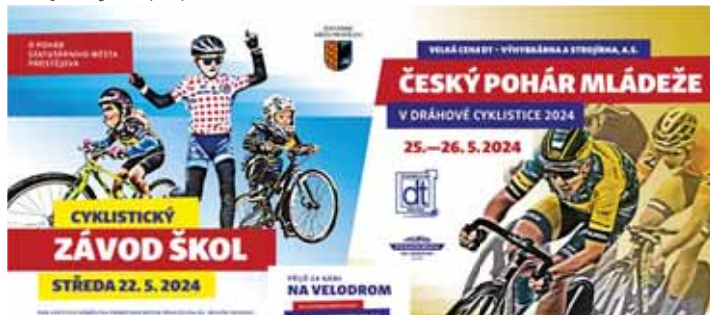
V tomto týdnu bude Prostějov hostit středěcí Závod škol a víkendový ČP na dráze.