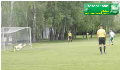
Ani chycená penalta Olšanům k bodům nepomohla.

filmovaný. Ve 33. minutě už se jí ale hosté dočkali, nedovoleně byl zastaven Novák. Míč si postavil Gábor, ale jen potvrdil, že střelecká forma aktuálně nepanuje a znovu se vyťal Bokůvka. Fotbalová poučka „nedás – dostaneš“ se pak potvrdila, když centrovaný míč našel domácí Samek a překonal hlavou brankáře – 2:0. Do kabin se mělo jít za velmi příznivého stavu pro domácí, jenže chyba v samém závěru na středu znamenala, že hosté dokázali snížit, protože se Gábor konečně branky dočkal – 2:1.