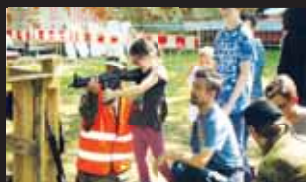
Možnost zastřílet si z airsoftové pušky využila i děvčata.