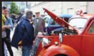
Fiat 1100 ALR z roku 1938 byl vyroben pro potřeby nemocnic.