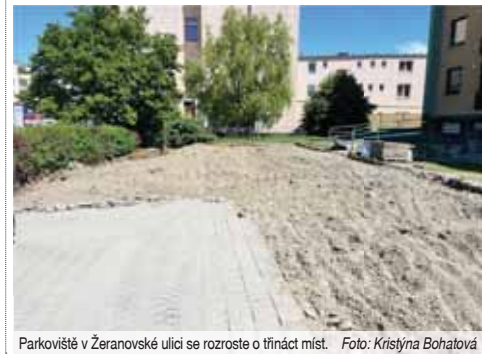
Parkoviště v Žeranovské ulici se rozroste o třináct míst.

Rekonstrukce vyjde městskou kasu na 7,2 milionu korun bez DPH, dokončena by měla být v červenci letošního roku. (kib)