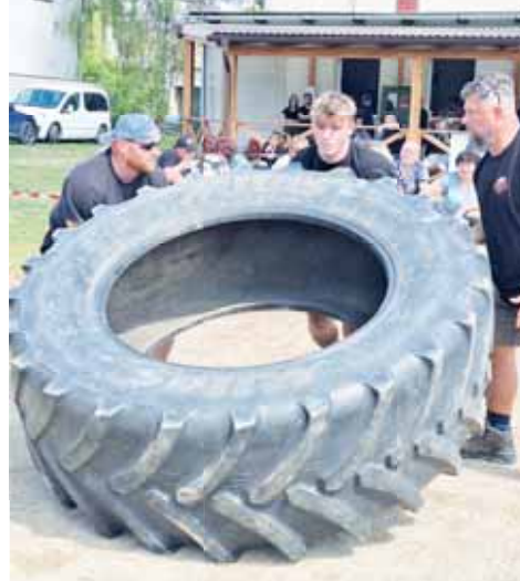
Dvousetkilogramová pneumatika byla pro juniory těžkým soupeřem.