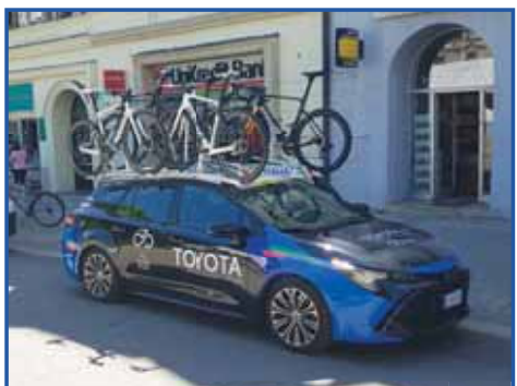
Týmový automobil favorizovaných cyklistů Itálie na prostějovském náměstí TGM.