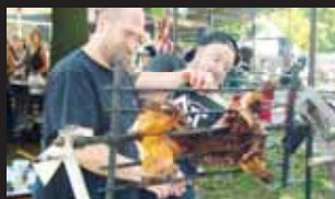
Jídla byla spousta, ovšem prasátko bylo neprekonatelné.