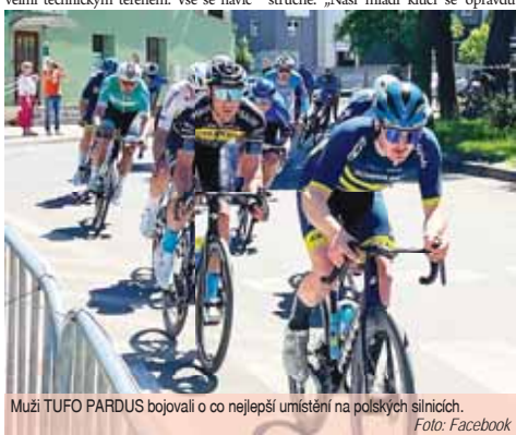
Muži TUFO PARDUS bojovali o co nejlepší umístění na polských silnicích.