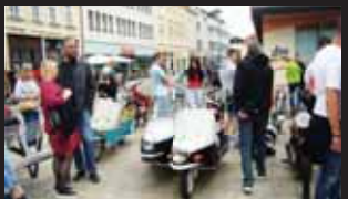
K vidění byly i skútry Čezeta či s postranním vozíkem Druzeta.