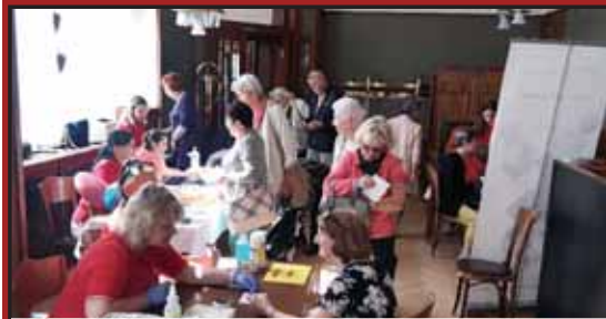
Jarní dny zdraví přitáhly do Národního domu davu zájemců o různá vyšetření.