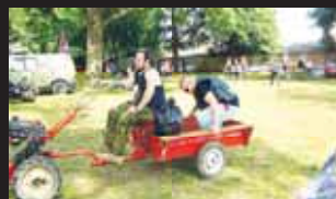
Scénka jako z filmu Slavnosti sněženek...