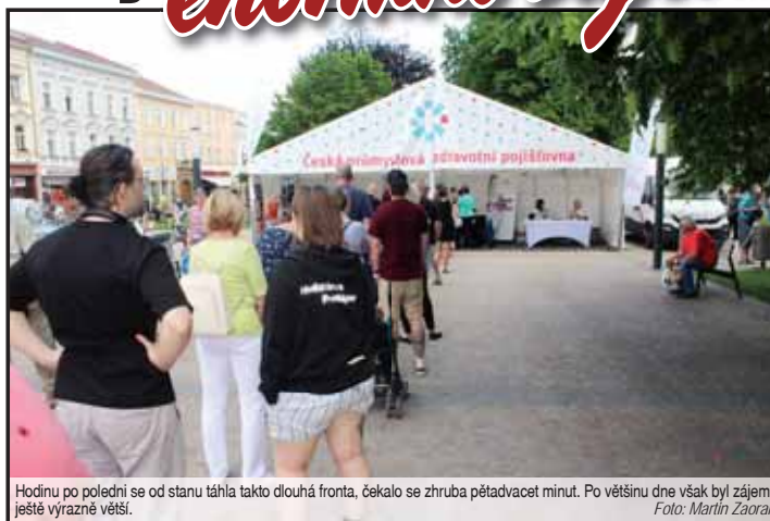
Hodinu po poledni se od stanu táhla takto dlouhá fronta, čekalo se zhruba pětadvacet minut. Po většinu dne však byl zájem ještě výrazně větší.