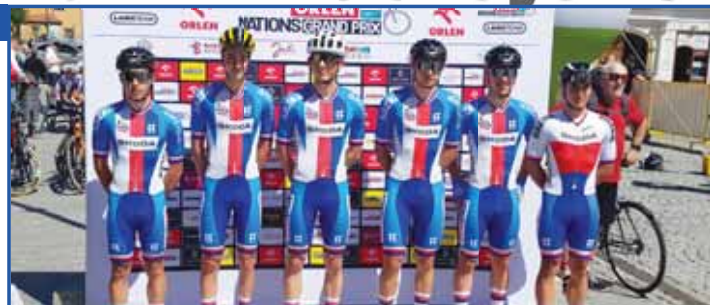
Družstvo České republiky při slavnostním nástupu ORLEN Nations Grand Prix 2024.