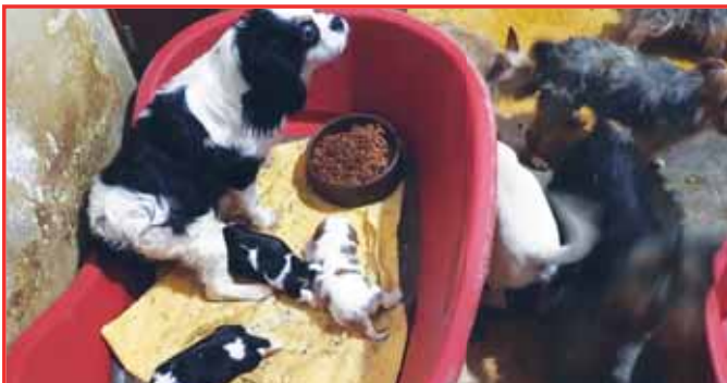
Téměř sto psů žilo v otřesných podmínkách a pouze na pár metrech čtverečných. Jejich majitelky zajímala pouze štěňata, která okamžitě prodávaly v Praze.

ČECHY POD KOSÍREM Tak už se to rozjelo na plné obrátky. PROSTĚJOVSKÝ Večerník jako první médium v republice informoval o obří psí množírně, z níž celkem 29 totálně zbídačených psů putovalo do útulku Voříšek v Čechách pod Kosířem. V průběhu uplynulého týdne policie konečně uvolnila první informace, které byly okamžitě zveřejněny v celostátních médiích. Ty pouze potvrzují to, co jsme již psali: případ podobných rozměrů u nás nemá obdoby. Téměř sto zbídačených psů žilo na pár metrech čtverečných, jejich majitelky zajímala pouze