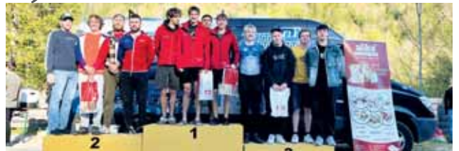
Muži TR ZUBR Prostějov získali na Tomi-Remont Cupu 2024 v Rakousku zlato i stříbro.