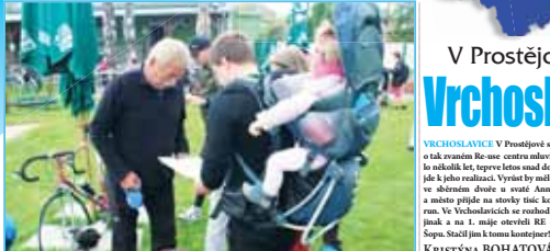
Na trase vandru byli i sobotní vydozba během Smržického vandru 720 příležeňářů účastníků nejvyššího věku.