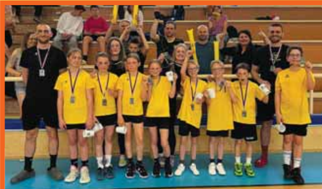
Korfbaloví minižáci Vosime.cz Prostějov obsadili doma v Lize ČR U11 výborné druhé místo.