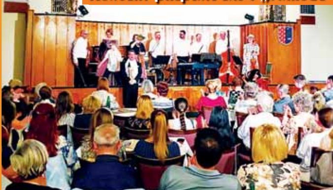
Přednáškový sál Národního domu skutečně praskal ve švech.