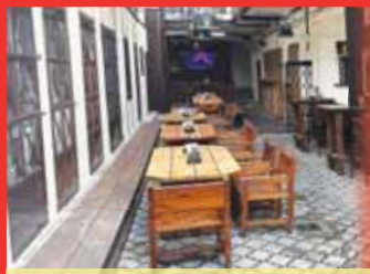
...klub 27 Music Bar pravidelně láká na prostějovské skupiny.

PROSTĚJOV Byla to opravdová škoda. Po čtrnácti letech v roce 2017 skončila jedna era prostějovské kultury. Hudební klub Apollo 13, který dlouhá léta nabízel perfektní zážemí pro začínající prostějovské hudebníky, zároveň v něm vystupovaly nejkvalitnější české kapely, definitivně skončil. Pňhodnotnou náhradu za něj se dosud ve městě rozjet nepodařilo, navíc prostor v Barákové ulici stále zejí prázdnotou. Prostějovské kapely však našťastí mají kde hrát!