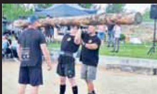
Zvednout 90 kilo vážící kmen nad hlavu není legrace.