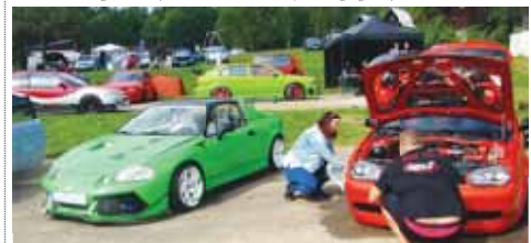
Svým svěřencům věnují tuningáři spoustu péče. V Plumlově byla o víkend radost pohledět!