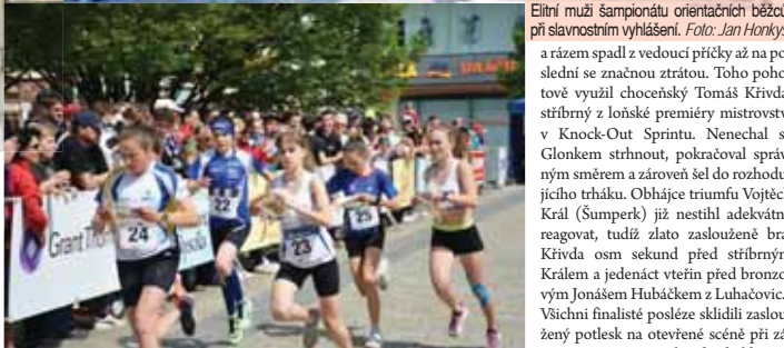
Šestice nejlepších žen vyrazí do boje o medaile z MČR v KO Sprintu.