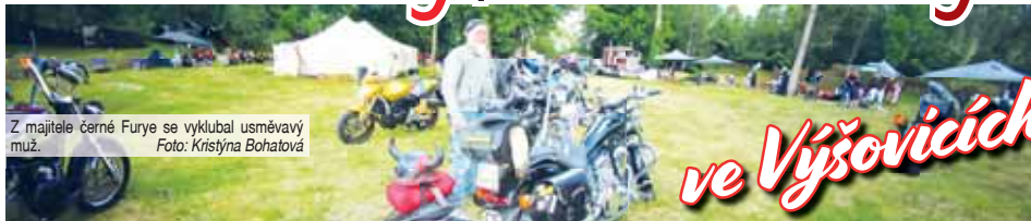
Z majitele černé Furry se vyklubal usměvavý muž.