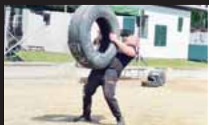
Pneumatiku vážící 70 kilo museli závodníci přehazovat.