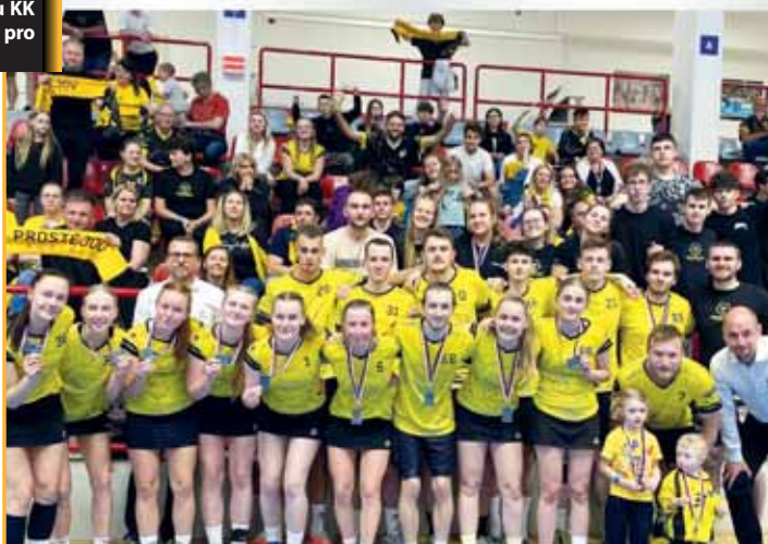
Stříbrní korfbalisté Vosíme.cz Prostějov se svými fanoušky po těsně prohraném finále extraligy s Brnem.