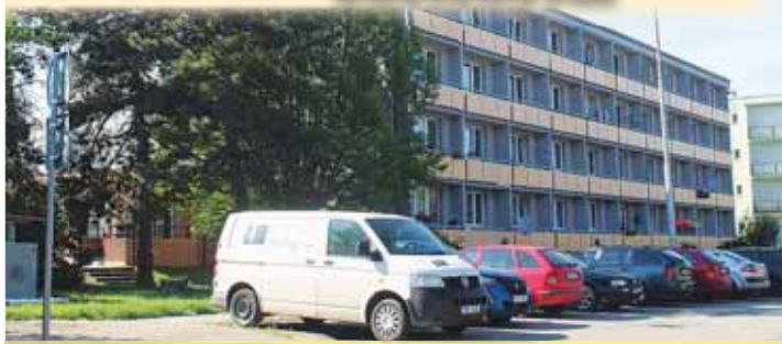
Městský dům v ulici Marie Pujmanové je častým terčem policejních výjezdů.