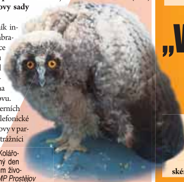
Toto mláďe sovy strážníci v Kolářových sadech odchytili a druhý den předali do péče ochráncům živočichů.

mláďe tohoto dravce odchytili a převezli na služebnu. Následující den byla sovička předána do záchrané stanice volně žijících živočichů v Němčičkách nad Hanou, sdělila Tereza Greplová z Městské policie Prostějov. (mik)