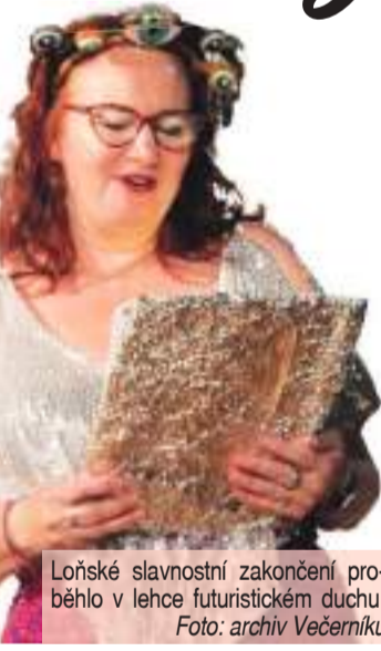
Loňské slavnostní zakončení proběhlo v lehce futuristickém duchu.