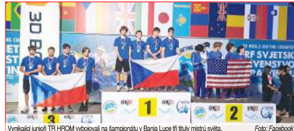
Vynikající junioři TR HROM vybojovali na šampionátu v Banja Luce tři tituly mistrů světa.

Hanáčkové muže nesrazil ani nevydařený slalom. „Tam měli smůlu, že je odnesl vodní válec na kritickém místě trati, což jim vzalo zhruba čtyři sekundy. Chlapi však potom ohromně zabojovali a například dokázali vyhrát disciplínu head to head, která se v Česku vůbec nejezdí. Zaslouží maximální pochvalu, stejně jako naši mladí kluci,“ zdůraznil Lisický. (son)