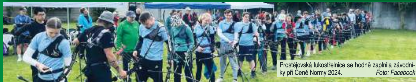
Prostějovská lukostřelnice se hodně zaplnila závodníky při Ceně Normy 2024.

PROSTĚJOV Aktuální sezóna Lukostřelby Prostějov – konkrétně její letní část pod otevřeným nebem – uhání vpřed raketovým tempem. Členové i členky úspěšného hanáckého oddílu z ní ukrojili celý květen, jenž obsahoval řadu akcí a soutěží jak tuzemských, tak mezinárodních.