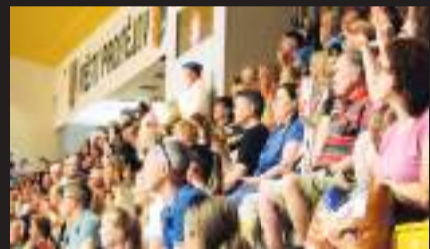
Diváci zaplnili takřka všechna místa na tribunách haly prostějovského DDM.