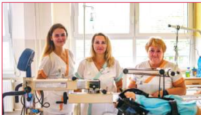
Hlavním úkolem prostějovské LDN je poskytování specializované zdravotní péče zaměřené především na doléčení po stadiu akutního vzplanutí choroby, dále na ošetrovatelskou a rehabilitační péči o osoby trpící chronickými, dlouhotrvajícími nemocemi.

Neodmyslitelnou součástí oddělení se stali i dobrovolníci, canisterapie nebo různá kulturní vystoupení, která pacientům zpestřují chvíle v nemocnici. „Neustále se snažíme pro své klienty vymýšlet různé akce. Kromě dvou pejsků, kteří dochází jednou za 14 dnů a pacienti se na ně těší, pravidelně máme kulturní vystoupení studentů a žáků ze škol nebo uměleckých kroužků. Písničky, básničky naše klienty potěší a často se k mladým lidem přidávají a zpívají s nimi,“ uzavřela vrchní sestra. (red)