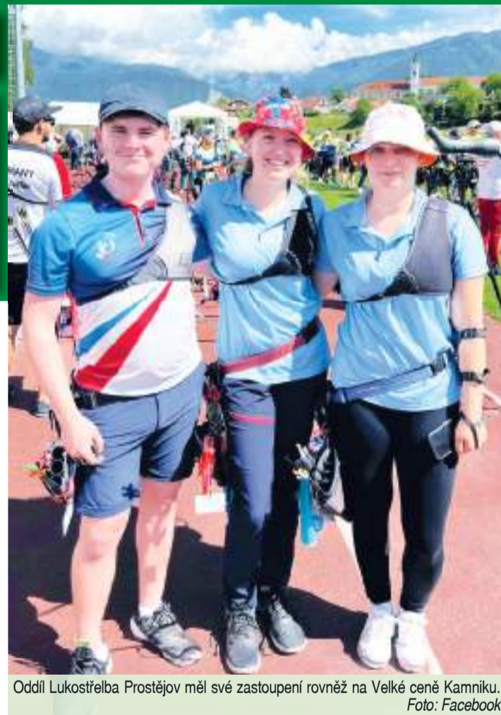
Oddíl Lukostřelba Prostějov měl své zastoupení rovněž na Velké ceně Kamniku.