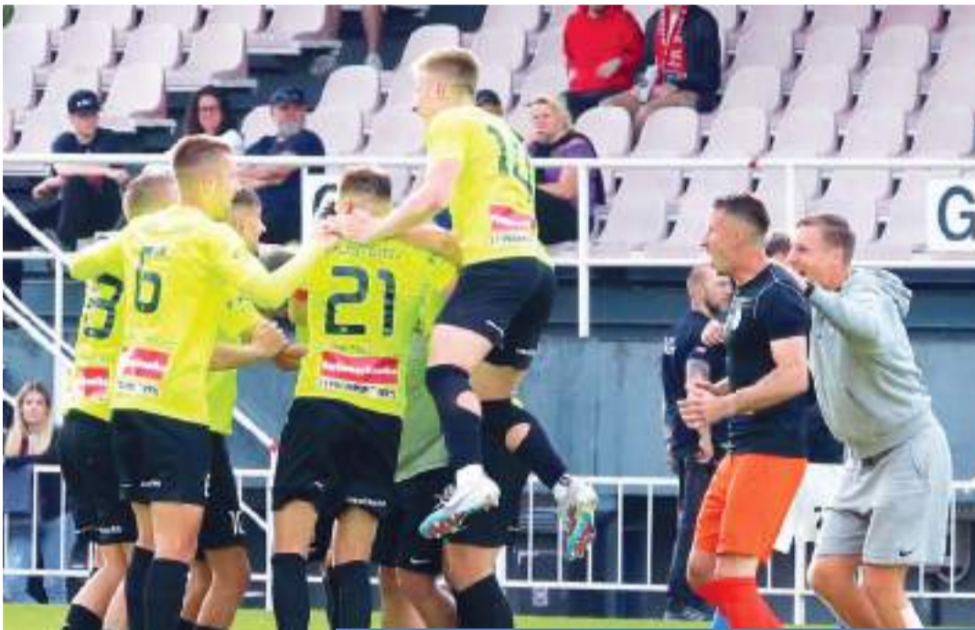
Fotbalisté Prostějova zvládli i letošní náročnou situaci.