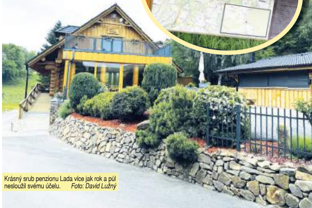
Krásný srub penzionu Lada více jak rok a půl nesloužil svému účelu.