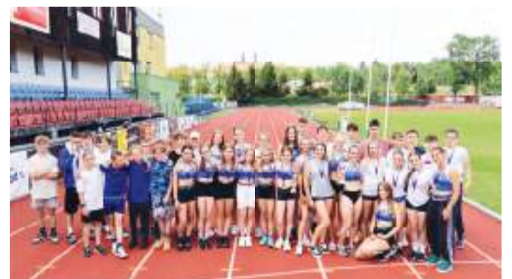
Atletické výběry ZŠ Jana Železného Prostějov uspěly v krajském finále Poháru rozhlasu.

Prostějovské starší žákyně teď čekají, zda postoupí na republikové finále atletického Poháru rozhlasu 2024. Tam pronikne šest nejlepších vítězů krajských finále, které doplní další dvě školy s nejvyššími bodovými zisky. (son)