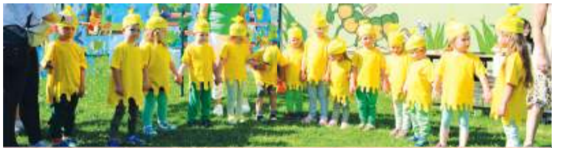
S programem vystoupily na slavnosti i nejmenší děti.