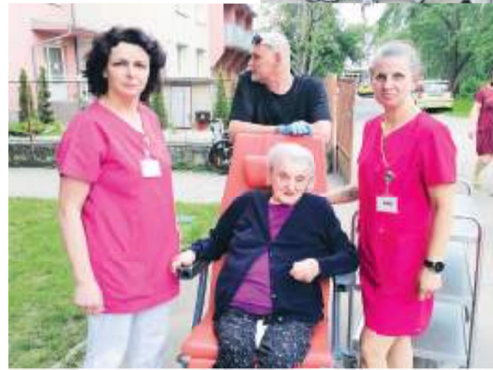
Pro seniory jsou podobné akce velkou událostí.

dlouhodobě věnuje interpretaci repertoáru Mistra Karla Gotta.