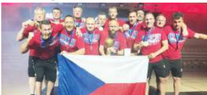
Házenkáři HKKH Haná přivezli z Masters Handball World Cupu 2024 titul mistrů světa.

„Na tomto šampionátu jsme v minulosti už získali jak dvě stříbra, tak jeden bronz, jen to zlato nám pořád