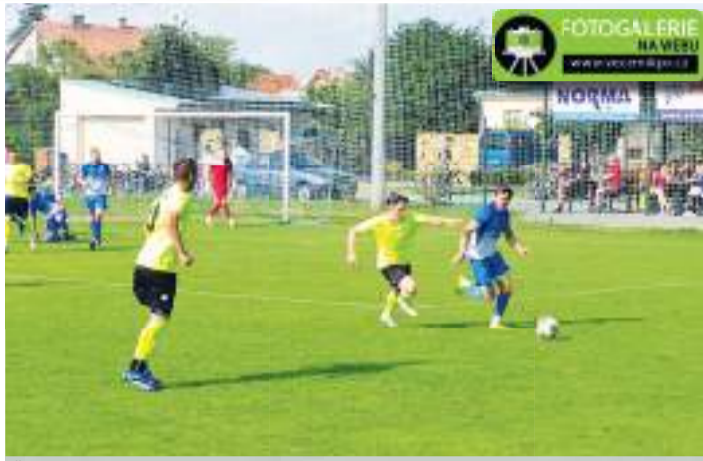
Čechovičtí fotbalisté porazili v derby konické (ve žlutých dresech) 3:0.

Po obrátce vzdychali četní hostující fanoušci zklamáním ještě dvakrát: nejprve ve 48. Šírůčkovo líznutí hlavou prošlo těsně vedle