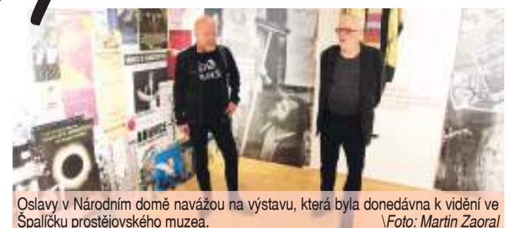
Oslavy v Národním domě naváží na výstavu, která byla donedávna k vidění ve Špalíčku prostějovského muzea.