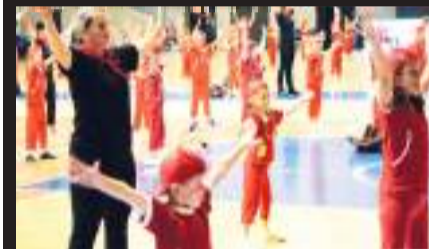
Nejpočetněji byla zastoupena skladba Mravenci, v níž vystoupilo 126 dětí.