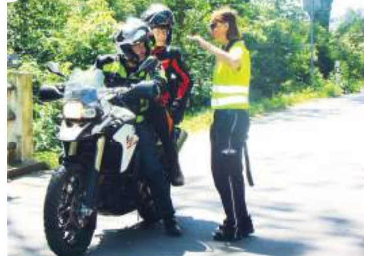
Tachometr si nechali od strážníků zkontrolovat i motorkáři.