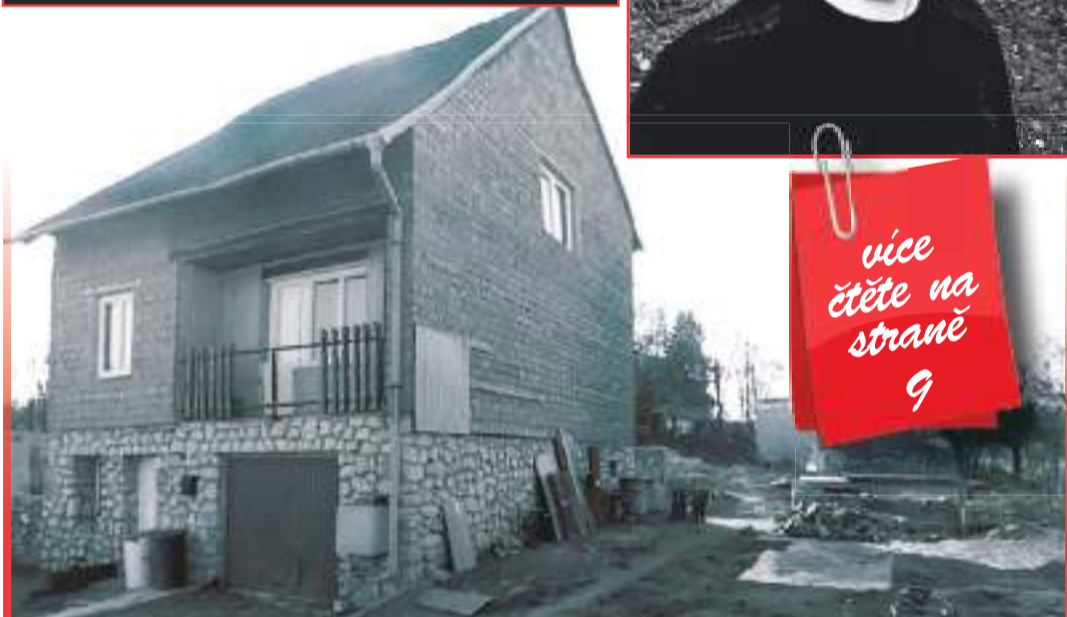
Josef J. měl vyskočit z okna tohoto rodinného domu stojícího u kostela v Brodku u Konice.