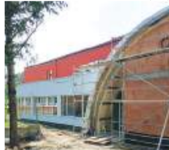
Stavba běžeckého tunelu bude dokončena s velkým předstihem.

Po dokončení tunelu bude následovat rekonstrukce atletického oválu, pro kterou počítá s investicí dalších 30 milionů korun. Půjde při ní také o rekonstrukci zpevněné plochy a výstavbu skladu sportovního nářadí. (kib)