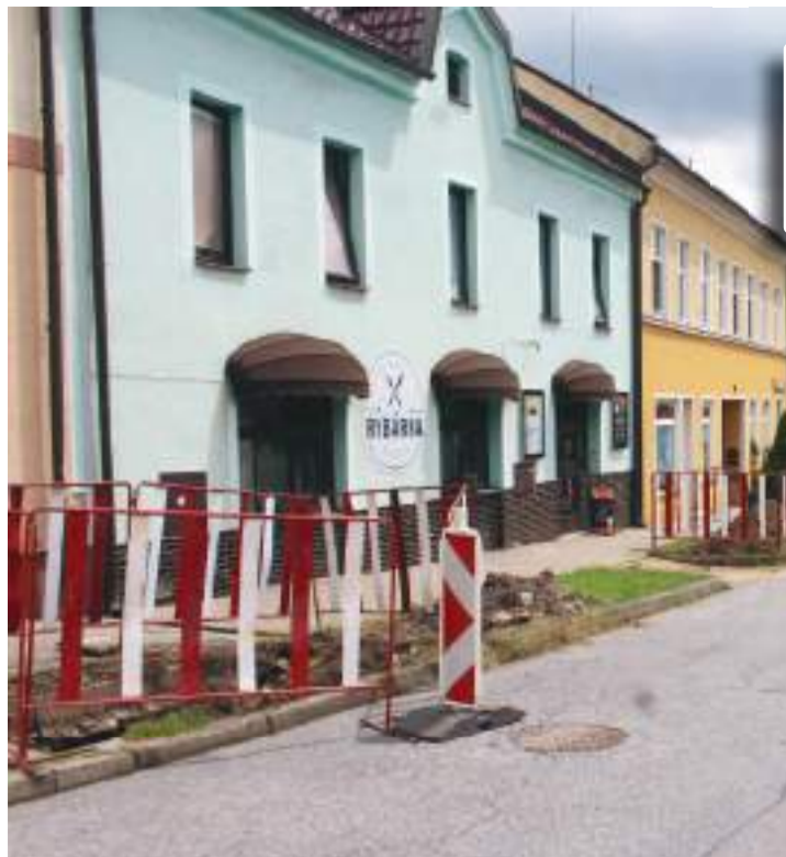
Tato silnice vedoucí přes konické náměstí bude zcela uzavřena, a to až do poloviny prosince.

Parkovat se bude jinde, místní obchodníci se obávají krachu