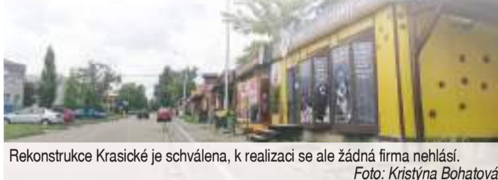
Rekonstrukce Krasické je schválena, k realizaci se ale žádná firma nehlásí.