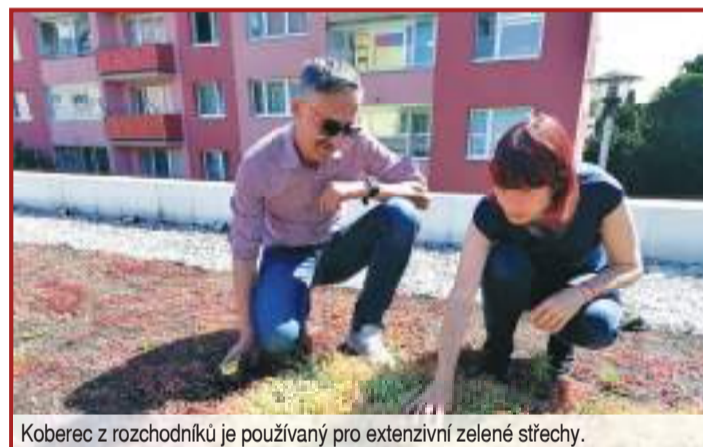
Koberec z rozchodníků je používán pro extenzivní zelené střechy.

střechou a fasádou v červnu 2023 v Prostějově otevřela. Na sídlišti Moravská v něm nabídla 44 parkovacích stání. V Tylově ulici chce postavit objekt se 49 místy k parkování. Odpůrci nové stavby poukazují na to, že střecha není zelená a rozhodně nenahradí pokácené stromy. Objekt jako takový navíc podle nich snižuje hodnotu nemovitosti, ubude zeleně pro děti, psy a relaxaci. „Důkazem našeho tvrzení je již veřejně známá nespokojenost obyvatel žijících