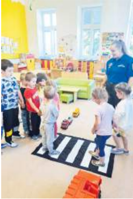
Ve společnosti strážníků městské policie se děti z prostějovských mateřinek dozvěděly spoustu užitečných věcí.

V závěru byla beseda zaměřena na dopravní předpisy. „Děti si vyzkoušely bezpečné přecházení silnice přes přechod pro chodce. Malým posluchačům jsme vysvětlili i to, co patří do povinné výbavy jízdního kola. Pro lepší zapamatování děti lepily reflexní samolepky dané barvy na obrázek jízdního kola na místa, kam patří odrazky,“ dodala Tereza Greplová s tím, že besed se zúčastnilo celkem 63 dětí. V červnu se se strážníky setkají ještě i děti z MŠ v ulicích Hanačka a Mánesova.