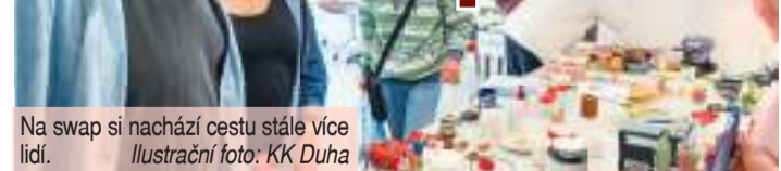
Na swap si nachází cestu stále více lidí.

PROSTĚJOV Přines a vyměň cokoli, co udělá radost tobě i druhému. Swapuj. Principem swapu je totiž smysluplná výměna, která prodlužuje životní cyklus předmětů a vrací je zpět do oběhu. A swapovalo se v neděli 2. června opět v prostějovské Duze.