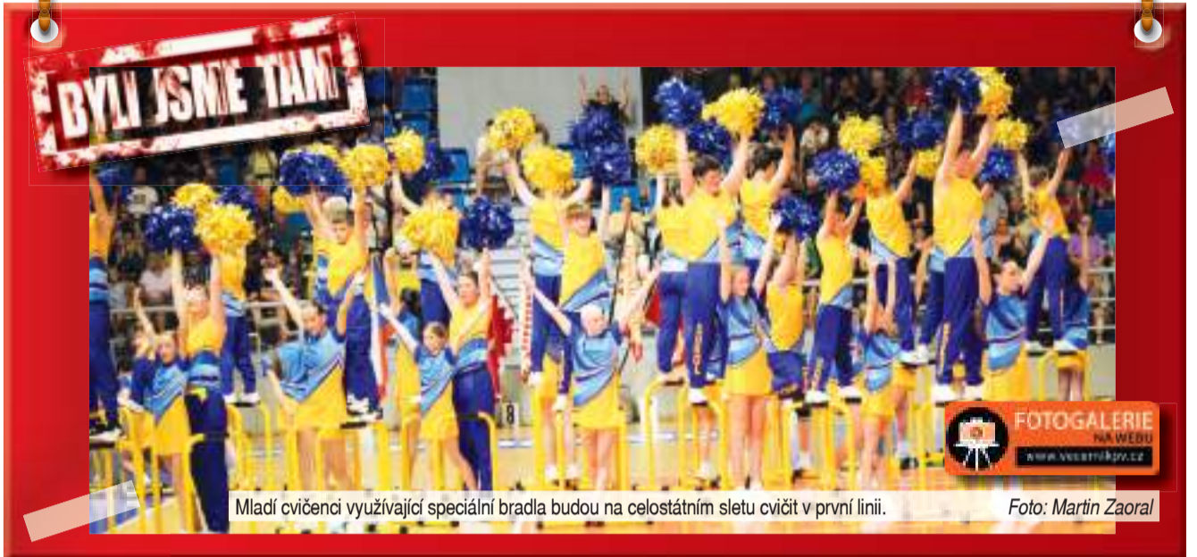
Mladí cvičenci využívající speciální bradla budou na celostátním sletu cvičit v první linii.