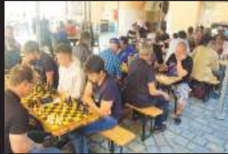
Dějištěm Chess Prostějov Open 2024 bylo nádvoří prostějovského zámku, kde se hrálo na 33 šachovnicích.