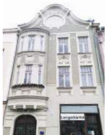
Dům na Žižkově náměstí v Prostějově zatím nového majitele nenašel.

V minulosti byla na hlavní budově provedena oprava střech, fasády, rozvodů plynoinstalace a elektroinstalace společných prostor. (kib)