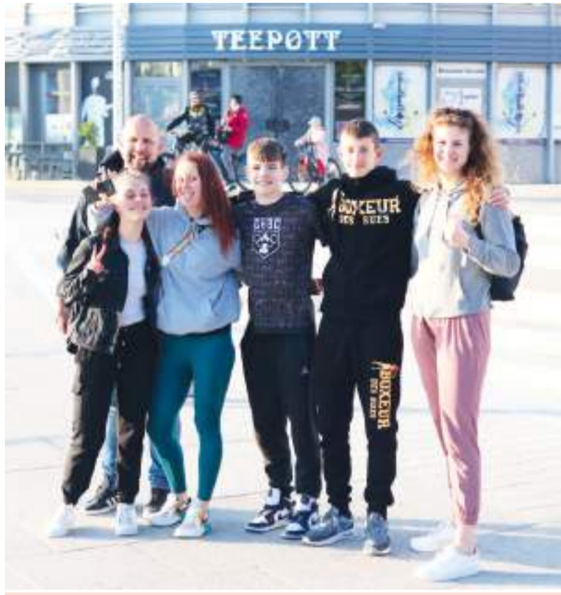
Výprava Our Hope Boxing Clubu Prostějov při pobytu v německém Rostocku.