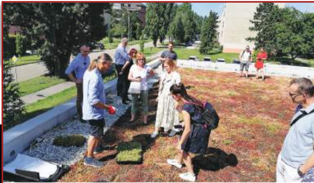
Den otevřených zelených střech mohli ve čtvrtce v Krasicích navštívit každý.