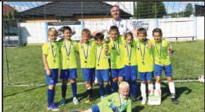
Vítězný tým vrahovického turnaje 1. SK Prostějov B.