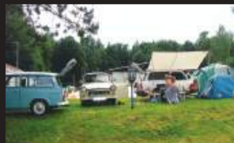
Trabantisté se stylově vrátili do osmdesátých let.