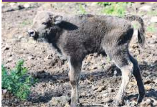
Největší velikáni ve svatokopecké zoo se radují ze dvou mláďat.

Svatokopecká zoo obnovila chov zubrů v roce 2013