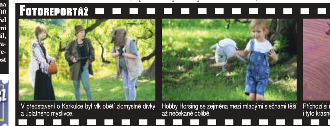
V představení o Karkulce byl vlk obětí zlomyslné divky a úplatného myslivce. Hobby Horsing se zejména mezi mladými slečnami těší a nečekaně oblíbené. Přichází si mohli v dílničce přímo v parku z drátků vyrobit i tyto krásné váčky.

EXKLUZIVNÍ reportáž pro Večerník Martin ZAORAL Začátek velkých letních prázdnin je hlavně pro školáky asi tím vůbec nejšťastnějším obdobím v celém životě. Pozoruhodné je, že tento radostný pocit už v dalším průběhu života překoná jen oprava máloco. Naplno, a přitom v naprostém poklidu si