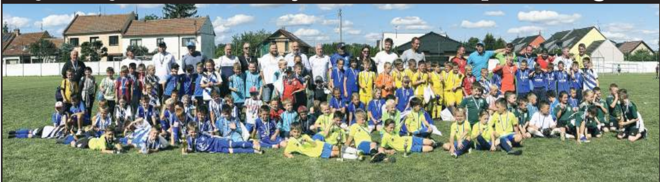
Všichni účastníci PINA CUPu 2024 na společném snímku.

vyhrál tým 1. SK Prostějov B, ve finále porazil Sigmu