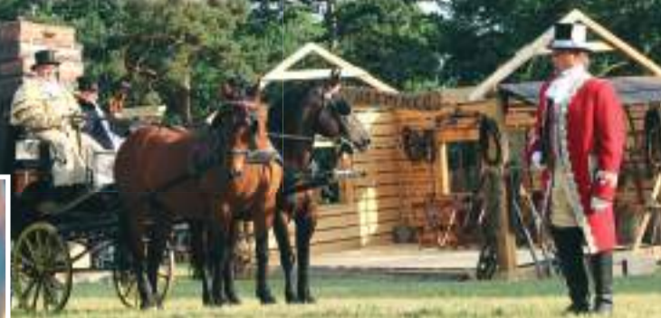
V loňském roce dvoudenní Josefkol navštívily téměř čtyři tisíce návštěvníků.

ČECHY POD KOSÍŘEM Tohle si určitě zaslouží podporu! Už od roku 2007 staví Josefkol mosty mezi minulostí a budoucností. Nenapodobitelná řemeslnická akce pořádaná v zámeckém parku v Čechách pod Kosířem byla nedávno nominována na Cenu Olomouckého kraje v oblasti Cestovních služeb v kategorii Živá tradice. Svým hlasem na webových stránkách www.cenykraje.cz ji nyní můžete podpořit i vy! Hlasovat bude možné už jen do 4. srpna 2024.