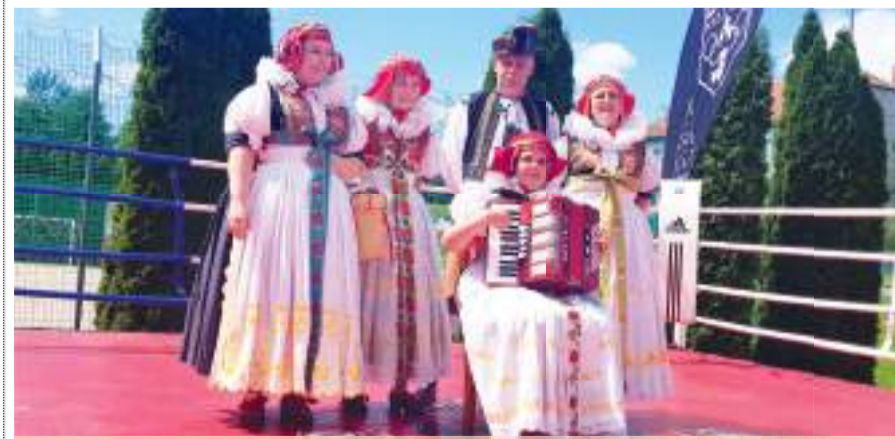
V rámci slavnostního zahájení turnaje vystoupil i národopisný soubor Mánes.

„Turnaj děláme jak pro boxerskou komunitu, aby měli účastníci co nejlepší zápasy, tak pro příznivce a širokou veřejnost, aby se lidi dobře pobavili. K čemuž tombola prostě patří. Proto mám radost, že jsme do ní získali tolik zajímavých cen, a všem včetně kamarádů i přátel za ně moc děkujeme,“ zdůraznil Martin Klíč.