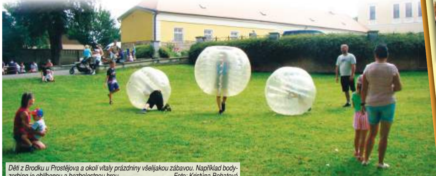
Děti z Brodce u Prostějova a okolí vítaly prázdniny všelijakou zábavou. Například bodyzorbíng je oblíbenou a bezbolestnou hrou.

BRODEK U PROSTĚJOVA Zámecký park patřil v pátek odpoledne dětem. Spolu s rodiči a prarodiči sem přišly přivítat prázdniny. V areálu jim byla k dispozici celá řada atrakcí, mimo jiné garda císaře Napoleona, malování na obličej či balónky Jitky Netolické. O hudební produkci a slovo se starala Martina „Qweetko“ Procházková z Rádía Haná.