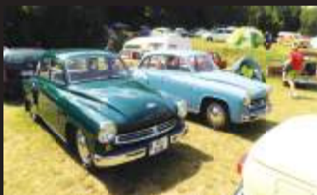
Z výroby koncernu IFA je i elegantní Wartburg 311.