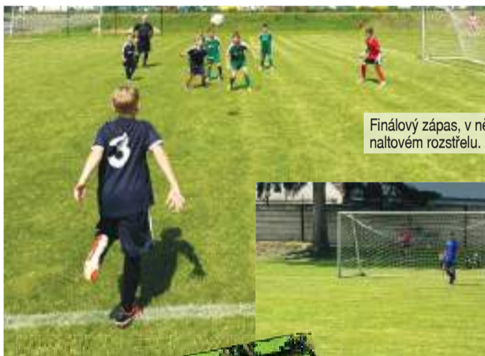
Finálový zápas, v němž ČechoMetle porazily Vyškov až po penaltovém rozstřelu.