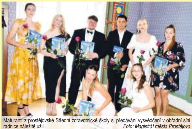
Maturanti z prostějovské Střední zdravotnické školy si předávání vysvědčení v obřadní síni radnice náležitě užili.

Předávání maturitních vysvědčení proběhlo v důstojné atmosféře a krásném prostředí obřadní síně prostějovské radnice. (mik)