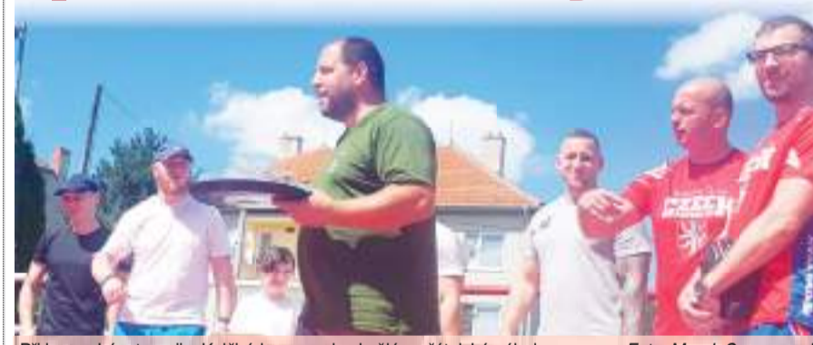
Při boxerském turnaji v Kelčicích panovala skvělá a přátelská nálada.

V přebohaté tombolce byla spousta rozmanitých cen