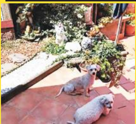
Jednou z fenek z množiny byla i Mijuška, která se už v novém domově krásně zabydlela a užívá si i společnosti partačky Engi.