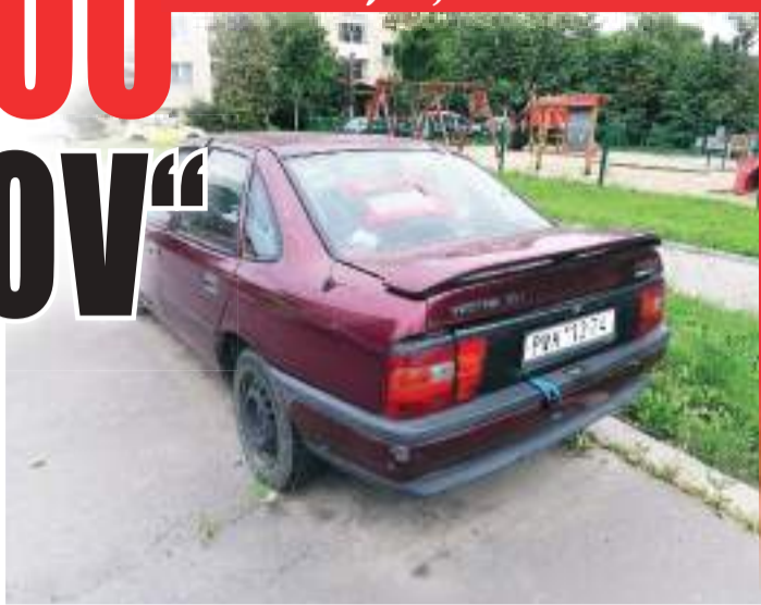
Ve vaku vínového opelu se spí, jí, i pije.

Obyvatelům okolních domů vadí právě fakt, že v autě přespávají bezdomovci. „Majitel byl zřejmě upozorněn, avízo je ale stržené. Navíc při