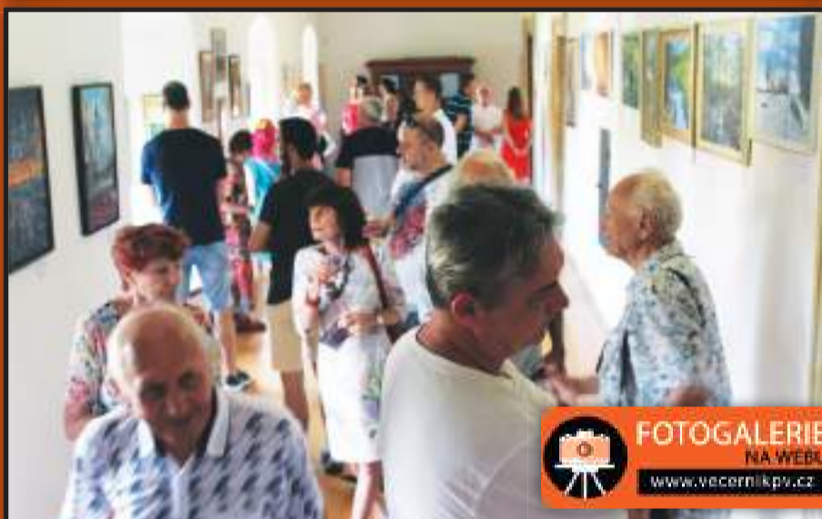
Četní návštěvníci vernisáže si prohlížejí obrazy hned sedmácti autorů. Všechny jsou k vidění na chodbě plumlovského zámku.