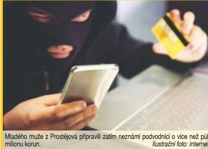
Mladého muže z Prostějova připravili zatím neznámí podvodníci o více než půl milionu korun.

tedy uhradil. Koncem května ale zjistil, že internetová stránka, na níž obchodoval, nefunguje a žena vystupující pod jménem Cynthia mu přestala odepisovat. Pokusil se to vyřešit sám a na internetu si vyhledal společnost, která se zabývá získáváním finančních prostředků z podvodů, a kontaktoval ji. Pracovník společnosti později sdělil poškozenému, že jeho finanční prostředky byly nalezeny a je třeba, aby si založil účet na konkrétní internetové stránce. Muž s vidinou zpětného získání svých finančních prostředků nezávalhal a účet si založil. Začaly ale přicházet pokyny k uhradení různých poplatků k tomu, aby mu byly nalezené peníze vráceny zpět na účet. K tomu ale nedošlo, žádné peníze se mu nevrátily, a na-