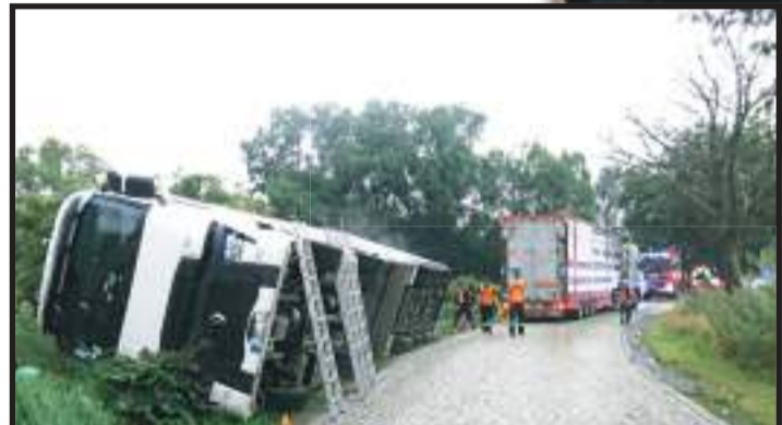
V havarovaném kamionu u Výšovic bylo osmadvacet krav. Všechny se podařilo zachránit.