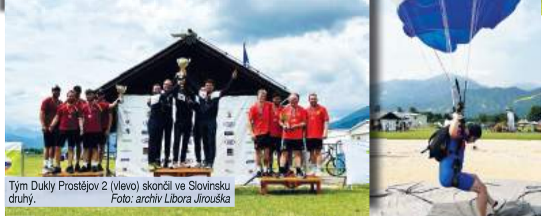
Tým Dukly Prostějov 2 (vlevo) skončil ve Slovinsku druhý.