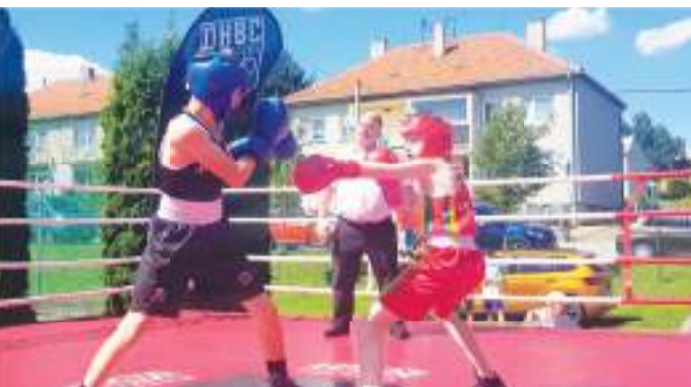
I letošní Hanácké beran měl mezinárodní punc například díky účasti Litevců.

„I Dorian měl druhý zápas ve dvou dnech, ale kondičně to pro něj není žádný problém. Spíš mu protivník – kolega z kadetské reprezentace ČR – moc neseděl svým stylem. Dokud Dorian dodržoval stanovenou taktiku, bylo střetnutí vyrovnané, ale takticky to neudržel a zaslouženě prohrál.“