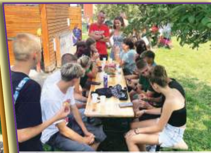
Na ZŠ v ulici E. Valenty si konec školního roku zpestřili rozlučkou s devátáky, kterou pro ně a jejich rodiče a učitele uspořádal klub přátel školy.