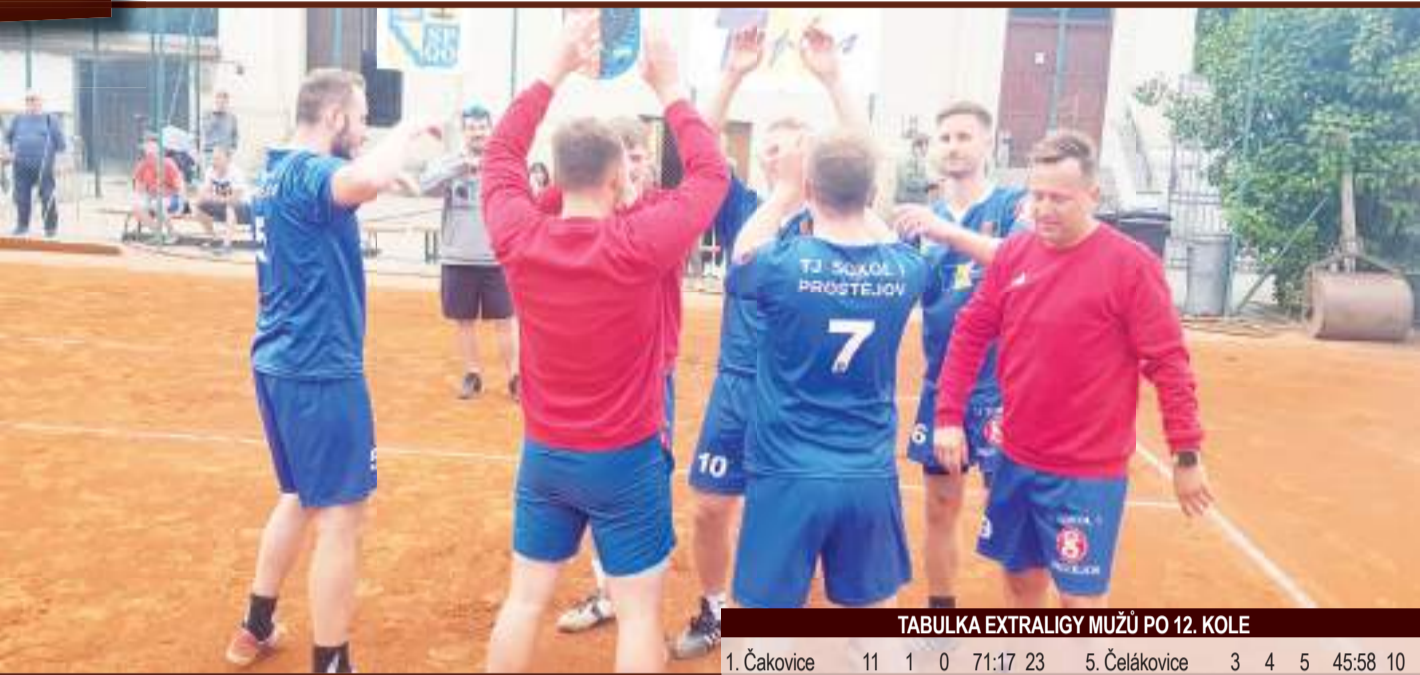
Prostějovští nohejbalisté ještě zkusí zabojevat o postup do extraligového play-off.

Přesto není aktuální postavení prostějovského týmu v tabulce nejvyšší soutěže zrovna moc příznivé, momentální sedmé místo by znamenalo pád do bojů o záchranu. Je potřeba se posunout na šestou pozici, která ještě zajišťuje účast v předkole play-off. „Pokud ve v předkole play-off. „Pokud ve vzbývajících dvou kolech nezískáme my, Holice ani Žatec už žádný další bod, budeme hrát o udržení, protože v minutabulce vzájemných utkání jsme za Holicemi a před Žatcem. Proto potřebujeme ze závěrečných dvou zápasů něco urvat, aspoň jednu remízu. A jmenování dva rivalové musí všechno prohrát,“ upozornil zkušený kapitán hanáckého mančafu.