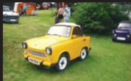
K vidění byl i Skrček. A věřte, že pojízdný!