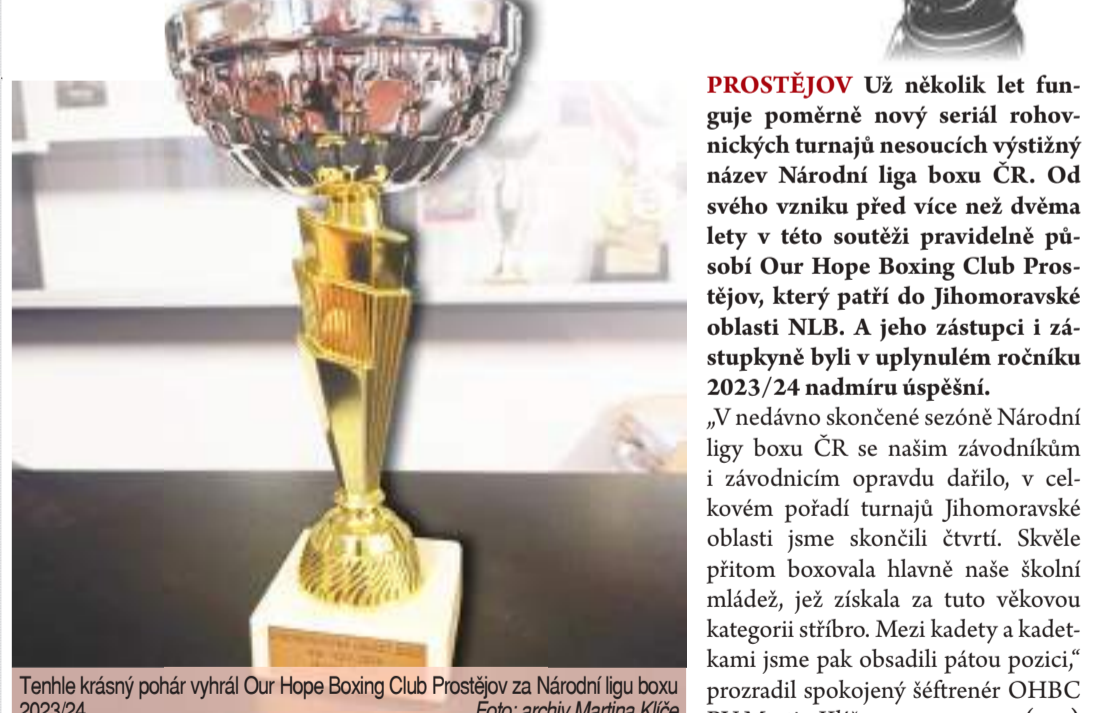
Tenhle krásný pohár vyhrál Our Hope Boxing Club Prostějov za Národní ligu boxu 2023/24.