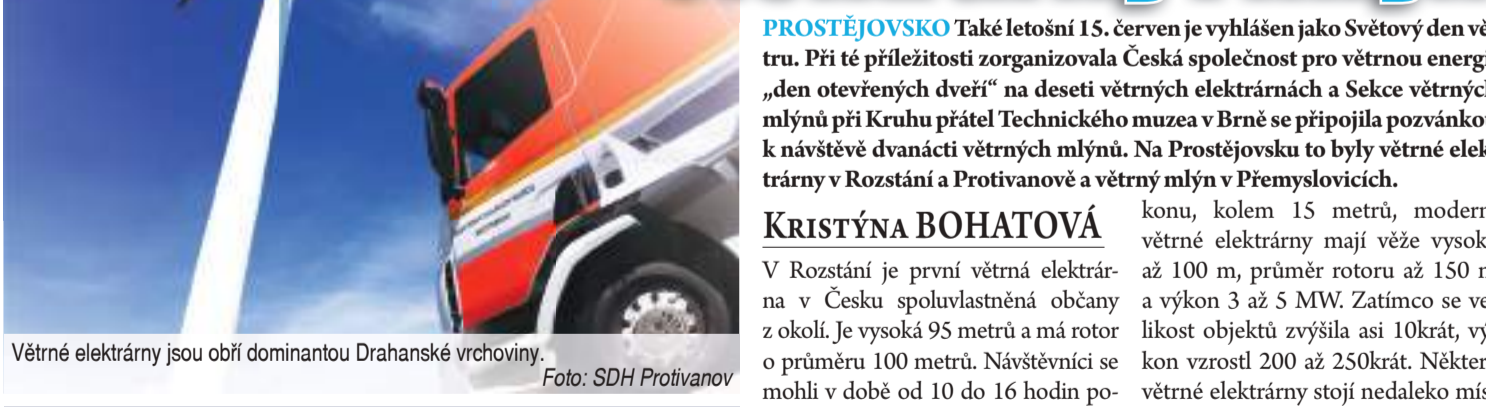
Větrné elektrárny jsou obří dominantou Drahanšské vrchoviny.