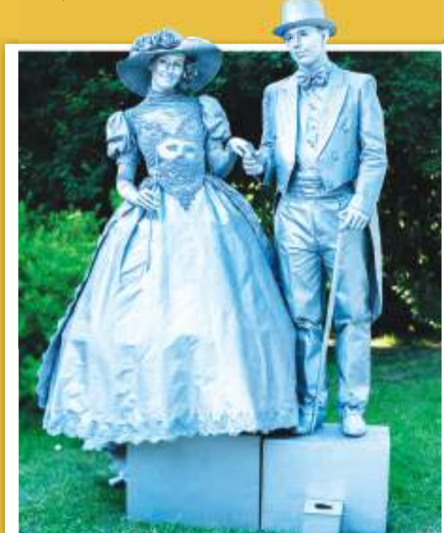
Živé sochy budou zajímavým kontrastem k sochám dřevěným, které řezbáři vytvoří.

I on totiž bude mezi mistry dřeva, kteří zrealizují své pojetí Wolkerových básní. Jejich slavnostní odhalení bude v sobotu 20. července ve Smetanových sadech. (kib)