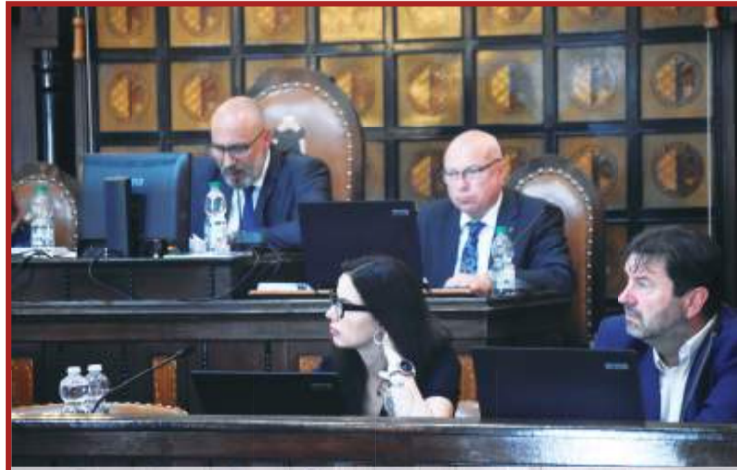
Prostějovští zastupitelé mají za sebou poslední předprázdninové jednání.