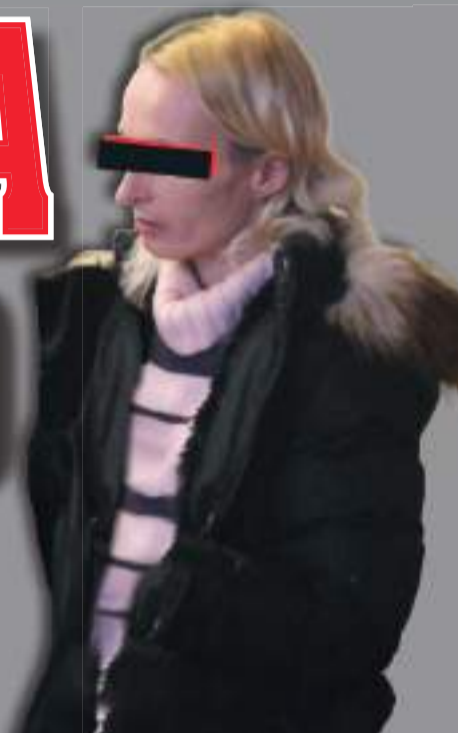
Renata D. jistě nemá jednoduchý život, za své problémy si však jednoznačně může sama.