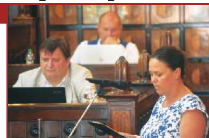
Občané z Tylovy ulice se vyjadřovali proti výstavbě garážového domu. Jak ale bylo nakonec patrné z výsledků hlasování, naprosto drtivá většina zastupitelů jejich protesty smetla ze stolu.