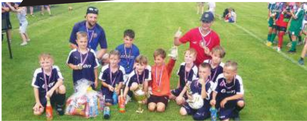
Triumf na Metle Cupu Junior 2024 v Otaslavicích vybojoval tým ČechoMetle.

V k.o. pavouku však každopádně šlo už do tuhého, přičemž tři ze čtyř