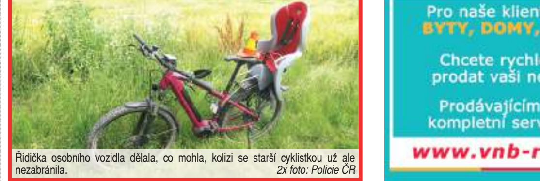
Řidička osobního vozidla dělala, co mohla, kolizi se starší cyklistkou už ale nezabránila.