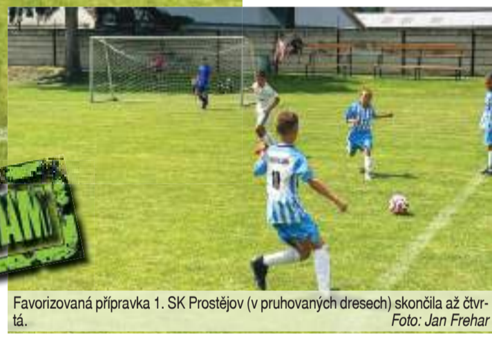
Favorizovaná příprava 1. SK Prostějov (v pruhaných dresech) skončila až čtvrtá.