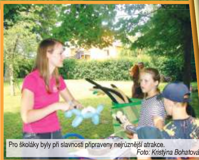
Pro školáky byly při slavnosti připraveny nejrůznější atrakce.

a jízda na ponících. Děti si také mohly vyzkoušet bodyzorbíng, kde se používá nafukovací balón podobný zorbinogové kouli. Slouží k bezpečnému narážení hráčů a k akrobatickým prvkům, jako jsou kotouly, přemety a podobné skotačiny. Na rozdíl od zorbinogové koule se bodyzorbíng navléká na tělo, kdy hlava a nohy sportovce zůstávají volné. „Vůbec necítím, že jsem spadl, ale vstávat ze země v té kouli je dost problém,“ smál se jeden z malých odvážlivců. Po skončení odpoledne pro děti se ale v Brodce veselili dál. Místní hasiče totiž čekalo převzetí nové automobilové cisternové stříkačky Scania P500.