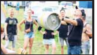
Pivní trojboj prověřil nejen „splávek“ účastníků.

PLUMLOV Pijeme s láskou! Právě tento slogan společně s půllitrem piva prostřeným Amorovým šípem zdobil tričko nejednoho návštěvníka druhého ročníku Pivních slavností, které se konaly uplynulou sobotu 17. srpna v areálu kempu Žralok u Podhradského rybníka v Plumlově. Dorazila na ni necelá tisícovka návštěvníků, kteří mohli ochutnávat piva hned ze 14 pivovarů.