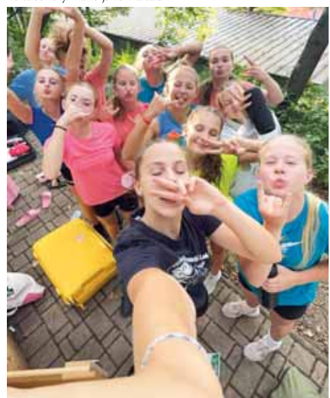
Starší žákyně věkáčka při tréninkovém kempu v Kutné Hoře.