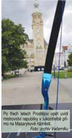
Po třech letech Prostějov opět uvidí mistrovství republiky v lukostřelbě přímo na Masarykově náměstí.