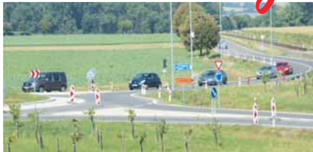
Pravidelné stání v kolonách před rondelem v Kostelecké ulici se pro mnoho lidí z Prostějova a okolí stalo nedílnou součástí letošního horkého léta.

PROSTĚJOV Také jste si tam určitě postáli! Záruční rekonstrukce obrub na rondelu ve směru na Kostelec na Hané se stala jedním z nejprobranějších témat letošního horkého léta v Prostějově. Semafory, které zásadním způsobem zpomalily provoz na frekventované silnici, hypnotizují od začátku prázdnin oči rekordního množství řidičů. Kolony se v ranní špičce pravidelně táhnou až ke křižovatce s tzv. Tichou. Stavba, na níž obvykle nikdo nepracoval, se tak dostala pod drobný pohled obrovského množství lidí. Jak to s ní tedy nakonec dopadne?