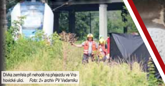
Dívka zemřela při nehodě na přejezdu ve Vrahovické ulici.