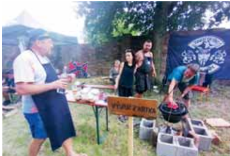
Vývar z rychlého krtka prezentoval tým výšovických motorkářů.

Zájemci si odpoledne mohli prohlédnout místní zámek. V neděli místní čekal buďček, který zajistila dechová hudba Vřesovanka. Slavilo se i v kostele hodovou mší a také odpoledním fotbalovým utkáním.