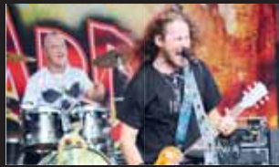
Havířská kapela Bastard to na pódiu rozjela.