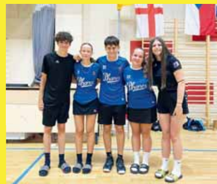
Tohle prostějovské mládří reprezentovalo ČR na Korbball Cupu U15 v Kutné Hoře.

Již od začátku velkých prázdnin probíhá letní příprava Vosímce.cz PV. Na dobrovolné bázi se jí účastní klubovní korbballisté i korbballistky všech věkových kategorií, jež mají na výběr ze tří tréninků každý týden. Kromě toho už se navíc blíží také tradiční srpnové soustředění korbballového Prostějova v Nizozemsku, kam zanedlouho odcestuje početná výprava na týdenní kemp pod patronátem partnerského klubu DOS-WK Enschede. (son)