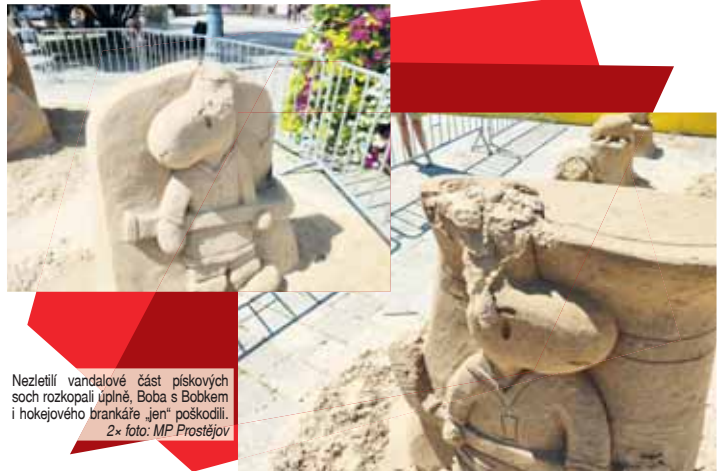
Nezletilí vandaloři část pískových soch rozkopali úplně, Boba s Bobkem i hokejového brankáře „jen“ poškodili.

kučrárny v polovině náměstí. „Děti hlídce uvedly, že chtěly pouze vyzkoušet pevnost písku, ze kterého jsou sochy vytvořeny. Po zjištění totožnosti byly všechny tři děti předány jejich zákonným zástupcům, kteří byli postupně hlídkou zkontaktováni a informováni o počínání svých ratolestí. Po zjištění veškerých skutečností oznámili strážníci celou záležitost příslušnému správnímu orgánu,“ uzavřela mluvčí Tereza Greplová. (mik)