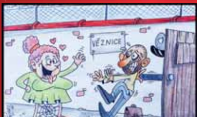
Mirek Vostrý spojil pojem svoboda originálně – pavučinou.