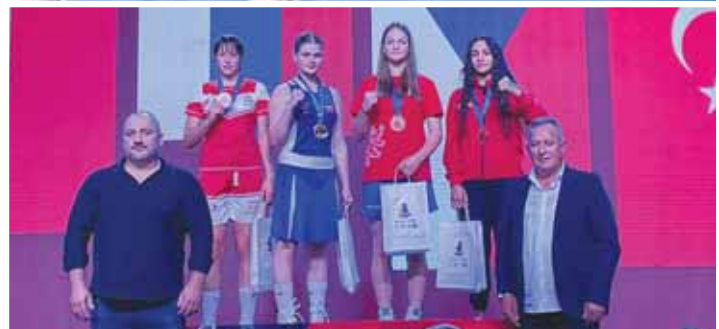
Prostějovská boxerka (druhá zprava) s bronzovou medailí z ME školní mládeže 2024.

„V semifinále proti Magdaleně Lewkowicz z Polska začala až moc opatrně, první kolo zaspala a jednoznačně prohrála. Ve druhém kole zvýšila obrátky a utkání se nám jevílo minimálně vyrovnané, ale rozhodčí zůstali nakloněni soupeře. Do třetího kola jsme šli s tím, že se pokusíme dostat Polku do počítání, což se však nepodařilo a finálové dveře tak zůstaly pro Ester uzavřeny“, litoval Dvorský.