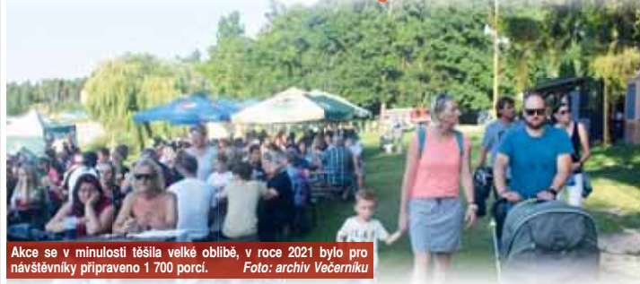
Akce se v minulosti těšila velké oblibě, v roce 2021 bylo pro návštěvníky připraveno 1 700 porcí.

MOSTKOVICE – V minulém vydání Prostějovského Večerníku jsme informovali o tom, že akce Guláš Rock Fest na plázi U Vrbiček u plumlovské přehrady se letos konat nebude. Akce pořádaná už od roku 2015 však bleskurychle našla svoji nástupkyni. Změnila však pořadatele, termín a z jejího názvu vypadlo slovo Rock. Na druhou stranu vstup na ni bude zdarma.