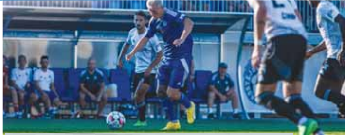
ESKÁČKO se dočkalo první výhry a teď na ní bude chtít navázat.

FOTBALISTÉ DOSTALI HLAD PO ÚSPĚCHU, RVOU SE O KAŽDÝ ŠANCI PROSTĚJOV Dvakrát po sobě dokázali bodovat fotbalisté 1. SK Prostějov a především vítězství na půdě rezervy ostravského Baníku je posunulo v tabulce druhé nejvyšší soutěže ze sestupových příček. Podruhé po sobě navíc dokázali vstřelit gól, což se jim v úvodních čtyřech duelech nepodařilo. V kabině všichni věří, že lepší období bude pokračovat a slušná hra v poli přinese další dobré výsledky.