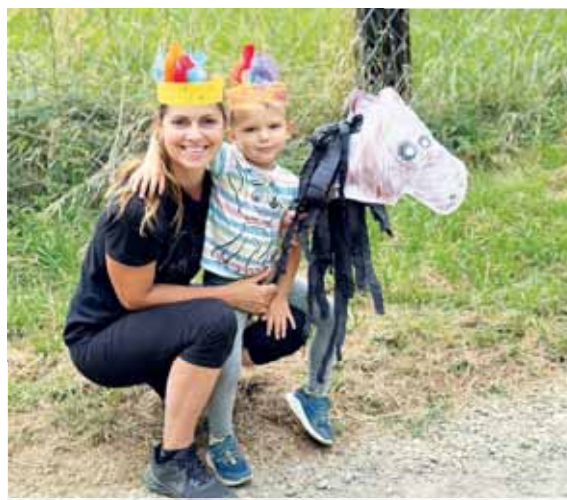
Zábavu i odpočinek našly v Cipískovi během léta i maminky se svými malými ratoletstmi.

pravujeme i další podvečerní rodičovské besedy o komunikaci v rodině, o výchově dnešních dětí, besedy o první pomoci pro rodiče, semináře spokojené máma, besedy o sociálních sítích, umělé inteligenci a vlivu internetu, kreativní večer pro maminky a další jednorázové akce pro celou rodinu. Rodičovské besedy probíhají v podvečer, semináře v sobotu dopoledne, podle aktuálního rozpisu a jsou určeny nejen stávajícím návštěvníkům MC, ale i veřejnosti,“ uzavřela Markéta Skládalová.