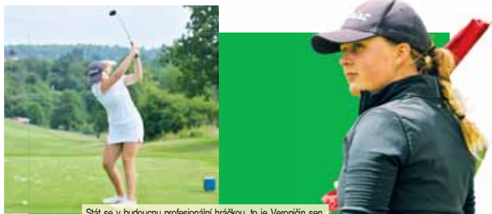
Stát se v budoucnu profesionální hráčkou, to je Veronici sen.