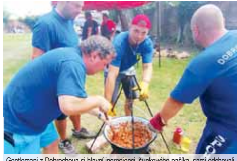
Gentleman z Dobrochova si hlavní ingredience, šunkového prasátka, sami odchovali.