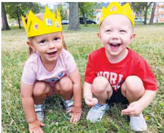
Mateřské centrum Cipísek připravilo pro nejmenší děti i bohatý prázdninový program.

V srpnu už se v MC Cipísek gruntuje a připravuje na nový školní rok, který bude zahájen 2. září. MC Cipísek nabízí denně dvouhodinové programy pro rodiče s dětmi od 3 měsíců do tří let. Program je připraven podle týdenních témat s respektem k vývoji dětí. Část programu