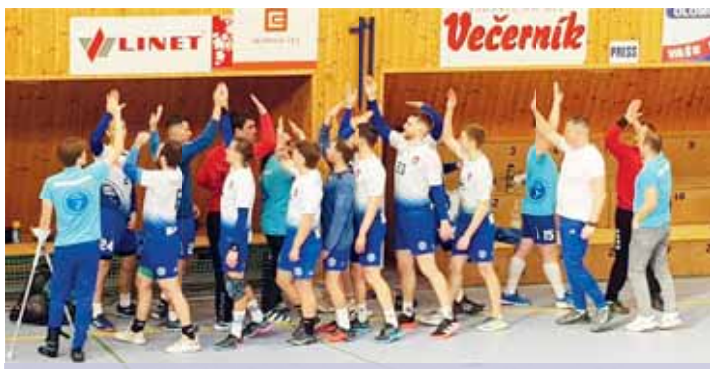
Házenkáři Kostelec na Hané už zahájili přípravu.