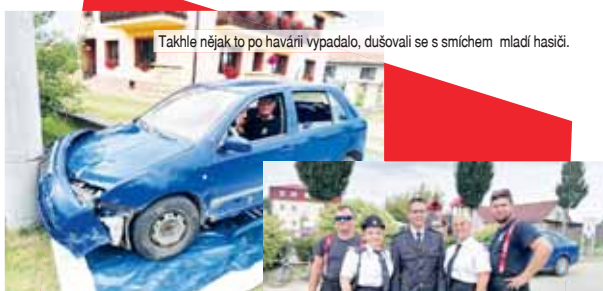
Takhle nějak to po havárii vypadalo, dušovali se s smíchem mladí hasiči.

nout výstavu z historie zdejšího sboru, nazvanou „Jak šel čas“. Všechny zaujaly ukázky hasičské techniky, které prezentovali prostějovští profesionálové a JSDH Protivanov. Součástí bylo i vyproštění osoby z havarovaného vozidla. Jak došlo k nehodě modré Felicie, kterou zastavil až sloup elektrického vedení, demonstrovala místní hasičská omladina. „Jednoznačně alkohol za volantem,“ smáli se mládenci, kteří na sedadlo nezodpovědného řidiče nominovali jednoho z kamarádů. Pro děti byl k dispozici skákací hrad, nejrůznější hasičské soutěže, pěna, tetování nebo ukázky útoků mladých hasičů. Závěr dne patřil zábavě s kapelou No Problem.