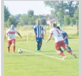
strany 28 a 29