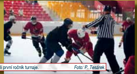
Hokejoví amatéři si užili první ročník turnaje.