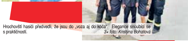
Hrochovští hasiči předvedli, že jsou do „voza aj do kočara“. Elegance snoubí se s praktičností.