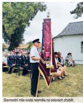
Slavnostní mše svatá nesměla na oslavách chybět.