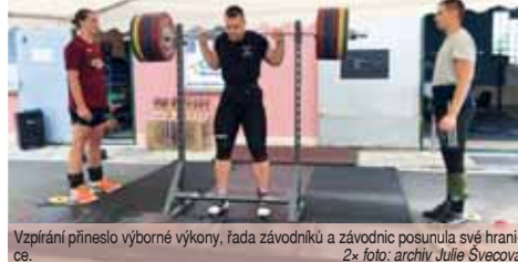
Vzpírání přineslo výborné výkony, řada závodníků a závodnic posunula své hranice.

z nízké účasti? „Závody se i přes slabší účast vydařily. O pohodovou atmosféru se postarali jak místní, tak členové z Koprivnice, kteří neváhali a pomohli s přípravou, průběhem, hecováním i následným uklídem po závodech. Za to patří všem účastní-