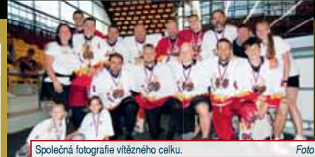
Společná fotografie vítězného celku.

Po hokejové stránce byli všichni hráči hobby hokeje spokojeni. Během celého turnaje se pak také vybíraly peníze, které pořadatelský klub věnuje rodině zesnulého kamaráda Davida Krejčího, jenž zesnul po hokejovém zápase v lednu letošního roku.