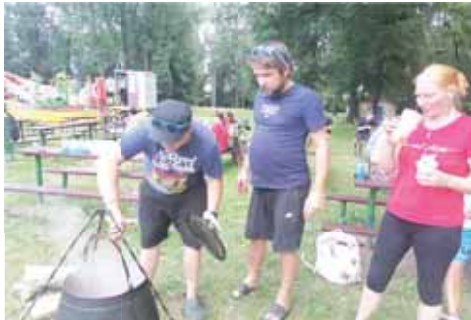
Tým Habibi vsadil na kance. A dopoval se párkem v rohlíku.