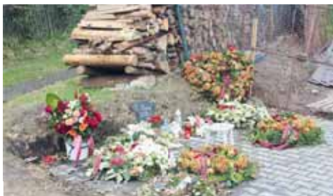
Kousek od místa výbuchu vznikl pomníček věnovaný zemřelému hasiči, kam místní přinášeli svíčky.

prve na své místo rezignovala jedna zastupitelka s tím, že se chce věnovat především rodině. V květnu pak pětičlenné zastupitelstvo opustil také další člen, jenž své důvody neuvěděl. Ve volbách, které se budou konat v sobotu 5. října, budou moci voliči nakonec vybírat hned ze dvou kandidátek.