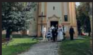
Slavnostní mše se zúčastnili i krojovaní Hanáci