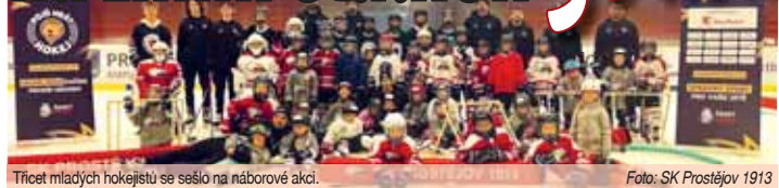
Třicet mladých hokejistů se sešlo na náborové akci.