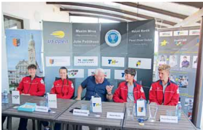
V Prostějově nastupuje další skvělá generace tenistů a tenistek.