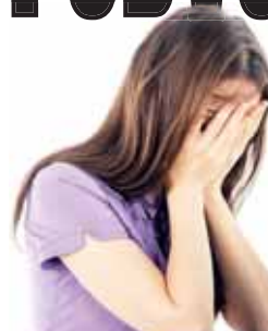
Žena z Kostece na Hané byla podvedena a okradena ve chvíli, kdy se bezstarostně přihlašovala do svého internetového bankovníctví.

Pozor, kde se přihlašujete, varuje policie