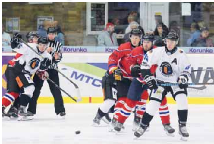
Hokejisté Prostějova nezvládli úvodní soubor nového ročníku.

Eskáčko ZÁPAS NEZVLÁDLO A MÁ CO ZLEPŠOVAT