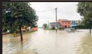
Ještě před pár dny byly Nezamyslice pod vodou

na vodní a hrabavou drubež, králíky či morčata, v nabídce bylo dokonce i prase. Tedy ne celé, lidé si po zaplacení kuponu mohli odnést pěkný kus pečeného čuníka. „Chodíme sem hlavně kvůli vnučátkům, aby se podívala na zvířátka. Ovšem jak to tak sleduji, zřejmě neodejdeme sami, ale s morčetem,“ směla se jedna z návštěvnic. Na sousedním fotbalovém hřišti pak proháněly míčůdu týmy starších a mladších žáků, posledním zápasem byl „srandamač“ v podání místních Mažoretů a starých pánů. Zaplněna byla i sportovní hala, kde probíhala utkání ve florbalu. Neděle byla opět vyhrazena ranní mši svatě, fotbalovému utkání mužů a večer kultuře, divadelnímu představení pivinského Větráku.