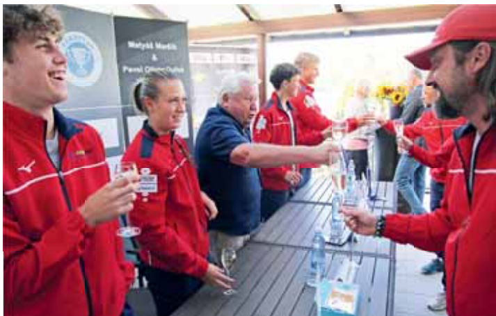
Slavnostní připítek ke skvělým úspěchům nemohi chybět.