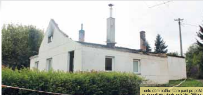
Tento dům patřil staré paní po požáru dopadl ze všech nejhůře. Příčinou bylo to, že zřehavě úločky zapálily seno uskladněné na půdě.

Po mrtvém hasiči zůstala manželka a dvě nezletilé děti. Právě jim by měly putovat peníze z transparentního účtu veřejné sbírky určeného pozůstalým, na němž se rok po výbuchu sešlo přesně 456 310 korun.