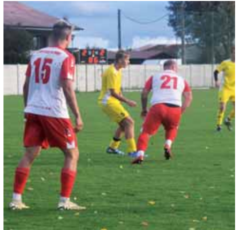
Kostelečtí fotbalisté byli častěji na míči, také Konice si ale připsala řadu akcí.

Hned zkrraje druhé půle mohl otevřít účet zápasu Skalník. Přišel hráče, vytočil se do střely a trefil levou tyč. Dorážka mířila mimo. Ve 49. minutě Vymazal zblízka ze skrumáže před bránou nedal. Hned poté se hosté radovali. Martin Kořenek zakončil z pravé strany situaci 2 na 1 povedenou střelou do vzdálenějšího rúčku. Holoubek se následně protáhl podél brankové čary, nevyrovnal však. Poté už se ale domácí dočkali. Vymazal se postavil k rohu a našel hlavu Radka Doležela – 1:1. Následně Grulich před bránou nedal, ze druhé vlny se neprosadil ani Piňos. Pak zapracovaly emoce, Ryp šel ve vápně k zemi a hosté se následně marně dožadovali penalty. V 70. minutě se hosté znovu dostali do akce po pravém křídle. Následně přenesli hru nalevo, kde byl Oldřich Kvapil, který nastřelil míč. Ten ještě tečoval Antl a bylo to 2:1 pro Konici. V 73. minutě měl Vymazal další šanci po jednom z četných rohů Kostelce, neproměnil. Deset minut před koncem se do další střely vytočil Skalník, našel však jen brankáře. Hned nato ale Kostelec srovnal, po přízemním centru přišlo doklepnutí do brány od Ondřeje Chytila – 2:2. Další velké šance už nepřišly a skóre se už neměnilo, následovaly tak pokutové kopy. V nich se mnohem více dařilo Konici. Ve druhé sérii přestřelil Skalník a hned poté poslal míc i Doležel mimo. Vítěznou penaltu si tak připsal zakončením k tyči David Kubín a rozhodl tak zápas, v němž byl Kostelec častěji na balónu, hosté však byli mnohem efektivnější.