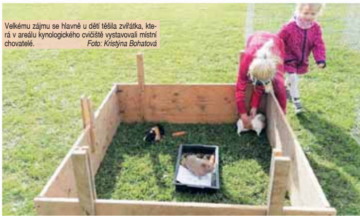
Velkému zájmu se hlavně u dětí těšila zvířátka, která v areálu kynologického cvičiště vystavovali místní chovatelé.

na vodní a hrabavou drubež, králíky či morčata, v nabídce bylo dokonce i prase. Tedy ne celé, lidé si po zaplacení kuponu mohli odnést pěkný kus pečeného čuníka. „Chodíme sem hlavně kvůli vnučátkům, aby se podívala na zvířátka. Ovšem jak to tak sleduji, zřejmě neodejdeme sami, ale s morčetem,“ směla se jedna z návštěvnic. Na sousedním fotbalovém hřišti pak proháněly míčůdu týmy starších a mladších žáků, posledním zápasem byl „srandamač“ v podání místních Mažoretů a starých pánů. Zaplněna byla i sportovní hala, kde probíhala utkání ve florbalu. Neděle byla opět vyhrazena ranní mši svatě, fotbalovému utkání mužů a večer kultuře, divadelnímu představení pivinského Větráku.