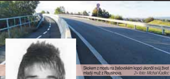
Skokem z mostu na žesovském kopci ukončil svůj život mladý muž z Rousínova.

„Dnes po sedmé hodině ranní jsme přijali oznámení o pádu osoby na dálniční těleso D46 nedaleko obce Žesov ve směru od Výchova na Olomouc. Po příjezdu na místo bylo zjištěno, že skutečně došlo k pádu jednatřicetiletého muže z mostu na komunikaci, který na místě podlehł způsobným zraněním. Dle prvotního šetření na místě se zřejmě jednalo o dobrovolné ukončení života. Dálnice byla uzavřena z důvodu šetření události,“ uvedla již minulé pondělí dopoledne Miluše Zajícová, tisková mluvčí Krajského ředitelství Policie ČR v Olomouci.