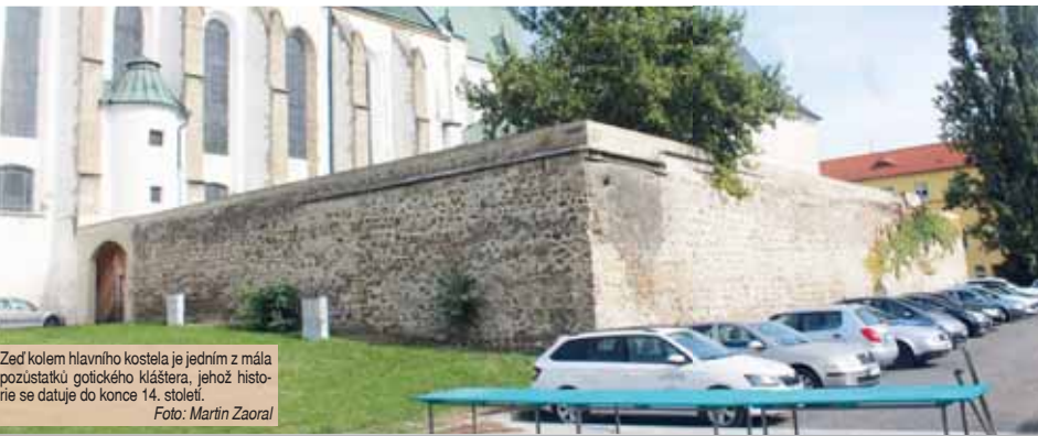
Zeď kolem hlavního kostela je jedním z mála pozůstatků gotického kláštera, jehož historie se datuje do konce 14. století.

VÍTĚZNÁ STUDIE NOVÉ PODOBY CENTRA MĚSTA POČÍTÁ S JEJÍM ZASTAVĚNÍM