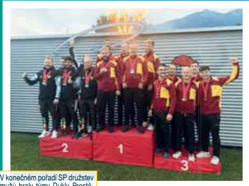
V konečném pořadí SP družstev mužů braly týmy Dukly Prostějov zlato (áčko) a bronz (běčko).