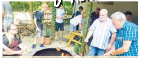
Na oběd si aktéři vlastnoručně opékali nad ohněm chutné špekáčky.

PROSTĚJOV Malebné prostředí přírodního občerstvení U Abrahámka v prostějovském lesoparku Hloučela bylo tradičním dějištěm tradičního turnaje – Šachového loučení s prázdninami 2024. Oddíl SK Rošáda Prostějov zorganizoval na oblíbeném místě jeho už 17. ročník, kterého se zúčastnilo rekordních třiašedesát hráčů a hráček!