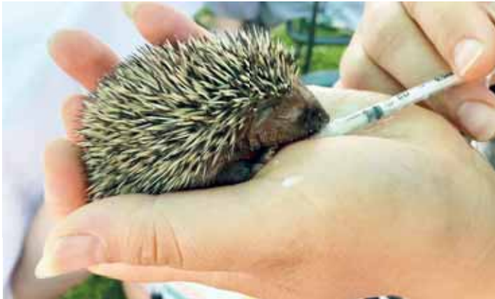
Malí bodlínáci nesmí kravské mléko, nahradíte ho sušeným pro kořata či štěňata.

NĚMČICE NAD HANOU Podzim klepe na dveře a záchranné zvířecí stanice se chystají na příliv nových obyvatel. Řada z nich ale do stanice vůbec nepatří. Příkladem jsou mladí ježci, které sem lidé nosí s tím, že zimu by ve volné přírodě nepřežili. Jenže zdravá zvířata pak zbytečně zabírají místo potřebným. Proto vedoucí německé stanice Lidmila Chňoupková sdílí několik zásadních skutečností.