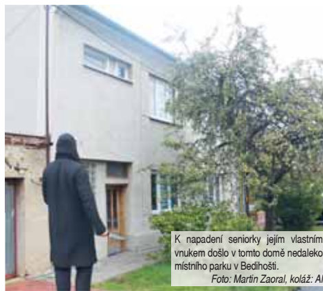
K napadení seniorky jejím vlastním vnukem došlo v tomto domě nedaleko místního parku v Bedihošti. Foto: Martin Zaoral, koláž: AI