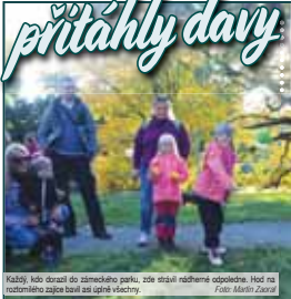
Kalšíj, kdo dorazí do zámečského parku, zde stráví nádherné odpolední. Hod na občerstvení nabízí bar u dětské hřiště.

CECHY POD KOSÍŘEM Tak se to opět potvrdilo! Zámečský park v Cechách pod Kosířem je pro návštěvníky stále oblíbeným místem. Každý rok přiláká tisíce lidí, kteří chtějí využít krásy podzimní přírody. V letošním roce se návštěvnost zvýšila díky výbornému počasí a široké nabídce aktivit. Park nabízí nejen krásné výhledy, ale také dětské hřiště, restauraci a občerstvení. Vstupné je 15 Kč, děti do 6 let zdarma. Provoz parku probíhá od 9:00 do 18:00 hodin.