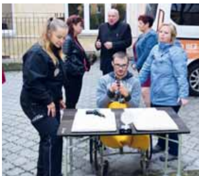
Asi nejatraktivnější soutěží sportovního dopoledne v Lipce byla střelba s laserové pistole.

střelnici, střelba z luku nebo shazování kuželek míčem. Dále si soutěžící mohli vyzkoušet dovednosti v disc-golfu nebo cornhole, tedy hod kukuřičným pytlíkem na cíl. Součástí byl i stolní hokej takzvaný pukec, který byl k dispozici pro hru ve dvou a ve čtyřech. Další disciplínou byl labyrint, kde bylo za úkol dostat míček za pomoci dvou táhel po dané trase do cíle, aniž by míček spadl do otvorů na desce,