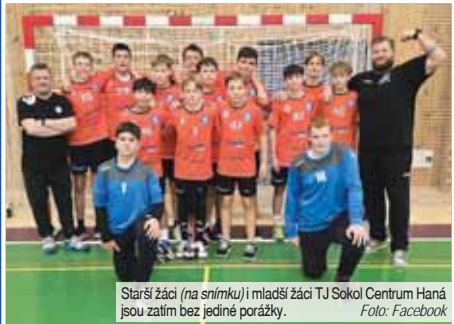
Starší žáci (na snímku) i mladší žáci TJ Sokol Centrum Haná jsou zatím bez jediné porážky.

Resumé: Starší dorostenci HAOLK po odloženém úvodním střetnutí vyhráli důležitou premiéru na půdě Koprivnice, načež nestabilitě favorizované Plzně a v dalším domácím duolu podlehli o tři góly silnému Brnu, což byla škoda.