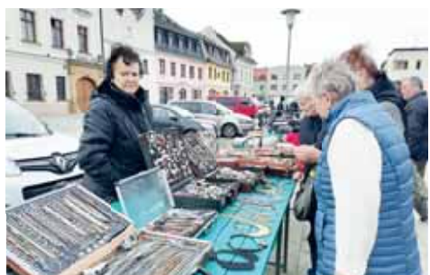
Nabídka retro bižuterie byla velká. Bleší trhy by se během zimních měsíců mohly přesunout do Kaska.