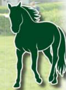
Bělka Manoria si v Pardubících zaběhla teprve třetí cross v životě.