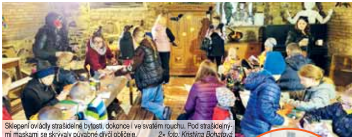
Sklepení ovládly strašidelné bytosti, dokonce i ve svatém rouchu. Pod strašidelnými maskami se skrývaly půvabné diví obličejky.

„Ve sklepení se návštěvníci setkali s ozvládnými strašidelnými bytostmi. Pobyt jim zprjemnilo promítání halloweenských kreslených pohádek a příběhů rodiny Simpsonových“, vysvětlila za pořadatele Kateřina Jenešová s tím, že hodně malých návštěvníků dorazilo v originálních kostýmech.