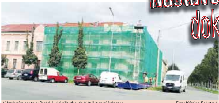
V Azylovém centru v Pražské ulici přibudou další čtyři bytové jednotky.