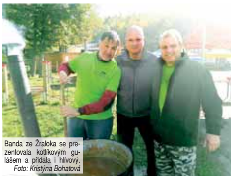
Banda ze Žraloka se prezentovala kotlíkovým gulášem a přidala i hlivový.