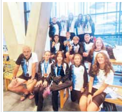
Plavci TJ Prostějov zaznamenali řadu úspěchů ve Znojmě.

ZNOJMO, PROSTĚJOV TJ Prostějov vyslala svoje plavce družstva „B“ na závody do Znojma pod názvem Znojemský hrozen 2024. Ty se konaly 28. září a z Prostějova tam vyrazilo patnáct plavců. Ti si z tohoto závodu odvezli 31 medailí a zařadili se mezi 5 nejspěšnějších klubů závodu, kdy předčili i kluby krajských měst Moravy. Síla prostějovského plavání tak na znojemské pětadvacitce byla znát. Detaily si nyní můžete přečíst níže.