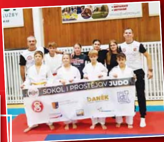
Judisté uspěli v Ostravě.