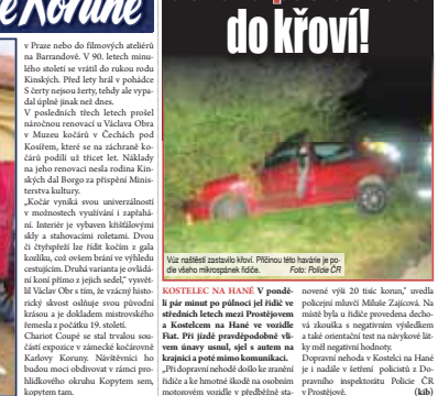
Viz rážel zastavil křoví. Příčinou této havárie je podle všeho mikrospánkové spánkové období.

Řidič v Kostelci usnul a poslal Fiatu do křoví. Havárie proběhla v neděli 10. října 2024 v 14:30 hodin. Řidič byl zraněn a poslán do nemocnice. Příčina havárie je mikrospánkové spánkové období.