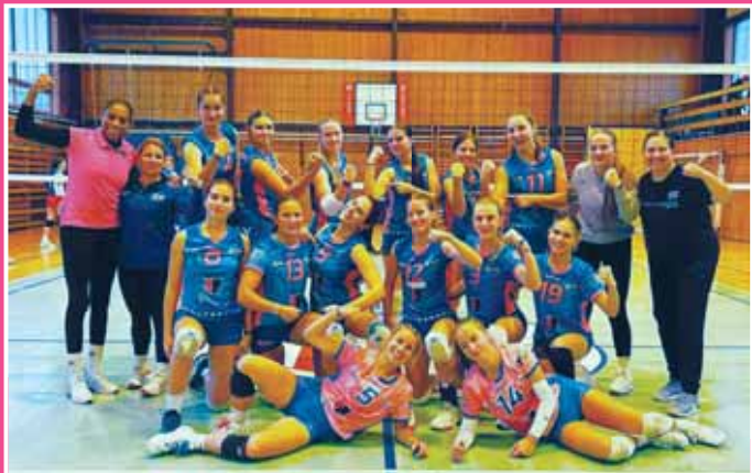
Kadečky křepčily po triumfech v extralize U18 na Vysočině.