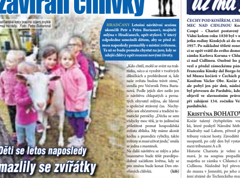
Děti se letos naposledy mazlily se zvířátky.

Hradčanech letos naposledy mazlily se zvířátky. Děti se těšily na setkání s domácími zvířátky v rámci akce. Akce proběhla v krásném prostředí parku.