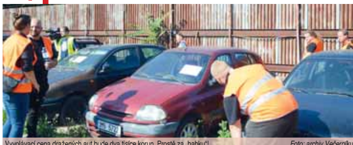
Vyvolávací cena dražených aut bude dva tisíce korun. Prostě za „babku!“

álu společnosti PV Recyklace s.r.o. a to v pracovní dny v době od 9 do 14 hodin (tel. 603 153 830). Podmínkou k převzetí vozidla je zaplacení platby za odtah vozidla a jeho uskladnění. První dražbu autovraků město realizovalo v září loňského roku. V nabídce jich bylo původně šest, Fiat Punto ale majitel vysvobodil těsně před aukcí a nechal ho zvrakovat. Podmínky dražby byly stejné, jako budou letos, až na vyvolávací cenu. Ta byla u všech aut tisíc korun. Vydražitel musí i tentokrát koupit vozbu obratem na místě zaplatit. (kib)