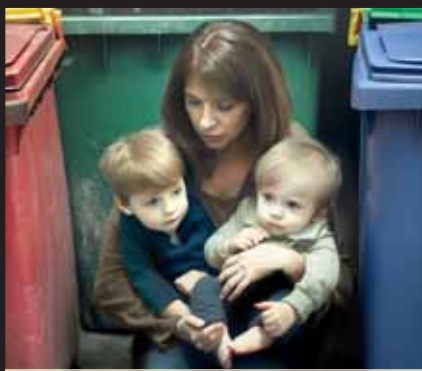
Přestože Večerník zná totožnost dané ženy, rozhodl se jí vzhledem k jejím nezletilým potomkům nezveřejňovat.