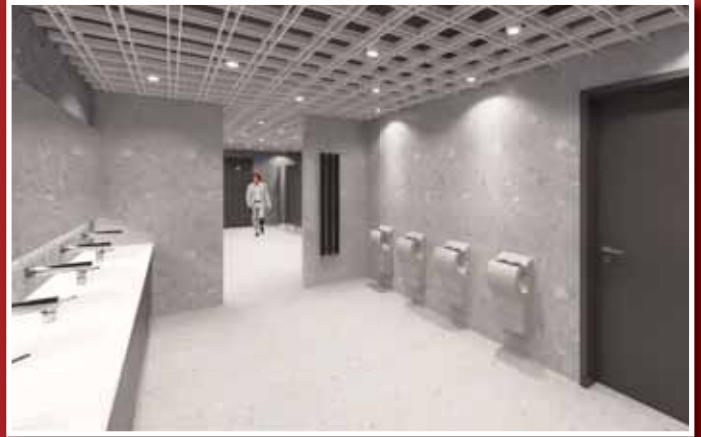
V KaSku budou návštěvníkům k dispozici moderní toalety.