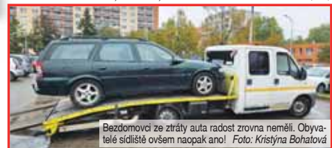
Bezdomovci ze ztráty auta radost zrovna neměli. Obyvatelé sídliště ovšem naopak ano!