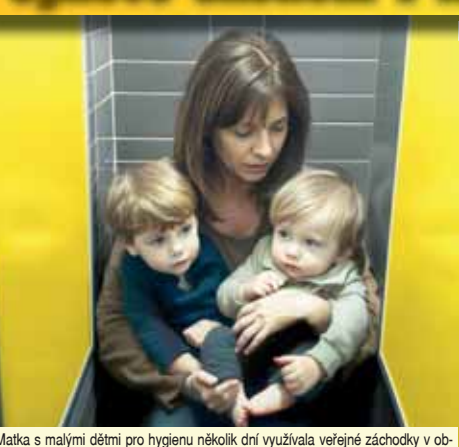
Matka s malými dětmi pro hygienu několik dní využívala veřejné záchodky v obchodním centru.