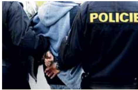
Prostějovští policisté zadrželi zloděje bez domova během pár hodin.