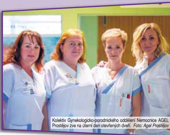
Kolektiv Gynekologicko-porodnického oddělení Nemocnice AGEL Prostějov zve na úterní den otevřených dveří.