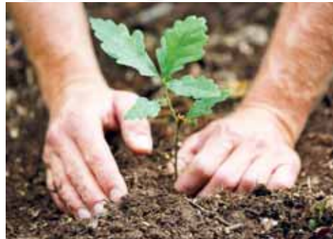
Město investuje další statisíce korun do podzimní výsadby. Jak nových stromů, tak i cibulovin a vykradených záhonů.

PROSTĚJOV Vedení prostějovského magistrátu hodlá znovu rozšířit plochu zeleně přímo ve městě. Bezmála 2,8 milionu korun vyčlenili radní z fondu zeleně tak, aby ještě letos došlo v různých ulicích k výsadbě stromů, keřů, cibulovin, ale také k obnově některých rozkradených záhonů. Ano, i takové nešvary některých obyvatel Prostějova je nyní potřeba napravit.