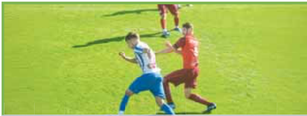
Esťáčko zvládlo derby s Čechovicemi.

PROSTĚJOV Jedenácté kolo nabídlo derby, na které se mnoho fanoušků velmi těšilo. V krajském přeboru proti sobě nastoupili fotbalisté Prostějova, kteří přivítali soupeře z Čechovic. Domáci šli do utkání jako favoriti a posílení z „A“ mužstva měli potvrdit, proč tomu tak je. V sobotním dopoledni se jim to povedlo splnit. Definitivně rozhodnutí ale přišlo až v posledních minutách.