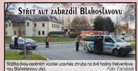
Strážka dvou osobních vozidel uzavřela zhruba na dvě hodiny frekventovanou Blahoslavovu ulici.

PROSTĚJOV Zřejmé nedání přednosti v jízdě stojí za střetem dvou osobních aut, k němuž došlo ve čtvrtek 21. listopadu dopoledne v Blahoslavově ulici. Nehoda omezila dopravu v centru města na bezmála dvě hodiny.