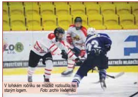
V loňském ročníku se mládež rozloučila se starým logem.

pozitivní a je potřeba zmínit fakt, že Prostějov zatím patří mezi nejvíce ofenzivní týmy a vstříhl nejvíce branek ze všech. Snad tak forma směrem dopředu vydrží i nadále. U mladších žáků se oběma kategoriím daří držet v klidném středu tabulky, kde se nachází jak žáci 6. třídy, tak žáci 5. třídy. Pravidelně souboje s kontinenty pak jistě nabízí dobré srovnání, a především posun směrem vzhůru, protože příprava na ještě starší kategorie je velmi podstatná a důležitá. Uvidíme, zda budou pokračovat v následujícím období, ale i letech na stejných příčkách, či se podaří dostat ještě na vyšší úroveň. Nestrádají ani ty nejmladší kategorie, které absoluuji pravidelné tréninkové dávky, ale také pravidelně turnaje a hokejem se baví. Velmi pozitivní zprávou je v tomto ohledu i skutečnost, že hokejisté SK Prostějov 1913 mohou využívat možnosti hokejových tříd, díky kterým se tak i častěji dostanou na led, a mají daleko větší porci tréninků, než by za normálních okolností měli. Kromě toho stále pokračuje i nábor, nechybí i řada dalších doprovodných akcí. Naposledy to byl například halloween na ledě, nyní se určitě bude chystat další překvapení kolem Mikuláše, a kromě hokejových dovedností nechybí například i škola bruslení.