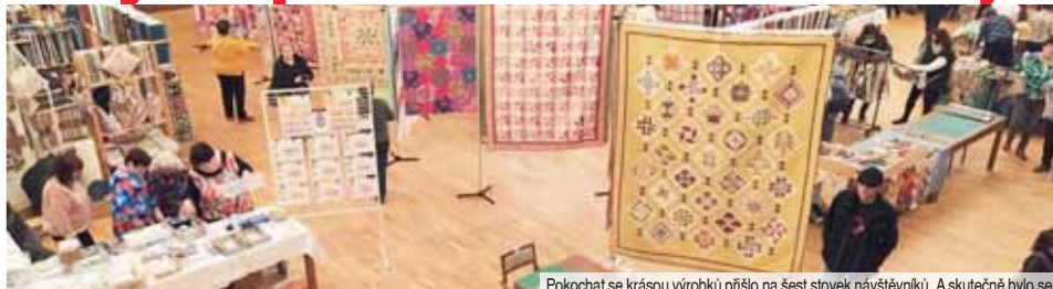
Pokochat se krásou výrobků přišlo na šest stovek návštěvníků. A skutečně bylo se na co dívat.