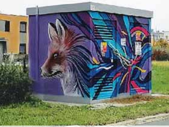
K ulici Josefa Lady liška Bystrouška prostě patří.