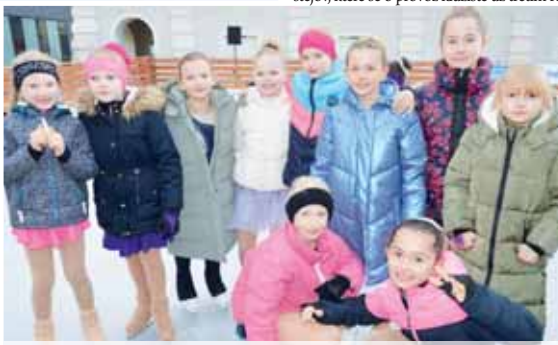
Jako první se na mobilní kluziště v centru Prostějova dostaly malé krasobruslařky, které divákům předvedly své výkony.

Po jeho proslovu na led vyjeli nejmladší členové florbalového oddílu SK K2 Prostějov,