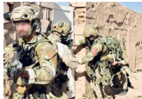
Prostějovští příslušníci speciálních sil čelí závažnému obvinění. Ilustraci foto: 601.skss