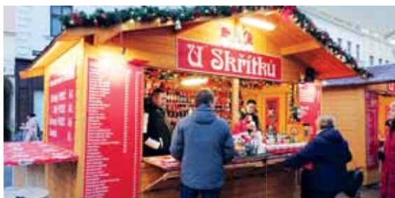
U Skřítka lákají na Turbomost – svažený jablčný most z Bílých Karpat se skořicí, hřebíčkem, badyánem a pravou jablkovici.

kem stará. Jak dodal, i letos je možnost zapůjčení bruslí. Za každý započatý blok bruslení je účtováno 70 korun. Je nutno počítat s vratnou kaucí 500 korun za každý vypůjčený pár bruslí,“ dodal Zatloukal. K dispozici je přímo u kluziště také občerstvení s bohatou nabídkou. „Působíme zde již třetí rok a už vlastně patříme k inventáři. Nabídku každý rok rozšiřujeme a nejinak je tomu letos. Máme, mimo jiné Bombardino,