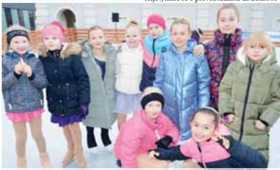
Jako první se na mobilní kluziště v centru Prostějova dostaly malé krasobruslařky, které divákům předvedly své výkony.

Po jeho proslovu na led vyjeli nejmladší členové florbalového oddílu SK K2 Prostějov,