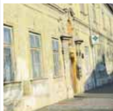
Stav historického areálu na začátku Svatoplukovy ulice je už řadu let velmi špatný. Už několik let existuje skvělý projekt na jeho kompletní rekonstrukci, který počítá i se smysluplným využitím.

S roztroušenou sklerózou u nás žijí spousta lidí, kteří společně se svými příbuznými ke vzniku podobného zařízení vzhlíží s velkým očekáváním. „Naším cílem není pouze vybudovat něco, co by pomáhalo nemocným lidem a jejich rodinám, ale od samého počátku jsme vedeni snahou pro budoucí generace zachovat významnou kulturní památku. Ostatně kdybychom stejné zařízení budovali někde na zelené louce, zřejmě by to vyšlo levněji a ušetřili bychom si řadu komplikací,“ vysvětlil Keprt, kterého o to více mrzely průtahy kvůli námitkám památkářů. „Došlo k výraznému zdržení a vzhledem k inflaci a značnému zdržení stavebního materiálu vzrostly odhadované náklady z původních 400 milionů na 600 milionů korun. Nyní nezbývá než věřit, že se potřebné peníze podaří najít,“ uzavřel Václav Keprt. (mls)