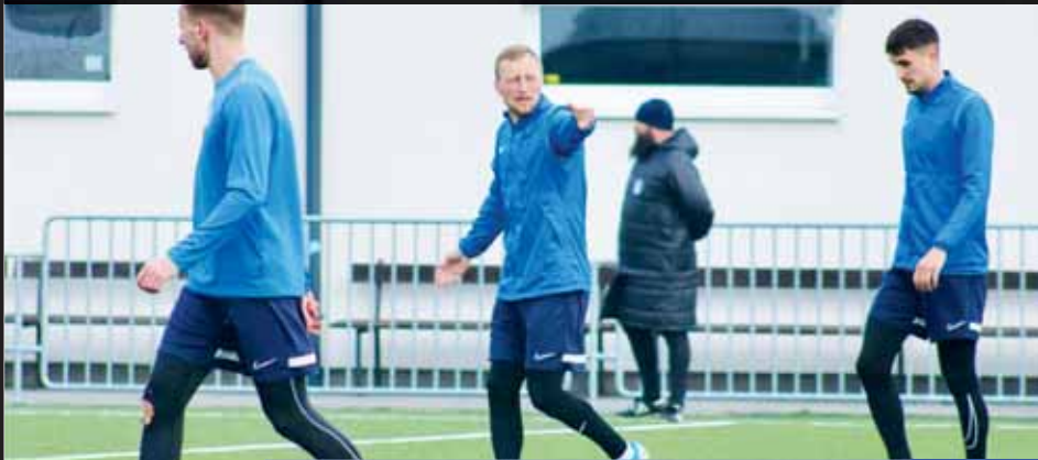
Kdo povede fotbalisty Prostějova do zimní přípravy zatím není jasné.

KANDIDÁTŮ NA KOUČE JE NĚKOLIK, SEZNAM ČÍTÁ PŘES DESET JMEN