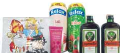
Dnes se v obchodech kradou zboží všeho druhu. A co víc, mezi zadrženými zloději jsou zástupci všech generací.

trahy zadržena za pokladní zónou se dvěma nezaplacenými limonádami v hodnotě 40 korun. Druhý pachatel byl ve stejném obchodě zadržán pět minut po čtrnácté hodině. Triatřicetiletý muž pronesl přes pokladní zónu dvě lahve alkoholu v celkové hodnotě 160 korun. Ani on se neobtěžoval za vybrané zboží zaplatit, uvedla Tereza Greplová z Městské policie Prostějov. Za necelou hodinu byli strážníci přivoláni do obchodního domu v Okružní ulici, kde byla pracovníky ostrahy zadržena pětasedmásetiletá žena! „Seniorka nezaplátla za zboží v hodnotě 55 korun. Jednalo se o sprchový gel a igelitový sáček na Mikuláše. Ke čtvrtému případu drobné krádeže strážníci vyjžděli opět do obchodu v ulici Újezd. Os-