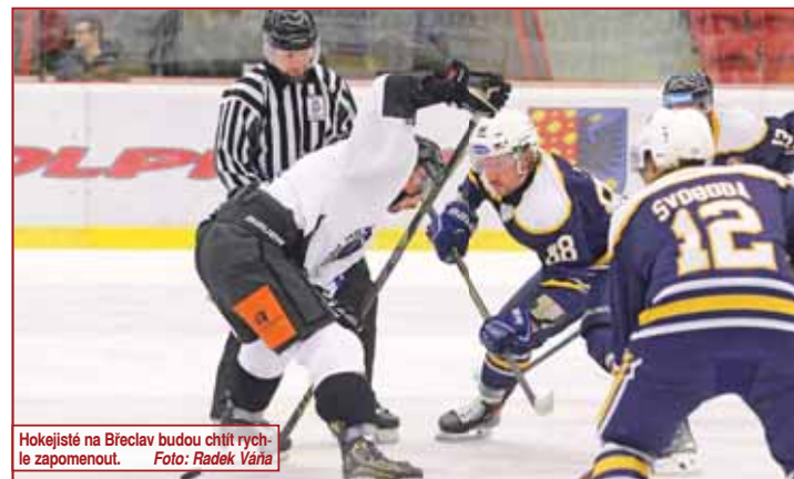
Hokejisté na Břeclav budou chtít rychle zapomenout.