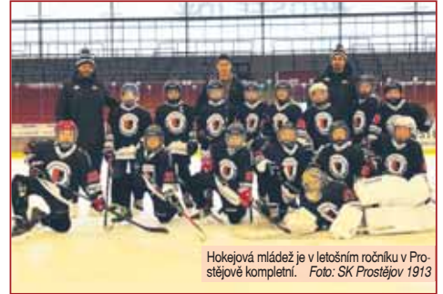
Hokejová mládež je v letošním ročníku v Prostějově kompletní.

PROSTĚJOV Hokejová mládež v Prostějově spadá pod křídla klubu SK Prostějov 1913 a už se pomalu blíží její první dekáda. V ročníku 2024/2025 se může eskáčko pochlubit kompletní strukturou mládeže, kde každý ročník hraje své soutěže a při pohledu na nejmladší ročníky to vypadá, že by nemusely mít strach ani do dalších let. Z velmi pozitivních věcí se dá vypíchnout zařazování některých juniorů do hlavního mužstva, dominance dorostu Prostějova nad konkurencí, ale třeba také fakt, že klub disponuje hokejovými třídami, díky kterým se mohou hráči ještě více zdokonalovat. I přes nemožnost nafouknout zimní stadion pro více tréninků tak může v rámci sportovního hlediska v klubu panovat spokojenost.