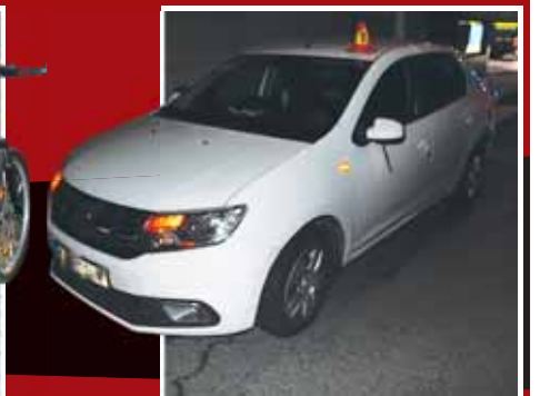
Po srazce s autem byl cyklista převezen do nemocnice a posléze zatčen policií.