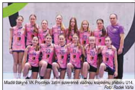
Mladší žákyně VK Prostějov zatím suverénně vládnou krajskému přeboru U14.

PROSTĚJOV Vynikajícím způsobem si zatím počínají mládežnické volejbalistky VK Prostějov věkové kategorie U14 v tomto ročníku krajského přeboru mladších žákyní, kde i po třetím kole zůstávají neporaženy. Pouze vítězství tak přispívají na své konto včetně kvalifikace už čtyři turnaje od začátku sezóny 2024/25! Naposledy ke 3. dějství KP U14 nastoupily talentované Hanačky v Olomouci, kde byla na programu elitní skupina o 1. až 4. místo. A rozjetý prostějovský tým během tří tanečních duelů opět neztratil ani set! Postupně porazil VAM Olomouc C, UP Olomouc A i Přerov A shodně 2:0,