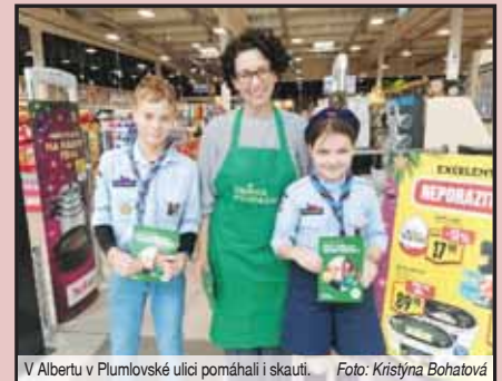
V Albertu v Plumlovské ulici pomáhali i skauti.