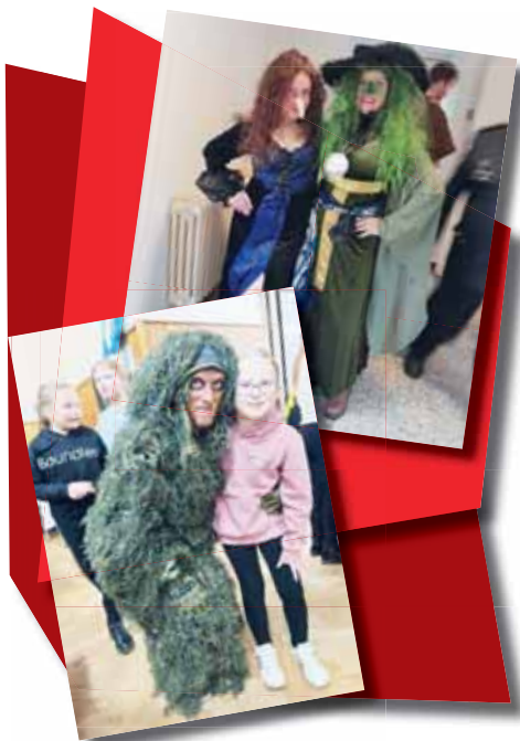
Před uspáním broučků se mnohá podzimní strašidla a pohádkové bytosti snažila děti vystrašit, ale marně... 2* foto: SDH Určice

Na programu bylo vystoupení místní mateřinky, konkrétně asi 30 dětí převlečených jako jezečci. Vystoupil rovněž taneční kroužek paní Miklíkové, taneční duo SI-MI, pěvecké trio sestry Klemešovy a na samý závěr bylo zinscenováno několik pohádek. „Na závěr předal pan Podzim žezlo paní Zimě, která se sněhulákem zvířátkem a samotného pana Podzima uspala. Pro všechny bylo připraveno bohaté občerstvení, prodalo se 1 700 losů do tomboly, hudbu k tanci a poslechu vedl DJ Vítězslav Švec z Bedihostě. Chtěla bych tímto poděkovat všem hasičům a dalším sponzorům, kteří přispěli lidem postiženým nedávnými povodněmi na severní Moravě. Materiální pomoc v hodnotě patnáct tisíc korun odvezla naše zásahová jednotka do Bělé pod Prádem a sek na pět tisíc korun jsme předali tamní mateřské a základní škole,“ uzavřela Lenka Sosíková.