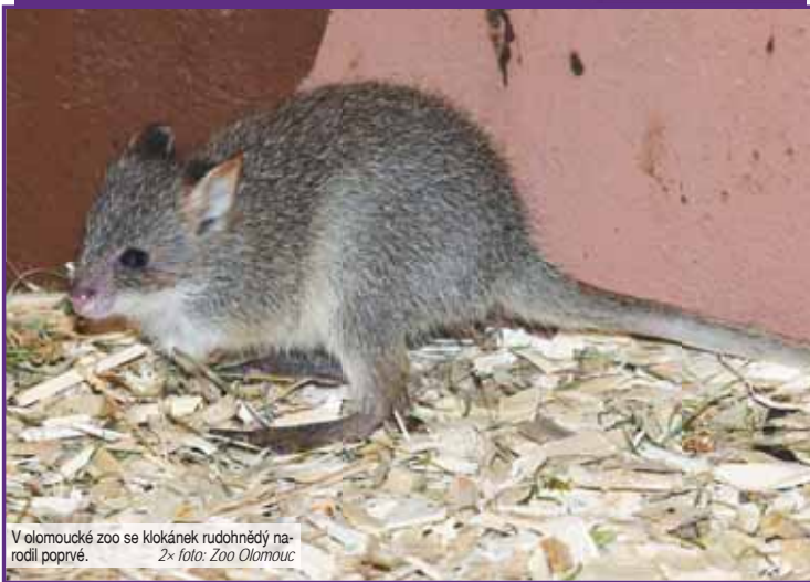
V olomoucké zoo se klokánek rudohnědý narodil poprvé.

„Po březosti trvající kolem 22 až 24 dnů samice obvykle porodí jediné mládě. Novorozená mláďata váží kolem jednoho gramu a stráví první čtyři měsíce života ve vaku. Poté zůstávají se svou matkou asi dva měsíce, než se osamostatní. Pohlavní dospělost nastává kolem jednoho roku,“ doplnila mluvčí zahrady Iveta Gronská.