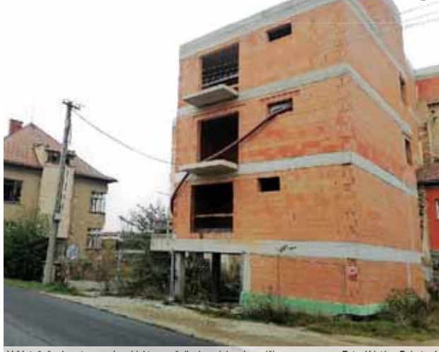
V částečně rekonstruovaném objektu se už dlouhou dobu nic neděje.