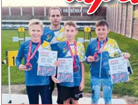
Štafeta žáků KB Prostějov vybojovala na mistrovství republiky bronz pod vedením kouče Romana Večeři.