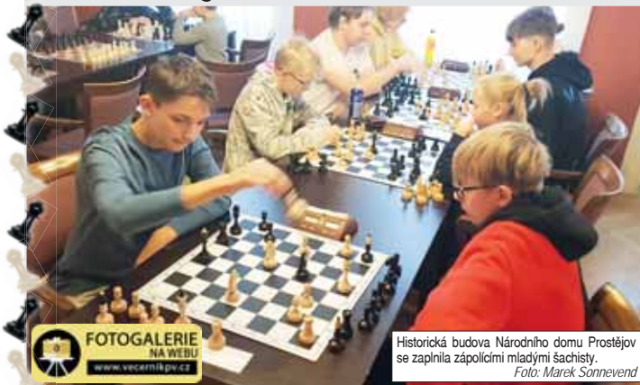
FOTOGALERIE NA WEBU www.vecernikpv.cz