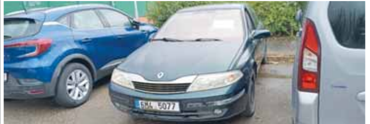
Laguna zabírá ve Fanderlíkově ulici v Prostějově parkovací místo přes půl roku.