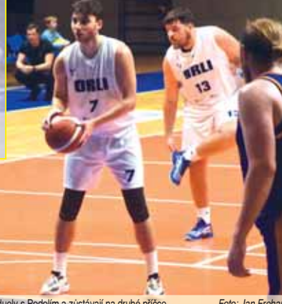
Basketbalisté zvládli oba duely s Podolím a zůstávají na druhé příčce.

„Od čtvrté minuty se vlastně dohrávalo. V některých okamžicích jsme byli trochu lehkovážní, celkově však šlo o kontrolované vítězství. Dokázali jsme podle potřeby přitlačit, když to bylo nutné. Zahrála si celá skupinka, to je vždy pozitivní,“ poznamenal kouč Orliů. (lv)