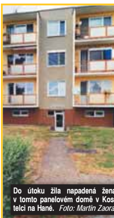
Do útoku žila napadená žena v tomto panelovém domě v Kostelci na Hané.

Velmi dobrou znalost místního prostředí využili strážníci v pondělí 9. prosince v dopoledních hodinách. Hlídka, která prováděla dohled na veřejný pořádek na náměstí T. G. Masaryka, kontaktovala Policii ČR a požádala ji o součinnost při pátrání po hledané osobě. Hlídka městské policie hledanou osobu dobře znala, a proto prověřila lokality, kde se občas podezřelý zdržuje. Strážníci o pár minut později našli jednadesátiletého muže v pátrání, kterého předali přívolaným policistům ČR k dalším úkonům.