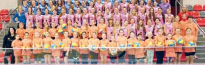
Mládežnickým volejbalistkám VK Prostějov se v této sezóně daří na všech frontách.