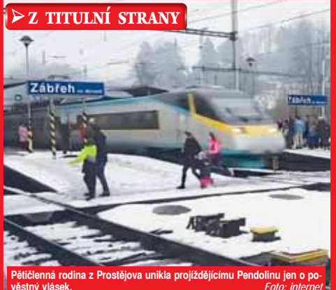
Pětičlenná rodina z Prostějova unikla projíždějícímu Pendolinu jen o poštěvní vlásek.

větší pravděpodobností bude přestupek oznámen drážnímu správnímu úřadu, jenž může přestupci udělit pokutu do 10 tisíc korun,“ uzavřel Libor Hejtmán. V průběhu minulého týdne reagovaly na sociálních sítích na toto nezodpovědné jednání rodičů z Prostějova tisíce lidí z celé republiky. „Svličníte je zaživa z kůže! Ti manželé do kriminálu a o děti ať se postará sociálka,“ znela jedna z reakcí od ženy z Olomouce. „Ať mi ten chlap nevykládá, že netušil o nebezpečí, které na kolejích hrozí vždycky,“ reagoval spíše dotazem další z diskutujících na webu celostátního deníku. „Jednoznačné ohrožení životů svých i těch dětí, a to z naprosté nedbalosti! To jako myslí vážně, aby to šetřili jako pouhý přestupek? Podivné zákony v této zemi,“ napsal zase muž na sociální síti. Ať je to jak chce, nezodpovědnost a hazardní chování obou rodičů z Prostějova je do nebe volající! (mik)