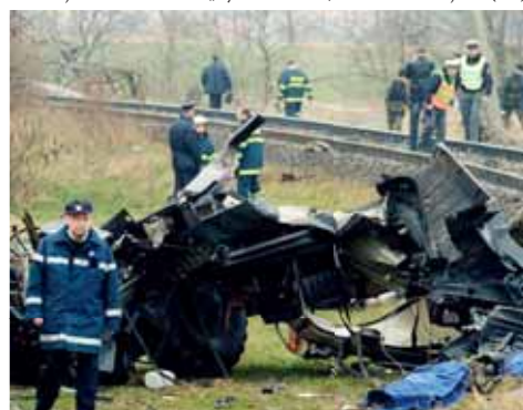
Na místě zemřelo pět příslušníků 601. skupiny speciálních sil.

natolik stresující a úděsný zážitek, že většina z nás uvítala pomoc psychologa,“ zavzpomínal jeden ze zasažených hasičů. Místo tragédie dnes připomíná šedý kámen, na němž jsou vytesána jména obětí. Svíčky a květiny tam nosí nejen rodinní příslušníci, ale i kamarádi vojáků. (kib)