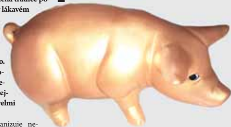
O toto zlaté prasátko se bude bojovat při nadcházejícím šachovém turnaji Rošády Prostějov.

Třídenní turnaj O zlaté prasátko 2024 se koná od 27. do 29. prosince. V pátek odstartuje ve 13.00 hodin, v sobotu i v neděli se bude pokračovat již od 9.00 hodin. Hraje se švýcarským systémem na sedm kol v tempu 2 x 60 minut a 30 sekund na každý další tah. Dějištěm se tentokrát stane