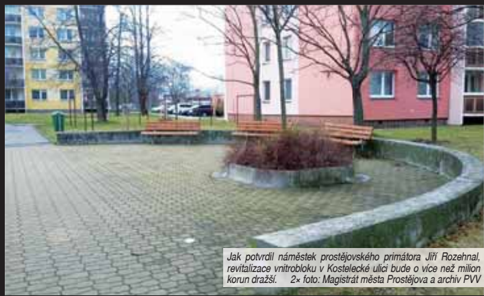
Jak potvrdil náměstek prostějovského primátora Jiří Rozeňhal, revitalizace vnitrobloku v Kostelecké ulici bude o více než milion korun dražší.

počtové opatření na rekonstrukci vnitrobloku v Kostelecké ulici. „Půjde o celkovou rekonstrukci komunikace a zpevněných ploch ve vnitrobloku ulice Kostelecká 366. Zároveň bude provedena kompletní oprava dlážděných chodníků, budou vytvořena nová parkovací místa a odstavné plochy a nová plo-