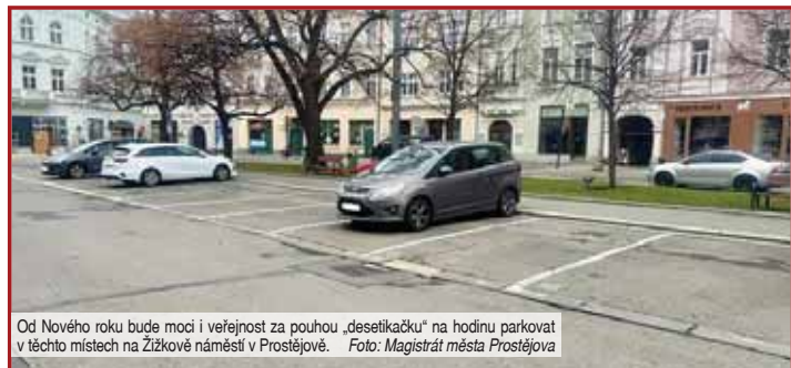
Od Nového roku bude moci i veřejnost za pouhou „desetičku“ na hodinu parkovat v těchto místech na Žižkově náměstí v Prostějově.

nabízena pouze rezidentům a abonentům k trvalému parkování. „Na základě jednání s podnikateli z centra města, které se uskutečnilo na jaře ve Společenském domě, jsme navrhli možnou změnu a tím zvýšení atraktivity parkování v blízkosti hlavního náměstí,“ zdůvodnila změ-