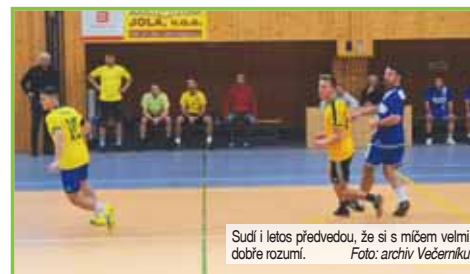
Sudí i letos předvedou, že se s míčem velmi dobře rozumí.

Slavnostní nástup všech akterů Elite Boxing Cup Gala ve Sportcentru – DDM Prostějov.