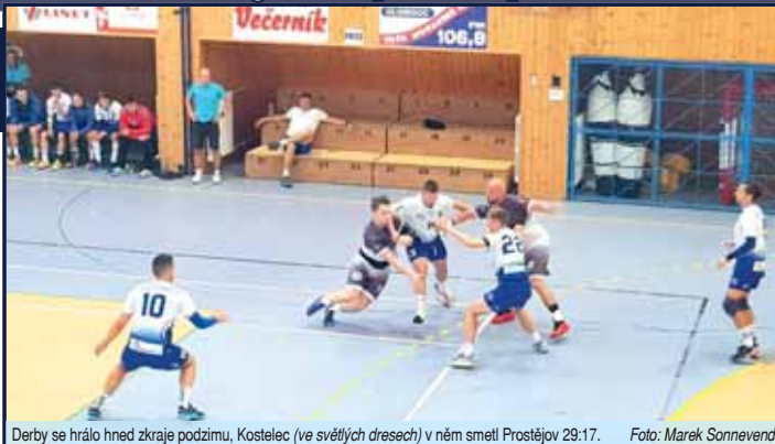
Derby se hrálo hned zkraje podzimu, Kostelec (ve světlých dresech) v něm směl Prostějov 29:17.

„Bodů jsme určitě mohli mít víc, některé zápasy se bohužel prohrály o gól. Kdybychom je aspoň zremizovali, nebo v nich dokonce zvítězili, pohybujeme se teď v klidném středu tabulky. Každopádně je i tak patrný herní posun k lepšímu, na tréninky chodí víc hráčů než dřív a s mladými kluky