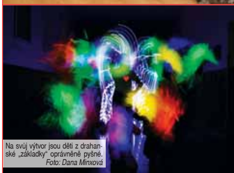
Na svůj výtvar jsou děti z drahanské „základky“ oprávněně pyšné.