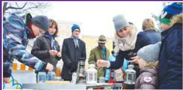
Pro Betlémské světlo lidé obvykle zamíří s přípravou lucerničkou, jinak hrozí, že by jim cestou domů mohlo zhasnout.

U prostějovského vánočního stromu se postupně vstřídají všechna tři prostějovská skautská centra: nejprve to bude středisko Jára Kaštila, dále pak středisko Děti přírody a konečně i středisko Pelikáni. Betlémské světlo se stalo novodobým symbolem Vánoc. I v té nejtěmnější době nám zvěstuje víru v lepší budoucnost. Lidé si jej uchovávají až do Štědrého dne a někteří po celé vánoční svátky. Pokud si jej nestihnete v sobotu odnést, budete mít možnost i po celý následující týden v některém z prostějovských kostelů, do nichž jej skauti v neděli roznesou. (mls)