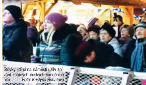
Stovky lidí si na náměstí užily zpívání známých českých vánočních hitů.

PROSTĚJOV Ve středu vpoledvečer rozezněly hlavní náměstí koledy. Prostějov se i letos zapojil do celostátní akce, která má v republice tradici už čtrnáct let. Vánoční písně si spolu se sborem Proměny zazpívaly stovky lidí.