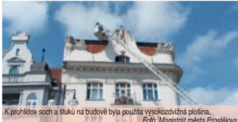
K prohlídce soch a štuků na budově byla použita vysokozdvizná plošina.

PROSTĚJOV V pátek 23. srpna odpoledne zabránila jen shoda náhod velké tragédii. Z městského domu, který stojí na rohu Kravčovy ulice a hlavního prostějovského náměstí, spadla hlava sochy nacházející se u střechy objektu. Naštěstí nikoho a nic nezasáhla. Město následně zajistilo druhou sochu nacházející se na domě a o dalším postupu jednalo s Národním památkovým ústavem.