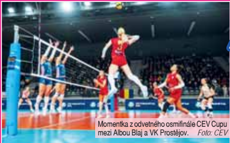
Momentka z odvetního osmiřádného CEV Cupu mezi Albou Blaj a VK Prostějov.

BLAJ, PROSTĚJOV Stejně jako v minulém ročníku Challenge Cupu volejbalistky VK Prostějov i tentokrát na evropské pohárové scéně nedosáhly na žádné dílčí vítězství ani postup a vyřadil je hned první jejich soupeř. Tentokrát se však nemají absolutně za co stydět, neboť v osmiřádné CEV Cupu žen 2024/25 notně potrápily vysoce favorizovanou Albu Blaj. Jak v prvním vzájemném duelu doma, tak především ve střední odvetě venku.