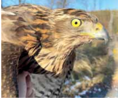
Mladá samice se vrátila do volné přírody. Její žluté oči postřehnou sebe-menší pohyb.