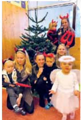
V MC Cipísek je vše o dobrém kolektivu.

A tak děti za pomoci rodičů natrénovaly válení těsta na modelíně, naplnění formiček v kinetickém písku, prosívání mouky, třídily vánoční ozdoby, pouštěly skořápky po vodě, zazpívaly koledy, povídaly si o tradicích a zapojily se do dalších vánočních aktivit.