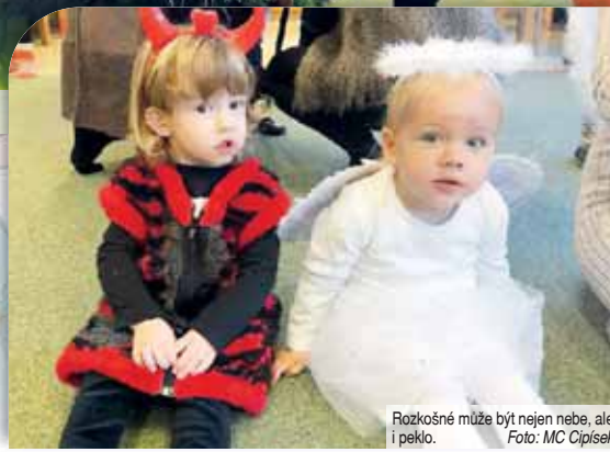
Rozkošné může být nejen nebe, ale i peklo.

Mateřské centrum Cipísek přeje všem krásný adventní a vánoční čas plný radosti a pohody.