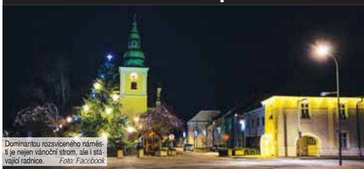
Dominantou rozsvíceného náměstí je nejen vánoční strom, ale i stávkující radnice.

NĚMČICE NAD HANOU Pro některé lidi jsou Vánoce hlavně o světylkách. Nemusí se přitom vždy nutně jednat o pestrobarevné řetězy blikající tak rychle, že by z nich nepřipravený člověk mohl dostat epileptický záchvat. Rozzáhlou, nicméně vkusnou výzdobou se letos doslova blýskli v Němčicích nad Hanou.