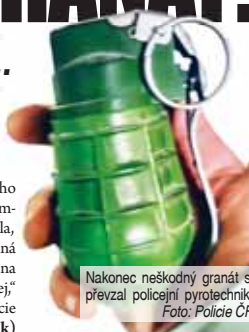
Nakonec neškodný granát si převzal policejní pyrotechnik.

„V úterý 10. prosince večer jsme přijali oznámení od třiatřicetiletého muže o nalezení granátu v Prostějově. Oznamovatel uvedl, že po nájemníkově vyklízení bytu a v jedné tašce, kterou mezitím odnesl do vozidla, nalezl ruční granát. Kontaktoval nájemníka, který mu sdělil, že se jedná o granát s odstraněnou rozbuškou. Policie pyrotechnik po příjezdu na místo potvrdil, že se jedná o granát URG 86 bez náplně a převzal si jej,“ informoval Libor Hejtman, tiskový mluvčí Krajského ředitelství Policie ČR v Olomouci. (mik)