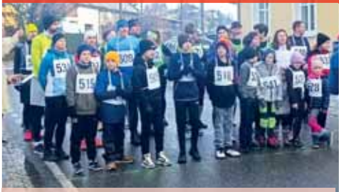
Vioe než tři desítky běžců vyrazily už po dvaadvacáté v Otaslavicích.

OTASLAVICE V sobotu 7. prosince se už po dvaadvacáté setkali nášinci pro běžecký sport v areálu sokolovny v Otaslavicích, kde odstartoval další ročník Mikulášského běhu pořádaný zdejší Sokolem. Letošní ročník přespolního běhu přilákal více než tři desítky běžců a stejně jako loni se ani letos organizátorům nevyhly sněhové komplikace. Ty však nebyly tak nepříznivé jako v předchozím roce, ale z přespolního běhu se musel stát silniční. Trať o délce téměř osm kilometrů zdolali dospělí, poloviční zvládli mládežníci a nejmenší si dali kilometr. Dominantní výkony pak předvedli zástupci atletiky Alojzov.