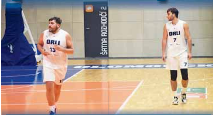
Orlí zvládli vstup do nového kalendářního roku.

PROSTĚJÓV První utkání nového roku basketbalisté Prostějova zvládli, přestože se jim do cesty postavila silná Karviná. V zajímavém souboji Orlí zvítězili 83:72, klíčový byl především závěr třetí čtvrtiny, v němž si vypracovali dvouciferné vedení.