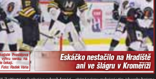
Nějaký Prostějov se v úvodu utkání v Kroměříži neprováděl.

PROSTĚJOV Z cestovním mimo svůj domov se pro hokejisty SK Prostějov 1913 začíná třetí noční míra. Sestřena trenérů Michala Janěčka totiž pokračuje ve špatných venkovních výsledcích a ani tenčítky se jim ve dvou mezinostech nepovedou negativní sérii zlomit. O čtvrté utkání přitom byla dost odlišná. Ve čtvrté do Uheršské Hradiště odcestovali noční ombrový kádr zatímco v sobotu v Kroměříži už nechybí žádní hráči. Bude však ani jeden z nich nepříteln.