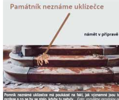
Pomník neznámé uklízečky má poukázat na fakt, jak významné jsou to profese a co se by se stalo, kdyby tu nebyly.