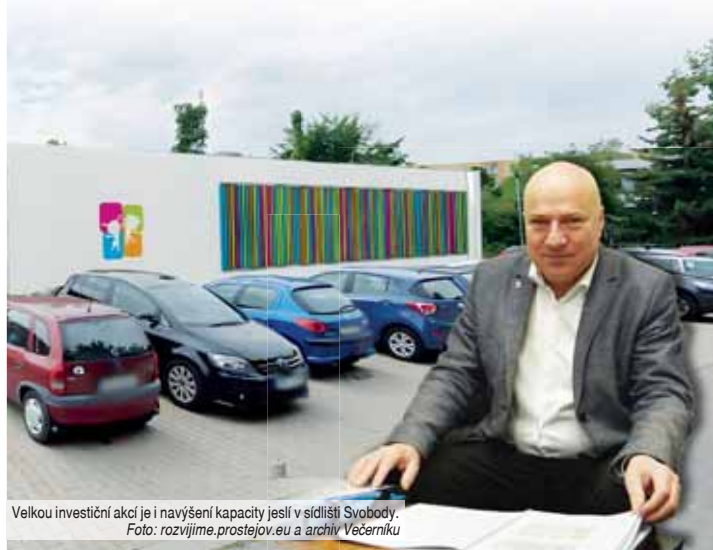
Velkou investiční akcí je i navýšení kapacity jesi v sídlišti Svobody.

PROSTĚJOV V prosinci byl na posledním zasedání zastupitelstva města schválen rozpočet města na rok 2025, jehož součástí jsou i stavební investice a opravy v přibližné výši 476 milionů korun. Mezi nejvýznamnější stavby patří dopravní terminál Újezd a parkovací dům a nové náměstí v Uprkové ulici.