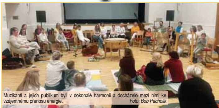
Muzikanti a jejich publikum byli v dokonalé harmonii a docházelo mezi nimi ke vzájemnému přenosu energie.