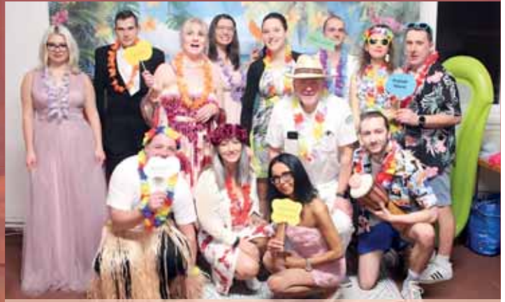
Všichni účastníci plesu v Kelčicích měli na sobě havajské věnce, využít mohli i nafukovací člun.

Dobrovolní hasiči už mají v letošním roce také za sebou jeden zásah, a to u auta, které sjelo z dálnice, protože z něj vytékal olej. V průběhu uplynulého roku však pomáhali i při dramatictějších situacích. „Hned začátkem léta nás zasáhly přívalové deště, takže jsme přímo v obci na několika místech odčerpávali vodu ze sklepů a zahrad. V září jsme se pak ve svém volném čase vypravili do Jeseníků, konkrétně do obcí Česká Ves