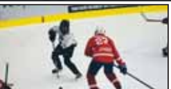
Devětáček doma převládá nad favoritem nedělní.