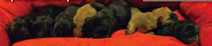
Štěňátko v době převzetí do útulku ještě žilo, jejich stav byl takový, že už se přes veškerou péči nedala zachránit.

Z útulku v Čechách pod Kosířem doputovala SMUTNÁ ZPRÁVA