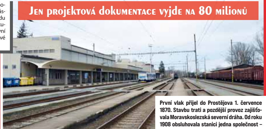
Rekonstrukci si hlavní nádraží zasluží. Nástupiště zde neexistují.

Správa železnic zatím nevydala žádné prohlášení týkající se postupu v případě prostějovského místního nádraží. O jeho bezúplatném převodu se již loni předběžně dohodla s městem Prostějov. Zastupitelstvo ho schválilo loni v červnu, na straně státu, který nemovitostí vlast-