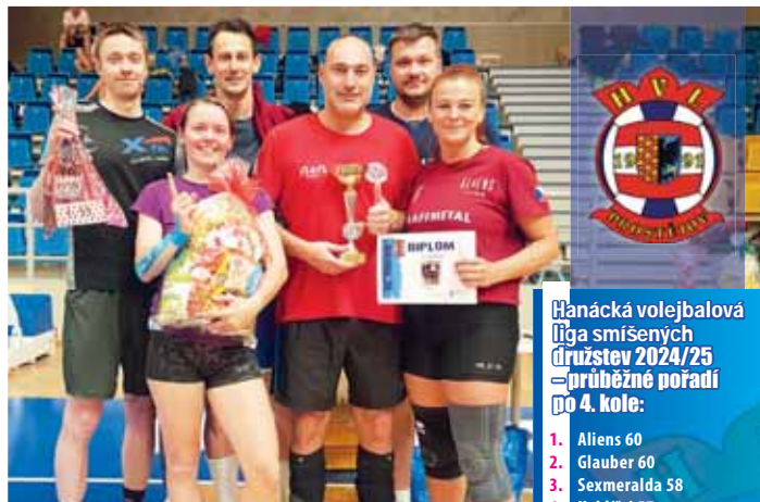
Průběžném pořadí vedoucí obhájce titulu.

PROSTĚJOV Další, v pořadí už 34. ročník Hanácké volejbalové ligy smíšených družstev hrané tradičně v Prostějově, má za sebou již více než polovinu své základní části. Dosud proběhla čtyři kola ze sedmi – a oblíbená soutěž pro týmy tvořené muži i ženami současně se ve své aktuální sezóně 2024/25 vyznačuje velkou vyrovnaností. Přesto jsou v průběžném čele finalisté minulého ročníku, když vede obhájce loňského titulu Aliens se stejným ziskem 60 bodů jako za ním těsně druhý Glauber. Pouze dva bodyky přitom ztrácí třetí Sexmerala a jen o další bod zpět jsou čtvrtí Koblížci, zatím největší