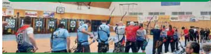
Lukostřelci Kostelce odstartovali sezónu parádně.