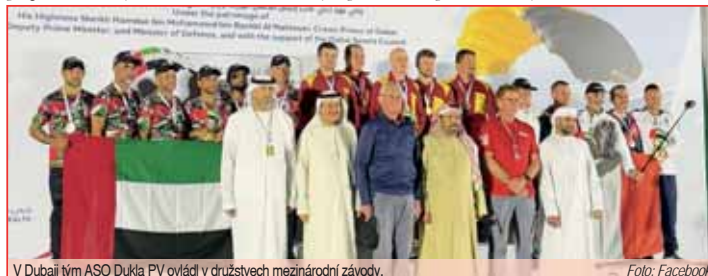
V Dubaji tým ASO Dukla PV ovládl v družstevě mezinárodní závody.

se pořadatelům následně povedlo závod dokončit. Skákalo se stejně jako předchozí rok vedle asi tři sta metrů vysokého hotelu na mořskou pláž za přítomnosti velice těžko okoukatelných výhledů, tím zajímavější jsou tam podmínky k přistání,“ přiblížil Jiroušek originalitu zápolení v metropoli Spojených arabských emirátů.