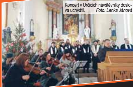
Koncert v Určicích návštěvníky doslova uchvátil.

URČICE První akcí letošního roku v Určicích, kde to v posledních letech kulturními i společenskými akcemi žije, byl benefiční Tříkrálový koncert v kostele svatého Jana Křtitele. Na něm v neděli 12. ledna vystoupil smíšený sbor z Lipníka nad Bečvou společně s hosty a pro návštěvníky připravil velmi vydařený program.