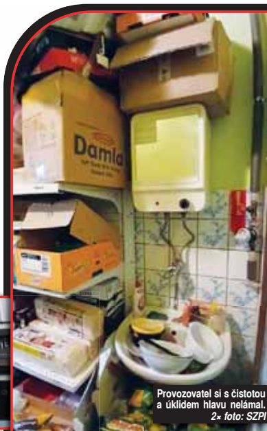
Provozovatel si s čistotou a úklidem hlavu nelámá.

Od 10. ledna provozovatelé zakázali užívání prostor pro prodej nebalených pekařských výrobků. Provozovna jako celek uzavřena nebyla. (kib)