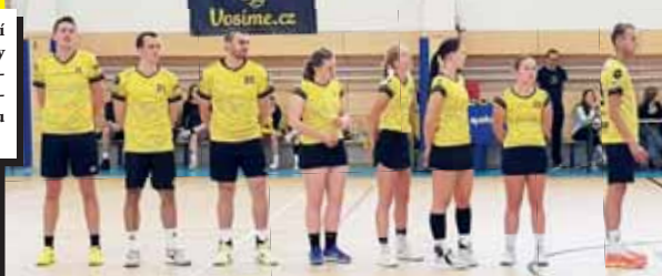
Prostějovští korfbalisté poprvé v této sezóně přivítají doma České Budějovice.

„Nejprve musíme porazit Budějovice, a pokud zároveň KK neztratí ve Znojmě, potřebovali bychom pak vyhrát v Brně aspoň o deset košů, což je opravdu dost. Právě takovým rozdílem jsme totiž podlehli v úvodním vzájemném utkání probíhajícího ročníku. Každopádně jít do play-off jako první nebo druhý celek tabulky nic extra neřeší,“ nedělal si Konečný zbytečně těžkou hlavu.