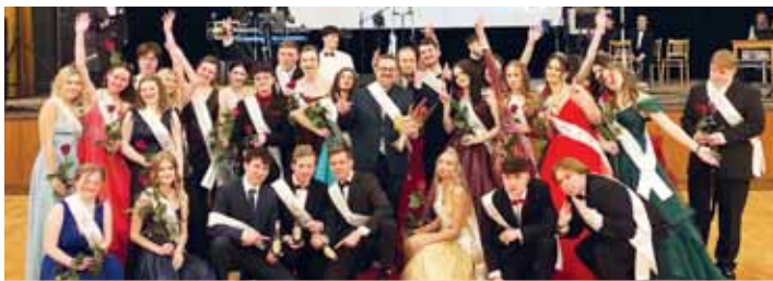
Maturitní ročník Obchodní akademie si ples náravně užily.

O kolikátý ročník reprezentačního plesu Obchodní akademie se jedná, to byly dlouhé roky spíše spekulace. Ty však už po letošku