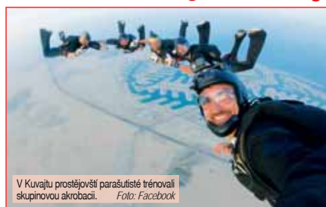
V Kuvajtu prostějovští parašutisté trénovali skupinovou akrobacii.

Zkraje prosince pak výprava Dukly PV vycestovala znovu na Blízký východ, tentokrát do Dubaje. Na programu tam byla mezinárodní