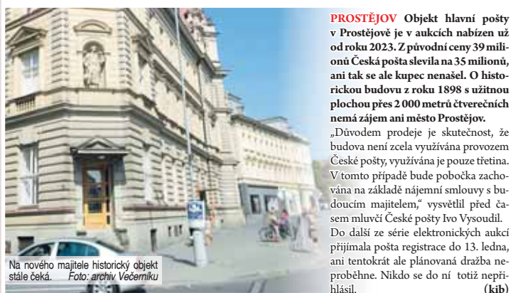
Na nového majitele historický objekt stále čeká.

PROSTĚJOV Objekt hlavní pošty v Prostějově je v aukcích nabízen už od roku 2023. Z původní ceny 39 milionů Česká pošta slevila na 35 milionů, ani tak se ale kupec nenašel. O historickou budovu z roku 1898 s užitnou plochou přes 2000 metrů čtverečních nemá zájem ani město Prostějov.