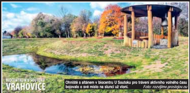
BIOCENTRUM U SOUTOKU VRAHOVICE

Do v pořadí 4. ročníku participativního rozpočtu přihlásili obyvatelé Prostějova celkem 27 projektů. Našli se i tací, kteří podali maximální počet, tj. tři. V této chvíli se ještě doplňují, analyzují a následně projdou procesem posouzení. Veřejnosti budou v březnu 2025 představeny ty, které postoupí do dubnového hlasování.