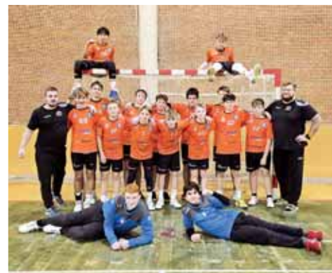
Starší žáci TJ Sokol Centrum Haná po úspěšné zvládnuté kvalifikaci o postup do Žákovské ligy ČR 2024/25 v Holesově.

PROSTĚJÓV Už třetím rokem v řadě za sebou působí mládežnickí házenkáři TJ Sokol Centrum Haná v celostátní Žákovské lize starších žáků ČR, do níž se tentokrát probojovali úspěšnou kvalifikací v Holesově. Elite tuzemská soutěž dané věkové kategorie se hraje vždy během zimního a jarního období od prosince do května, její aktuální ročník 2024/25 má zatím za sebou úvodní kolo.