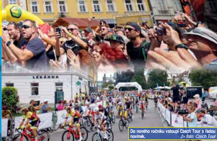
Do nového ročníku vstoupí Czech Tour s řadou novinek.

Organizátoři slibují pro rok 2025 řadu novinek, včetně nových tras, startovních a cílových měst a bohatého doprovodného programu. „Blíží informace budeme postupně zveřejňovat,“ uzavřel Leopold König.