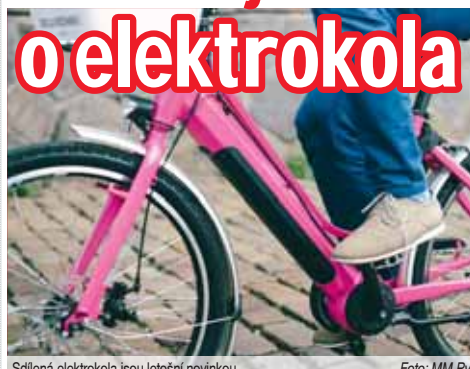
Sdílená elektrokola jsou letošní novinkou.