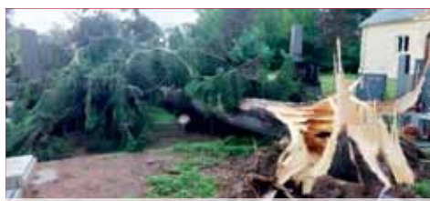
Na vichřici doplatily stromy na městském hřištovi.

„Jedná se o neoperspektivní dřeviny s výrazně zhoršeným zdravotním stavem a silně narušenou stabilitou (podezření na infekci kořenového systému, nakloněné kmeny). Nachází se ze zejména v lokalitách městských parků Kolářovy sady, Smetanovy