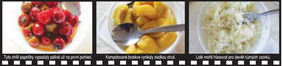
Tyto chilli papričky vypadaly pálivé už na první pohled.