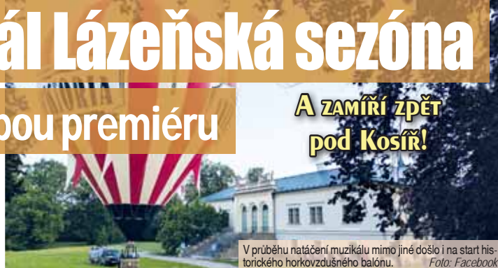
V průběhu natáčení muzikálu mimo jiné došlo i na start historického horkovzdušného balónu.

Vzpomínáte? První dva červencové dny byl zámek v Čechách pod Kosířem zcela uzavřen. Důvodem bylo natáčení filmového muzikálu Lázeňská sezóna, které se následně přesunulo do zámeckého parku. Ten již začátkem ledna zazil svoji světovou premiéru v olomouckém kině Metropol. Na jáře by se měl film promítat také v zámecké oranžerii. Zámek i jeho park se proměnily v prostředí prvorepublikových Mariánských Lázní. I proto tu