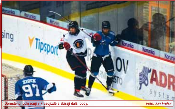
Dorostenci pokračují v krasojízdě a sbírají další body.