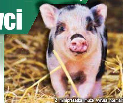
Z miniprasátka může vyrůst normální pašák.