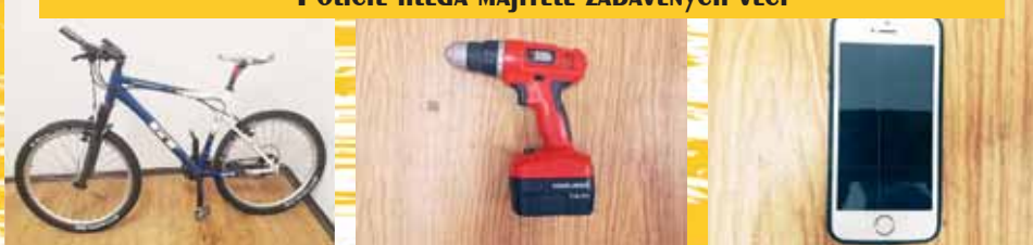
Policisté hledají například majitele jízdního kola, vrtačky nebo mobilního telefonu. Ostatní fotografie ukradených věcí jsou veřejnosti k dispozici na úřední desce města.