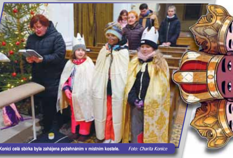
V Konici celá sbírka byla zahájena požehnáním v místním kostele.

KOLIK SE LETOS VYBRALO V OBCÍCH NA KONICKU?