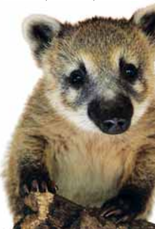
Chov nosálů podléhá registraci a povolení k chovu zvířat vyžadujících zvláštní péči.

Nenáročný, ale obří. Achatina velká je druh suchozemského afrického šneka, kterému se v zajetí docela daří. V dospělosti měří až 30 centimetrů a váží až 300 gramů. Dožívá se až sedmi let. Má velkou pružovanou ulitu a tělo černé barvy. „Nejsou nijak nároční, konzumují ovoce, zeleninu, nepohrdnou vařenými těstovinami či kousky sýra,“ říká Robert, který obří šneky chová již bezmála deset let. „Dají se ochočit a jsou nenároční.“