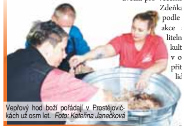
Vepřový hod boží pořádají v Prostějovičkách už osm let.

„Akcce začala v pátek, kdy se škarvily skvarky a porcovalo maso, z něhož se pak připravilo několik lahodných pokrmů. V sobotu, zatímco venku v kotli bublala tradiční polévka, se v kuchyni peklo maso a vařilo zelí,“ uvedla pro Večerník starostka obce