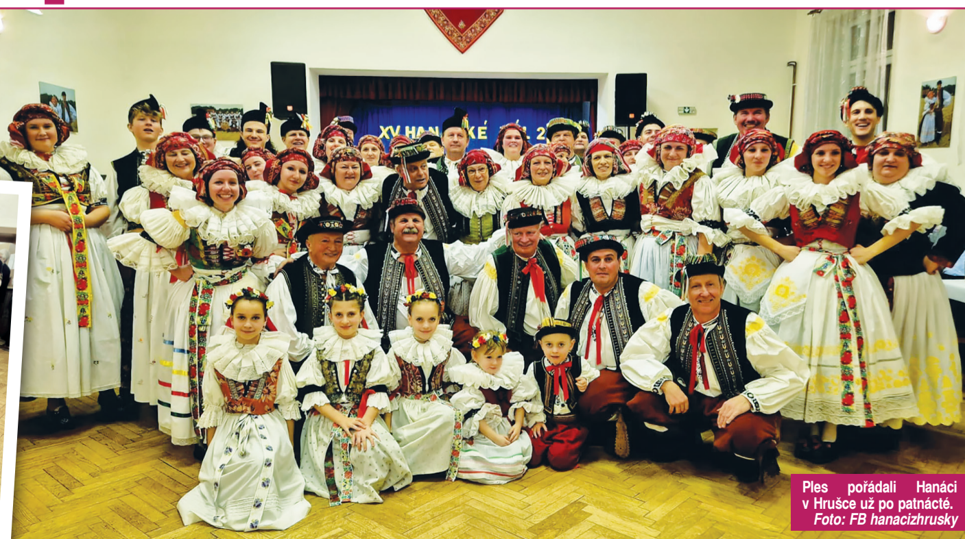
Ples pořádali Hanáci v Hrušce už po patnácté.