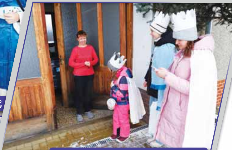
Lidé vítali tři krále obvykle se širokým úsměvem.