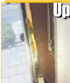
Jeden z bratrů se při údajném „dohadování“ natlačil na dveře domu a způsobil škodu.

PROSTĚJOV Během předminulé soboty řešili prostějovští strážníci kuriózní případ poškození soukromého majetku. V odpoledních hodinách vyjžděla hlídka prověřit telefonické oznámení týkající se neúmyslného rozbití vstupních dveří do domu v Prostějově, které měl způsobit jeden z kamarádů oznamovatele. „Strážníci na místě zkontaktovali devatenáctiletého mladíka a dva bratry, jeho kamarády ve věku 16 a 20 let. K rozbití dveří došlo tím způsobem, že se bratři mezi sebou dohadovali a při tom starší z nich couval a zakopl o vyvýšený schodek u vchodu domu a upadl na zamknuté dveře. Ty se otevřely, a při tom se vylomilo kování v zárubni dveří, čímž došlo ke škodě na majetku,“ uvedla Tereza Greplová z Městské policie Prostějov. Strážníkům se podařilo zjistit a následně i telefonicky