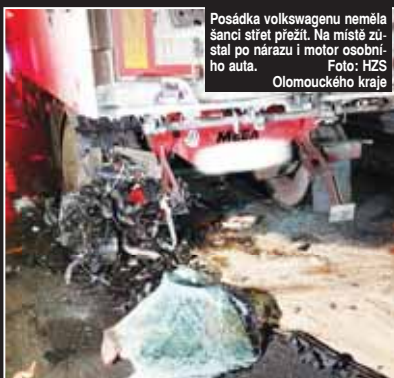
Posádka volkswagenu neměla šanci střet přežít. Na místě zůstal po nárazu i motor osobního auta.

BRODEK U PROSTĚJOVA Minulé úterý krátce po půlnoci došlo na dálnici D46 u Brodku u Prostějova k tragické nehodě. Osobní vůz narazil do odstavěného kamionu a následky byly fatální. Na místě zemřel řidič a jeho spolujezdkyně, řidič kamionu byl zraněn lehce. Provoz byl omezen do ráno hodin.