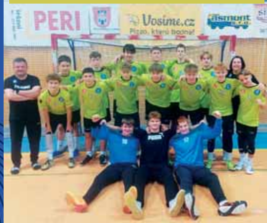
Mladším dorostencům TJ Sokol Centrum Haná podzim ve druhé lize vyšel nadmíru dobře.

PROSTĚJOV Druhý únorový vikend je termínem, kdy propukne jarní fáze rovněž v dorosteneckých soutěžích mládežnických házenkářů, v nichž působí talenty Házenkářské akademie Olomouckého kraje a oddílů TJ Sokol Centrum Haná. Jak jsou zatím na tom a co je v jarní části čeká? (son)