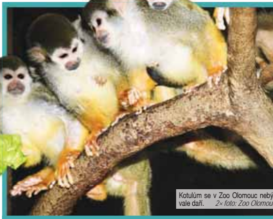
Kotulům se v Zoo Olomouc nebyvale daří.

travě v jejich korunách. Živí se nejrůznějšími plody, květy, hmyzem, nektarem i drobnými obratlovci. Kotulové tvoří až stočlenné tlupy složené z druhů novosvětských primátů, nejčastěji s uakari či s malpami. „Samice rodí jediné mládě po pílnoční březosti, které