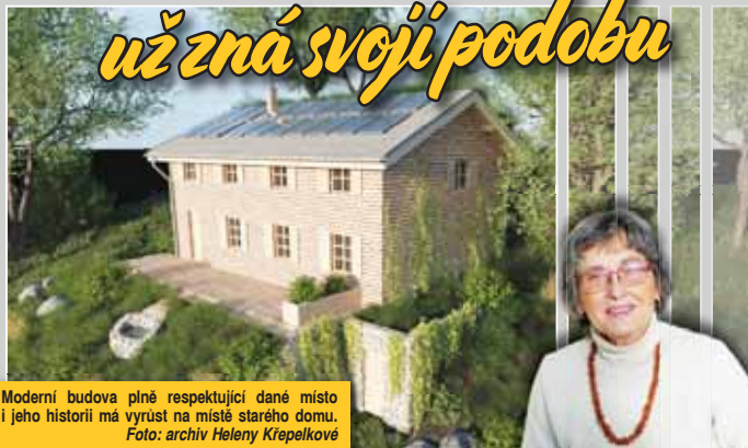
Moderní budova plně respektující dané místo i jeho historii má vyrůst na místě starého domu.

STARECHOVICE Vypadá to nádherně, snad se to podaří dotáhnout až do konce. Večerník získal návrh nového centra, které by mělo vyrůst na úpatí Kosíře v prostoru zvaném Ulmanka. Právě zde se připravují velké a zajímavé věci začínající nabírat konkrétní rozměry.