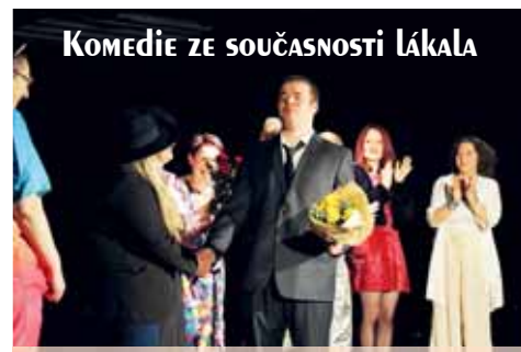
Představení si herci užívali, stejně jako diváci.

Provozovatelem Divadla Kolárka je Spolek CIRCULUS. Jeho činnost vyplývala z potřeby bývalých absolventů ZUŠ Blansko pokračovat v divadelní tvorbě. V čele spolku