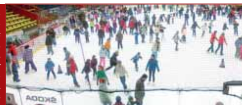
Přestože je o bruslení veřejnosti na zimním stadionu velký zájem, možnosti jsou minimální.

no i pravidelné bruslení veřejnosti? V rozpočtu města na rok 2025 je pro stadion vyčleněna nemalá částka, tak věřím, že bude možné ho využít i častěji než jednou v roce na Vánoce.“ Odpověď provozovatele, kterým je Sportcentrum – DDM Prostějov, zprostředkovala referentka informačních služeb Lenka Gartnerová: „Počet hodin veřejného bruslení je negativně ovlivněn skutečností, že jako jeden z mála zimních stadionů musí zajistit herní plochu pro dva hokejové kluby a také velmi obsáhle fungující klub