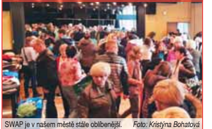
SWAP je v našem městě stále oblíbenější.

Lidé si zdarma odnášeli věci, které se jim hodí