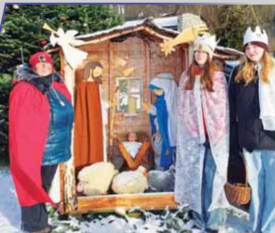
V Malenách se kolednice sešly u zdejšího malebného betlému.