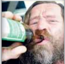
Ilustrační foto: internet

V pátek 24. ledna v odpoledních hodinách si strážníci v Olooucké ulici povšimli trojice osob popíjejících lahvové pivo nedaleko Domu služeb. Pánové ve věku 48, 45 a 24 let se nacházeli na místě, kde konzumaci alkoholu zakazuje obecně závazná vyhláška města Prostějova. O protiprávním jednání byli poučeni. Všichni tři strážníkům uvedli, že o platnosti vyhlášky vědí. Projednání přestupku na místě odmítli. Z části rozpitý alkohol jim byl hlídkou odebrán. Celá záležitost byla předána k dořešení příslušnému správnímu orgánu. Ten má možnost uložit za porušení pravidel uvedených ve vyhlášce města pokutu až do výše 100 tisíc korun.