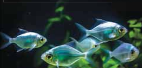
Ilustrační foto: internet

A že prej správný podnikatel musí mít tvrdé srdce. Houbelec.