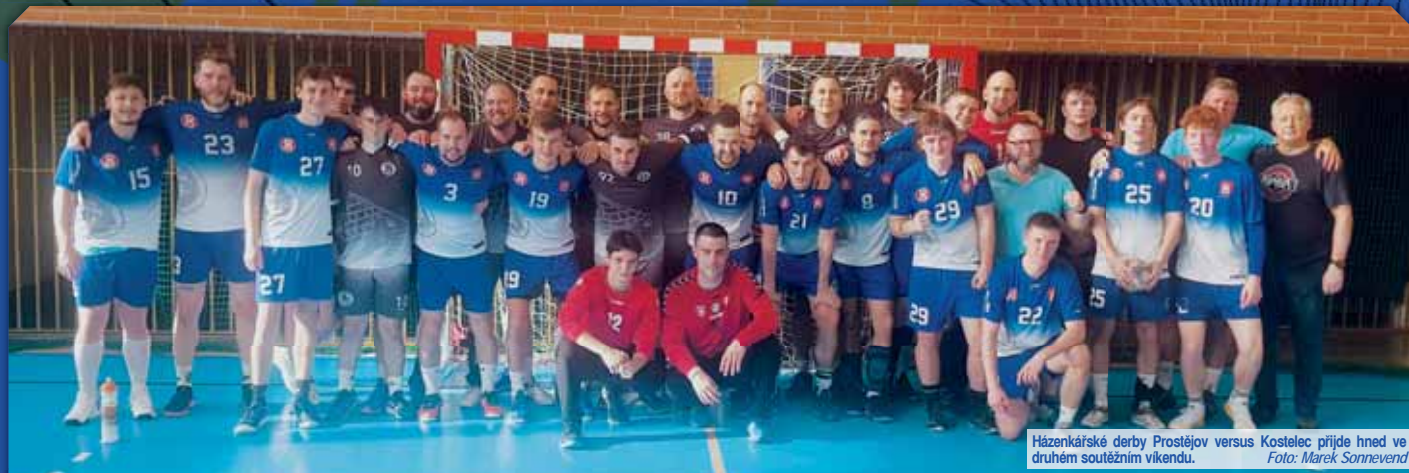
Házenkářské derby Prostějov versus Kostelec přijde hned ve druhém soutěžním vikendu.

PROSTĚJOV O nejbližším vikendu odstartuje házenkářům TJ Sokol Kostelec na Hané HK i Sokola II Prostějov odvetná část 2. ligy mužů ČR 2024/25. Oba zástupci našeho okresu ve třetí nejvyšší tuzemské soutěži dospělých dlouhodobě hrají skupinu Jižní Morava, kde jaro zahájí v sobotu 8. února shodně venku.