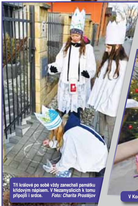
Tři králové po sobě vždy zanechali památku křídovým nápisem. V Nezamyslicích k tomu připojili i srdce. Foto: Charita Prostějov

Letos se hodně vybralo i v Polišenského ulici v Prostějově. Foto: Charita Prostějov