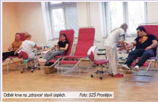
Odběr krve na „zdravce“ slavil úspěch.