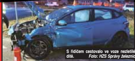
S řidičem cestovalo ve voze nezletilé dítě.

PROSTĚJOV Na přejezdu v Kostelecké ulici nedaleko Rudolfova pekařství došlo minulý úterý ráno ke střetu vlaku s osobním autem. Nehoda si vyžádala zranění řidiče, do nemocnice bylo převezeno i nezletilé dítě!