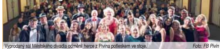
Vyprodáný sál Městského divadla odměnil herce z Pivína potleskem ve stoje.

PROSTĚJOV, PIVÍN Holt někdo to rád hot se jmenuje představení, které v neděli 26. ledna v Městském divadle v Prostějově představilo pivníské seskupení ochotníků. Před zaplněným sálem rozehráli herci skvělou komedii na motivy legendárního filmu Někdo to rád horké.