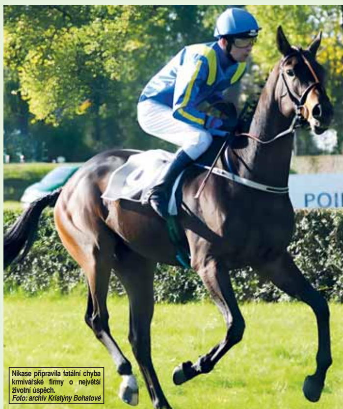
Nikase připravila fatální chyba krmivářské firmy o největší životní úspěch.