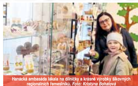
Hanácká ambasáda lákala na dílničky a krásné výrobky šikovných regionálních řemeslníků.