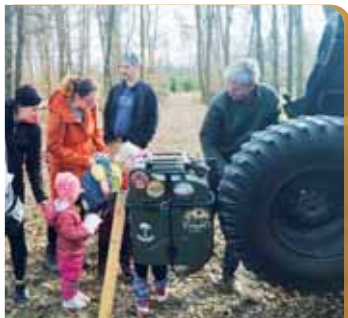
V Otaslavicích vyšla první jarní akce perfektně.

OTASLAVICE Čtvrtstoletí oblíbené první jarní akce v Otaslavicích nemohlo pro všechny zájemce i organizátory vyjít lépe. V sobotu 22. března ukázal teplotěm až ke dvaceti stupňům a s hřejivými slunečními paprsky vyrazil zástup více než stovky registrovaných směrů oblíbená destinace. I pětadvacitý ročník pak provázela skvělá nálada a po zdravotní vycházce nemohlo chybět ani občerstvení v místní sokolovně, kde proběhl i start.