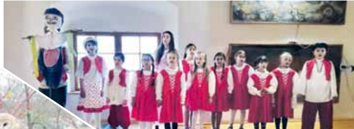
O kulturní program se postaraly děti. Představily i Moranu.