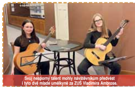
Svůj nesporný talent mohly návštěvníkům předvést i tyto dvě mladé umělkyně ze ZUS Vladimíra Ambrose.