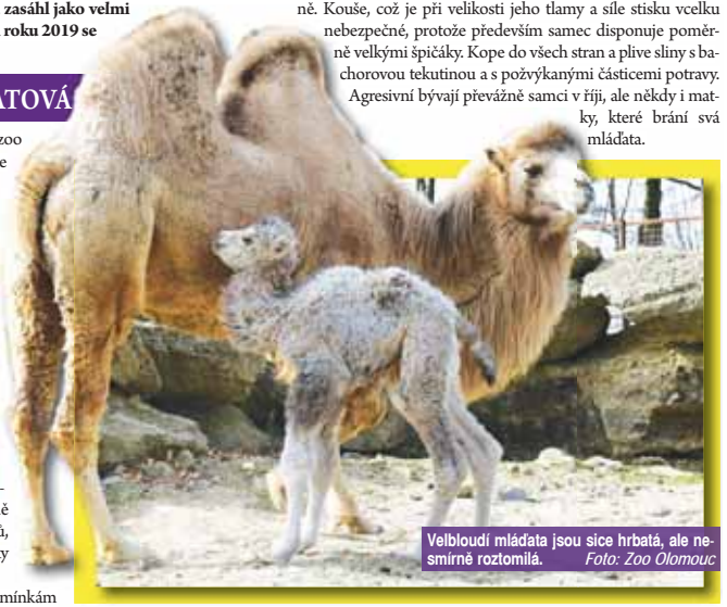
Velbloudí mláďata jsou sice hrbatá, ale nesmírně roztomilá.

neskonale dobře přizpůsobení. Jejich srst, která slouží jako velmi dobrý tepelný izolant, je dokáže chránit před mrazy až -40 °C. Úzké šterbiny nozd se při písečné bouři semknou a brání pronikání jemných pískových částic. Uši chrání husté chomáče srsti a oči dlouhé dvojité řasy. V případě nutnosti zakryje velbloud oční bulvu průhledným víčkem a začne šlehat, aby vyplavil případná zrnka písku. Pociťuje-li velbloud ohrožení či se potřebuje bránit, používá 3 zbraně. Kouse, což je při velikosti jeho tlamy a síle stisku vcelku nebezpečné, protože především samec disponuje poměrně velkými špičáky. Kope do všech stran a plive sliny s bahorovou tekutinou a s požívanými částicemi potravy. Agresivní bývají převážně samci v říji, ale někdy i matky, které brání svá mláďata.