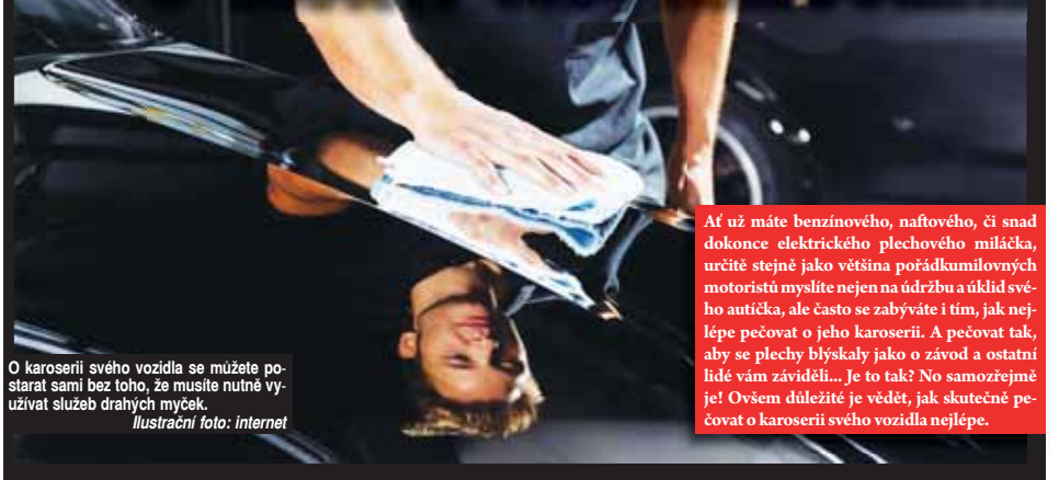
O karoserii svého vozidla se můžete postarat sami bez toho, že byste nutně využívali služeb drahých myček.

Ať už máte benzinového, naftového, či snad dokonce elektrického plechového miláčka, určitě stejně jako většina pořádkumilovných motoristů myslíte nejen na údržbu a úklid svého autíčka, ale často se zabýváte i tím, jak nejlépe pečovat o jeho karoserii. A pečovat tak, aby se plechy blýskaly jako o závod a ostatní lidé vám záviděli... Je to tak? No samozřejmě je! Ovšem důležité je vědět, jak skutečně pečovat o karoserii svého vozidla nejlépe.