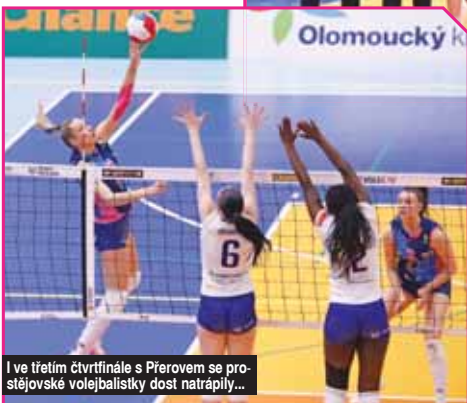
I ve třetím čtvrtfinále s Přerovem se prostějovské volejbalistky dost natrápily...

... a jejich výrazy po výsledkově hladkém postupu do semifinále tak by spíše rozpačité.