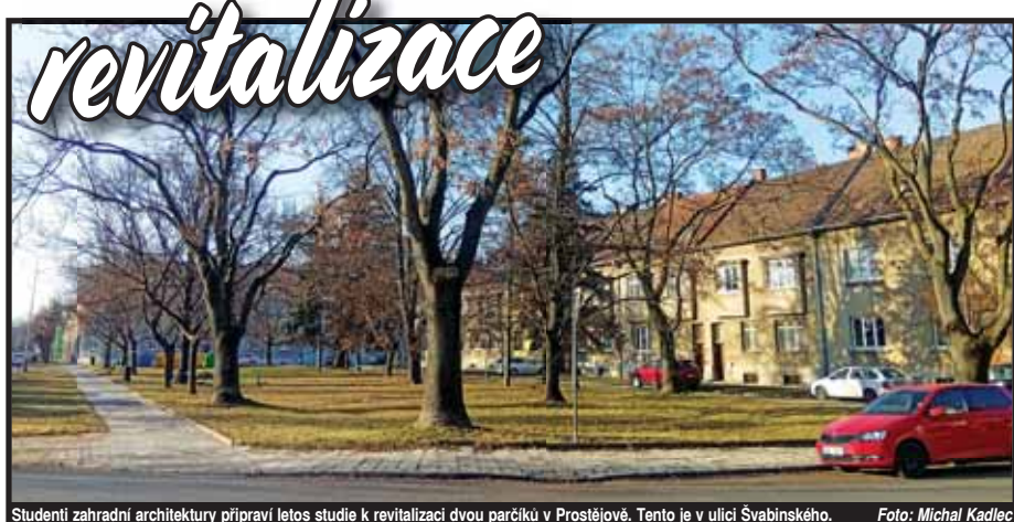
Studenti zahradní architektury připraví letos studie k revitalizaci dvou parčíků v Prostějově. Tento je v ulici Švabinského.

PROSTĚJOV Vedení prostějovského magistrátu chce dát další příležitost talentovaným studentům. Radní na svém jednání schválili rozpočtové opatření ve výši 60 500 korun na vypracování studentských návrhů na revitalizaci parku v ulici Švabinského v Prostějově a lokality U Lípy v části Vrahovice.