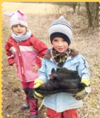
V přírodě ponecháme na pospas nejruznější věci. Tato pracovní bota už se slušně zelenala.

Uklízet ale vyrazili i jednotlivci či celé rodiny. Jako ta paní Aleny. „Ráno jsme nestihali, manžel musel jet do firmy, a tak jsme sbalili děti a vyjeli po obědě. Vydali jsme se do lesa nad Seloutky a musím říct, že jsem překvapená, co všechno jsme našli. Teba pra-