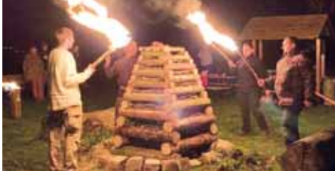
V Němčicích se signál ohnivého telegrafu předává již několik let.

MALÉ HRADISKO, NĚMČICE NAD HANOU V sobotu 22. března večer se republika rozsvítila mnoha ohni. Keltský telegraf opět pomoci světelného signálu propojil místa a ty, kteří se telegrafování účastnili. Navazuje se tak na pradávno techniku využívající ohně k přenosu zpráv z kopce na kopec. U nás plameny vysílaly poselství z keltského oppida ve Starém Hradisku u Malého Hradiska a z Němčice nad Hanou.