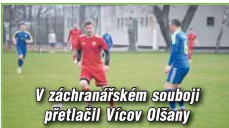
V záchranářském souboji přetlačil Vícov Olšany