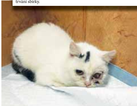
Pro své svěření potřebuje spolek materiální i finanční pomoc.