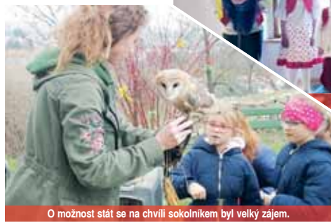
O možnost stát se na chvíli sokolníkem byl velký zájem.

výtěžek bude vložen na účet založený na opravu zámku. „Od dubna máme otevřeno o víkendech a svátcích od 10 do 18 hodin.