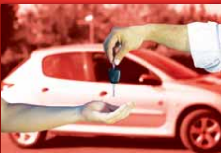
Pokud si budete vybírat vozidlo pro svoji potřebu, máte možnost koupě buď nového, či ojetého. Dobře si to rozmyslete.

Největší nevýhodou ojetých aut bohužel je, že nevíte nic o historii vozidla. Ano, sice máte servisní knížku, jenže v té se nepíše, jak se majitel k vozu choval a co může mít auto už za sebou. Pokud objevíte nějakou vadu, bude možná problém s jejím dokazováním. Stejně tak některá auta nemusí být v perfektním stavu, a tak se možná porozhlédnete po jiném vozu s lepším a méně opotřebovaným interiérem. Hodí se po koupi provést základní servis.