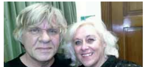
Po koncertě se jinak velmi introvertní písničkář přece jen nechal vyfotografovat se svými fanykami.