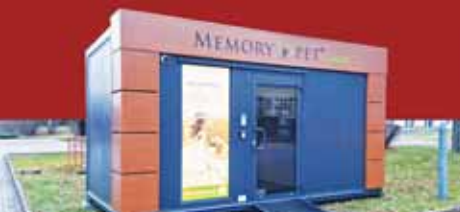
Memory Pet Point je samoobslužné pietní místo, kde se majitelé mohou naposledy se svým mazlíčkem důstojně rozloučit.