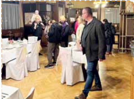
Luxusně prostřené stoly v divadelní restauraci a kavárně přitáhly spoustu zájemců.