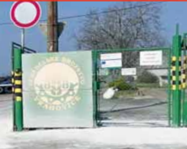
Například vjezd do areálu Zemědělského družstva Vrahovice chrání v pátek pás dezinfekce.

PROSTĚJOVSKO Pokud si hodláte zajet pro mléko či jinou lahůdku na Zlatou farmu do Štětovic, neuspějete. Ani výlet za zvířátky není do odvolání možný. Areál je pro veřejnost uzavřen. Stejně tak není možná návštěva v Našem mlýně v Hradčanech, kde chovají kozy, nebo v Tištině, opatření přijala i zemědělská družstva a soukromníci věnující se živočišné výrobě. Nákaza slintavkou a kulhavkou vypukla v Maďarsku, objevila se na Slovensku a ohniska se začínají objevovat nedaleko českých hranic.