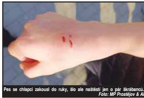
Pes se chlapci zakousl do ruky, šlo ale naštěstí jen o pár škrábanců.

Muž strážníkům předložil očkovací průkaz psa. „Hlídkou byl poučen o nutnosti kontrolního veterinárního vyšetření. Zraněného chlapce si na místě převzal rodinný příslušník, který byl o celé situaci informován. Svým jednáním je senior podezřelý z přestupku proti zákonu na ochranu zvířat proti týrání a dále je podezřelý z porušení obecně závazné vyhlášky o volném pohybu psů na veřejném prostranství. Celou záležitost bude dále projednávat příslušný správní orgán,“ dodala mluvčí prostějovských strážníků Tereza Greplová. (mik)