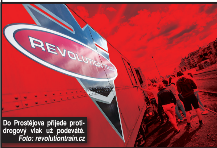
Do Prostějova přijede protidrogový vlak už podeváté.

příběhem procházejí a díky možnostem interaktivních technologií se aktivně stávají jeho účastníky. Cílem programu je prostřednictvím zapojení všech lidských smyslů efektivně zapůsobit na návštěvníka vlaku, na jeho pohled na legální i nelegální drogy, závislosti a inspirovat jej k pozitivním životním volbám. Délka programu ve vlaku je kolem 90 minut, minimální věk návštěvníků vlaku je 10 let. Vstupné je dotováno z finančních prostředků statutárního města Prostějova, vstup je zdarma. Rezervace míst pro veřejnost v odpoledním bloku je možná na rezervace@revolutiontrain.cz nebo telefonicky na 774 724 757. Více informací naleznete na www.revolutiontrain.cz