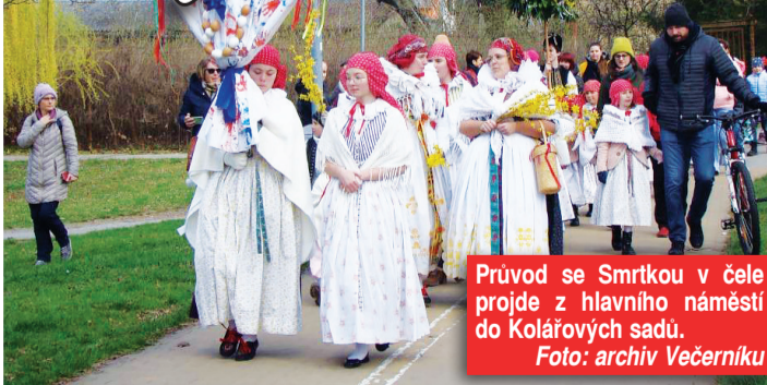
Průvod se Smrtkou v čele projde z hlavního náměstí do Kolářových sadů.