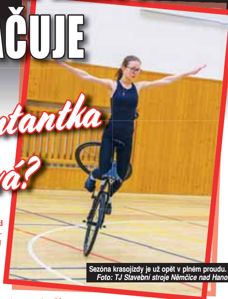
Sezóna krasojízdy je už opět v plném proudu.