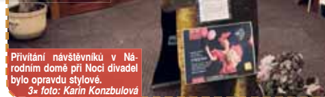
Přivítání návštěvníků v Národním domě při Noci divadel bylo opravdu stylové. 3* foto: Karin Konzbulová

ganizačně podíleli,“ uvedla na závěr ředitelka Městského divadla Karin Konzbulová.