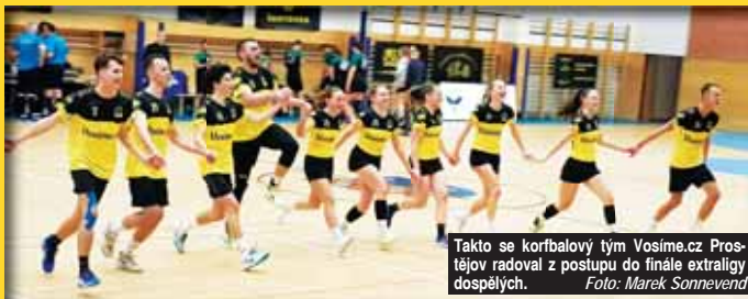
Takto se korfbalový tým Vosíme.cz Prostějov radoval z postupu do finále extraligy dospělých.

Ve finále dorostenecké extraligy na sebe od 13.30 hodin rovněž narazí výběry KK Brno a Vosíme.cz Prostějov, leč tady jsou role otočeny. Coby mírný favorít