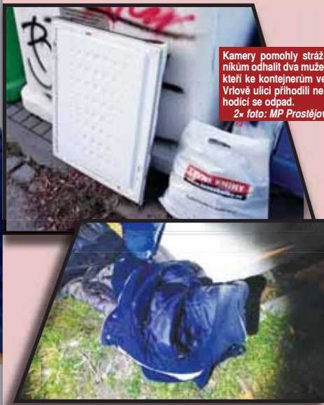
Kamery pomohly strážníkům odhalit dva muže, kteří ke kontejnerům ve Vrlově ulici přichodili nevhodící se odpad.

PROSTĚJOV Z tohoto případu je patrné, k čemu jsou dobré městské kamery. Právě podle videozáznamu odhalili strážníci odpad u kontejnerů ve Vrlově ulici, který tam neměl vůbec co pohledávat. Ale co je hlavní, kamery odhalily i pachatele černé skládky.