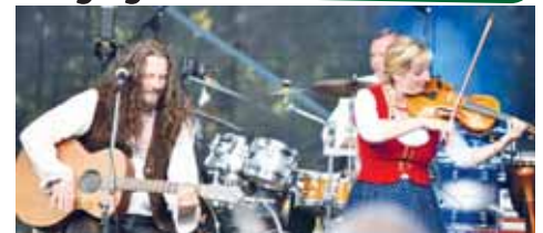
Keltská noc se bude letos konat už po dvaadvacáté.

PLUMLOV Do dnešní půlnoci mohou lidé hlasování rozhodovat o tom, kdo získá Cenu veřejnosti Olomouckého kraje za výjimečný počin v oblasti kultury za rok 2024. Mezi nominovanými je Keltská noc – mezinárodní hudební festival 2002–2024, který je posledních letech spojen s kempem Žralok v Plumlově.