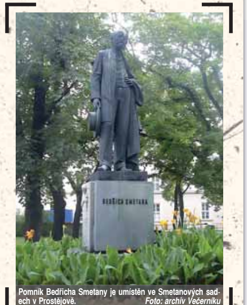
Pomník Bedřicha Smetany je umístěn ve Smetanových sádkách v Prostějově.