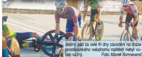
Jediný pád za celé tři dny závodění na dráze prostějovského velodromu našťáště nebyl vůbec závažný.

PROSTĚJOV Cyklistika je sportem, kde čas od času dochází ke karambolům – tak jako při běžném ježdění na kole. Vzhledem vysokým rychlostem závodních jezdců však následky po jejich pádech bývají často vážnější než nepřijemné. Naštěstí tři srpnové dny na dráze prostějovského velodromu zůstaly pro tentokrát těchto nemilých událostí ušetřeny. Jediný pád se odehrál bezprostředně po startu závěrečného madisonu mužů každoročně konaného coby Memoriál Otmara Malečka. Došlo němu okamžitě po úvodním sjezdu akterů od horní bariéry, to znamená za situace, kdy jezdců ještě nemají žádnou rychlost. Proto našťáště nedošlo vůbec žádným zraněním, dokonce ani cyklisticky obligátní odnětení se nekonaly. „Mladí nedočkaví vládci se nám tady trochu zamotali nabourali, ale nic se nestalo. Kluci, přistě pozor,“ komentoval spikr Josef Kratina velkou neškodnou srážku dvou méně zkušených cyklistů věkové patřících nejmladším mužským pelotonu. Chlapci se rychle sesbírali betonového povrchu, znovu nasadili na své bicykly nepovedený start se mohl za pár minut opakovat. Tentokrát již úspěšně. „Ničemu závažnějšímu tak na Hané 2023 nedošlo. „Za to jsme opravdu moc rádi, že se letos naše třídenní akce obešla bez jakékoliv zdravotní újmy všech účastníků,“ oddechl si sportovní ředitel pořadajícího TUFO PARDUS Prostějov Michal Mráček. (son)