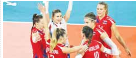
Volejbalistky Slovenska se dvěma hráčkami VK Prostějov v základní sestavě přivězly z ME žen 2023 desáté místo.

FLORENCIE, PROSTĚJOV Již byl pro volejbalistky Slovenska na mistrovství Evropy žen 2023 historickým úspěchem. Tým se dvěma hráčkami VK Prostějov v základní sestavě se navíc na malý kousek přiblížil ještě většímu dějinnému počínu v podobě čtvrtfinálové účasti, která však nakonec boleštně protěkl mezi prsty.