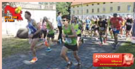
FOTOGALERIE Blatná www.vecernikpv.cz

MORICE Tady umí uspořádat příjemnou sportovní akci pro každého! Už je tomu čtyři roky, co se Mořice po Skalce a Čehovicích také zapsaly na běžeckou mapu prostějovského regionu. V sobotu 12. srpna prověřilo nesnadné pořádkání akce vzájemnou spolupráci místních hasičů, sokolů i zaměstnanců obce, kteří hostili celkem 51 běžců z různých koutů kraje. Na své si přišly i místní děti.