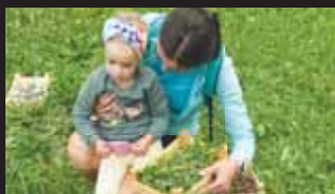
Děti se při Oslavě léta snažily hádat i některé druhy rostlin.

mou cvičení s maminkami při básničkách a říkankách. Cvičíme na gymnastických balóněch, na podložkách, máme tady relaxační chvíli s cvičením jemné motoriky a mnohá další stanoviště. Děti se tady dnes pobaví s rodiči i na opěči držá, venku pak pro všechny máme připravenou