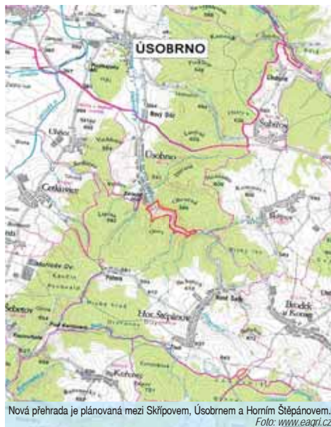
Nová přehrada je plánovaná mezi Skřípovem, Úsobrnem a Horním Štěpánovem.

Co na to říkají zainteresovaní? Dočtete se v příštím čísle!