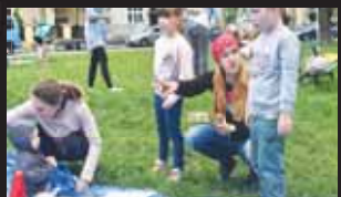
Lektorky v parku dětem vždy vysvětlily přesná pravidla dané soutěže.