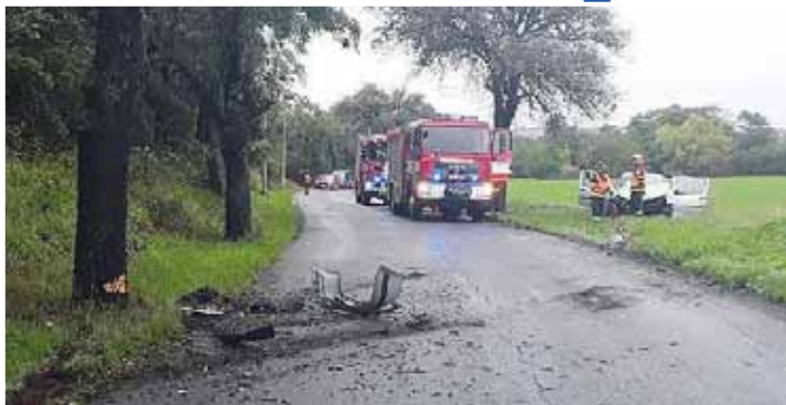
Řidič osobního vozidla měl u cihelny velké štěstí, že vyvázl bez většího zranění.