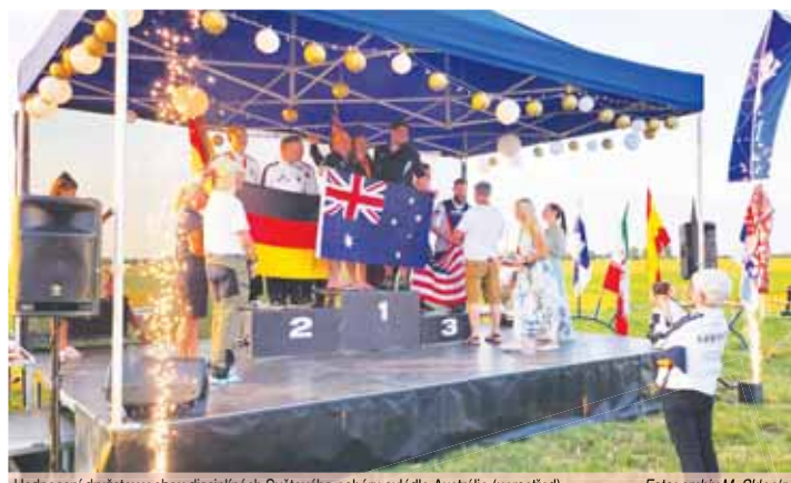
Hodnocení družstev v obou disciplínách Světového poháru ovládla Austrálie (uprostřed).