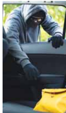
Krádež měla kromě hotovosti pro řidiče šťastný konec.

křížovate, zda je čistý vzduch. Z auta pachatelé vzali řidičovu ledvinku, v níž měl veškeré doklady, karty, drobnou hotovost