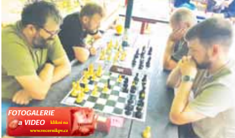
FOTOGALERIE a VIDEO kláně na www.vecernikpv.cz

Stejně jako loni nepřálo Šachovému loučení s prázdninami – hlavně zpočátku – nijak vlídné počasí. „Naštěstí