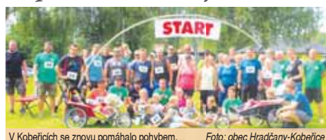
V Kobereicích se znovu pomáhalo pohybem.

Sponzoři a běžci vybrali sto dvacet tisíc korun