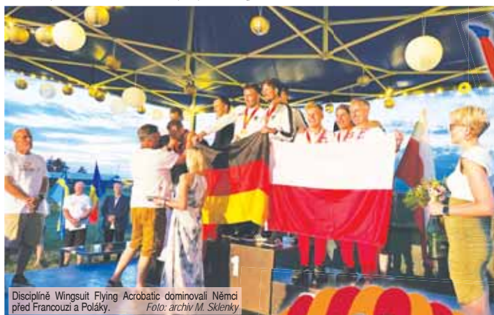
Disciplíně Wingsuit Flying Acrobatic dominovali Němci před Francouzi a Poláky.

skakovali jednotliví závodníci nebo družstva. Letání v kombinézách je přitom velice populární. Hodnotí se rychlost, vzdálenost i čas. Závodníci musí dodržet své koridory a vše je hodnoceno rozhodčími podle GPS přístroje,“ přiblížil Sklenka. Boje o evropské a světové medaile přitom byly nadmíru krásné, leč mistři i dost lité. „Jury musela řešit některé protesty kvůli technickým vylepšením na kombinézách. Vše ale dobře dopadlo. Velmi pěknou disciplínou v letacích kombinézách je z mého pohledu akrobacie, kde dva parašutisté předvádí akrobatické prvky, kdy mění své pozice ve vzduchu.