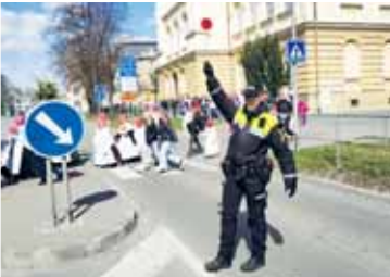
Strážníci Městské policie Prostějov budou na přechodech dohlížet na bezpečí školáků.

PROSTĚJOV Školní prázdniny opět začaly jako voda a právě dnes, 4. září, nastal začátek školního roku. V rámci kontrol na bezpečnost a plynulost silničního provozu budou strážníci dohlížet na bezpečnost přechodů a základních škol v jejich okolí.