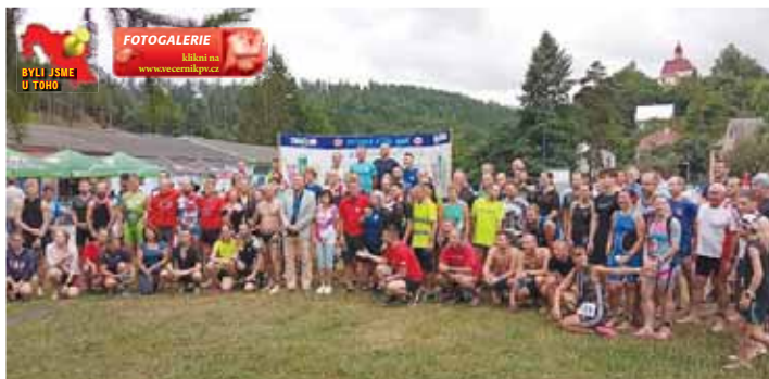
Na úvod opět vznikla společná fotografie všech účastníků, kterých se letos sešlo 104.

Konický triatlon po Nálce a Čertových rybnících nakonec našel ideální podmínky právě na koupališti ve Stražisku. „Jsme rádi, že vás tu můžeme přivítat