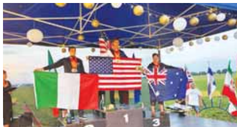
Nejlepší tři muži SP v celkovém pořadí disciplíny Wingsuit Flying Performance.

„Dorazilo k nám přesně 101 závodníků z 21 zemí, například z Austrálie, USA, Iráku či Kuvajtu. S doprovodem, rozhodčími a jury strávilo v Prostějově jeden týden okolo 250 lidí vlastní příprava dala pošídné zabrat. Zejména zajištění vzdušného prostoru o průměru deseti kilometrů bylo oříškem, rovněž se musely zajistit orientační body, podle kterých vy-