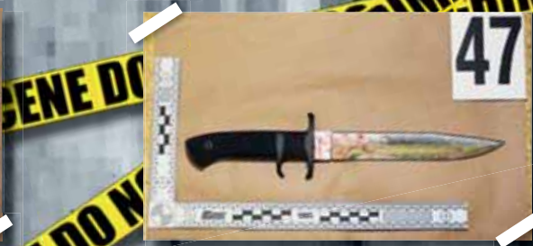
Jeden z vojenských bojových noží, které použil muž v Kostelci na Hané při vraždě svého bratra, sestry a otce.

UCHOVEJTE VZPOMÍNKU Mimořádná nabídka: Dvojvzpomínka místo 450 zaplatíte POUZE 199 Kč Klasická vzpomínka místo 350 zaplatíte POUZE 149 Kč Platí pro zadání ve dnech 4. až 8. 9. na termín 11. září 2023. více na straně 21