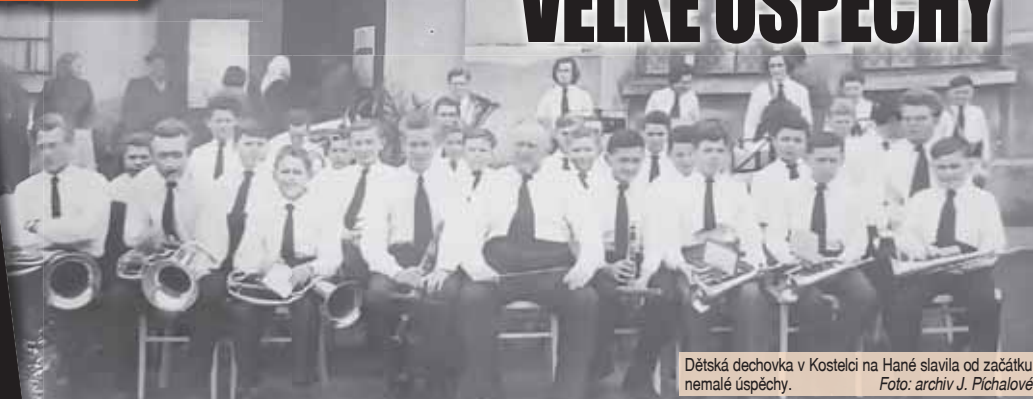
Dětská dechovka v Kostelci na Haně slavila od začátku nemalé úspěchy.