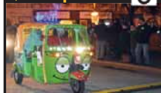
Všechny přihlížející pobavil taxíček.