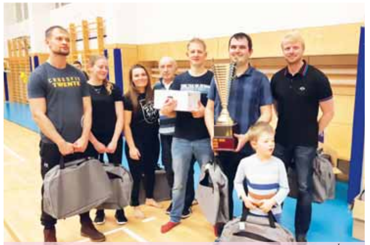
Tradiční klání vyhráli Absolventi 2007.