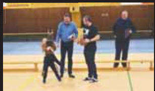
Radost z výsledků tomboly měli malí i velcí.