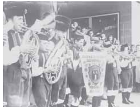
Dobová fotografie z vystoupení dětské dechovky.

se konala v Brně a ve Strážnici. I když nás soubor patřil věkově i existenčně k těm nejmladším dětským dechovkám, tak byl v roce 1963 vybrán komisí v celorepublikové soutěži a nominován na prestižní účinkování při setkání pionýrů a mládeže s tehdejším prezidentem Antonínem Novotným. Setkání se konalo na přelomu června a července v Hluboké nad Vltavou a zúčastnilo se ho na 1200 pionýrů z Československa. Kulturní program postavil na dětských pěveckých, tanečních a divadelních souborech a naši dechovce herec Miloš Nesvadba,“ pokračovala Jitka Píchalová. V průběhu léta se dechovce nadmíru dařilo, zúčastnila se během prázdnin i nahrávání v Československém rozhlasu v Brně. Po