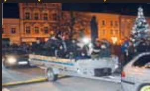
Lidé si jízdu užívali i ve vozíku.