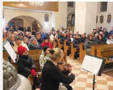
Krásný kostel v Mostkovicích se třetí adventní nedělí utěšeně zaplnil, lidé stáli i seděli úplně všude.