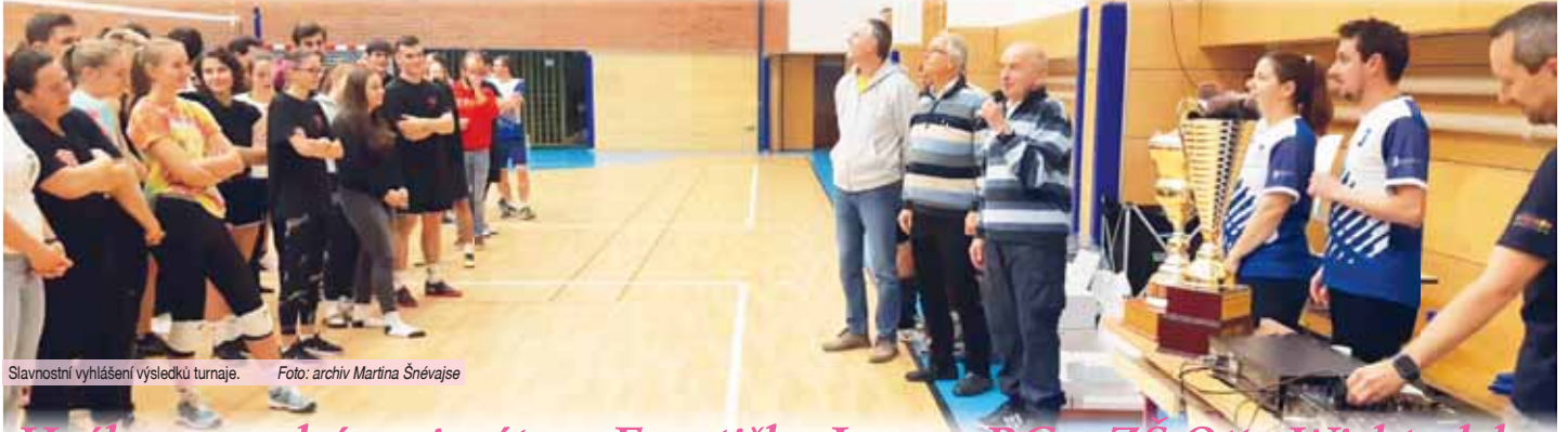
Slavnostní vyhlášení výsledků turnaje.