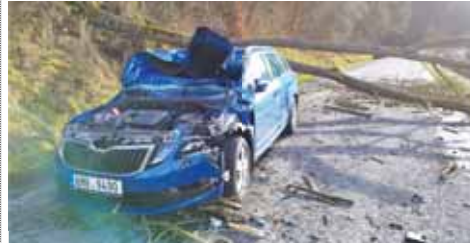
Po zásahu stromem bylo auto na odpis. Dle místních byla otázka času, kdy v úseku mezi Stražiskem a Čunimem k něčemu podobnému dojde.

STRAŽISKA Hodně osklivá záležitost. K hroznému vypadající nehodě došlo v pátek 22. prosince na silnici ve směru ze Stražiska na Čunín. Na projíždějící auto totiž spadl strom. Došlo ke zranění řidičky, strom zastavil provoz i na vlakové trati do Konice.