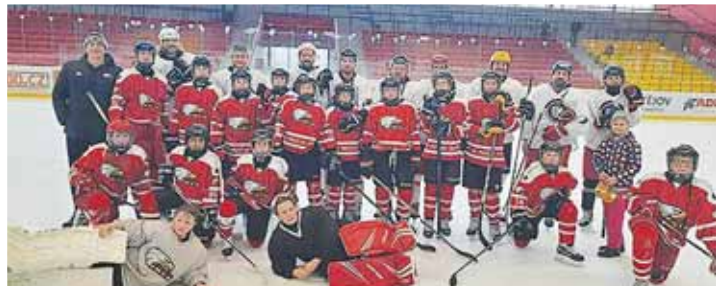
Během volného období nechyběly ani zápasy proti rodičům.

padů radovali dospělí, kteří tak svým dětem předvedli, že ještě musí pracovat na tom, aby se postupně role obrátili. Ročník 2016 si pak užil turnaj v Brně, kde se konal mini open air pod širým nebem a domů si tak hráči i rodiče odvezli řadu zážitků. Jediný ostrý duel pak odehráli hokejisté SK Prostějov 1913 v pátek 22. prosince, kdy si na domácím ledě poradili mladší žáci se Zlímem a nadešli si tak předčasný dárek.