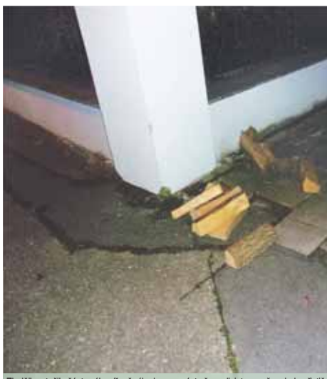
Zlodějka stačila část svého dřevěného lupu vyneset až na ulici, tam ovšem byla přistížena majitelem dřevníku.