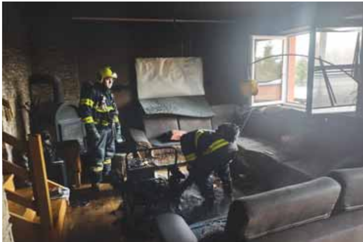
V bytě ve Vrbátkách hořelo v obývacím pokoji, hasiči měli plné ruce práce.

Drtivá většina případů byla kvůli padajícím stromům, které nevydržely náporu silného větru, ale nechyběly ani požáry. Jeden z nich byl ohlášen večer v Hradčanech-Kobeřicích. „Zahoření vánočního věnce, našťastí bez většího rozšíření, bylo uhašeno před naším příjezdem. Ve Vrbátkách došlo k zahoření v obývacím pokoji, nejspíše od elektrického zařízení,“ potvrdil informace mluvčí krajských hasičů Zdeněk Hošák. Především ve Vrbátkách se jednalo o větší zahoření a obývací pokoj byl na svátky neobyvatelný. O tento nechtěný zážitek se podělila