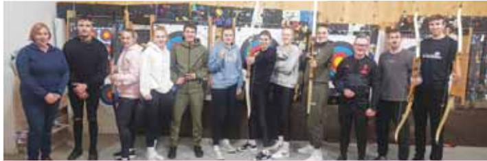
Volejbalová parta lukostřelkyň a lukostřelců VK Prostějov.

Díky spolupráci s místním lukostřeleckým oddílem si zpestřily přípravu, daly si i malý závod mezi sebou