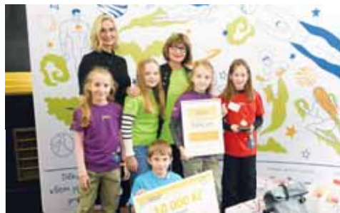
Během vyhlášení na Staroměstské radnici v Praze se děti vyfotily i s patronkou soutěže, herečkou a zpěvačkou Petrou Černockou a ředitelkou společnosti Whirpool, jejíž nadační fond je organizátorem soutěže.