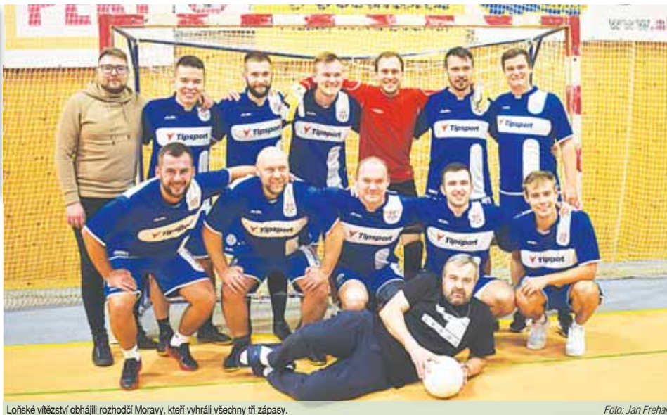
Loňské vítězství obhájili rozhodčí Moravy, kteří vyhráli všechny tři zápasy.

KOSTELEČ NA HANÉ Jen málokterá fotbalová událost na našem území se může pochlubit takovou tradicí, jakou představuje memoriál Milana Bartoška, který rok co rok pořádá Okresní fotbalový svaz Prostějov mezi svátky. A ani letos neudělal výjimku, takže sudí ze všech možných soutěží od profesionálů až po nejnižší třídy ukázali, že by si často dovedli poradit i na opačné straně takzvané barikády. Obhajobu loňského titulu zvládli sudí z Řídící komise pro Moravu, ale více než o výsledky šlo o příjemné setkání v závěrečném období roku.