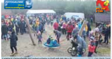
V předstihu to vzhledem k předchozím zánětlivým ročním na Kosíři opět vzhled jako v úlu.

VELKÝ KOSÍŘ Pokud Kosíř není sopka, pak to určitě musí být magnetická hora Důkaz pro toto tvrzení se přimno nabízí. Vždy první den v roce je tento kopce schopný přitáhnout tisíce lidí ze širokého okolí. Na haničsky Mount Blanc putují od Cechovic. Lhota pod Kozlím, Czech pod Mlýnskou barvou a uplynulá pondělí 1. ledna si v domě odnášelo celkem 3 103 turistů.