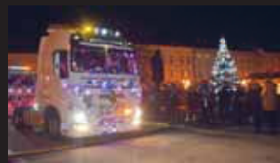
Kulisa náměstí umocnila hezkou podívanou.