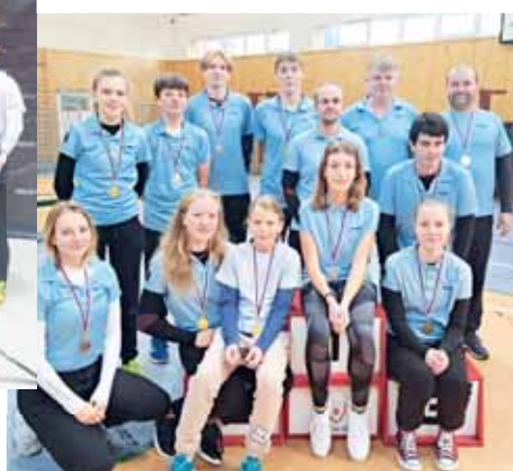
Výpravě oddílu Lukostřelba Prostějov se dařilo na závodech v Kostelci na Haně.