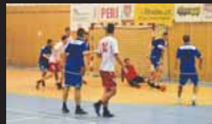
Poslední duel nakonec rozhodoval o vítězi.