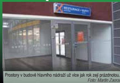
Prostory v budově hlavního nádraží už více jak rok zejí prázdnotou.

PROSTĚJOV Tady to kdysi žilo. Jenže už před šesti lety se uvolnily prostory v hlavní budově prostějovského hlavního nádraží, kde v minulosti fungoval bufet i restaurace. Zhruba po roce došlo na úvahy, že by zde mohl vzniknout supermarket. Z těch však sešlo. Následně však v místě otevřelo Pivárium Hlavák, které si získalo poměrně velkou oblibu. Bohužel i tento podnik skončil a v současnosti prázdný prostor na nádraží zaplňují pouze Stíny lepší minulosti.