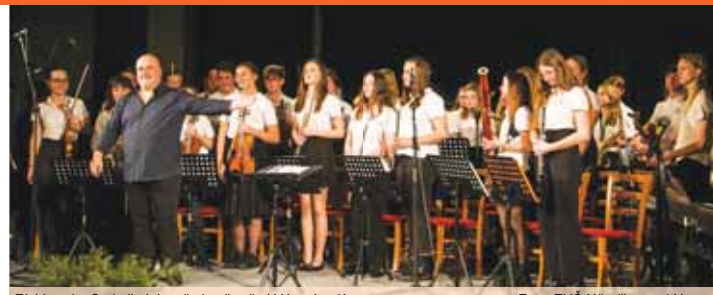
Richband a Sedmikráska předvedly před Vánoci svůj um.

NĚMČICE NAD HANOU Předvánoční období oživila symbióza symfonického orchestru Richband a pěveckého sboru Sedmikráska v Němčicích nad Hanou. Během pouhých tří dnů si tato hudební formace přichystala pro své příznivce hned dvě koncertní akce. Richband, složený z talentovaných žáků a pedagogů Základní umělecké školy v Němčicích nad Hanou, spojil své síly s pěveckým sborem Sedmikráska a společně připravili nezapomenutelné hudební zážitky.