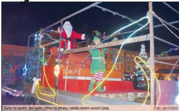
Santu na saních, ale i parbu přímo na přívěsu nabídla letošní vánoční jízda.