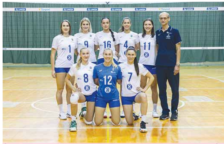
Šternberské volejbalistky přijedou do Prostějova již v úterý 9. ledna.

Všechny tři zbývající mače prostějovských žen do konce extraligové základní části se tudíž konají jindy, než původně měly. Duel 16. dějství s Ostravou byl na žádost TJ přesunut z 21. prosince na čtvrtek 11. ledna (18.00 hodin), trénink slágru 17. kola v Liberci