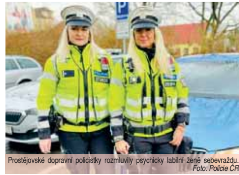
Prostějovské dopravní policistky rozmluvily psychicky labilní ženě sebevraždu.

vyrazily na místo. Vyběhly do patra, kde jim otevřela matka nemocné ženy. V době jejich příchodu se dcera před hlídkou schovala a zamkla v koupelně. Dál vyhodlala, že si vezme život. Policistky nevěděly, zdali u sebe nemá léky nebo předmět, kterým by si mohla ublížit. Se ženou se pokusily komunikovat a rozmluvit jí její počínání, což se jim naštěstí podařilo, žena dveře do koupelny po chvíli otevřela. V tu dobu již na místo přijela záchranná služba, která si ji převezla do své péče a převezla do zdravotnického zařízení,“ uvedla Miluše Zajicová.