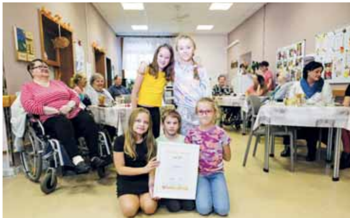
Děti ukázaly svá ocenění také přímo seniorům Centra sociálních služeb, kam za nimi pravidelně dochází.

PROSTĚJOV Tak je to potvrzeno. Máme u nás nejšikovnější děti České republiky. Žáci školní družiny ZŠ v ul. Dr. Horáka na tento titul mají dokonce diplom. Získali ho díky nominaci v soutěži Zlatý oříšek. Už předtím děti jely do Prahy, aby v nádherných prostorách Staroměstské radnice převzaly cenu za Dětský čin roku, jejichž patronkou se letos stala zpěvačka a herečka Petra Černocká. To vše se jim podařilo na základě dlouholeté a velmi intenzivní i nápadité spolupráce dětí se seniory z Centra sociálních služeb v Lidické ulici.