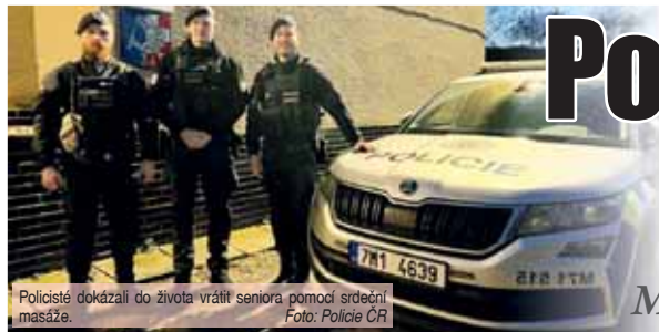
Policisté dokázali do života vrátit seniora pomocí srdeční masáže.