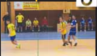
K vidění byly i krásné fotbalové momenty.