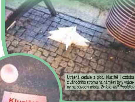
Utřené cedule z plotu kluziště i ozdoba z vánočního stromu na náměstí byly vráceny na původní místa.