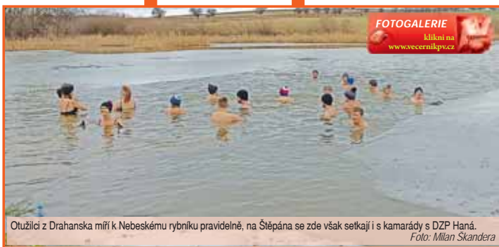
Otužilci z Drahanska míří k Nebeskému rybníku pravidelně, na Štěpána se zde však setkájí i s kamarády s DZP Haná.

psal Milan Škandera z pořádajícího Spolku přátel chladu. Štěpánský ponor se zde letos konal již potřetí. Stejně jako loni i tentokrát u Drahany na Štěpána vládlo téměř „tropické“ počasí s teplotami přes 7 °C, voda si však stále uchovávala mrazivých 2,3 °C a na podstatné části rybníka stále ještě plavaly ledové kry. „Věřme, že příští rok se zde ve zdraví opět sejdem,“ uzavřel Milan Škandera. (mls)