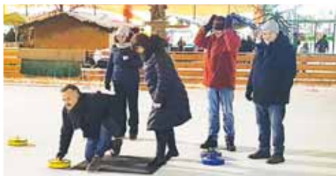
Druhý turnaj prostějovské série Hanácké curling se po tragické střelbě v Praze nehrál.

Nicméně třetí díl akce Hanácké curling 2023/24 už proběhne normálně podle plánu, to znamená v pátek 5. ledna od přibližně 17.00 hodin na prostějovském mobilním kluzišti mezi muzeem a Zlatou bránou. Srdečné zvání jsou jak zájemci o účast, tak diváci. (son)