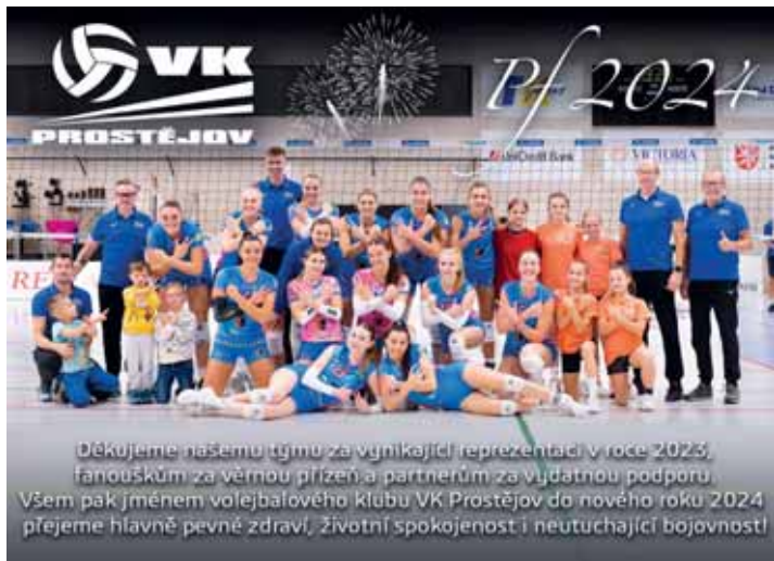
Děkujeme našemu týmu za vynikající reprezentaci v roce 2023, fanouškům za věrnou přízeň a partnerům za vydatnou podporu. Všem pak jménem volejbalového klubu VK Prostějov do nového roku 2024 přejeme hlavně pevně zdraví, životní spokojenost i neutuchající bojovnost!

1. UP Olomouc A 84, 2. VK Prostějov B 62, 3. VK Prostějov A 59, 4. VAM Olomouc B 52, 5. VAM Olomouc A 47, 6. Přerov A 44, 7. Troubky 38, 8. UP Olomouc B 37, 9. Uničov 26, 10. Šternberk 24, 11. Litovel 21, 12. Přerov B 21, 13. VAM Olomouc C 11, 14. Šumperk 5.