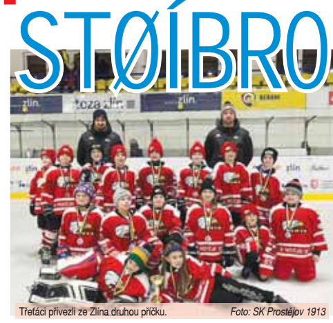
Třetáci přivezli ze Zlína druhou příčku.

PROSTĚJOV Konec kalendářního roku patří u hokejové mládeže tradičně turnajům a dalším aktivitám, které trochu rozbijí a ozvláštní zaběhlý tréninkový proces. Mládežníci si tak společně s trenéry užijí i jistou formu zábavy. O velký úspěch se v pátek 29. prosince postarali hráči ročníku 2015, kteří vyrazili do Zlína na tradiční turnaj Capri-Sun Cup. V nabité konkurenci se neztratili, díky čemuž tak obsadili krásné druhé místo. Nestáli totiž jen na domácí celek.