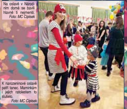
K narozeninové oslavě patří tanec. Maminkám i jejich ratolestem to slušelo.