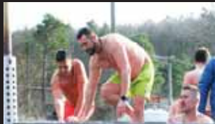
Není nad to prohrát ledové tělo v horké sudové vaně.