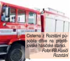
Cisterna z Rozstání působila dříve na prostějovské hasičské stanici.

Hasiči z Rozstání pak převzali druhou cisternu, pouze osm let starou CAS 20 Tatra 815 Termo v pořizova-