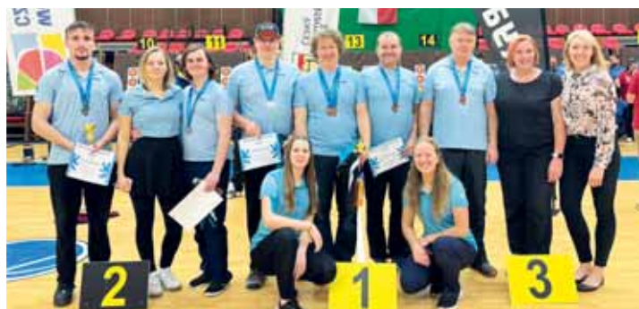
Oddíl Prostějova se zvečnil i po mistrovství dospělých a seniorů.

Ještě před výše zmíněným MČR žactva 2024, jež Lukostřelba Prostějov uspořádá o druhém březnovém víkendu ve Sportcentru – DDM PV, vygraduje letošní Halová liga družstev ČR finálovým třetím kolem v Humpolci (sobota 2. března). „Naši muži zatím vedou předběžné pořadí a mají slibné naslápnuto k ligovému zlatu,“ těšila se Robová.