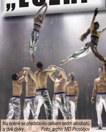
Na scéně se představilo celkem sedm akrobatů a dvě dívky.

PROSTĚJOV Říká se, že občas kolem vás někdo jen tak proletí. Neznamená to však obvykle, že dotyčný právě plachtí vzduchem. Jinak tomu bylo v představení „Nespoutaní“ v podání souboru Losers Cirque Company. Dechberoucí tanečně akrobatická show, při níž často běhal mráz po zádech, byla k vidění ve čtvrtek 15. února v prostějovském divadle. Podobné kousky jste přitom v prostějovském Národním domě mohli vidět vůbec poprvé v jeho více jak 126 let trvající historii.