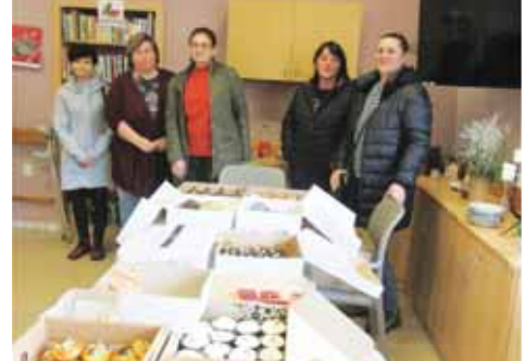
Amatérští i profesionální pekaři či cukráři předvedli své umění i seniorům v Lidické ulici v Prostějově.

PROSTĚJOV Festival srdcí je dobrovolná akce charitativního valentýnského pečení amatérských i profesionálních cukrářů pro obyvatele domovů seniorů. Je to takové malé poděkování těm, díky nimž jsme mohli vystudovat a prožít bezstarostné dětství. Přesto hlavním mottem zůstává myšlenka dát všem v domovech vědět, že na ně okolní svět nezapomněl. Před dvěma roky začalo všechno nesmělé vánočním pečením pro azylové domy a domovy seniorů. Překvapení, radost, úsměvy a obrovská vděčnost obyvatel domovů seniorů za trochu sladkosti – to vše dalo původní myšlence přesný směr. „A tak v roce 2023 spatřil světlo světa Festival srdcí – valentýnské pečení pro seniory. Toho roku se zapojilo na