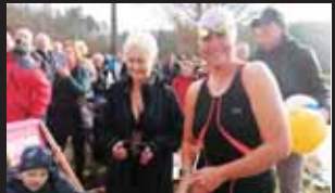
Pro dámu vlevo to byla premiéra. Dala jí na jedničku.