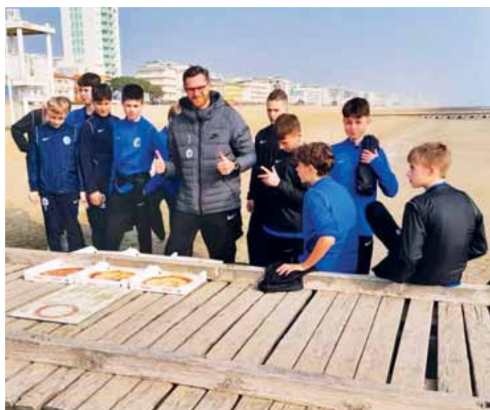
Kromě tréninků a zápasů absolvovali i krátký výlet, chybět nemohla ani pizza. Pro Itálii tak typická.

„Ubytování a vše podstatné našli hráči v Benátkách. „Zvolili jsme toto místo, protože mám známého v klubu Treviso, pomohl mi najít týmy pro přípravné zápasy. Zahráli jsme si tak právě s Venezuelou a Udinese, což jsou opravdu kvalitní kluby na top mládežnické úrovni. Mohli jsme proto poznat zcela něco odlišného. Musím říct, že tam všechno dělají jinak, a věřím, že to pomohlo nám trenérům i klukům. Viděli jsme, co všechno můžeme dělat pro to, abychom se postupně dostávali na vyšší úroveň,“ má jasno kouč Prostějova. Na jih Evropy odcestovali hráči společně v neděli večer. „Doprava byla v pohodě, využili jsme našeho partnera Autobusy Konečný. Jeli jsme tam necelých deset hodin a byli