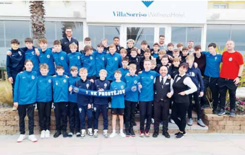
Mládežnická eskádka za sebou mají soustředění v Itálii.

Nápad na zahraniční soustředění v rámci zimní přípravy se zrodil už loni, ale až v průběhu aktuální zimy se podařilo vše zorganizovat. „My jsme už minulý rok řešili nabízející se možnosti, že bychom vycestovali na nějaké soustředění mimo republiku, m ěli jsme kontakt i ve Španělsku. Tam jsme ale narazili ohledně ceny, letenek a podobně, bylo by to náročné i logisticky. Na letošní rok jsme navrhli Itálii, odkud pocházím a kde mám dobré kontakty. Jednalo se navíc o severní Itálii, což bylo pro nás i z logistického hlediska jednodušší. Začal jsem na tom pracovat už v září a všechno nakonec vyšlo. Kategorie do čtr-