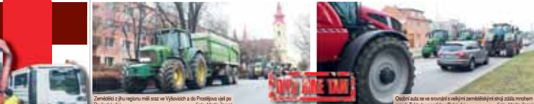
Zemědělci z ju regionu měli sraz ve Východích a do Prostějova vjel po Brněnské ulici.

PROSTĚJOV České potraviny na český stáří. To byl asi hlavním vzkaz zemědělských během jejich protestů. Inšady po Prostějově. Ze dvou směrů se na dorazilo více jak sto traktorů a další zemědělské techniky z celého regionu. Zemědělci se svými stáří ve čtvrtek 22. února od 10:00 do 11:30 hodina opakovaně projeli po Dolní a Kostelecké ulici, což se neobešlo bez kolon. Dle svědků v Kostelecké ulici dokonce na více jak půl hodiny zcela zablokovala dopravní činnosti a sympatie řidičů rozhodně nezískali.