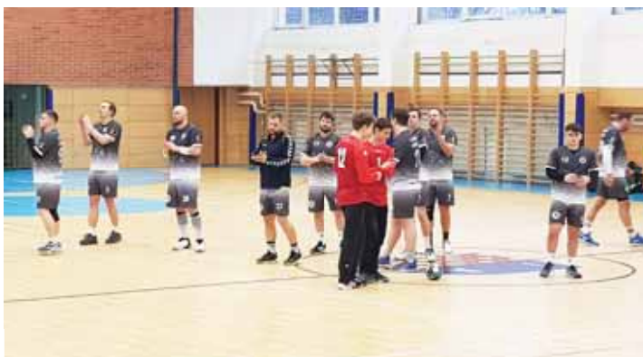
Prostějovští házenkáři nastříleli Kuřimi pětáctičet gólů, přesto o šest kusů podlehl.

Nejvic branek Kuřimi: Hírš 14/3, Mikel 8/1, Kocman 5, Křivánek a Švejda 4, Chýlek 4/2.