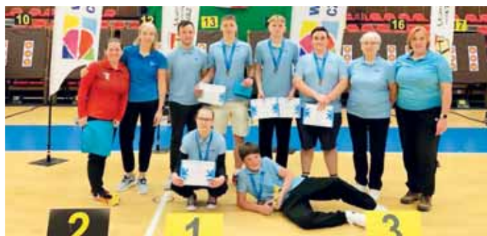
Prostějovská lukostřelecká výprava po MČR dorostu.