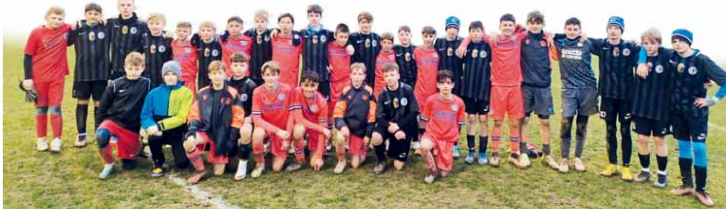
Na soustředění je čekaly hned tři zápasy ve čtyřech dnech.

Zahraniční soustředění si všichni náramně užili