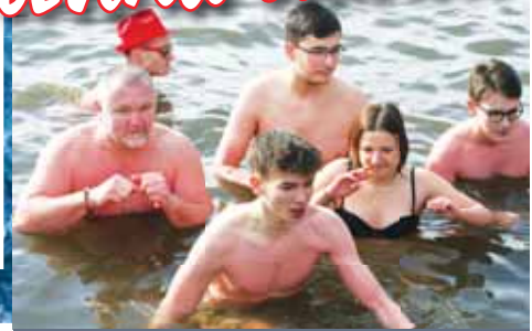
Některým otužilcům pár minut v chladné vodě Podhradského rybníka bohatě stačilo. A rychle ven!

jsem to a díky, zůstanu u koupání na rovníku.“ Stejného názoru byla i většina diváků. „My jim fandíme, ale nikdy by mě tam nedostal. To přechám mladším. My totiž zástupce máme, támhle plave vnuk,“ dodala jedna ze čtveřice přihlížejících starších dam. Komu po koupeli nestačilo osušení ručnickem, mohl využít možnosti naložit se do sudu s horkou