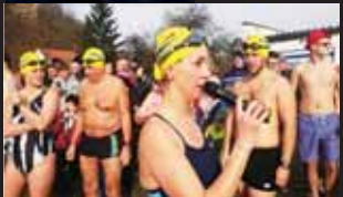
Před vstupem do vody bylo nutné rozdat pár rad.