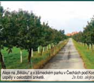
Aleje na „Běláku“ a v zámeckém parku v Čechách pod Kosířem uspěly v celostátní anketě.

PROSTĚJOV Festival srdcí je dobrovolná akce charitativního valentýnského pečení amatérských i profesionálních cukrářů pro obyvatele domovů seniorů. Je to takové malé poděkování těm, díky nimž jsme mohli vystudovat a prožít bezstarostné dětství. Přesto hlavním mottem zůstává myšlenka dát všem v domovech vědět, že na ně okolní svět nezapomněl. Před dvěma roky začalo všechno nesmělé vánočním pečením pro azylové domy a domovy seniorů. Překvapení, radost, úsměvy a obrovská vděčnost obyvatel domovů seniorů za trochu sladkosti – to vše dalo původní myšlence přesný směr. „A tak v roce 2023 spatřil světlo světa Festival srdcí – valentýnské pečení pro seniory. Toho roku se zapojilo na