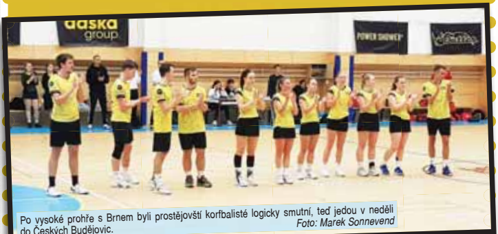
Po vysoké prohře s Brnem byli prostějovští korfbalisté logicky smutní, teď jedou v neděli do Českých Budějovic.