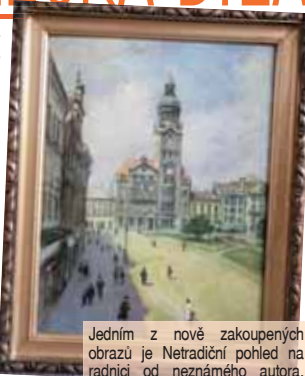
Jedním z nově zakoupených obrazů je Netradiční pohled na radnici od neznámého autora.

PROSTĚJOV Už několik let pokračují prostějovští radní ve snaze obstarat pro městskou galerii ta nejlepší umělecká díla. Není ničím výjimečným, že několikrát do roka se koná rozhodnou zakoupit obrazy, sošky či jiná díla, která postupně obohacují umělecké sbírky našeho města. A nejnak tomu bylo i na posledním jednání Rady statutárního města Prostějova. „Rada odsouhlasila nákup dvou obrazů do městských sbírek.