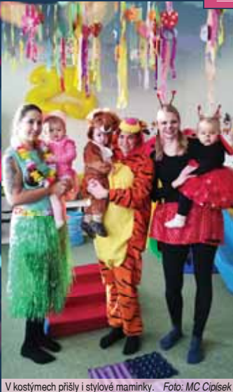
V kostýmech přišly i stylové maminky.