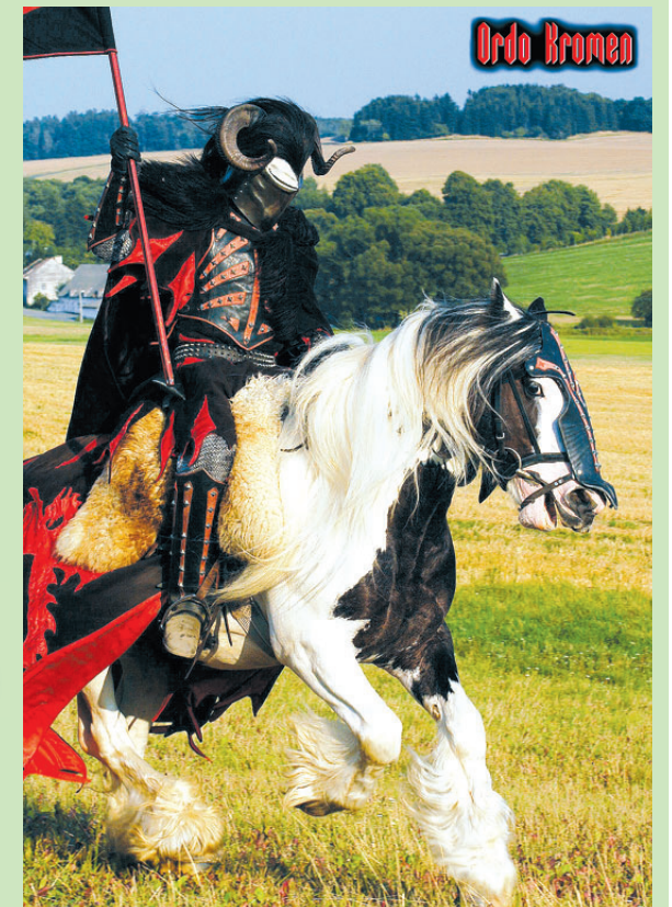
Pořadatelská agentura Ordo Kromen ve dnech 16. až 20. 9. 2009 vystoupí v Prostějově u HM Tesco s představením divadla na koních.

Jedná se o vystoupení plně soubojů na zemi i na koni, zábavy, krásných koní, rytířských turnajů, šermu, boje dobra se zlem i magie. Představení se líbí jak dospělým, tak dětem. Po vystoupení se mohou děti povozit na rytířských koních, vyfotit se s rytíři nebo si vyzkoušet dobové zbraně. Takové vystoupení probíhá během dne. Ovšem sobotní večer se uvádí vystoupení noční s mnoha ohňovými efekty na koních i bez a pro veřejnost lákovou atmosférou.