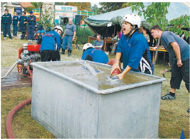
Starším žákům z Krasic se první pokus zrovna nevydařil, napravili si reputaci až dalším - vítězným.