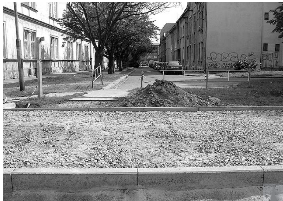
Ulice Tetína a Brněnskou nyní přepažují vysoké obrubníky na nově budované cyklostezce. Odpůrci zprůjezdnění Tetína se ale radují marně...

Odpůrci městem plánovaného zprůjezdnění ulice Tetína se během posledních dní zaradovali. Několik z nich nám zavolalo do redakce s tím, že v místě plánovaného výjezdu z Tetína na Brněnskou ulici nyní radnice buduje cyklostezku s vysokými obrubníky a tudíž je nemožné, aby tudy někdy jezdila auta. Když jsme se na zmíněné místo přijeli podívat sami, rovněž nás jako první napadlo, že město zřejmě upustilo od dlouhodobého plánu zprovoznit znovu Tetína a ulevit tak tíživé dopravní situaci okolo Tylovy ulice. Necháпали jsme totiž, jak by vozidla mohla směřem do Brněnské ulice přejet přes vysoké obrubníky ohraničující nově budovanou cyklostezku. Při našem dalším pátrání však vyšlo najevo, že odpůrci zprůjezdnění Tetína se nyní radují marně. "Je pravda, že mi už kvůli tomuto volalo několik lidí, i ze speciální školy na Tetíně. Všichni se těšili, že už netrváme na zprůjezdnění Tetína. Ale bohužel je musím zklamat, od našeho plánu jsme v žádném