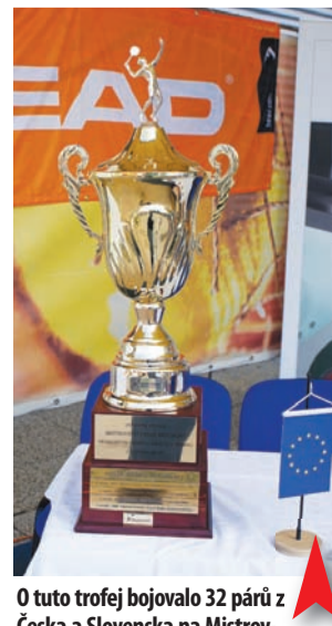
O tuto trofej bojovalo 32 párů z Česka a Slovenska na Mistrovství ČR neregistrovaných hráčů.