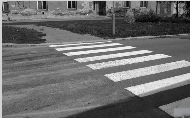
Pár dní po našem zveřejnění došlo k rychlé nápravě. Dnes už bílá zebra ve Vodní ulici směřuje z chodníku na chodník a nikoliv do trávy. Rozdíl vidíme podle snímků pořízených s odstupem jednoho týdne.