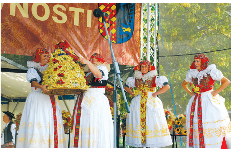
Dožatá - tak nazvali svůj tanec na motivy starých zvyků a tradic tanečníci z folklórního souboru Klas z Kralic na Hané. Věvodí mu majestátní symbol ukončených žní - třípatrový dožínkový věnec, který přinášela chasa svému hospodáři jako poděkování za to, že úroda je pod střechou a bude dost obilí na chleba - Boží dar - pro všechny.