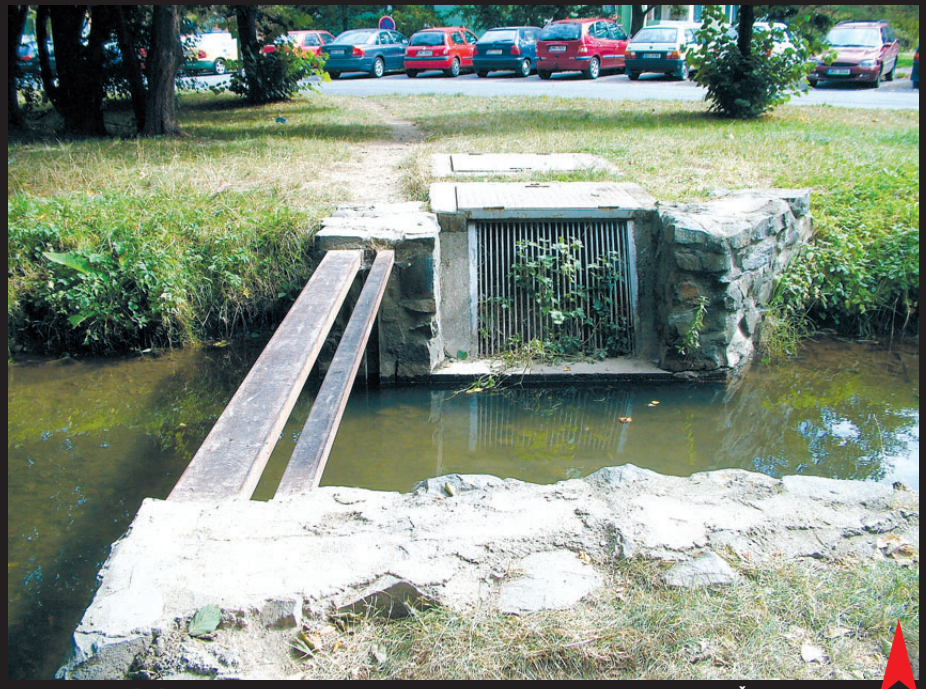
Místo tragického neštěstí. Muž při přechodu provizorní lávky přes potok v blízkosti Šmeralovy ulice upadl a způsobil si smrtelné zranění.

Policisté na místo neštěstí vy- slaly operativní skupinu vy- členěnou speciálně na tento případ. Do pečlivé práce se dala také výjezdová skupina Služby kriminální policie a vyšetřování společně s krimi- nalistickými techniky. "Na začátku vyšetřování jsme ne- znali totožnost zemřelého muže, tu se operativní sku- pině podařilo zjistit až druhý den dopoledne. Nyní mů- žeme potvrdit, že jde o třice- letého muže z Prostějova, který si chtěl cestu zkrátit přes provizorní most přes potok v Kolářových sadech. Na kole lávku asi zřejmě pře-