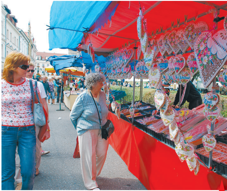
V záplavě poutového zboží i výrobků lidových řemeslníků na náměstí T. G. Masaryka nechyběly ani tradiční perníková srdce. Už dávno sice nenosí mladíci barevně zdobená a pentlená srdce svým vyvoleným, přesto toto zboží k tradici každé pouti patří.