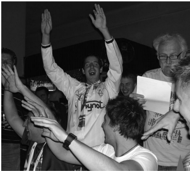
Zábava je v plném proudu...

V sobotu 7. listopadu 2009 si Hanáci uspořádali na počest úspěšné podzimní sezóny rozlučkový zápas a společné posezení v hostinci Na Růžku. Mužstvo TJ Haná Prostějov doplněné o příznivce a přátele tohoto jediného městského klubu se utkalo na domácím hřišti, protože funkcionáři OFS zrušili obě předehraná jarní kola. Hráči rozdělení na "oranžové" a "modré" se po oba poločasy vzájemně proháněli a vychutnávali si tuto nej-