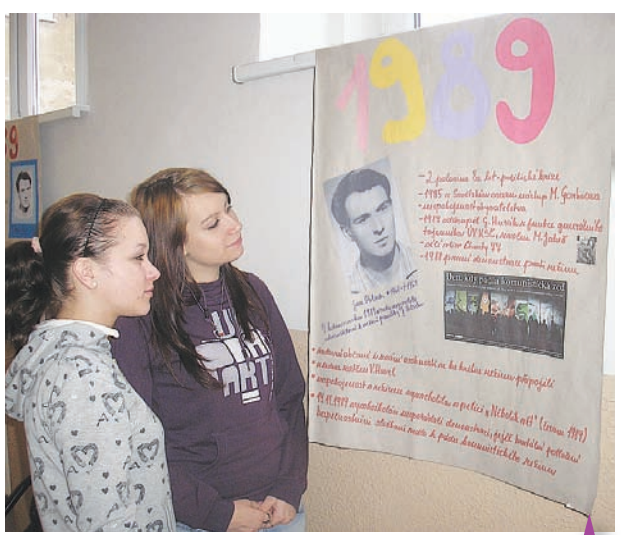
Studentky Střední zdravotnické školy samy vytvořily kroniku listopadových událostí před dvaceti lety.

formována veřejnost v širokém okolí studentských měst a také například na dojemnou scénu, když do sídla stávkového výboru na filozofické fakultě přišli ve dvě hodiny v noci osmdesátiletí manželé s taškami plnými čerstvě napečených hanáckých koláčů pro stávkující studenty a vyjádřili svou radost nad tím, že se dožili pádu totalitního režimu a chtějí alespoň takhle podpořit stávkující. Nakonec zůstali až do rána a vyprávěli studentům co prožili například za války, při komunistickém převratu v roce 1948, v roce 1968 a následné normalizaci atd. Svě vzpomínky vyučující dějepisu doplnil i vytvořením speciální nástěnky ze svého osobního archivu, na které vystavil archivní dokumenty z roku 1989, které se mu podařilo uchovat i po dvaceti letech, pod názvem „Listopad 1989 v archivních dokumentech...“ Jak ředitelka Hemerková na