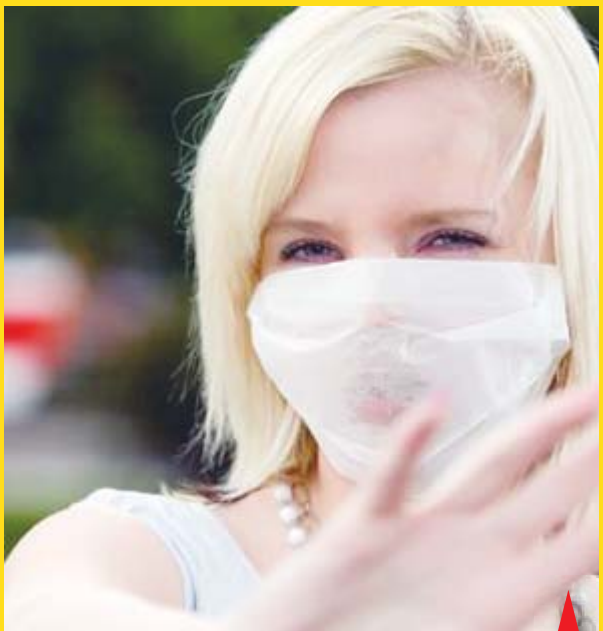
Budeme se brzy v Prostějově potkávat takto s nezbytnou rouškou? Ilustrační foto

Nejde o žádný planý poplach či vyvolávání poplašných zpráv. Nyní je už téměř jisté, že vir prasečí chřipky doputuje brzy i do Prostějova. V České republice bylo hospitalizováno už přes 150 osob a v pátek média zveřejnila zprávu o třetím úmrtí osoby nakažené virem typu H1N1. V Olomouckém kraji bylo dosud potvrzeno pět onemocnění prasečí chřipkou, v prostějovské nemocnici pak byly nedávno hospitalizovány už dvě osoby. Odborníci však upozorňují na hrozbu daleko vyššího počtu nakažených, prasečí chřipka totiž z Ukrajiny míří přes Slovensko k nám. "Bylo by naivní domnívat se, že nás virus mine. Lidé by v těchto okamžicích měli dbát zvýšené pozornosti o své zdraví a nepodceňovat ani ty nejmenší příznaky onemocnění chřipkou. Může se jednat o běžnou chřipku, ale také nemusí. To pozná odborný lékař," sdělil Večerníku MUDr. Zdeněk Prokeš, primář infekčního oddělení prostějovské nemocnice. Krajský úřad vydal v pátek varování pro školy. Všechny umývárny a toa-