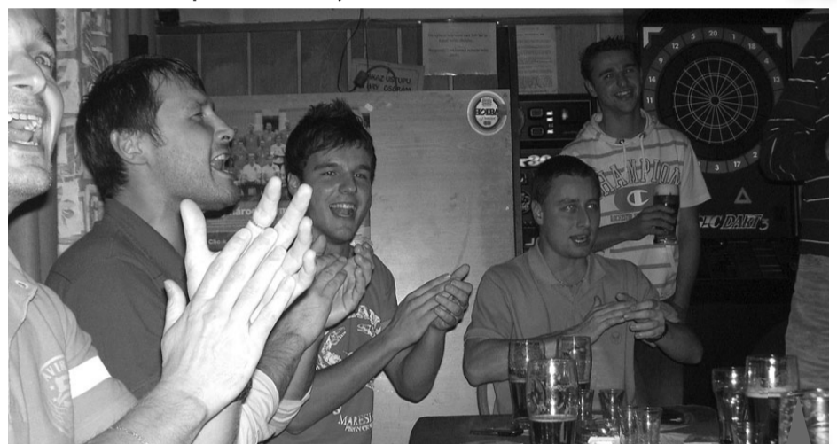
Frenetický potlesk na závěr hodnocení sezóny.