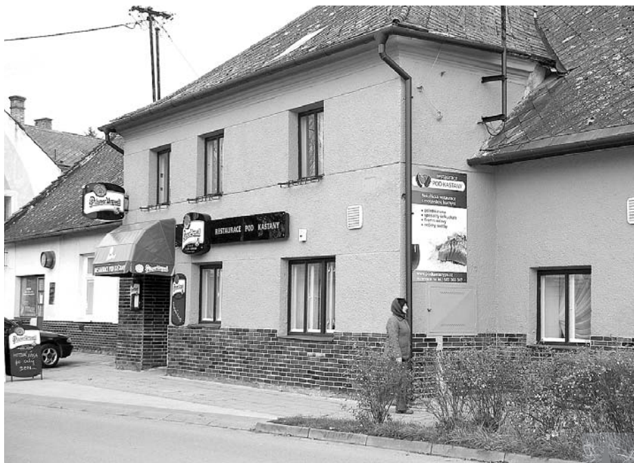
Nedávno nově zrekonstruovaná restaurace Pod kaštaný v Prostějově - Krasicích je přísně nekuřácká. A to i přesto, že majitel Radek Kocourek je sám kuřákem.

Důležitá je správná strava s vysokým obsahem ovoce a zeleniny a omezením tuků a přiměřený a pravidelný pohybový režim. Někdy totiž kuřák po zanechání kou-