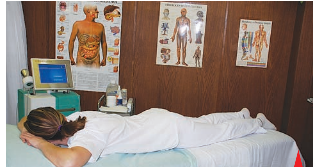
Chytrá mašinka zbaví ženy faldiků i sžíravých pocitů.

kteřá na bázi akupunktury odhalí záněty a problémy vnitřních orgánů. Služby pro zdraví a krásu se budou rozšiřovat o další nabídku. -in-