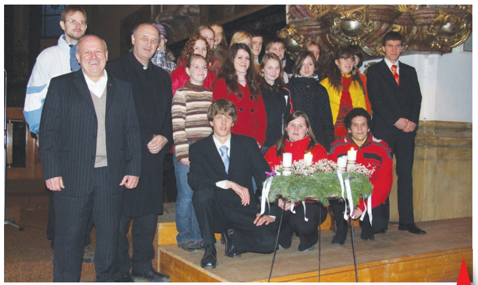
Studenti a profesori Cyrilometodějského gymnázia v Prostějově nabídli veřejnosti adventní zastavení v kostele Povýšení svatého Kříže.

Výtěžek z dobrovolného vstupného a prodeje výrobků studentů bude použit na úhradu výdajů na vzdělání indického chlapce v projektu „Adopce na dálku...“ O několik dnů později se na CMG konal tradiční Den otevřených dveří a více jak 50 dětí se svými rodiči si přišlo prohlédnout prostředí školy a dozvědět se vše, co je zajímavé o studiu na této škole. Pro zpestření byla pro děti připravena hra s plněním úkolů v