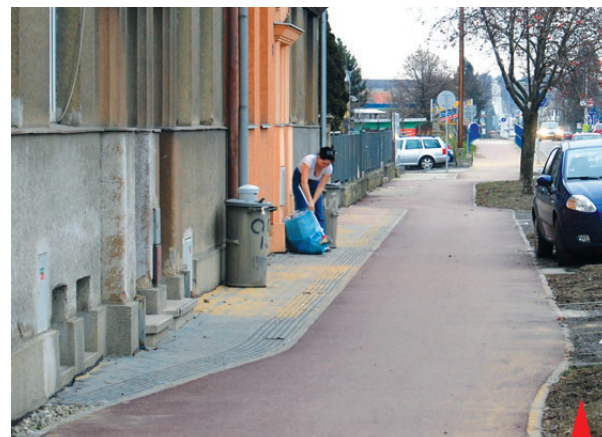
Obyvatelé těchto domů nemohou radnici přijít na jméno. Město jim postavilo cyklostezku šedesát centimetrů od vchodů do domů. Tak tady nejde už jenom o úraz, ale rovnou o život. Ovšem radní jsou jiného názoru...

právě pro ně budujeme celou síť cyklostezek po celém městě. A rovněž ta v Olomoucké ulici je po technické stránce naprosto v pořádku, byť je pouze šedesát centimetrů od obytných domů. Možná ně lidé bydlící v těchto