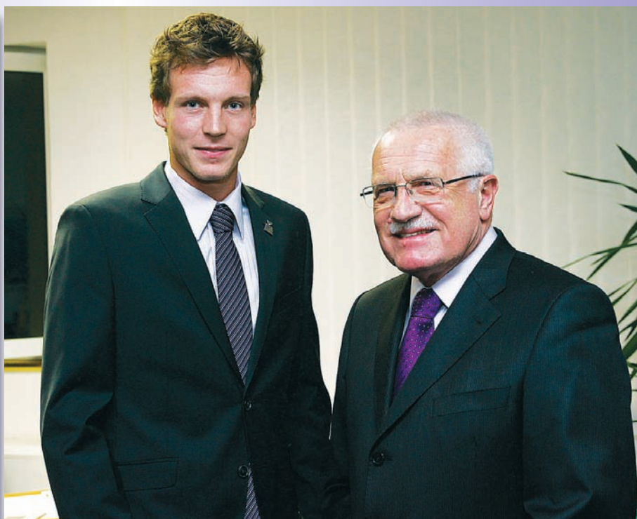
VYTVORÍ SPOLU DEBLA? Dvacátý hráč světa Tomáš Berdych se po čtyřech letech panování musel částečně vzdát trůnu čtyřmásového panovníka ankety. Že by pro příští sezonu vytvořil nový debllový pár s Václavem Klausem a ten jej vytáhnul opět o patro výš? No, nechme se překvapit...