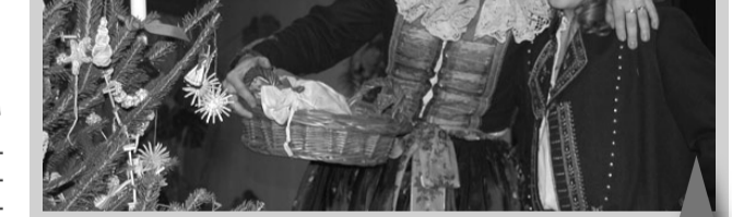
Ozdobený vánoční stromček je vrcholem adventního vystoupení.