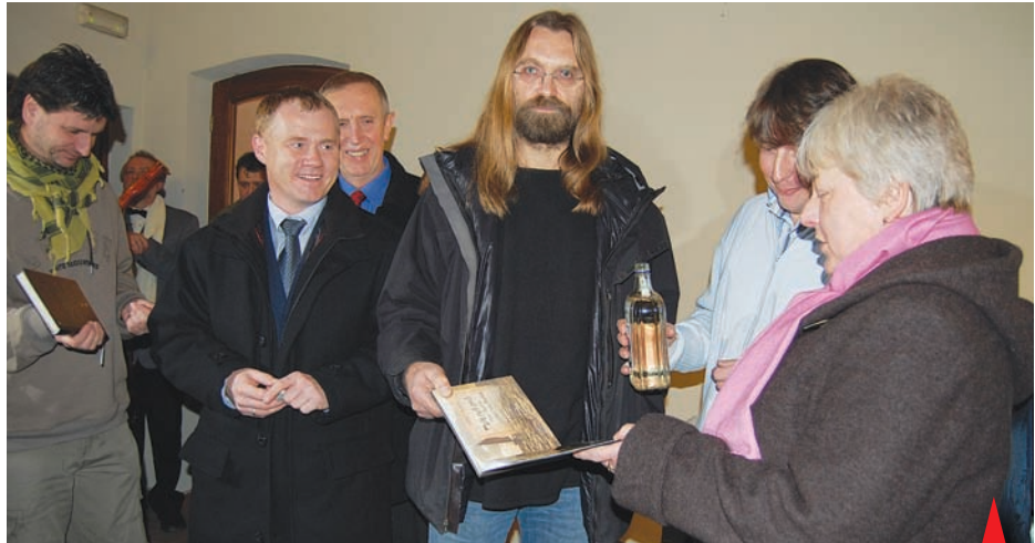
Dvojkřest prostějovskou pálenkou odstartoval cestu knih na předvánoční trh.

Výstava potrvá až do 23. ledna, ale milovníci přírody mohou nádherné fotografie Roberta Hlavici obdivovat týden co týden po celý příští rok díky Mysliveckému kalendáři, který obsahuje další zajímavé snímky z fotoarchivu čítajícího přes pětadvacet tisíc snímků. -jp-