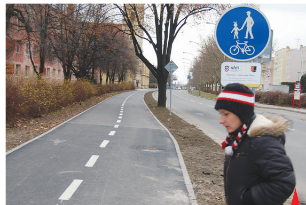
Stezka pro chodce i cyklisty v Brněnské ulici. Na celkem úzké komunikaci se musí umět jeden druhému vyhnut. Nechceme sýčkovat, ale brzy tady někdo přijde k úrazu...