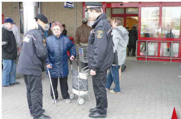
Strážníci zastavovali nakupující zákazníky před supermarketem a kontrolovali, kde mají uschovanou peněženku.

"V minulém týdnu proběhla další preventivní akce vyzvaná ze- jména seniorům s názvem „Kde mám peněženku?“. Před obcho- dními domy Kaufland a Lidl upo- zorňovali strážníci občany, aby si dávali dobrý pozor na své věci. Ti, kteří měli peněženku řádně uschovanou, dostali nákupní tašku s reflexní nášivkou. Ta je vhodným doplňkem pro nastáva- jící období, kdy se brzy stmívá. V tom opačném případě, kdy lidé vycházeli z nákupního centra s peněženkou v ruce, bylo jim vy- světleno jejich pochybení,"