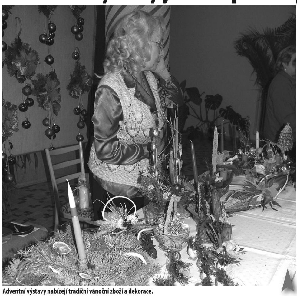
Adventní výstavy nabízejí tradiční vánoční zboží a dekorace.