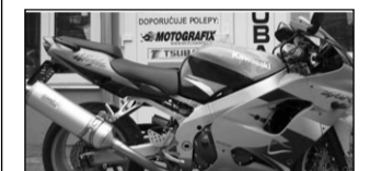
Kawasaki ZX9R Ninja, r.v.00, 75t