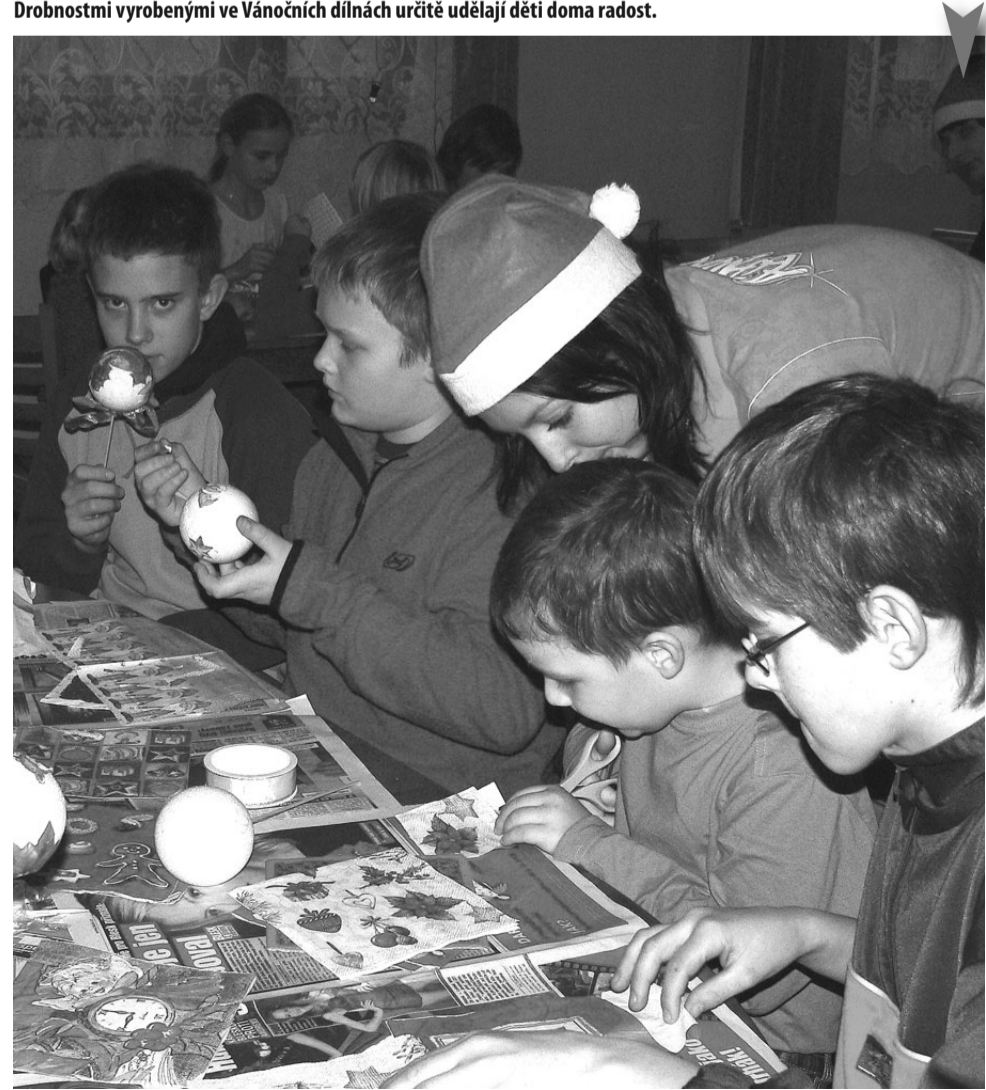
Drobnostmi vyrobenými ve Vánočních dílnách určité udělají děti doma radost.