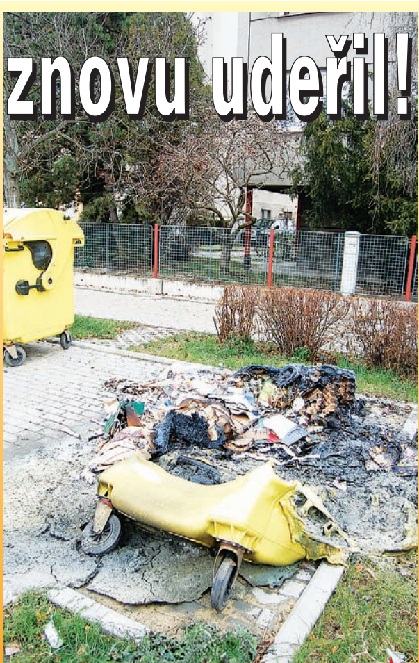
V Okružní ulici řádil v noci o víkendu žhář. Dvě plastové nádoby na tříděný odpad lehly popelem.

Ještě v živé paměti máme sériové případy žhářství z konce loňského a začátku letošního roku. Policie tehdy zatkla mladíka, kterému se připisovaly zhruba dvě desítky případů úmyslného zapálení kontejnerů na tříděný odpad po celém území Prostějova. Zdálo by se, že podobným pomateným činům je konec. Ale omyl, v noci ze soboty na neděli udeřil v Prostějově další žhář! "V nočních hodinách byl na naší stanici ohlášen požár dvou nádob na tříděný odpad v bytového domu poblíž kruhové křižovatky v Okružní ulici. Oba kontejnery v době příjezdu hasičů již zcela pohltily plameny, po uhašení z nich už moc nezbylo. Majitel vyčíslil škodu zhruba na devět tisíc korun," uvedl Josef Nedělník, vyšetřovatel Hasičského záchranného sboru v Prostějově. Podle něho je příčina požáru jasná. "Těžko mohlo jít o samovznícení nebo nedbalost například při odhození nedopalku cigarety do nádoby. Musel je někdo zapálit úmyslně," míní Josef Nedělník.