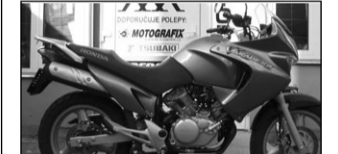
Honda Varadero 125,r.v.06, 63t