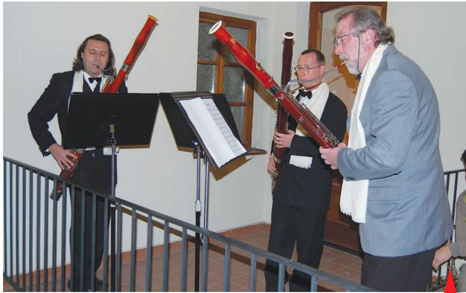
Originální fagotové trio vzniklo jen u příležitosti křtu.

„Byla to pro mne obrovská výzva. Dva roky jsem prožil se vzpomínkami odvážných mužů, kteří v roce 1967 vypluli na jachtách po stopách legendárního francouzského mořeplavce Alaina Bombarda. Propluli křížem krázem Středozemní moře až k africkým břehům, přes Gibraltar pak do Atlantiku. Plavby se zúčastnili i filmaři z bratislavské Koliby, takže vznikl film, který však byl zasunut v temnotách totality. Slovní podobu jsme dali s pamětníky dohromady až nyní. Čerpal jsem především ze vzpomínek, z lodního deníku, zápis-