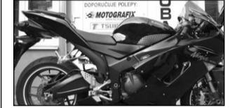
Kawasaki ZX6R, r.v.05, 107t