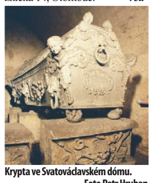
Krypta ve Svatováclavském dómu.

historického podzemí na celé Moravě,“ říká nadšený fotograf a speleolog. Ve středu 16. prosince proběhne od 17.30 hodin autogramiáda autorů knihy Olomoucké podzemí v knihkupectví Kosmas, Ostružnická 14, Olomouc. -red-