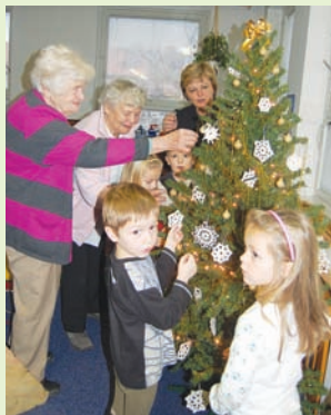
Vánoční stromeček v MŠ Krále ozdobily háčkové sněhové vločky a hvězdičky.

Drobné háčkové ozdoby na vánoční stromeček a zdobené perníčky pro mlsné jazýčky přinesly členky Kroužku šikovných prstů při občanském sdružení Lípka dětem v Mateřské škole A. Krále v Prostějově. Společně ozdobili stromeček, zazpívali koledy a pak se podívali na divadelní představení Příběh vánoční. Kroužek šikovných prstů je sdružení kantorek, které ač na penzi, stále mají k dětem vřelý vztah a své prsty nenechávají zahálet. Hadrové a háčkové hračky, zvířátka a další dárky věnovaly například do nadačního fondu Kapka naděje Venduly Svobodové, do dětských domovů nebo právě do mateřské školy. „Bylo nás osm, teď nás zbylo už jen pět. Dokud nám prsty slouží, stále vyrábíme ze zbytků vln, bavlnek a hadříků hračky pro děti a napadlo nás věnovat je také dětem z mateřských škol. Jako prv-