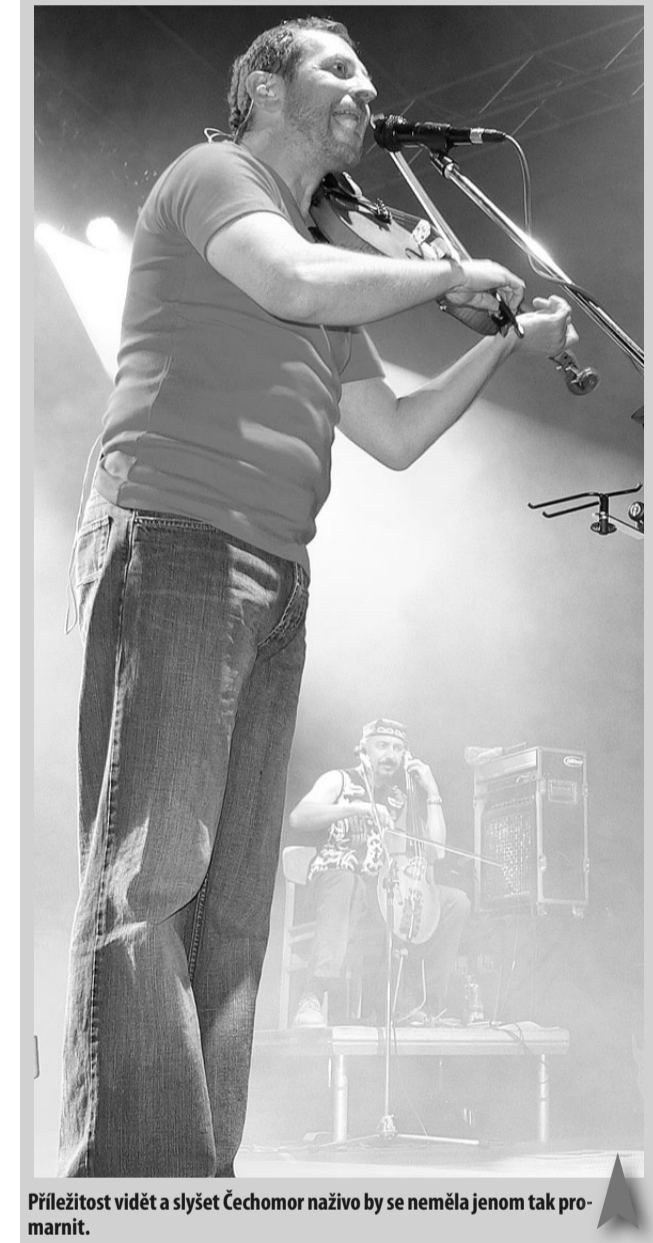
Příležitost vidět a slyšet Čechomor nazývá by se neměla jenom tak promárnit.

Už pozítří přijede kapela Čechomor do Olomouce. Koncert bude hostit KD Sídla a předvánoční čas není jen shodou okolností. Čechomor tuto část KOOPERATIVA TOUR 2009 částečně věnovala Vánocím. Není asi třeba se příliš zmiňovat o tom, že odkud Čechomor čerpá. Při hledání a objevování třeba i zapomenutých nebo nepříliš známých lidových písníček se samozřejmě tu a tam objeví i nějaká vánoční. Lidové koledy a vánoční písně z Čech, Moravy, Slovenska a Polska pak vydaly na celé album, které v loňském roce vyšlo pod názvem Sváteční Čechomor. A není asi lepší příležitost, jak je představit i živě, než při sérii předvánočních koncertů, z nichž jeden bude i v Olomouci. Nicméně „Sváteční Čechomor“ bude tvořit jen část celého vystoupení, určitě nepřijde ani o to, čím je kapela charakteristická. Svými turné Čechomor už třetí rok podporuje projekt Pomocné tlapyky zaměřený na výcvik a výchovu asistenčních psů pro tělesně postižené. Na něm se podílí spolu s jejíhož spolupracovníkem. Jenom po pořádku dojde, že střední koncert v olomoucké Sídli začíná v 19 hodin, vstup bude umožněn už od půl šesté. -MII-