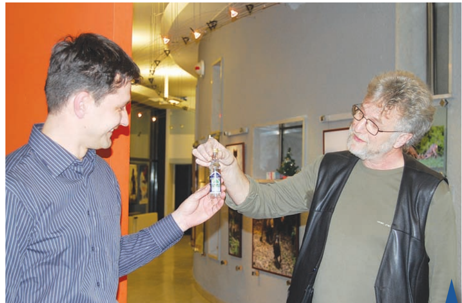
Pro autory je již obligátní odměnou pravá prostějovská pálenka.