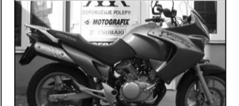
Honda Varadero 125, r.v.06, 63t