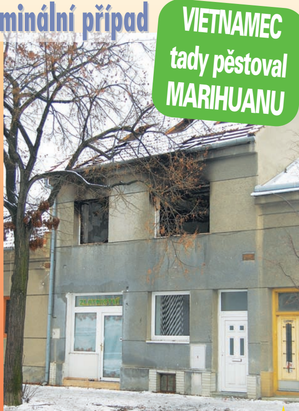
Při požáru domu v Jihoslavské ulici došlo k téměř milionové škodě. Uvnitř našli policisté pěstírnu marihuany. Zatčen byl sedmatřicetiletý muž vietnamské národnosti.

Vyhořelý interiér domu pak požárně prohledali jak hasičští vyšetřovatelé, tak policisté. A nestačili se divit. Na místě našli jasné stopy, které ukazovaly na tajnou pěstírnu marihuany. Bylo jen otázkou několika minut, než kriminalisté zatkl podezřelého Vietnamce. "V úterý 15. prosince 2009 byly zahájeny úkony trestního řízení ve věci podezření ze spáchání trestného činu nedovolená výroba a držení omamných a psychotropních látek a jedů, kterého se měl dopustit sedmatřicetiletý muž vietnamské národnosti. Uvedená výroba měla spočívat v indoorovém pěstování rostlin konopí k dosažení vysokého obsahu THC, dále k násled-