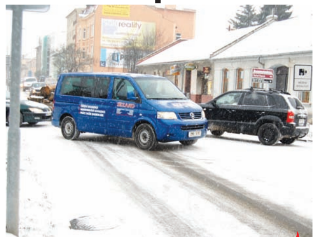
Pár centimetrů sněhu a v Prostějově je z toho málem hned kalamita. Na první silničáře čekali šoferi v Olomoucké ulici neuvěřitelných pět hodin!

ního stadionu. A chodí? Ti nedávali ještě víc. Jak známo, podle nového zákona je nyní za úklid chodníků zodpovědné město. A podle toho to také tak vypadalo. Náměstí T. G. Masaryka, které se má uklízet jako první, vesele zapadalo sněhem a lidé tady na chodnicích padali jako hrušky. První uklízeč vozítko technických služeb se na náměstí objevilo také až pozdě odpoledne. První letošní sních měl také za následek celou sérii dopravních nehod. Svě by o tom mohl vyprávět například řidič Fordu, který ve středu odpoledne zle havaroval na rychlostní komunikaci z Olomouce do Prostějova. "Ve středu 16. prosince ve 14.10 hodin jel čtyřicetiletý řidič vozidla Ford Focus po dálnici z Olomouce na Prostějov a z důvodu nepřiměřené rychlosti dostal smyk, přičemž narazil do středových svodidel. Od nich byl odmrštěn vpravo mimo komunikaci, kde se s vozidlem převrátil na střešku. Řidič z nehody naštěstí vyvázl bez zranění, dechová zkouška na alkohol byla v jeho případě negativní," uvedla Eva Čeplová, tisková mluvčí Policie ČR v Prostějově. Jak dodala, hmotná škoda na vozidle byla vyčíslena na 200 tisíc korun. -mik-