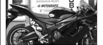
Kawasaki ZX6R, r.v.05, 107t