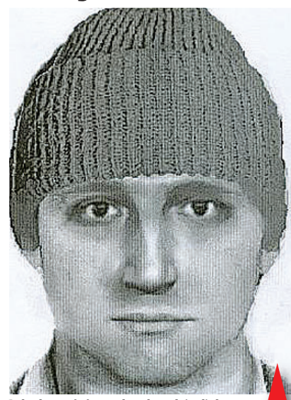
-mik- Pokud poznáváte pachatele, volejte linku 158

"V sobotu 12. prosince 2009 kolem 10.00 hodin se v Konečné ulici v obci Držovice dosud neznámý pachatel pod falešnou záminkou výkonu funkce pracovníka elektrárny odcizujícího hodnoty na elektroměrech v jednotlivých odběrových místech Držovic dostal do vnitřních prostor majitele domu. (1924). Pachatel se záměrem získat finanční prostředky pětáosmdesátiletého muže fyzicky napadl. Následně muže zanechal svázaného ve sklepních prostorách domu, prohledal jeho obytnou část, kde odcizil finanční hotovost ve výši 50 000 korun," sdělila Eva Čeplová, tisková mluvčí Policie ČR v Prostějově. "Poškozený muž utrpěl zranění v podobě oděrek a podlitin v obličejí a na rukách, které si vyžádalo ošetření u lékaře. Po neznámém pachateli se intenzivně pátrá," dodala mluvčí prostějovské policie. Kriminalisté znají podobu pachatele a v pátek nás požádali o zveřejnění jeho identikitu. Pokud ho znáte, předejte o něm jakékoliv informace policistům na bezplatnou linku 158.