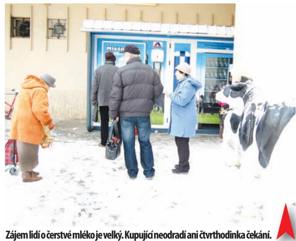
Zájem lidí o čerstvé mléko je velký. Kupující neodradí ani čtvrt hodinka čekání.

ení je v nerezovém provedení a Centrální státní laboratoř denně odebírá namátkově vzorky. Ke spotřebiteli jde skutečně kvalitní, čerstvé a zdravé mléko," vysvětlil Zdráhal. Jednou z hlavních podmínek je také trvalé a kvalitní veterinární ošetření dojníc. Litř mléka z automatu přijde spotřebiteli na stejnou sumu, jakou zaplatí za litř krabicového v marketu. Kvalitu a chuť nelze porovnávat. Zájem kupujících povzbudil vedení družstva k vytipování dalších míst v Prostějově i v regionu, kde chtějí mléčné bary instalovat. -jp-