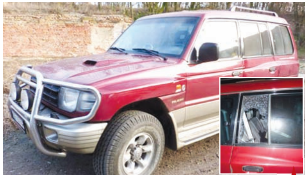
Vozidlo Mitsubishi Pajero bylo v pondělí po poledni vykradeno na parkovišti u ČSOB ve Školní ulici. Jak je vidět ze druhého snímku, zloděj rozbil sklo na bočních dveřích a z auta odcizil značnou sumu peněz.

Na nehoráznou neopatrnost doplatil minulý pondělí muž, který krátce po poledni odstavil své vozidlo na parkovišti mezi obchodním centrem Atrium a bankou ČSOB. Muž si jen "odskočil" do banky něco vyřídít a po několika málo minutách se ke svému vozidlu vrátil. Uviděl však rozbité boční sklo na dveřích a posléze zjistil, že mu zloděj ze sedadla ukradl tašku s obrovskou finanční hotovostí. Poškozený nyní žádá i veřejnost o pomoc. Hledají se svědci, kteří mohli zloděje vidět přímo při činu.