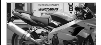
Kawasaki ZX9R Ninja, r.v.00, 75t