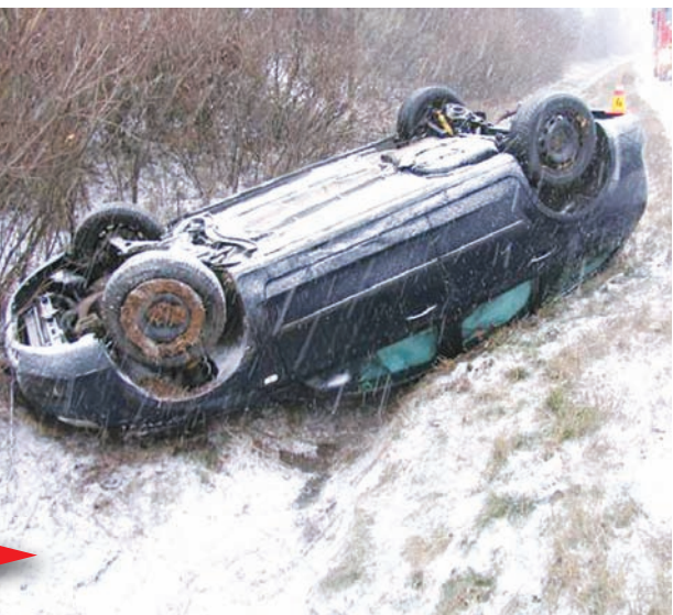
Řidič tohoto Fordu měl ve středu nebetýčné štěstí. Auto na střeše v příkopě a on vyvázl bez zranění!