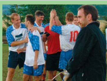
Sport přináší radost i smutek... PROSTĚJOVSKÝ Večerník je u všeho!

- ě JD QENRIN P i OR GHVWN KRQIQ RNDMP H NRCHF VMLKPR D SFĚKRG QRPKURNX / HRSĚHV SFQCHO RSĚVDFGX JIMP DĚFK UGRVĚFK P pQĚ YHĚFK L SFHNSDĚFK XG QRWD G VHSFHSRNDQDVAH UREQN Q WP ENCHREGREQE AP XA VQENP XGFHVMHĚENP X P pQĚ 352 67 Ě-296. ě 9 HĚQN VHQDICEVWAG X WKRDSFIQ ĚHV Y P DNVI QI QIRP DEH9 HVSRIQ NP HVN E Q VĚYĚP LYSRURQP L NOIE RGGQ NĚQRNP L L VP RV QĚP L VSRURĚL D VSRURAN QĚP L J QĚHKRUHTRCK 7LYĚFKQE YI P Q Q U GLSRĚNRDDJ DYĚLSĚJĚ H SRĚSRUXDĚNG LSREKSHQ NMLP MMVQP LYNRĚHRP URH P ěO =i URH YI P SFHVAHI (- GRURX Q VQENRKR NMLĚ P i YANJHJDM P DĚ ĚVOP ĚU 3RGREQ VQDP i P HQVGLLP YHSRURQP UĚDNL9 HĚQNX =D YĚFKQ NWH SURY VAGQERVAGQ SFSDXNVI SUDRĚNMV ĚSRUWĚH URKRIKI VQWVNI D P QRK GĚFK QĚE VĚFK QIRP DR YI P P QRK ĚVWV JGDĚ D -VĚFKĚ