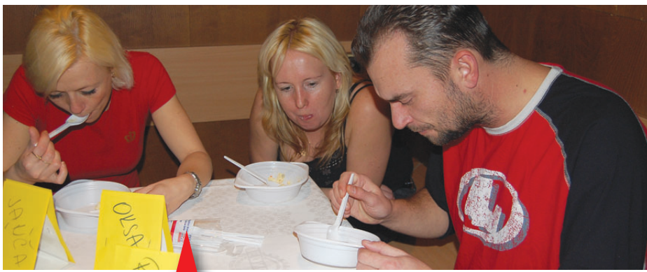
Tříčlenná porota zapojila chuťové i zrakové buňky.