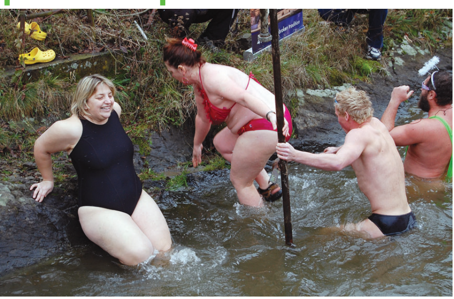
Otužilci se před početnou návštěvou patnácti stovek diváků směle vrhali do chladné vody ve výpusti Plumlovské přehrady. Někdo se v ní čvachtal i hodné dlouhých minut, jiní po pár plaveckých tempech prchali do tepla vyhřátých šaten. Nechyběly ani tradiční slušivé oblečky účastníků této tradiční a populární akce.

Představit si Štědrý den bez koupele na Plumlovské přehradě, to je pro násince už šestadvacet let naprosto nemyslitelné. Plavci TJ Haná Prostějov ve čtvrtek uspořádali tradiční akci, která přilákala šestatřicet otužilců a spolu s nimi na hráz přehrady bezmála 1 500 diváků. Zatímco přihlížející drkotali v teplém oblečení zuby, otužilci se krátce po poledni směle ponořili do chladné vody přehradní výpusti. Podmínky pro 26. ročník Vánoční koupele byly znovu přijatelné. I když otužilci zase trochu remcali, že by si přáli konečně mráz, sníh a led. Ani letos jim to nebylo dopřáno, teplota vzduchu se držela na pěti stupních nad nulou, voda tak byla chladnější,