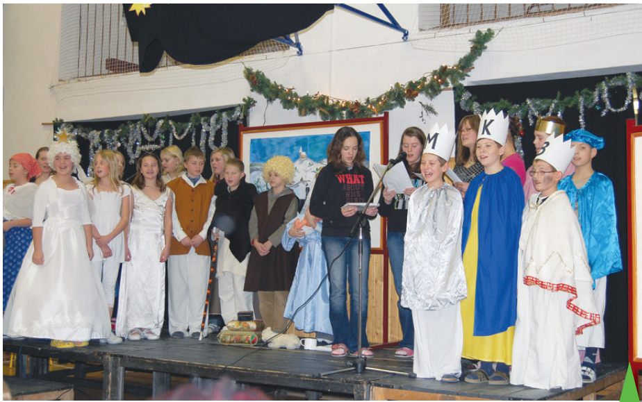
Pod betlémskou hvězdou odehráli žáci příběh o narození Ježíška.

Česká vánoční legenda příjemně zpestřila adventní období školákům a rodičům, a byla také skromným přáníčkem k vánočním a novoročním svátkům. „Je to takové milé poděkování všem příznivcům vrahovické školy od našich žáků. Prvníáci