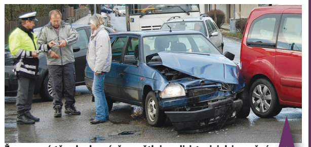
Žena na místě nehody právě vysvětluje policistovi, jak je možné, že při vyjždění z vedlejší ulice nedala přednost.

Tak to byly vypráskané Vánoce! Ve středu 23. prosince okolo poledne došlo k dopravní nehodě tří vozidel ve Sportovní ulici. Přestože zatím chybí oficiální popis karambolu ze strany policie, podle svědků za nehodu může žena za volantem Škody Favorit, která vyjžděla z Květné ulice, přičemž nedala přednost po hlavní komunikaci jedoucímu vozidlu. Došlo ke srážce, obě auta vzápětí pak narazila ještě do třetího. "Ta ženská jednoznačně nedala přednost, navíc je podle mě opilá jako Dán," ulevil si poškozený řidič z notně nabouraného stříbrného Volkswagenu. "Mám vozidlo ještě v záruce, nedávno