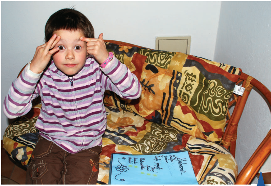
Do hlaviček nadaných dětí se vejde daleko víc informací, než jim může dát běžná školní výuka.

„Pro speciální třídu jsme vyčlenili vhodné prostory v budově Masarykovy školy na Skálově náměstí. Třída pro 22 dětí s rozšířenou výukou bude vybavena speciální technikou, která bude maximálně využívána, samozřejmě bude interaktivní tabule a počítačová hnízda. Umělecky talentované děti budou využívat pro rozšířenou výuku estetiku školní keramickou dílnu a ateliery. Příprava projektu je s podporou pedagogů v závěrečné fázi,“ informoval ředitel ZŠ Palackého Jiří Pospíšil. Jak dále uvedl, po ukončení 5. třídy budou školáci pokračovat v osmiletém studiu na gymnáziu bez přijímacího. Prostějovské GJW je patronem projektu.