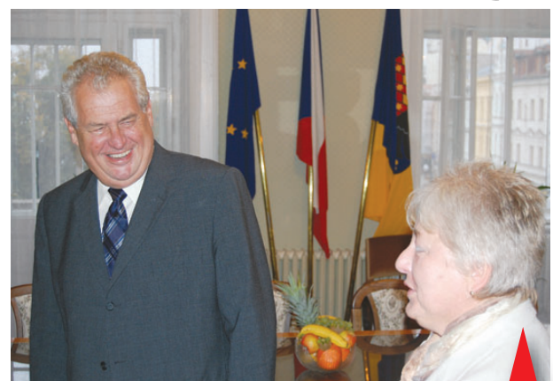
Naše město vloni navštívila jedna z největších politických celebrit uplynulých dvaceti let. Miloš Zeman se vrací do velké politiky a tak prohodil pár slov i s prostějovskými radními.

rovnání s městem dohodu. Kasář vylopuil poštu v Němčicích nad Hanou a prostějovští radní prohlásili, že mají v ruce čtyři návrhy řešení nebezpečné krížovatkou u Domu služeb v Olomoucké ulici. Jako nejlogičtější se jeví stavba nového rondelu. Na přehradě je už pomalu vidět dno a tak se zde kromě tisíců zvědavců pohybují i lovci pokladů s detektory kovů. Konšelé už začínají horečně jednat o nové vyhláše, která by zakázala pití alkoholu na veřejnosti, především u škol a městských sportovišť. Poprvé po třiletém provozu vykazal prostějovský aquapark ekonomický zisk. Malý, ale přece. Prostějovská kriminálka odhalila varnu pervitinu v Žárovicích. Uprostřed října zasáhla celé Prostějovsko nečekaná sněhová kalamita. Nejhorší situace byla na Protivanovsku a v okolí Drahan a Malého Hradiska. Sníh se objevil k radosti zejména dětí i v Prostějově. Slavný hokejista Oldřich Machač tvrdě zkritizoval radnici za nedostatečnou hlídkovou službu strážníků na městském hrbitově. Machač poukazuje na to, že z rodinné hrobky zmizela už spousta cenných věcí. Prostějov navštívila politická celebrita Mi-