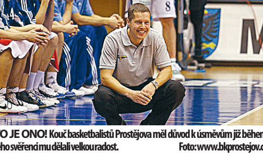
HOŠI, TO JE ONO! Kouč basketbalistů Prostějova měl důvod k úsměvům již během zápasu. Jeho svěřenci mu dělali velkou radost.

ještě o jeden stupínek výš. Zdálo... (text pokračuje)