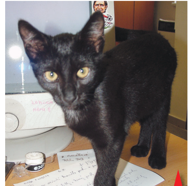
Zřejmě největší událostí roku uvnitř naší redakce bylo přijetí nového člena. Černý kocourek dostal jméno Jackson na památku zemřelého krále popu. A věřte, stále se nám plete do práce!