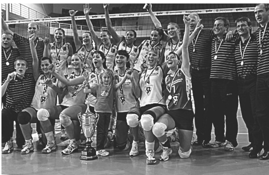
MÁME ZLATO! Volejbalistky Prostějova zvídaly jak základní část, tak i nástrahy play off a staly se poprávu mistryni ČR pro rok 2009. Navíc vyhrály Český i Česko-Slovenský pohár a při svém premiérovém vystoupení v Lize mistryň jim chybělo málo, aby se radovaly i z posunu mezi evropskou elitu.