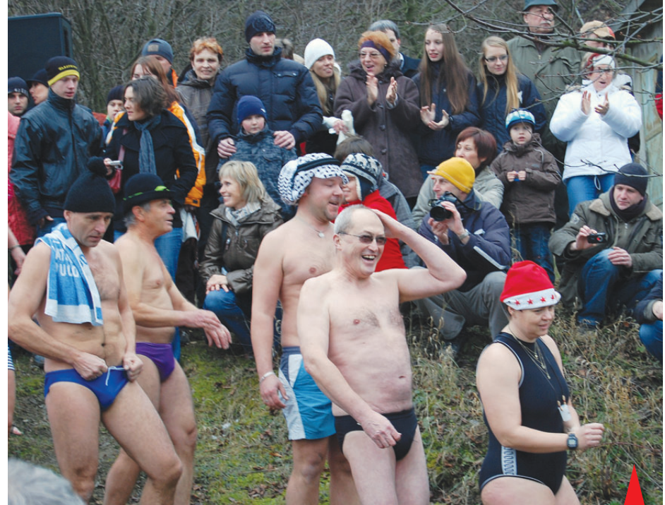
Závěr roku by se pochopitelně neobešel bez tradiční vánoční koupeli otužilců na Plumlovské přehradě. Rekordní počet šestáctičtíř plavců se ponořil do vody za bouřlivého aplauzu bezmála patnácti stovek diváků.

Za restauraci Luto bylo nalezeno další mrtvé tělo bezdomovce. Záchranáři byli obviňováni z toho, že muži neprijeli poskytnout lékařskou pomoc poté, co je personál restaurace volal. Město ohlásilo veřejnosti, že se bude renovovat stoletá kanalizační síť v Prostějově. Strážníci honili po náměstí nahatého chlápka, který zřejmě prohrál sázku a byl donucen běhat po městě tak, jak ho Bůh stvořil. Sousedé z Držovic změlki a místo soudu navrhuji při dodatečném majetkovém vy-