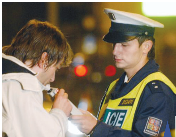
Policejní hlídky kontrolovaly během vánočních svátků a před Silvestrem řidiče na celém Prostějovsku.

pady z Plumlovka byly policisty zjištěny dne během druhého svátku vánočního. Ve 22.00 hodin v obci Soběšuky, kdy byla při dopravní kontrole dvacetiletému řidiči naměřena hodnota 0,40 promile alkoholu a téhož dne kolem 21. hodiny v obci Mostkovice řidiči vozidla Opel Astra hodnota 0,75 promile alkoholu. V obou uvedených případech se jedná o přestupky proti bezpečnosti a plynulosti provozu na pozemních komunikacích,“ sdělila nám Eva Čeplová, tisková mluvčí Policie ČR v Prostějově. Další tři případy přistižených opilců za volantem jsou evidovány Obvodním oddělením Policie ČR v Prostějově. „Trestný čin ohrožení pod vlivem návykové látky spáchal mladý triadvacetiletý muž z Prostějova, když řídil dne 26. prosince motorové vozidlo Renault Thalia v ranních hodinách na ulici Brněnská v Prostějově, přičemž byl kontrolován hlídkou policie a byla mu naměřena hodnota 1,87 promile alkoholu. Zbýlé dva případy byly zjištěny ve stejný den ve 23.40 hodin a pak ještě 28. prosince 2009 ve 20.30 hodin, v obou případech na ulici Brněnské. Pětapadesátiletý muž, který řídil vozidlo Volvo, nadýchal hodnotu 0,22 promile a čtyřiatřicetiletý