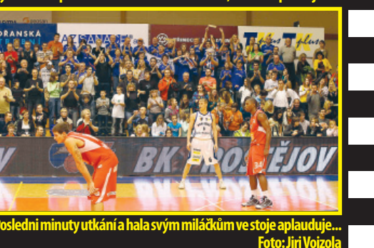
Poslední minuty utkání a hala svým miláčkům ve stoje aplauduje...