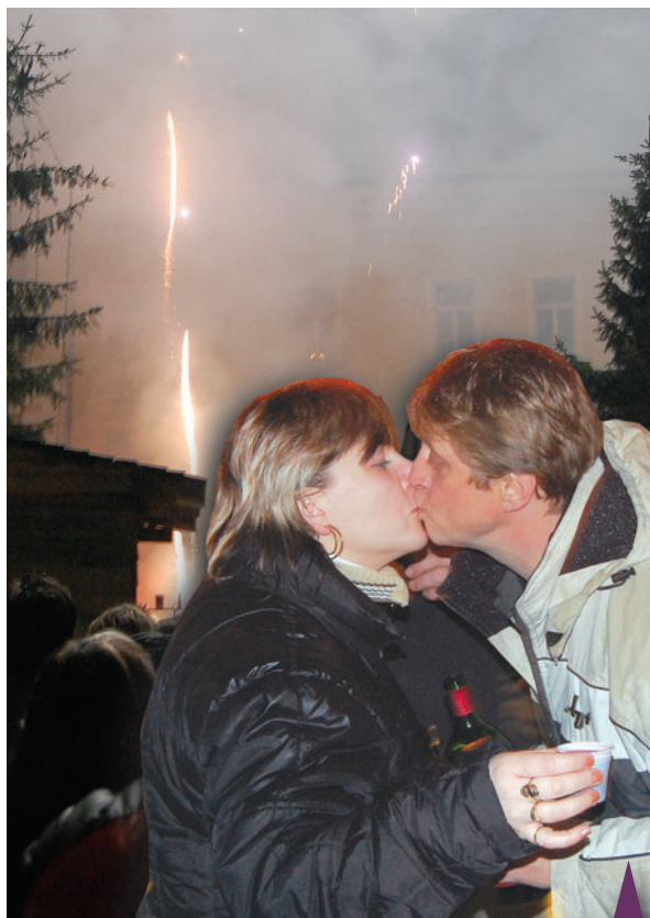
Kdo se na náměstí po půlnoci nepolíbil, jako by tam vůbec nebyl. Šampaňské teklo proudem, lidé se i v dešti pořádně vyřádili. Stejně jako uklízení čtyři dny ráno...

Organizátoři totiž jaksi zapomněli na odpočítávání posledních vteřin starého roku, takže návštěvníci našeho náměstí stáli ještě pár minut po půlnoci jako opaření a zmateně se jeden druhého ptali, zda už je Nový rok. A co horšího, nikoho z pořadatelů ani nenapadlo, že by mohla tradičně s prvními vteřinami roku 2010 zaznít česká hymna. Prostě faux - paux jako vyšití! Navíc novoroční ohňostroj začal až sedm minut po půlnoci, což firma pověřená touto akcí také