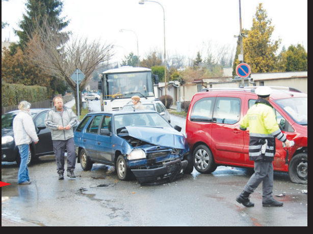
dýchnout. Ti nás ale uklidňovali vysvětlením, že odmítnutí dechové zkoušky je spíše přítěžující okolností a že v tom případě se na ženu pohlížejí jako na opilou. Ale pozor, něco tady nehraje. Jak je tedy možné, že tato stejná žena vlastní i nadále řidičský průkaz a dnes si jezdí autem vesele dál? Více o případu na třetí straně dnešního vydání. -mik-

Psal se 23. prosinec 2009 a ve Sportovní ulici došlo k dopravní nehodě tří vozidel. Způsobila ji blondýna středního věku, která za volantem favoritu nedala přednost a postupně nabourala dvě vozidla jedoucí po hlavní komunikaci. Podle všeho ale nešlo o pouhou neopatrnost. "Je opilá jako Dán, podívejte se na ni, sotva se drží na nohách. Nebo je zfetovaná," ukazoval před námi prstem na viníka nehody jeden z řidičů nabouraného auta. Při vyšetřování bouračky však žena policistům odmítla