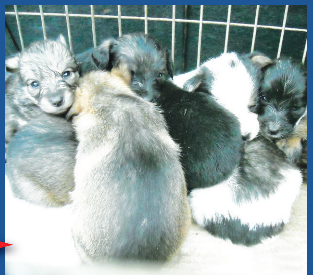
Snímek pořízený strážníky těsně po nálezu. Hladová štěňata byla nalezena v krabici u kontejneru.

Pro milovníky psů máme však nakonec dobrou zprávu a zároveň vzkaz. Malým štěňátkům se už nyní vede dobře a pokud byste některé z nich chtěli mít doma, můžete si pro ně dojet do psiho útulku v Čechách pod Kosířem. -mik-