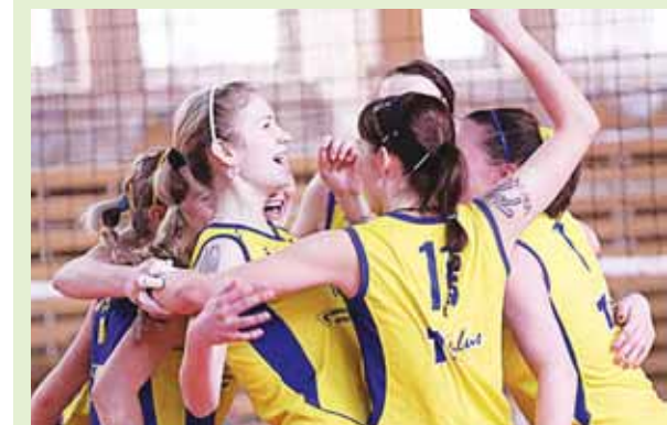
EUFORIE. Kadetky VK Modřanská Prostějov mohly slavit, oba domácí zápasy v baráži o extraligu zvládly a k postupu do nejvyšší soutěže už jim chybí pouze poslední krok!