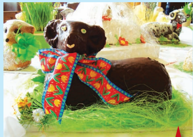
Vybrat toho nejkrásnějšího velikonočního beránka bude jako každý rok hodně složité.