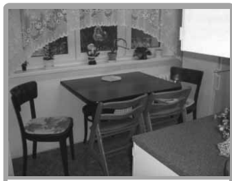
Prostějov | Prodej velmi pěkného bytu 2,5+1 v OV na sídl. Svobody.