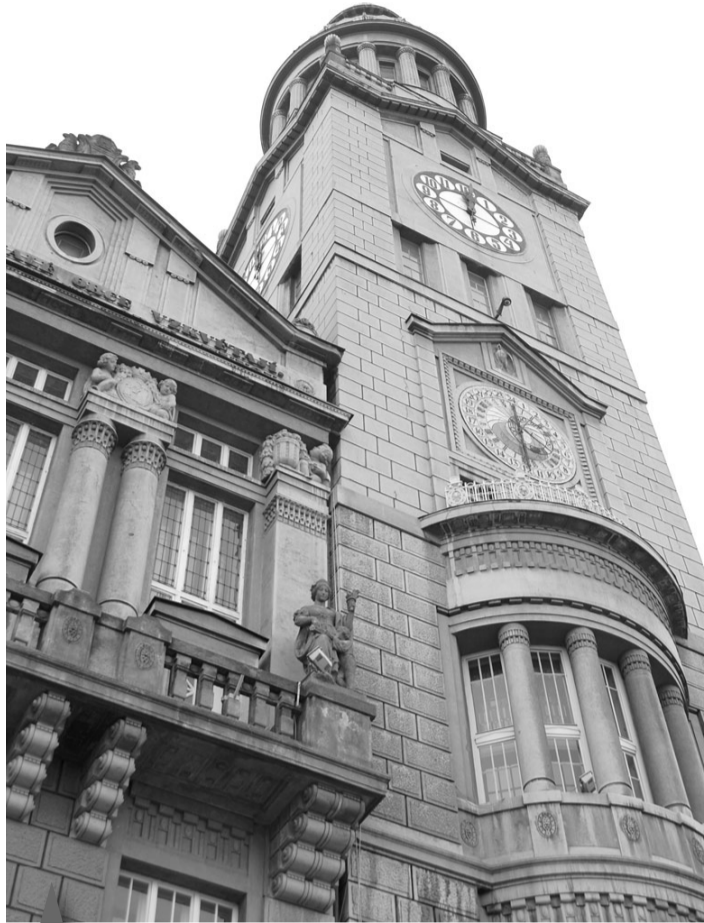
Už příští rok se můžeme dočkat toho, že věž radnice až po ochoz bude zpřístupněna veřejnosti. A ještě bychom k tomu mohli dostat průvodce...

V plánu našich konšelů také je, aby věž radnice byla přístupná co nejčastěji. "Neříkáme že každý den, ale rozhodně co nejčastěji. Tento náš záměr je ovšem také spojen i s průvodcovskou službou, která by mohla návštěvníkům předávat i zajímavé informace o historii radnice a zároveň dbát na jejich bezpečnost. Touto službou bychom určitě ztraktivnili naši radnici. Myslím si, že mnoho Prostějovanů by uvítalo možnost vystoupat do radniční věže a rozhlédnout se okolo sebe. Když jsem tak nedávno učinil já, zdá se mi Prostějov z té výšky relativně velmi malý. Jako bych rukou dosáhl z věže až na hřbitov," podotkl místostarosta. Už před několika týdny se konšelé vytasili s plánem na celkovou rekonstrukci prostějovské radnice, která by měla být dokončena v roce 2014, tedy při 100. výročí jejího dostavění v roce 1914. Zpřístupnění ochozu věže jde ale mimo tuto rekonstrukci. "Je to něco navíc. Co se týká plánované celkové rekonstrukce radnice, při ní se budeme zaměřovat především na odstranění technických problémů tak, aby radnice sloužila potřebám městského úřadu v 21. století. Ale příznám, že zpřístupnění věže bude určitým komfortem a opravdu něčím navíc pro návštěvníky, kteří budou chtít někdy v budoucnu stoletou radnici navštívit," uzavřel Miroslav Pišťák. -mik-