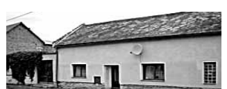
Prodej RD 2+1 s příjezdem a zahradkou v Určicích. Koupelna s vanou, splach. WC. Obecní voda, vytápění na tuhá paliva, plyn před domem. Zast. plocha 316m 2 , zahrada 160m 2 . Cena: 700 000Kč