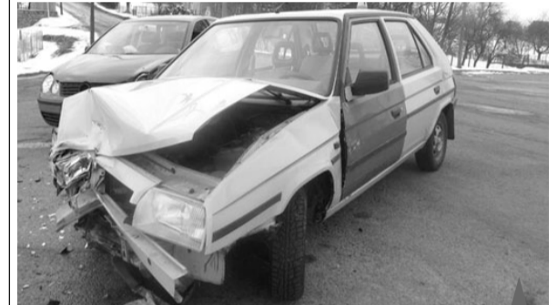
Při karambolu na křižovatce v Jednově to našťestí odnesly jen pomákané plechy.

leva na Hrochov přednost protijedoucímu vozidlu Volkswagen Polo, které řídil třicetiletý muž z Prostějovska. Došlo ke střetu vozidel a k jejich poškození. Celková škoda byla vyčíslena na 75 000 korun. U obou řidičů byla provedena dechová zkouška s negativním výsledkem. Technická závada, jako příčina dopravní nehody, nebyla na místě ohledáním zjištěna ani uplatněna. Celou věc dále šetří Skupina dopravních nehod," uvedla k nehodě Eva Čeplová, tisková mluvčí Policie ČR v Prostějově. -mik-