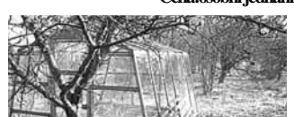
Prodej zahrady 327m 2 se zděnou zahrad. chatkou, skleníkem, studnou a elektr. vlt. na Dobroměřicích. Cena: 180Kč/m 2

Pronájem prodejny 95m 2 a skladu 30m 2 v centru města. Možno využít i na služby. Dokončovací práce lze provést dle přání nájemce! Cena: 12 000Kč/měs. + inkaso