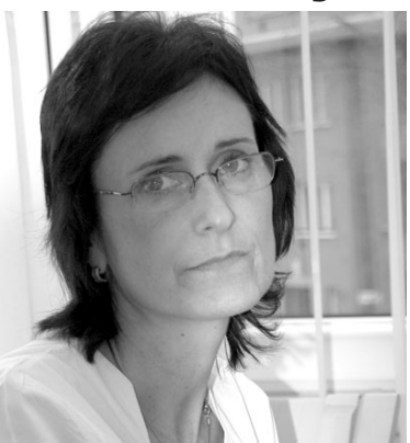
mohou objevit až rok po nehodě!

Proč je tomu tak? Podstatou problému je poranění měkkých tkání - svalů, šach, ligament. A nejen jich. Také dochází k trhlinám čelistního kloubu, mikroskopickým poraněním chrupavek hrtanu a mikroinfarktům mozkového kmene. Pokud účinně nezasáhne, tak je nervová tkáň nahrazena glií-jizvou. To má za následek zhoršení sluchu, ušní šelesty, bolesti hlavy, poruchy spánku a koncentrace a podobně. Přitom příznaky se