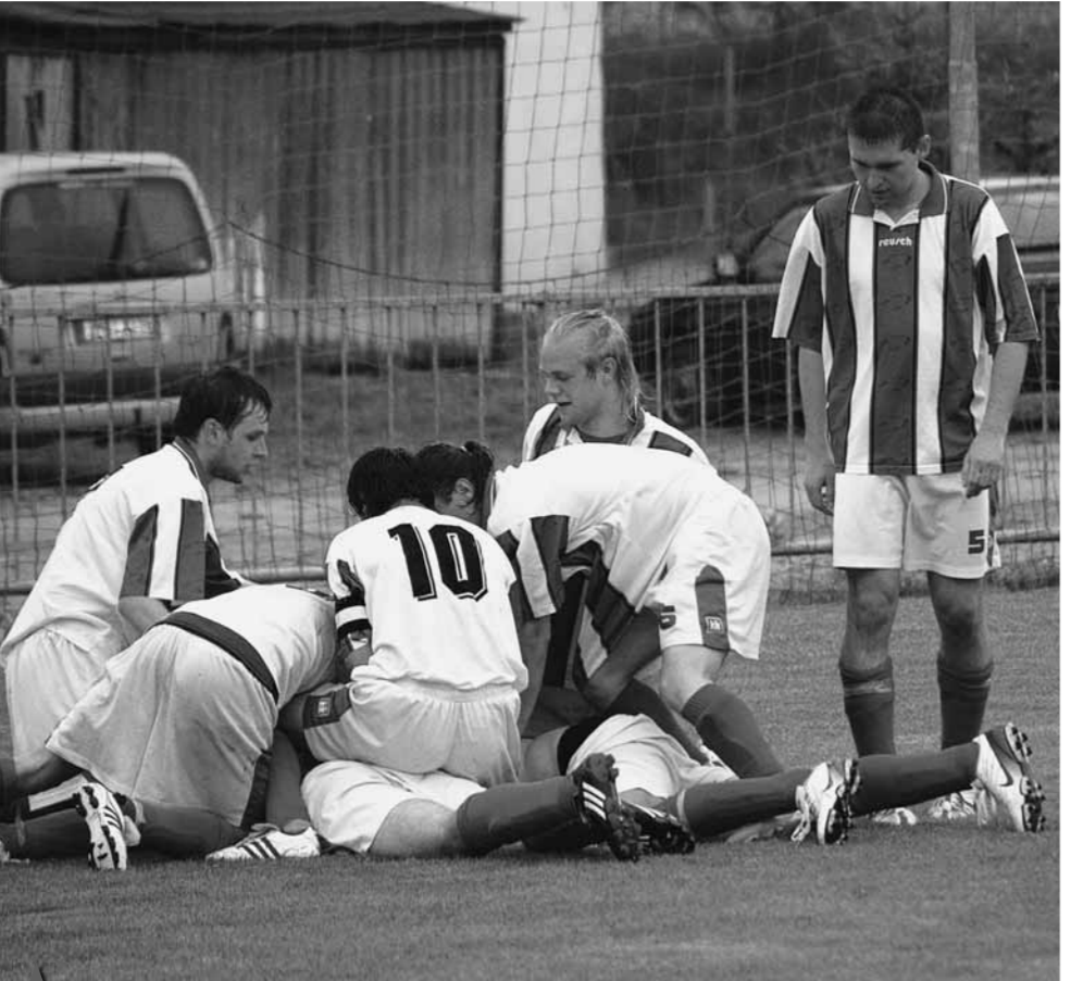
PŘIPRAVIT, POZOR, START! Právě o uplynulém víkendu měly začít nižší soutěže Olomouckého KFS, které svůj program nakonec zahájí až o týden později. Nejvíce radosti si v podzimní části užili fotbalisté Jesenec.