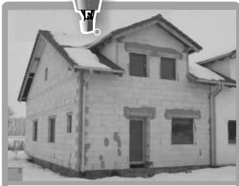
Olšany u Prostějova | Prodej hrubé stavby RD 4 kk.

RE/MAX prodává nejvíce nemovitostí na světě 75 zemí, 6 536 kancelářů, 93 338 makléřů