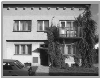
Čechy pod Kosířem | Prodej pěkného RD 2+1, 4+1.