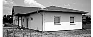
Prodej novostavby RD 4+kk s garáží a zahradou v Mostkovicích. Nízkoenergetické, bungalov - dřevostavba. Kuchyňská linka na míru s elektrospotřebiči, koupelna s vanou, rekuperační jednotka atd. Pozemek 835m 2 . Cena: DOHODOU