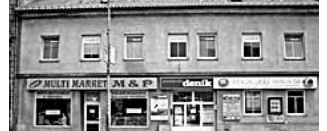
Prodej dvoupatrového komerčního objektu s využitím podkrovní v centru Prostějova. V objektu se nacházejí obchodní a kancelářské prostory. Zásobování z dvorního traktu, kde jsou situovány i garáže a parkoviště. BĚŽÍ info v RK. Cena: osobní jednání