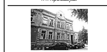
Prostějov, Havlíčkova ul. Činovní dům v centru města, vel. 2x4+1, každé podla- ží 120m 2 , nová střecha, zahrada, celé podsklepeno, při- praveno na rekonstrukci. Zast. plocha 219m 2 , zahrada 231m 2 . Cena: Kč3.290.000,-

Fotokazdého bytu najdete na: www.jhrealty.cz