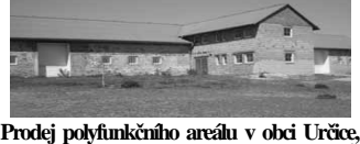
Prodej polyfunkčního areálu v obci Určice, okr. Prostějov. Plocha areálu cca 8100m 2 , čtvercový tvar. Admin. budova, stáje, bývalá sýpka a skladhala 67m x 12,5m. Průběžná údržba. Cena: DOHODOU