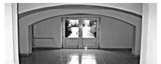
Pronájem nebyt. prostor 200m 2 v Prostějově. Snížené přízemí, dva vchody, 2x WC, sprcha, dlažba, variabilní prostor. Vhodné i na cukrárnu, pekárnu atd. Cena: 14 000Kč/měs. + služby

Pronájem prodejny 95m 2 a skladu 30m 2 v centru města. Možno využít i na služby. Dokončovací práce lze provést dle přání nájemce! Cena: 12 000Kč/měs. + inkaso