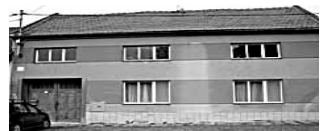
Prodej RD, s příjezdem, garáží, dílnou a zahradkou v Žesově Plyn. vyl. obec. voda i studna, ele., žumpa. Cena: DOHODOU

1+1, ul. Winklerova, os. vlt. chl. zvýšené přízemí, 38m 2 . Nová koupelna se sprch. koutem, nový kotel. Cena: 850 000Kč