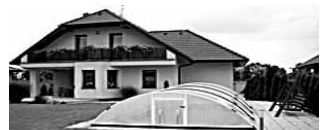
Prodej nového RD 5+1 v obci Mostkovic. Podlah. vytápění, krb, nábytek a vest. skříně na míru, balkon, garáž, dílna, posezení s venk. křeslem, bazén, samozavlaž. systém na zahradě, alkam. atd. Pozemek 1000m 2 . Doporučujeme! Cena: 8 000 000Kč POZOR SLEVA: 6 900 000Kč !!!