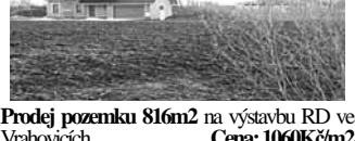
Prodej pozemku 816m 2 na výstavbu RD ve Vrahovicích. Cena: 1060Kč/m 2 Prodej st. pozemku na RD v Mostkovicích. Všecké ing. síť. Výměra 994m 2 . Cena: 1600Kč/m 2

Pronájem zpevněné plochy 500m 2 s Unimobankou a WC u sjezdu z dálnice. Cena: 250Kč/m 2 /rok