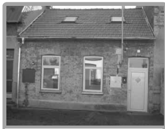
Kostelec na Hané | Prodej RD 3+kk po rekonstrukci.