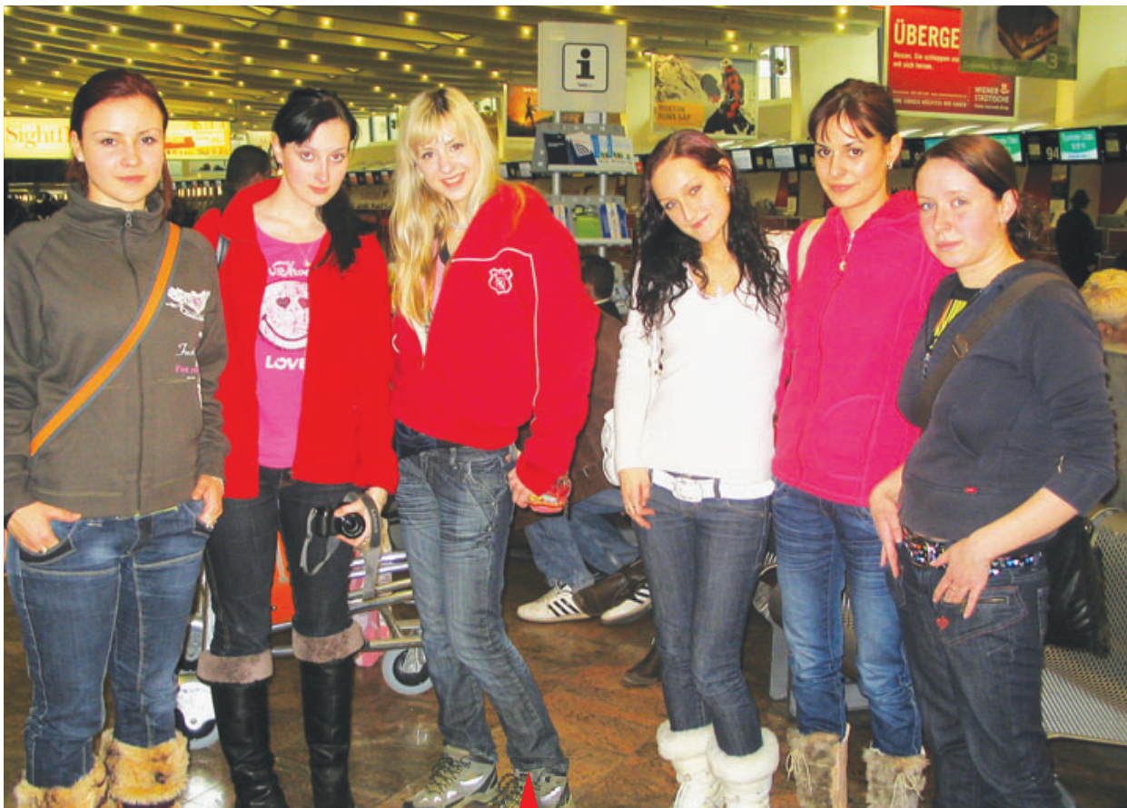
Budoucí sestřičky a oděvní návrhářky získaly ve Finsku nové zkušenosti zejména v oblasti jazykových dovedností.