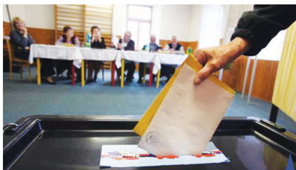
V pátek od 14.00 do 22.00 hodin a v sobotu od 8.00 do 14.00 hodin budou v Prostějově otevřeny volební místnosti ve 44 okrscích.

Úsilí politických stran dostoupilo v těchto dnech vrcholu. Už o tomto víkendu v pátek a sobotu se kandidáti do Parlamentu ČR dozvědí, jak zaujali voliče svými programy a sliby. A pozor, po letošních volbách má Prostějov jedinečnou šanci mít ve Sněmovně hned čtyři poslance!