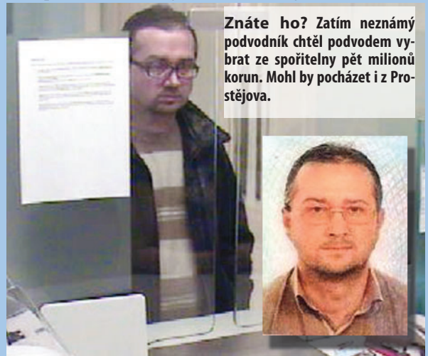
Znáte ho? Zatím neznámý podvodník chtěl podvodem vybrat ze spořitelny pět milionů korun. Mohl by pocházet i z Prostějova.

udání důvodu z pobočky odešel. Následně pracovníci zjistili, že předložené doklady jsou padělané a celou věc oznámili policii. Ta nyní pátrá po muži, jenž se padělanými doklady a padělaným průkazným lístkem k bankovnímu účtu prokazoval," uvedl Michal Pižurin, tiskový mluvčí krajského odboru Poli-