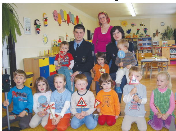
Mezi dětmi. Policisté navštívili v rámci besed i nejmenší děti ve školce v Malém Hradisku.

no modelové dopravní hřiště s dopravními značkami. Zde děti prokázaly své teoretické znalosti i po praktické stránce. O den později navštívili policisté z Obvodního oddělení Konice a Preventivně informační skupiny Policie ČR z Prostějova děti ze Základní školy v obci Přemyslovice. Setkání se uskutečnilo v prostorách základní školy a zúčastnilo se ho celkem 55 žáků. Policisté si pro děti připravili besedu zaměřenou na oblast činnosti Policie ČR jako jedné z bezpečnostních složek státu. "Děti se v přednášce dozvěděly informace o činnosti všech složek, které jsou v Policii ČR zúčastněny. Tyto informace jsme doplnili také prezentačním videomateriálem, po kterém jsme byli dotazováni na celou řadu nejrůznějších otázek. Aby slovo dostaly ovšem i děti, připravili jsme pro ně vědomostní