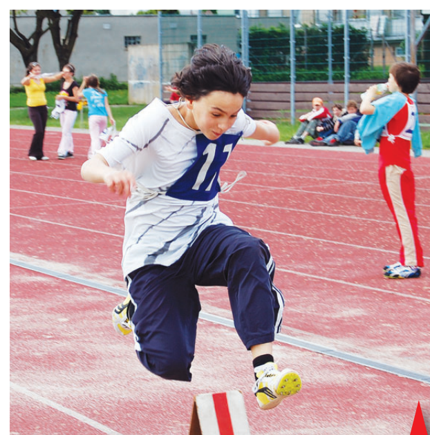
Skok do dálky byl jednou z pěti olympijských disciplín.

cistů a výstrojních součástek až po vozový park a donucovací prostředky, kterými je Policie ČR vybavena," řekl mluvčí prostějovské policie. -mik-