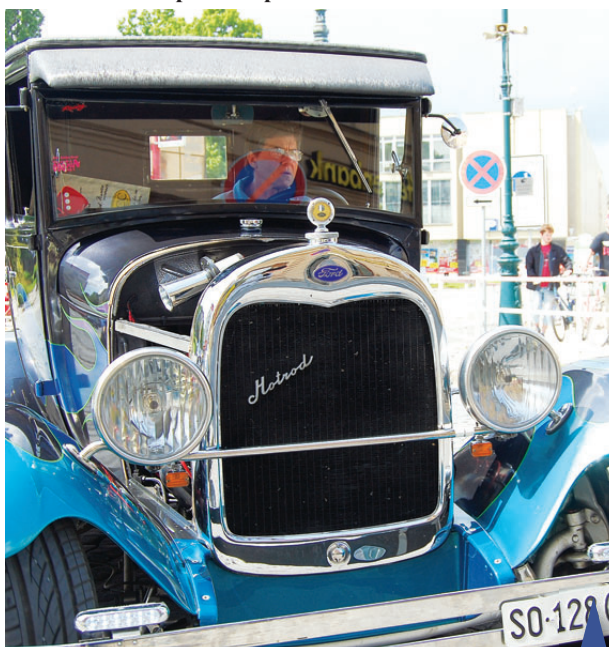
Byla to paráda. Majitelé historických aut a motocyklů se v plném lesku předvedli v Prostějově.

pamětníky a příznivce motoristického sportu v pořadí už 15. setkání bývalých motocyklových a automobilových závodníků.