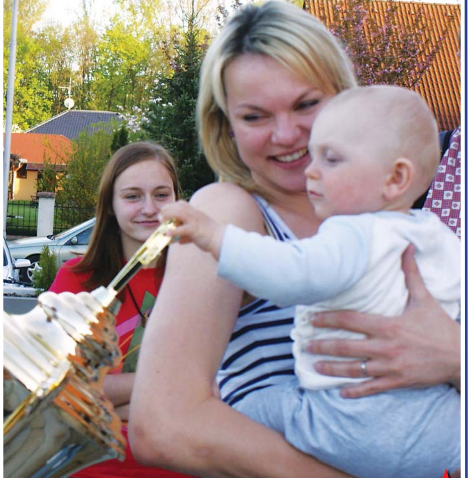
MÍSTO MÍČE MIMINO. Jedna z osobností celého českého volejbalu se rozhodla vyměnit volejbalovou „mičudru“ za batole.

* Můžete nám říct, kdy by vám bude volat tak moc chybě v Polsku?