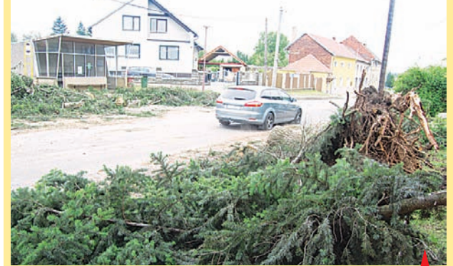
I s kořeny vytržený jehličnan přetnul komunikaci ve Výšovicích. S masou větví a mohutným kmenem si hasiči-profíci z Prostějova lehce poradili a pokračovali k zásahu dál na Němčicko.