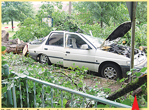
Ve Víceměřicích padl vyvrácený strom na auto a rozdrtil ho.

Silnice zaplavené pūdou z polí, vyvrácené stromy a polámané větve zanechala za sebou sobotní noční bouřka. Vichřice, která ji doprovázela, měla charakter tornáda. Kornout vichru obrovskou silou vyvracel letivé stromy i s kofeny, očesával větve a rozhazoval je po okolních polích jako sirky. Za obět mu padla řada stromů ovocné aleje lemující silnici z Výšovic až do Němčic nad Hanou i větrolamy u rybníků v Němčicích nad Hanou, Doloplazech i na jiných místech Němčicka. „V parku vyvrátil desítky