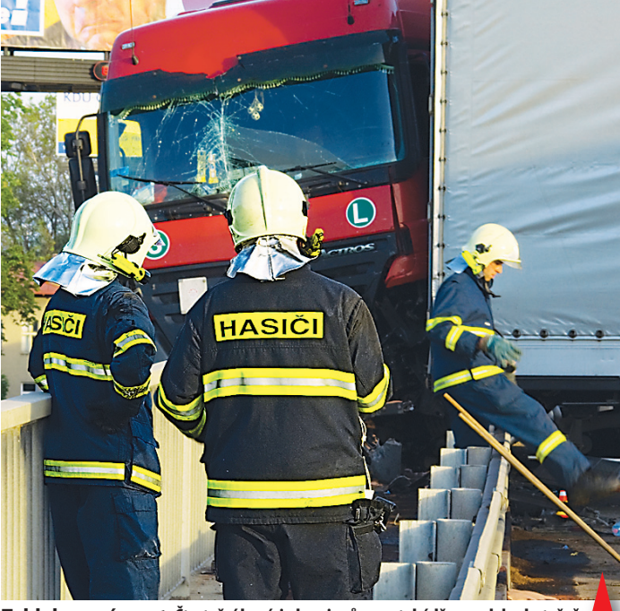
Zablokovaný most. Čtvrteční havárie kamionů na estakádě vypadala skutečně hrozivě. Jeden z nich se málem z mostu zřítit.