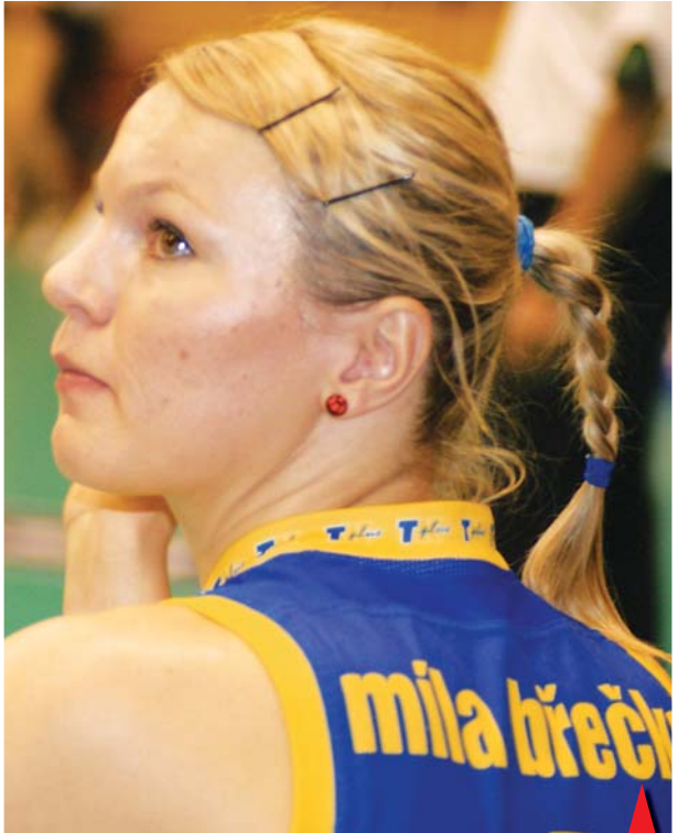
ODCHÁZEJÍCÍ KAPITÁNKA. Tricetiletá blokařka prožila v Prostějově dvě úspěšné sezony, nyní ale tým opouští. Na jak dlouho, to ukáže až čas.