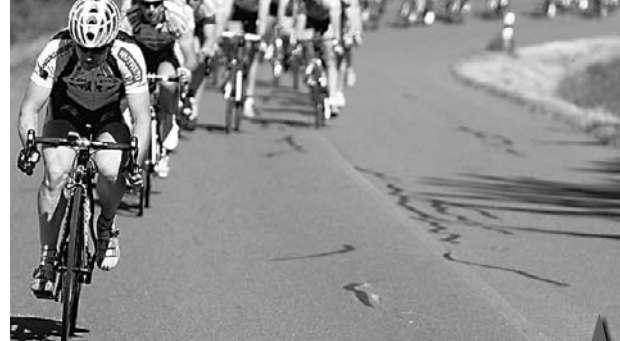
TO BYL HAD. Počátkem června patřily silnice na Drahané vrchovině cyklistům. Při tradičním etapovém klání Haná Tour nebyla nouze o zajímavé snímky...