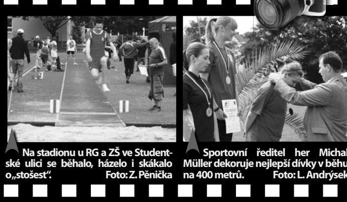
Na stadionu u RG a ZŠ ve Studentské ulici se běhalo, háželo i skákalo o „stošest“!