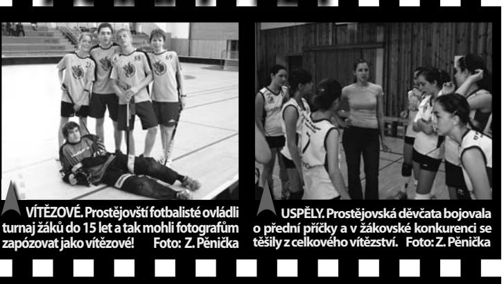
VÍTĚZOVÉ. Prostějovští fotbalisté ovládli turnaj žáků do 15 let a tak mohli fotografům zapozovat jako vítězové!