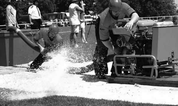
POJĎ, JDEME, JDEME. Při soutěžích v požárnímu útoku jde o každou setinku vteřiny, takže není divu, že usilí závodníků je nezměrné...