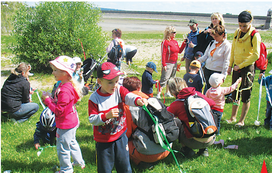
Výlet na Plumlovskou přehradu zavedl děti do vodnické pohádky.

V rámci tématického měsíce června a programů, které spojovala myšlenka Cestujeme s dětmi , připravilo Mateřské centrum Cipísky besedy o cestování a zajímavé výlety rodičů s dětmi. Velkým lákadlem pro děti byl hned první výlet na Plumlovskou přehradu. Děti měly po cestě připravené úkoly, ten hlavní byl najít klobouček vodníčka, který se musel odstěhovat z vypuštěné přehrady. Děti namotivované vodnickou pohádkou skutečně poctivě hledaly, aby vodníček o svůj zelený klobouček neplakal. Další výlet směřoval na Bělčický mlýn, kde na děti čekal také bohatý program. „Každého výletu se zúčastnilo asi 20 dětí s rodiči i prarodiči. V rámci