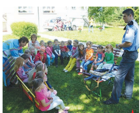
Dětičky z mateřských škol poslouchali policisty velmi pozorně.

V průběhu minulého týdne zamířili policisté z Územního odboru Policie ČR v Prostějově opět za dětmi z mateřských škol na území Prostějovska. Setkání s dětmi se uskutečnilo v Prostějově, Otaslavicích, Pěněčíně a v Brodku u Prostějova. „Děti na závěr školního roku mohly v průběhu dopoledne shlédnout nejen vybavení policejních složek, ale mohly se také dozvědět více informací o náročném práci policistů. Činnost policejních složek byla dětem prezentována jednak teoretickým výkladem služby pořádkové a dopravní policie, ale také formou ukázek, zejména skupiny základních kynologických činností policie,“ uvedl Petr Weisgärber, tiskový mluvčí Policie ČR v Prostějově. Celkově bylo všem uvedeným setkáním přítomno více jak dvě stě dětí. Policisté pro děti rovněž připravili různé kvízy, kdy nejlepší z dětí byly oceněny formou věcných dáreků.