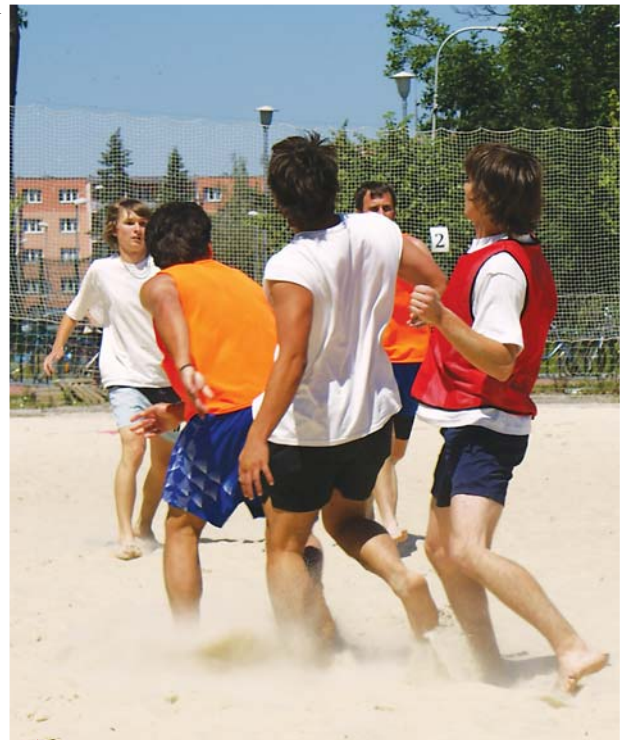
HRÁLO SE „NA KREV“. Po celou sobotu a neděli se na pískových hřištích bojovalo o každý míč.

HRÁLO SE „NA KREV“. Po celou sobotu a neděli se na pískových hřištích bojovalo o každý míč. Turnaj byl velmi úspěšný a přilákal mnoho zájemců. Vítězný tým si odvezl pohár a trofej, kterou jim předal organizátor turnaje. Turnaj byl velmi úspěšný a přilákal mnoho zájemců. Vítězný tým si odvezl pohár a trofej, kterou jim předal organizátor turnaje.