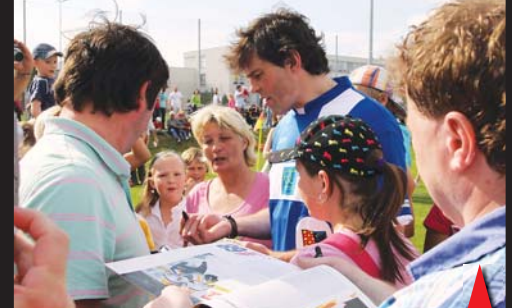
HOLT HVĚZDA. Jaromír Jágr se ani nemusel zapojit do hry, přesto byl právě o jeho autogram suverénně největší zájem.