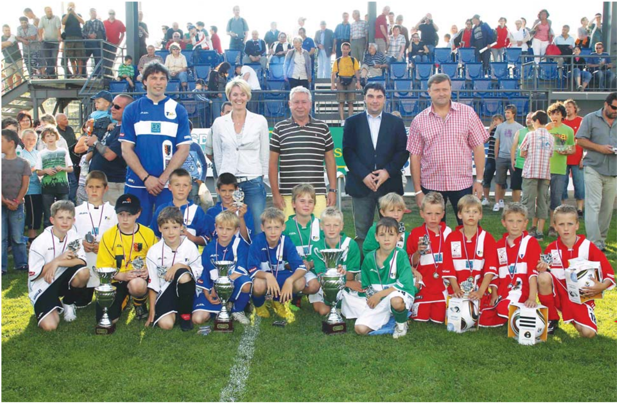
Exkluzivní rozhovory s Lukášem Krajíčkem a Ivanem Haškem i další ohlasy účastníků JABULANI CUPu vám přineseme v příštím čísle Večerníku, které vyjde 12. července.