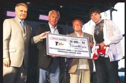
OPĚT ROZDÁVALA. Marketingová společnost TK PLUS předala během onoho večera i několik finančních šeků. Jeden z nich obdržel i výběr přípravky 1. SK Prostějov, ročníku 2000.