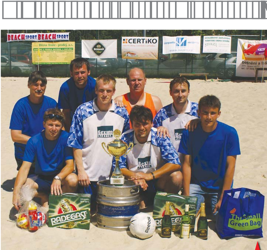
Vítězný tým turnaje v plážovém fotbale BEXIM PALETTEN.