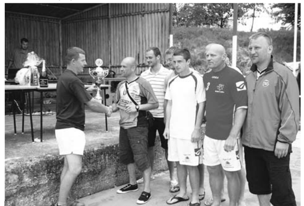
OVLAĐDI BEDIHOŠT CUP 2010. Vítězem 2. ročníku turnaje v malé kopané, který se hrál opět v Hrubčicích se stal výběr pod názvem FC Anděl,