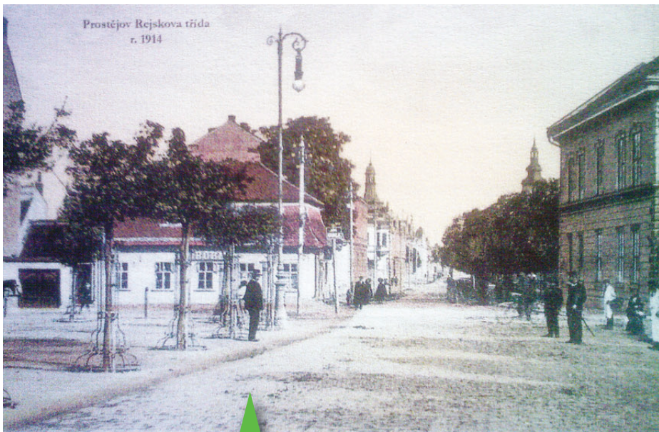
Fotografie pořízené těsně před první světovou válkou. Vlevo pohled na nově vybudovanou radnici a sousední Živnobanku, nahore tehdejší Rejskova třída.

Rok 1711 se nesl ve znamení neočekávané smrti císaře Josefa I., která způsobila odklad potvrzení 36 městských privilegií. Zostřo-