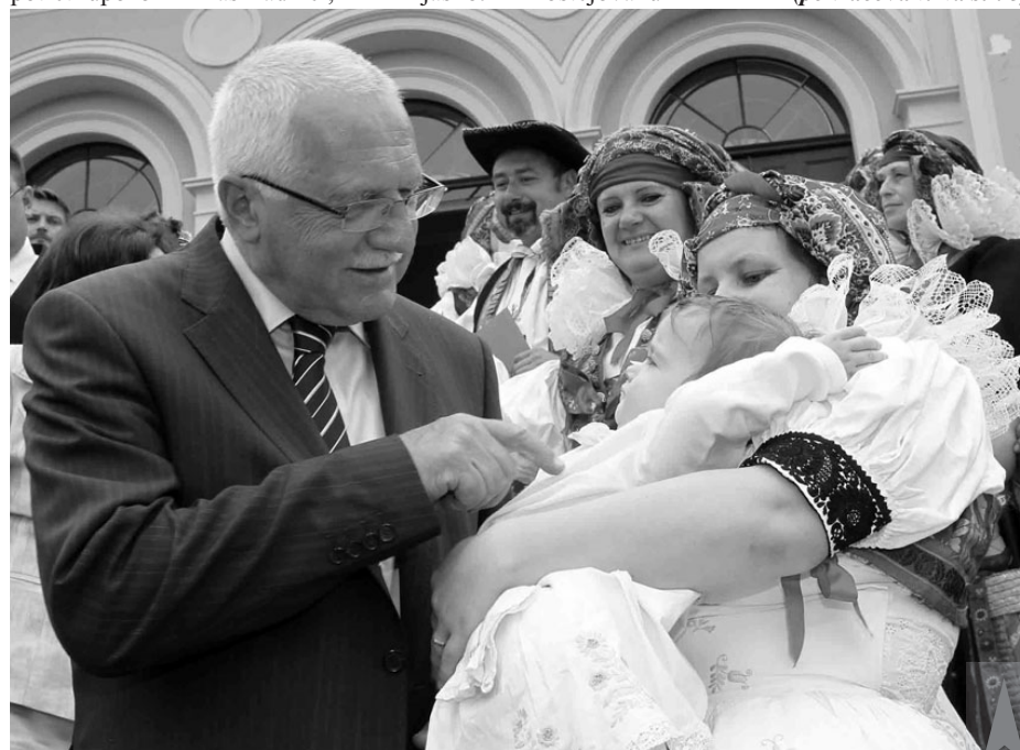
V závěru června navštívil Prostějova Václav Klaus s manželkou Livií. Prezident se na skok zastavil v Čechách pod Kosířem, kde se seznámil i s nejmenší zdejší drobtinou.