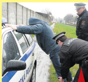
Strážníci v loňském roce zatkli hned několik sprejerů, které se podařilo přistihnout přímo při činu nebo těsně po něm.

"Před polednem zadrželi strážníci čtyřiačtyřicetiletého muže na Plumlovské ulici poblíž čerpací stanice, jak píše černým fixem na reklamní tabuli. Při spatření hlídky výtečník propisovač zahodil. Choval se impulzivně, nepředvídatelně a hrozila zde