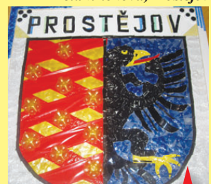
Žáci ZŠ Melantrichova v Prostějově uspěli v soutěži ve výrobě erbů měst. Poznali byste, že děti vyrobily znak Prostějova z odpadových materiálů?