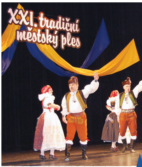
Na pódiu divadla se představil národopisný soubor Mánes.