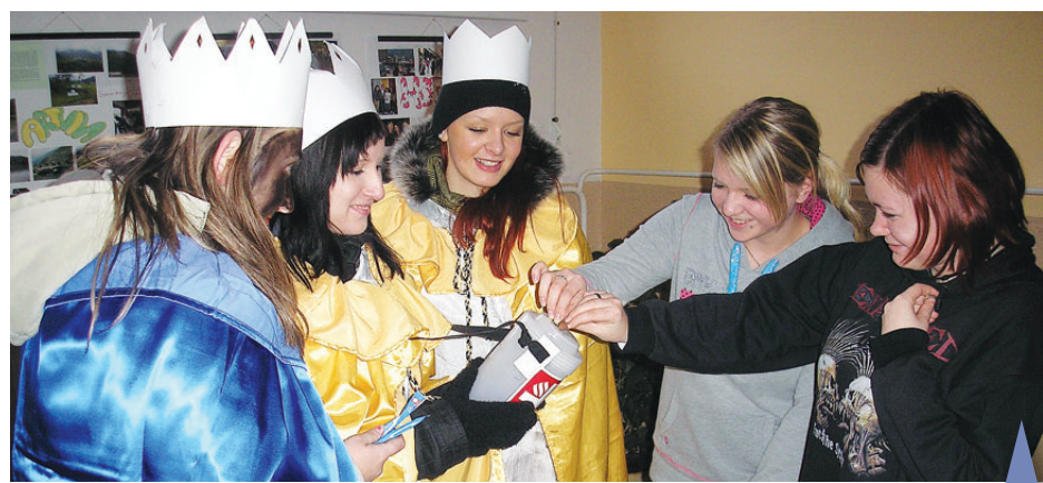
Studentky Střední zdravotnické školy se do Tříkrálové sbírky v Prostějově rovněž zapojily.

552 000 korun. Jak uvedl Martin Mokroš z prostějovské zdravotnické školy, děvčata se na koledu přihlásila dobrovolně i s rizikem, že v sychravém počasí mohou akci odstat a obzvláště maskování „toho černého vzadu,“ bylo velmi povedené. „Pokud vykoledované peníze přijdou na dobrou věc, a všichni věří že ano, akce splnila svůj účel a škola se jí ráda účastní i v příštích letech,“ dodal ještě Mokroš.