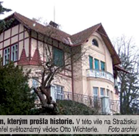
Dům, kterým prošla historie. V této vile na Stražisku zemřel světoznámý vědec Otto Wichterle.