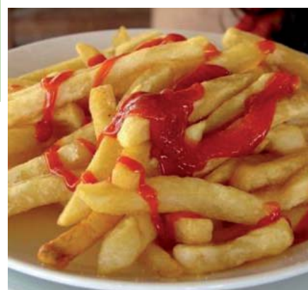
Také to máte rádi? Hranolky s kečupem - oblíbená svačina, oběd i večera našich dětí. To je ale špatně...!

tý způsob stravování dodržuje celá rodina. Především je nutná pravidelnost - rozdělení jídla na pět denních porcí a vyloučení všech energeticky bohatých potravin. Patří k nim například bramborové hranolky, chipsy, tučné pečivo (koblihy), smetanové zmrzliny, cukrářské výrobky, majonézy, ale i některé druhy drůbeže (husa, kachna, u kuřat nejist kůži), uzeniny, sekaná a mletá masa, plnotučné mléčné výrobky, šlehačka, tučné sýry. Při dodržení správné výživy, dostatku pohybu a pevné vůli lze nadměrnou hmotnost ztratit. Výhodnější je správným způsobem života předejít jejímu vzniku zvláště u dětí. Je skutečně prokázáno, že osmdesát procent dětí zůstává obezními i v dospělosti se všemi uvedenými následky... Tak co, jaké dítě máte doma, vy?