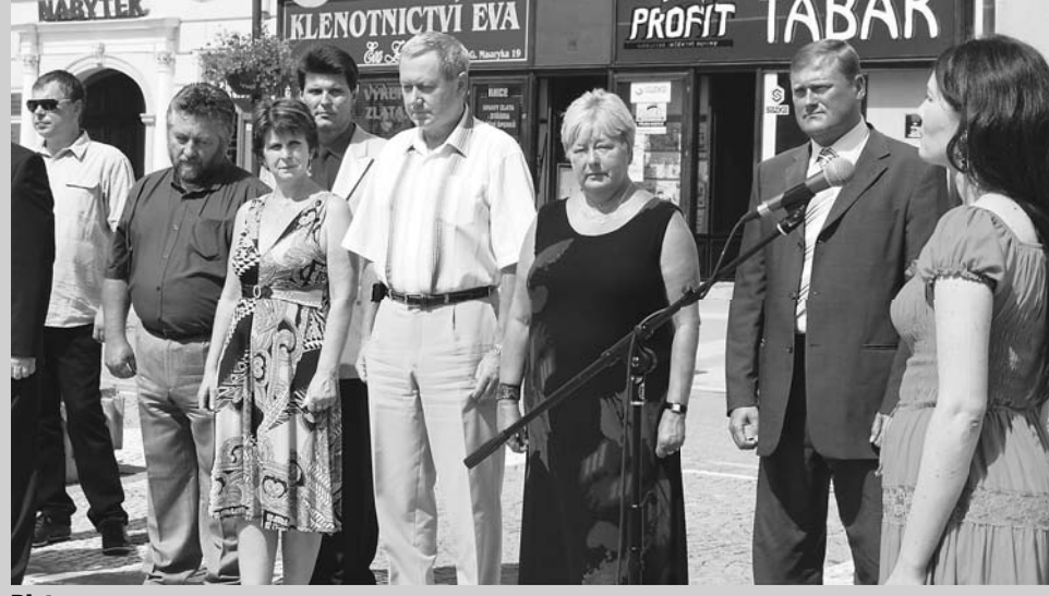
Pieta. Představitelé města si připomněli 43. výročí vpádu vojsk Varšavské smlouvy do naší země. Konkrétně v Prostějově padli za obětí okupantů dne 25. srpna 1968 tři lidé, další byli zraněni.