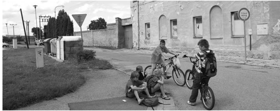
Smi se to? Asi ne... Tuto značku ve vrahovičské ulici Jano Köhlera dle místních denně poruší desítky řidičů. Cesta přitom vede kolem dětského hřiště!