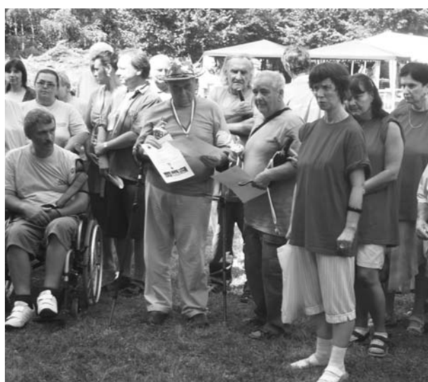
Pohár zůstal doma. Muži z Domova důchodců v Nerudově ulici se stali celkovými vítězi turnaje, jehož se zúčastnilo hned jedenáct týmů.