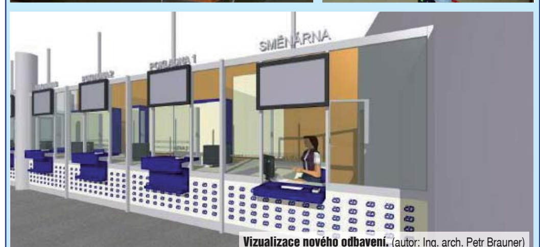
Vizualizace nového odbavení. (autor: Ing. arch. Petr Brauner)