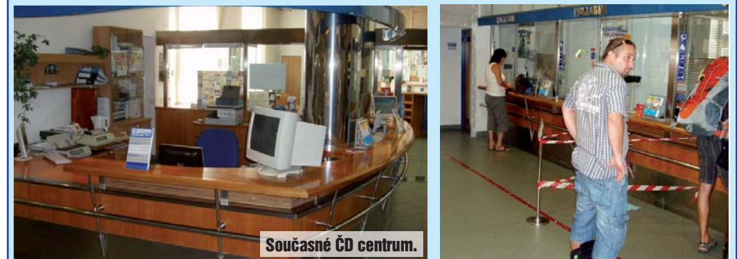
Současné ČD centrum.

směrnáru, pokladny pro výdej vnitrostátních i mezinárodních jízdenek a přepážku pro přednostní odbavení. Pro hendikepované spoluobčany bude vybudována snížená přepážka. Do těsné blízkosti přepážek se také přestěhuje čekárna ČD lounge. S vybudováním nového odbavení se také dokončí rekonstrukce interiéru vestibulu, sjednotí se dlažba a obklady, také se vymění všechny dveře z přednádražního prostoru i z prvního nástupiště. „Věříme, že cestující budou mít pochopení pro ztížené podmínky po dobu rekonstrukce. Omlouváme se také tímto za dočasné omezení provozu pokladen a vestibulu. V případě naléhavé potřeby bude operativně zajištěn doplňkový prodej jízdenek,“ zní z Českých drah.