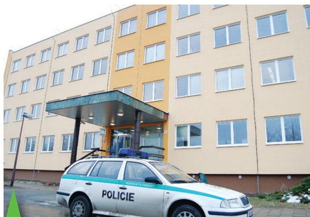
Prostějovské obvodní oddělení, obecnou kriminálku a vedení policie najdete už v této budově na Újezdě.