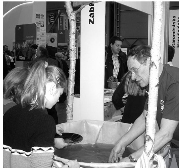
Expozice Zlatých Hor na Regionturu 2011. Návštěvníci si mohli vyzkoušet rýžování zlata.