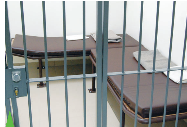
Policejní cela byla nejtatraktivnější ukázkou pro veřejnost. Zadržení pachatelé tady budou mít celkem komfort...

Prostějovaně si pomalu budou muset začít odvykat na zažitou skutečnost, že po hospodách se už přestane říkat, že někoho "odvezli" na Havlíčkovou... -mik-