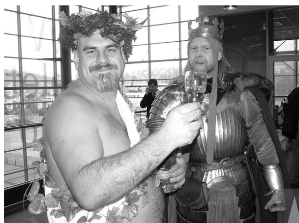
Mikulov se představil jako město vína a historie. Prostějovská expozice byla naopak statická a nevyrazná.

Jednou z posledních aktivit města v oblasti cestovního ruchu je