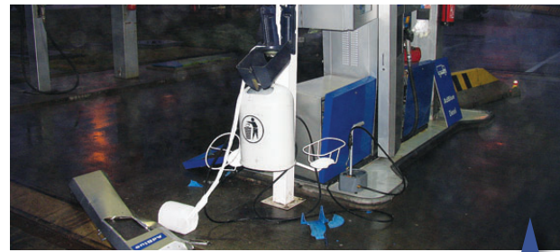
Zpusořil vybavení benzínky a ujel. Policie pátrá po řidiči, který z neznámých příčin boural v úterý ráno na čerpací stanici u Žesova.

Byl opilý nebo jen nešikovný? Prostějovská policie hledá stále svědky kuriózní nehody, ke které došlo minulý týden v úterý brzy ráno na čerpací stanici u rychlostní komunikace na konci Prostějova směrem na Vyškov. Řidič nákladáku zde naboural do čerpacího stojanu a kromě něho zničil i další vybavení benzínky. Problém je v tom, že šofér ihned nato ujel z místa nehody a policie po něm pátrá.