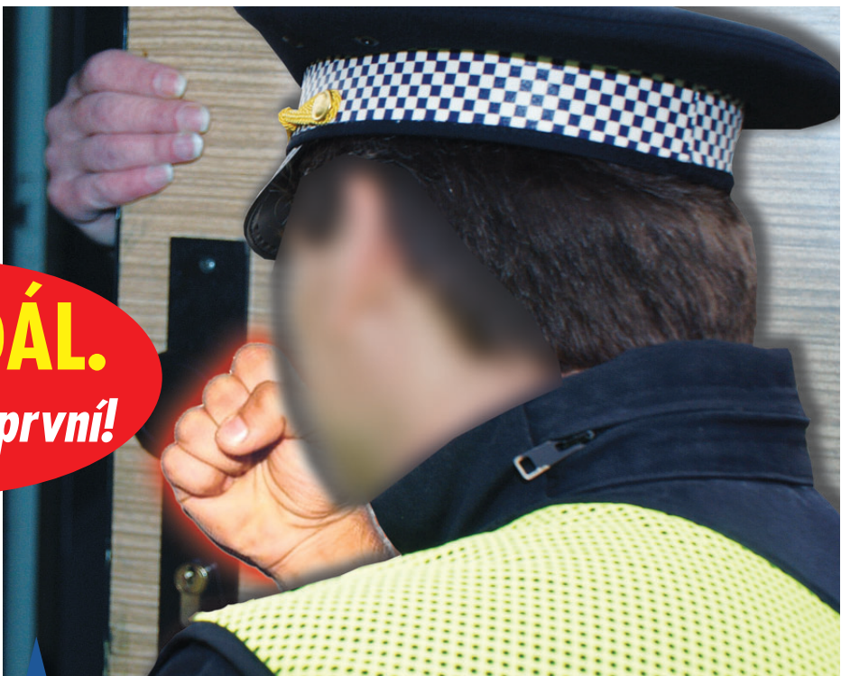
Strážník po vykopnutí dveří udeřil pěstí ženu do obličeje.