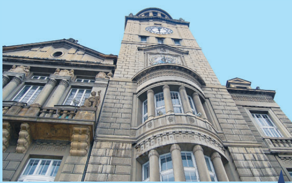
Ve čtvrtek byla zahájena rekonstrukce radniční věže. Po ní bude mít až na její ochoz umožněn přístup široká veřejnost. Hodinky si ale teď podle radnice raději nejdte...

"Ve výběrovém řízení na rekonstrukci radniční věže zvítězila prostějovská firma INGREMO. Rekonstrukce zahrnuje výstavbu nového schodiště, posílení stropů, které jsou v současné době tvořeny pouze štíhrou železobetonovou konstrukcí, aby tak byla zajištěna dostatečná únosnost stropů. Těmito úpravami bude umožněno případné zpřístupnění věže pro veřejnost. Povrchy stěn budou ponechány v podobě stávajících režných omítek, podlahu bude tvořit ocelový plech nové ocelové konstrukce stropu. Úpravy navrhl architekt Beran. Dále bude z věže odstraněna elektrokomunikační technika, která je zde v současné době umístěna. Uvolněné prostory budou využity pro trvalou výstavní expozici s tematikou Prostějova a