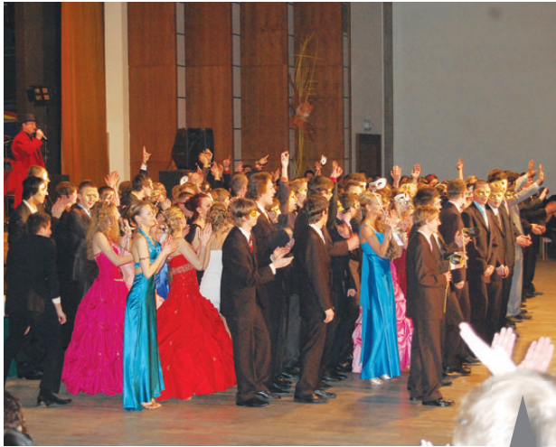
Letošní maturanti se představili tanečním vystoupením...

mosféra naplněná hrdostí, hrdostí na vás studenty, kteří spolu s námi ušli kus cesty a prožili mnoho. Přeji všem hodně úspě-