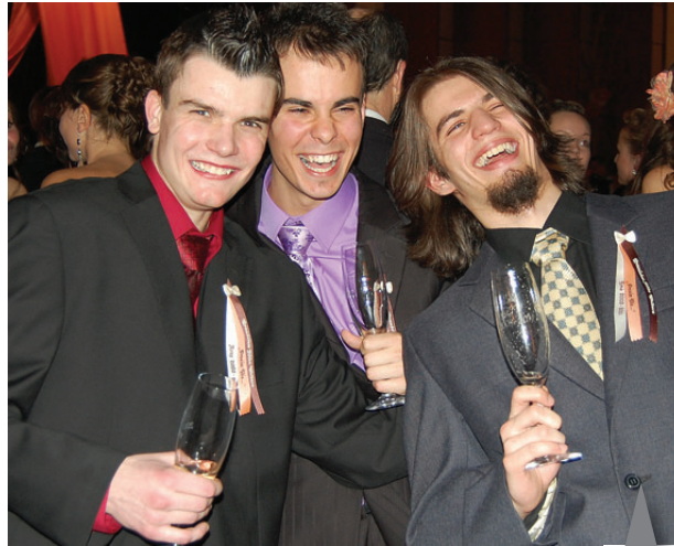
... a pak už vypukla plesová zábava s bujarým veselím.