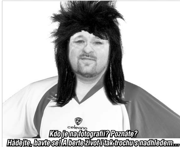
Kdo je na fotografii? Poznáte? Hádejte, bavte se! A berte život! I tak trochu s nadhledem...

Otevřeno NONSTOP! Plumlovská 73, 796 01 Prostějov 150m od OD Haná www.obcerstvenibrutus.cz