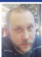
M. L., Prostějov

„Předsevzetí si nedávám a ani jsem to nikdy nezkušel, protože bych to stejně nedodržel. Osobně jsem se ještě nesetkal s nikým, kdo by si své údajné novoroční předsevzetí splnil. Pojem předsevzetí bych spíše změnil na přání. Bylo by lepší, kdyby si do nového roku každý něco přál... A myslím si, že lidé více než předsevzetí mají svá určitá přání.“