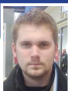
V. M., Prostějov

„Předsevzetí si nedávám a ani jsem to nikdy nezkušel, protože bych to stejně nedodržel. Osobně jsem se ještě nesetkal s nikým, kdo by si své údajné novoroční předsevzetí splnil. Pojem předsevzetí bych spíše změnil na přání. Bylo by lepší, kdyby si do nového roku každý něco přál... A myslím si, že lidé více než předsevzetí mají svá určitá přání.“