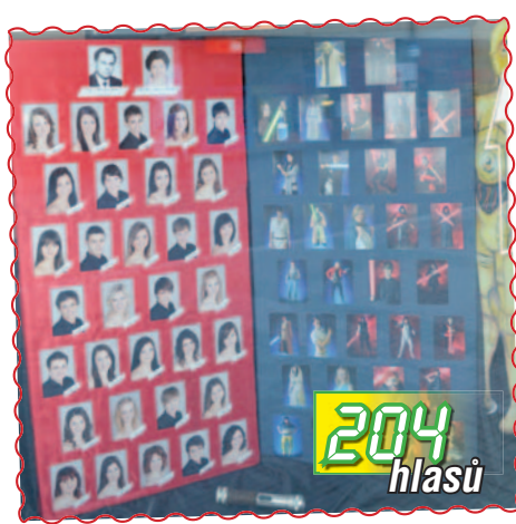
06. Třída 4. A z GJW ve výloze obuvi Baťa na nám. TGM prezentuje své hvězdné války.