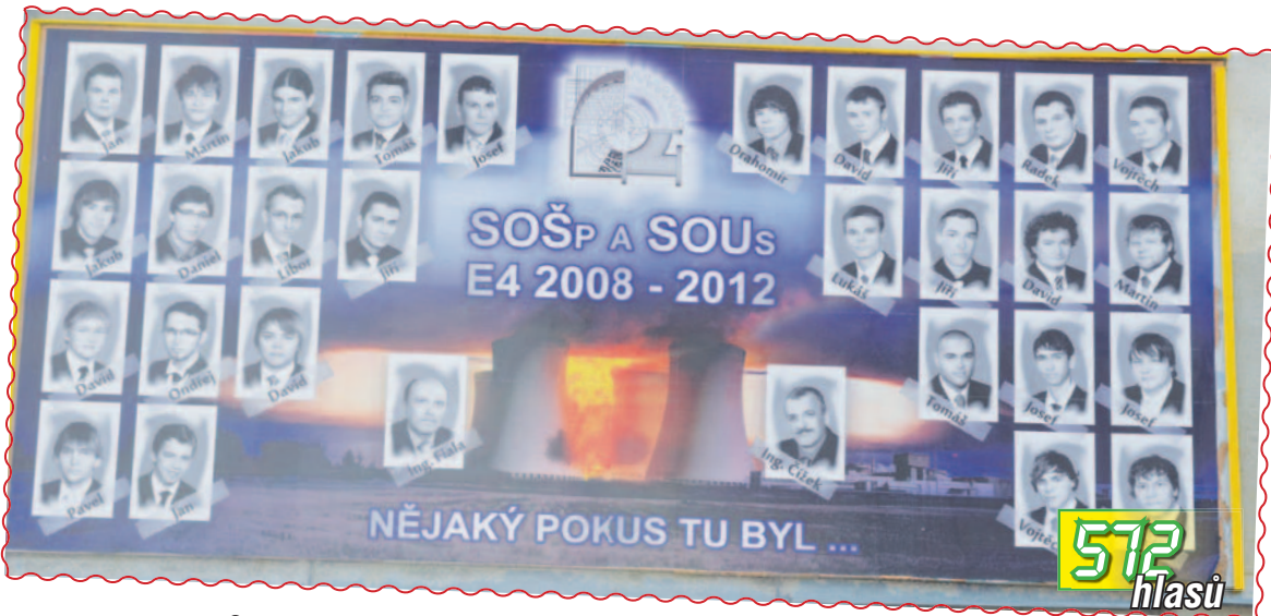
01. Třída 4. E ze SOSp a SOUs na billboardu v Plumlovské ulici prezentuje výsledky svého pokusu.

Třídy, které se umístí na prvních třech místech, od nás dostanou zajímavé ceny. Ty jsou připraveny i pro vylosované hlasující.