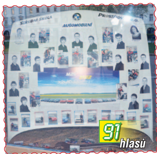
09. Studenti SŠ automobilní si v prodejní uzenin Makovec za podklad tabla vzali kapotu auta.

V dnešním čísle můžete najít průběžné výsledky, tak jak jsme je zaznamenali v sobotu 5. května ve 21.00 hodin.