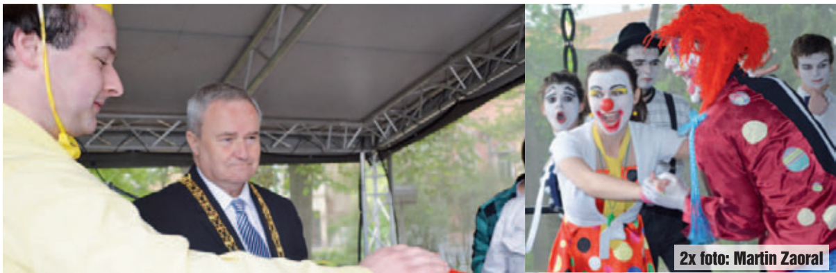
2x foto: Martin Zaoral