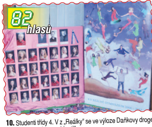
10. Studenti třídy 4. V z „Reálky“ se ve výloze Daňkovy drogerie proměnili v barevné lentilky.