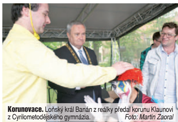
Koronovace. Loňský král Banán z reálky předal korunu Klaunovi z Cyrilometodějského gymnázia.

Přímou reportáž z páteční události si můžete přečíst na straně 10 dnešního vydání, exkluzivní rozhovor s králem Majálesu pak najdete na straně 16.