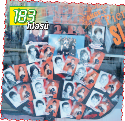
12. Třída 2.PA ze Švehlovy SŠ v hodinářství na náměstí E.Husserla ukazuje, že život je boj.