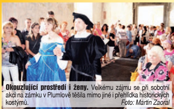
Okouzující prostředí i ženy. Velkému zájmu se při sobotní akci na zámku v Plumlově těšila mimo jiné i přehlídka historických kostýmů.