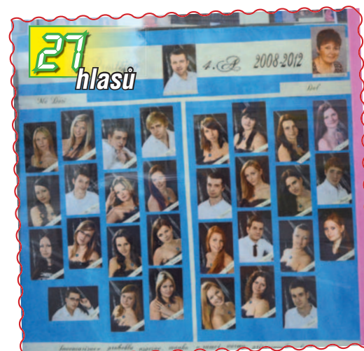
03. Třída 4.A z Obchodní akademie v Atriu na Hlaváčkově náměstí ukazuje, jak šel čas...