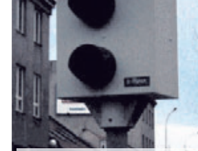
Brzy se spustí! Stacionární radary na měření rychlosti budou v Prostějově znovu spuštěny. Ale s jakou firmou?

Nyní se tedy nabízí logická otázka. Proč byly dva roky radary vypnuté a neměřila se rychlost, když, jak se nakonec ukázalo, bylo všechno v pořádku? „To je úplně jednoduché, protože jsme očekávali stanovisko ministerstva dopravy a nemohli jsme se dočkat. Přišlo teprve až nedávno. Za druhé nyní musíme rozhodnout, s kým do nového měření rychlosti půjdeme. Určitou nabídku máme od stávajícího majitele stacionárních radarů, tedy od společnosti Czech radar. Budeme o ní jednat. Podle mého názoru by Rada města o tom měla rozhodnout co nejdříve. Půjde o to, kdy, v jaké