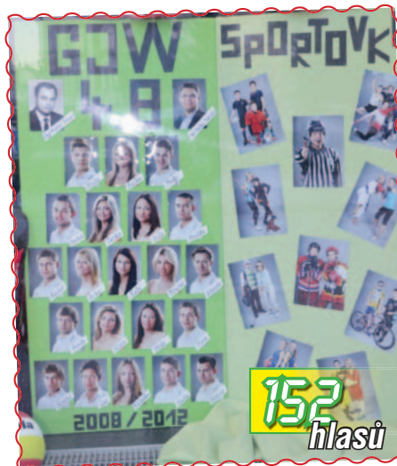
05. Sportovní třída 4.B z GJW ve výloze HZH sportu na nám. TGM navlékla sportovní dresy.