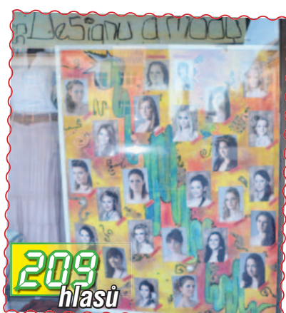
11. Barevné kreace SŠ Designu a módy v obchodě Fantazim collection na náměstí E.Husserla.