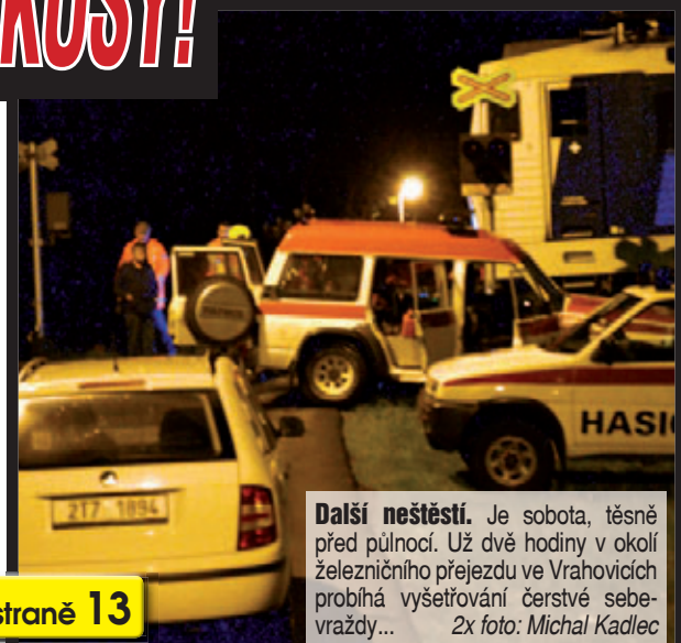
Další neštěstí. Je sobota, těsně před půlnocí. Už dvě hodiny v okolí železničního přejezdu ve Vrahovicích probíhá vyšetřování čerstvé sebevraždy...