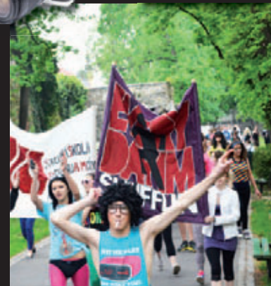
Nesourodá skupina. Střední školu designu a módy zastupovaly mimo jiné zebra, divný robot a pračlověk.