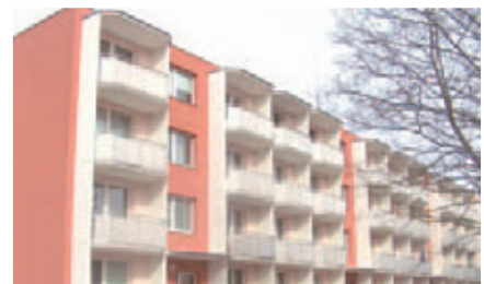
Kdo vraždil? V paneláku v Okružní ulici číslo 31 došlo 2. března tohoto roku k brutálnímu mordu. Kdo ze dvou obviněných mužů dostane výjimečný trest se stále neví.