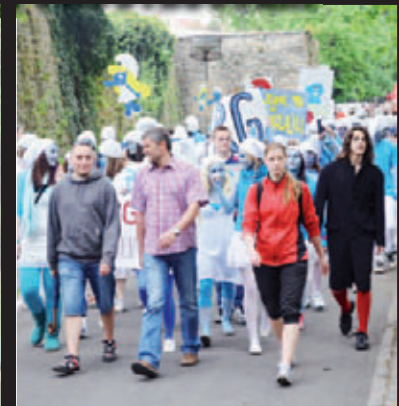
Boj za práva Šmolů. „Realka“ prosazovala stop zabíjení Šmolů do zmrzliny!