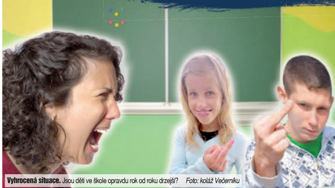
Vyhrocená situace. Jsou děti ve škole opravdu rok od roku drzejší?