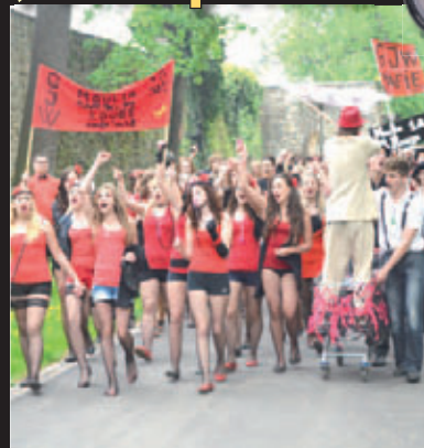
Armáda z Moulin Rouge. Za Gymnáziem Jiřího Wolkera do boje vyrazily dívky v síťovaných punčochách.