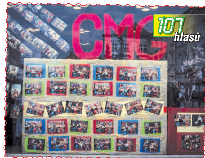
07. Studenti CMG v prodejní H&D na nám. TGM ukazují, jak vypadá pohoda na lavičce v parku.