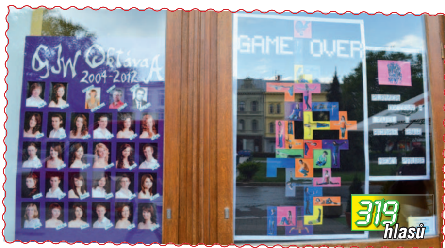
04. Oktava A z GJW ve výloze PENU na nám. TGM právě dohrála svoji partii populární hry Tetris.