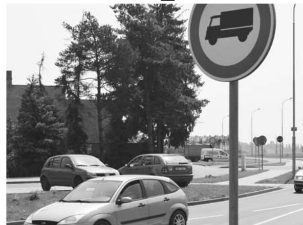
Jen pro osobní. Jižní kvadrant mohou využívat zatím jen osobní automobily. To by se ale brzy mělo změnit. Kdy, to se ještě přesně neví...