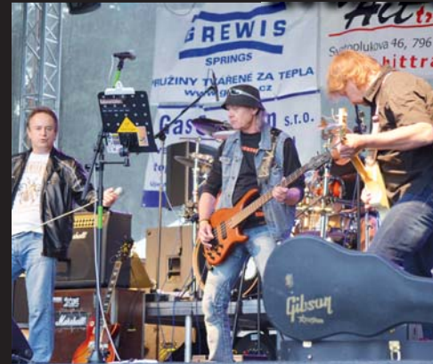
No jasně, Quercus! Co na tom, že tato kapela krouží na pódiích už dvaatřicátý rok. Pořád je v úžasné formě.