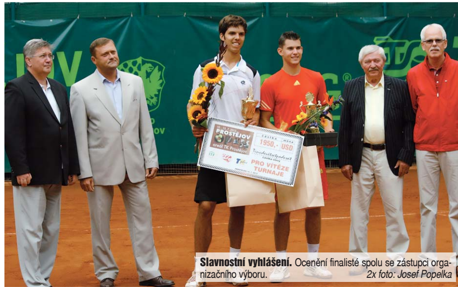
Slavnostní vyhlášení. Ocenění finalisté spolu se zástupci organizačního výboru.