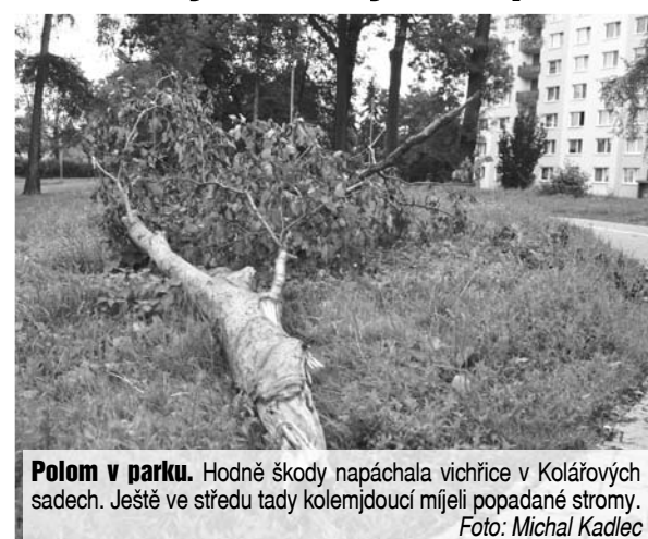
Polom v parku. Hodně škody napáchala vichřice v Kolářových sadech. Ještě ve středu tady kolemjdoucí měli popadané stromy.

Následkem bouře přímo ve městě i mimo něj popadala spousta stromů i velkých větví. Jejich likvidaci a uklid měly na starosti prostějovské technické služby. „Nejhorší situace byla ve Smetanových sadech, Kolářových sadech, v biokoridoru Hloučela, a na Sídlišti svobo-