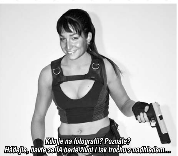
Kdo je na fotografii? Poznáte? Hádejte, bavte se! A herte život i tak trochu snadiládem...