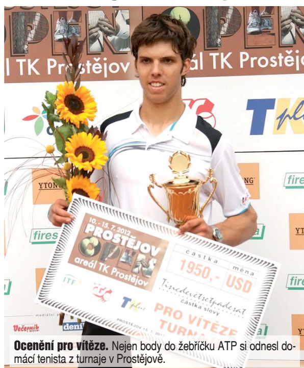
Ocenění pro vítěze. Nején body do žebříčku ATP si odnesl domácí tenista z turnaje v Prostějově.

2. KOLLO: Veselý jde dál, Pavlášek nepostupuje Dalším kolem pokračoval turnaj mužů na dvorcích tenisového klubu Prostějov. Druhé kolo patřilo zejména favoritům, kteří potvrdili papírové předpoklady a vybojovali si postup do další fáze turnaje. Povětrnostní podmínky opět připomínaly nedávno ukončený lon-