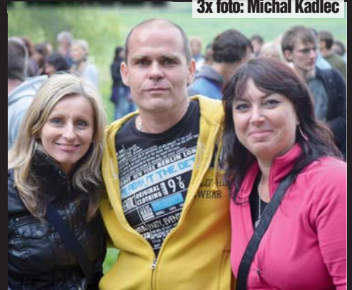
Skvělá nálada. Postupem doby se pláž U Vrbiček začala zaplňovat rockovými fanoušky. „Bylo to super,“ vzkazují všichni.