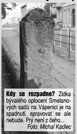
Kdy se rozpadne? Zídka bývalého oplocení Smetanových sadů na Vápenici je na spadnutí, spravovat se ale nebude. Prý není z čeho...