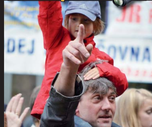
Pro všechny. ROCK MEMORY OF jen pro starší generace? Zapomíte! I ti nejmladší si našli cestu za rockovými legendami.