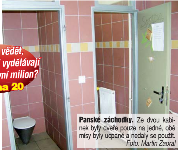
Panské záchodky. Ze dvou kabiňek byly dveře pouze na jedné, obě mýsy byly ucpané a nedaly se použít.

Chcete vědět, jak bezdáci vydělávají na svůj první milion? strana 20